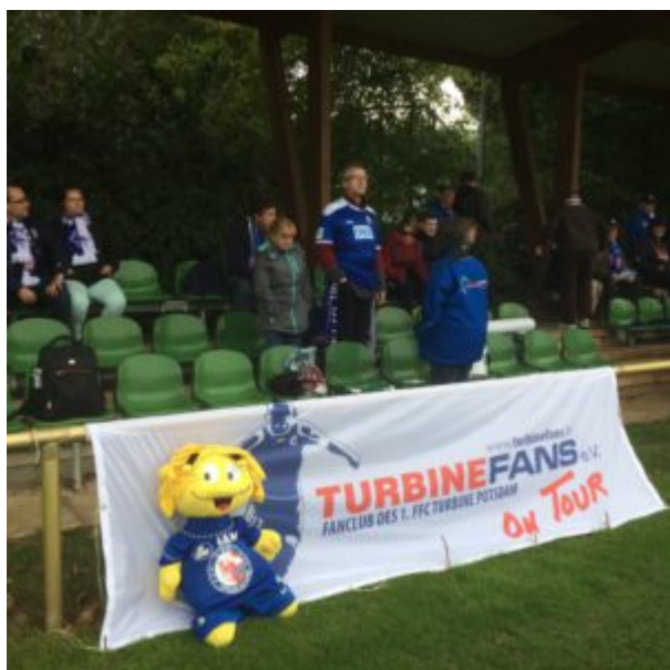
Spiel gegen Bremen (DFB-Pokal - Aus nach der 1. Runde...) im Oktober 2016

Fahrpreis über Hartmut Feike erfragen > Überweisung bis spätestens 15.03.2018