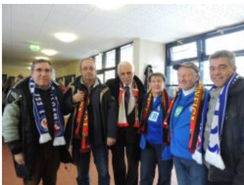
Lissabon vs Potsdam