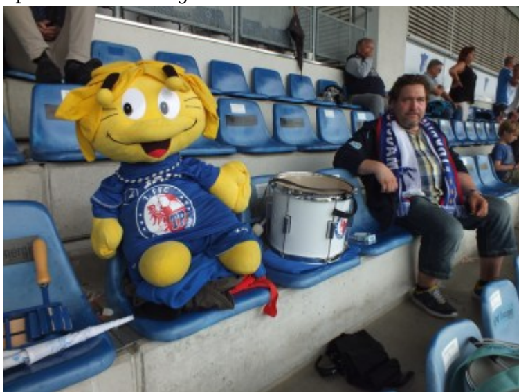
Turbinchen in Hoffenheim