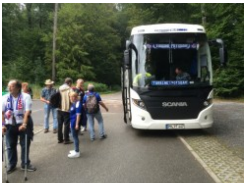
Busabreise in Hoffenheim