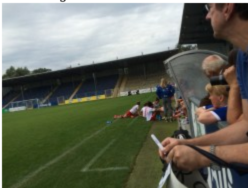
Warten aufs Abklatschen