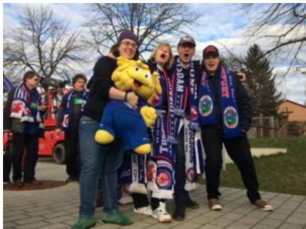
Turbine- und Frankfurter Fans eng vereint (Spiel gegen Frankfurt im Februar 2018)