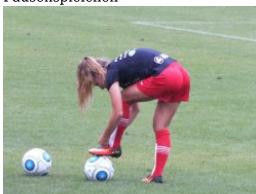
Schleife machen mit Fußbank