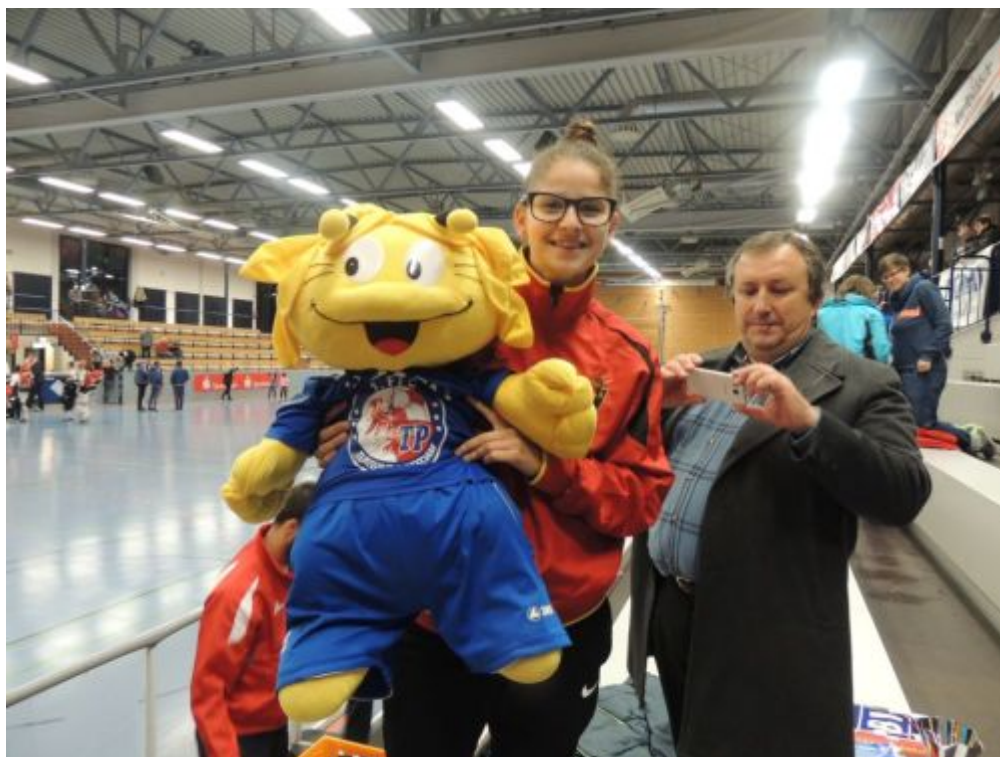
Turbinchen fliegt nach Portugal