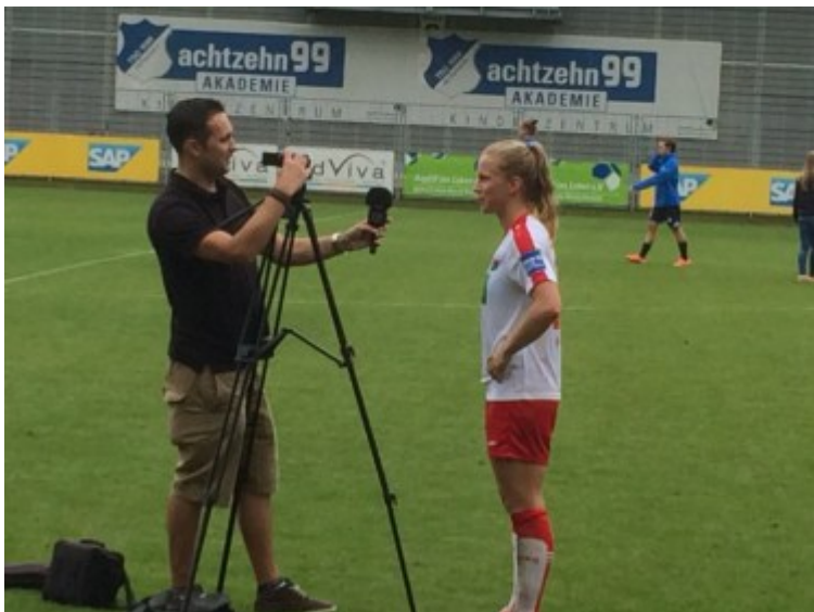
Doppeltorschützin im Interview