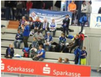
Fanblöckchen am 2. Spieltag, eine Stunde vor Turnierbeginn