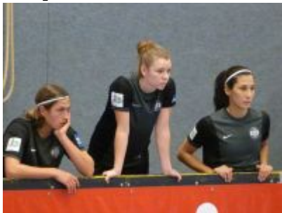
Die Drei aus Essen