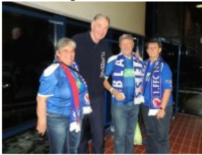
Einen Abschied gibt es nur mit den Fans...