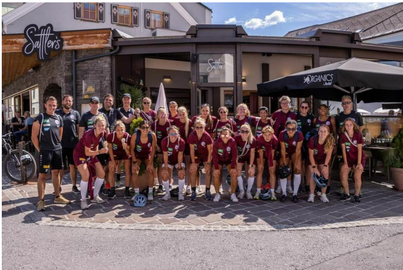
Das Team für die kommende Saison