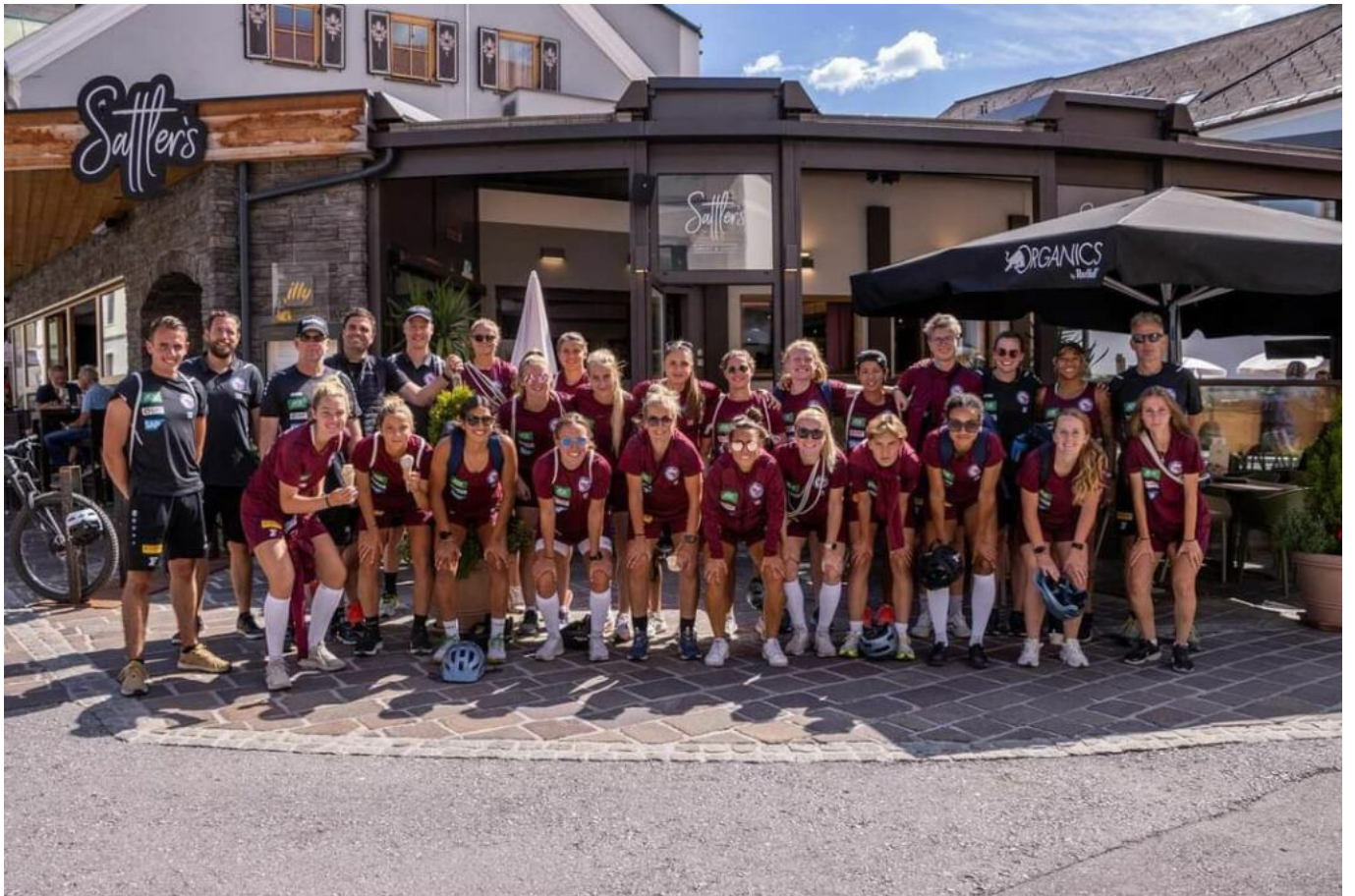
Das Team für die kommende Saison