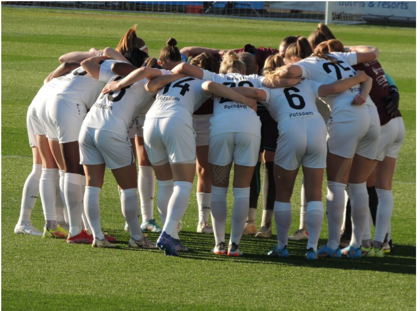
geheime Absprache