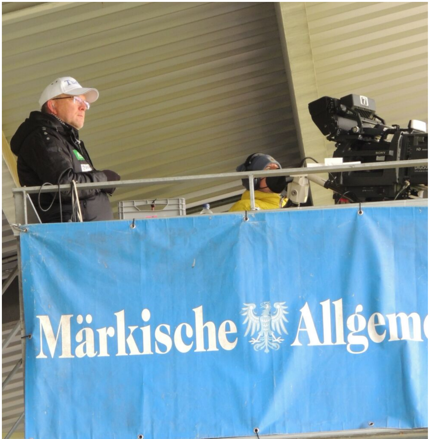
hoch oben