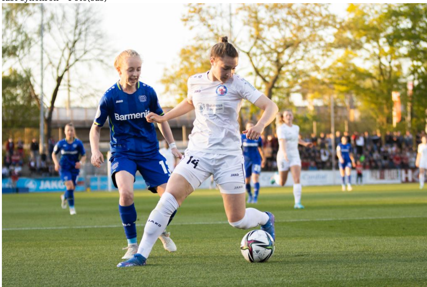
frühere Team-Kolleginnen