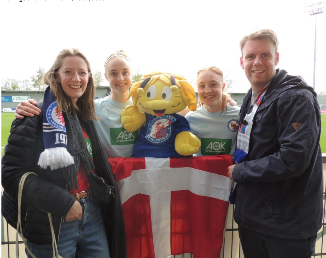
Holmgaard Familie

Nach dem Abpfiff - Jubel der Turbinen, Gesang der Fans „Oh, wie ist das schön“. Aber auch Sorge um die verletzten Isy, Gina und auch Goszia. Allen Dreien gute Besserung von den Turbine-Fans.