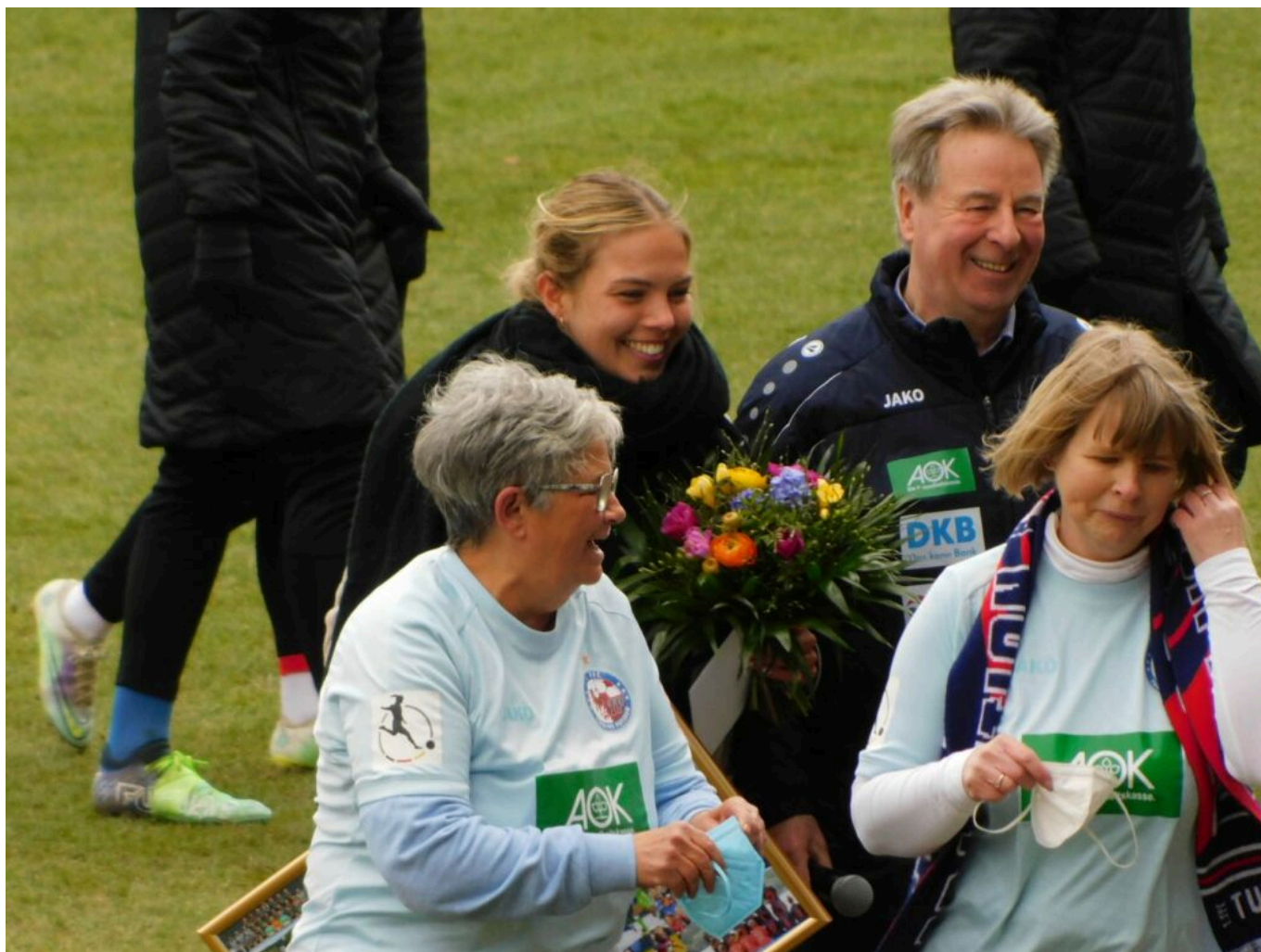
trotz Abschied, lachende Gesichter