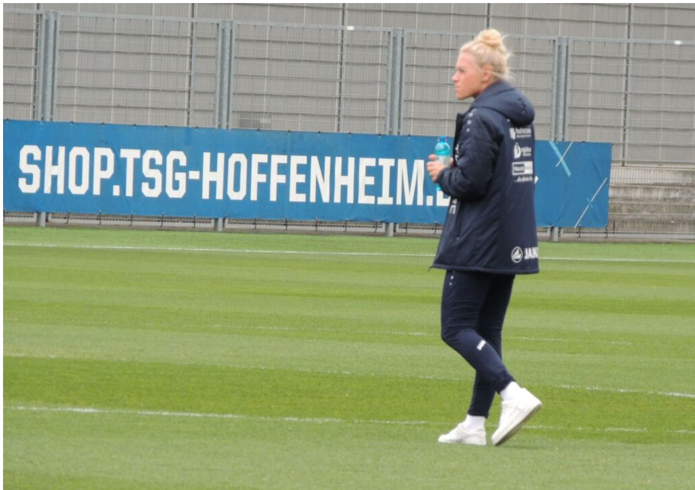
erste Eindrücke