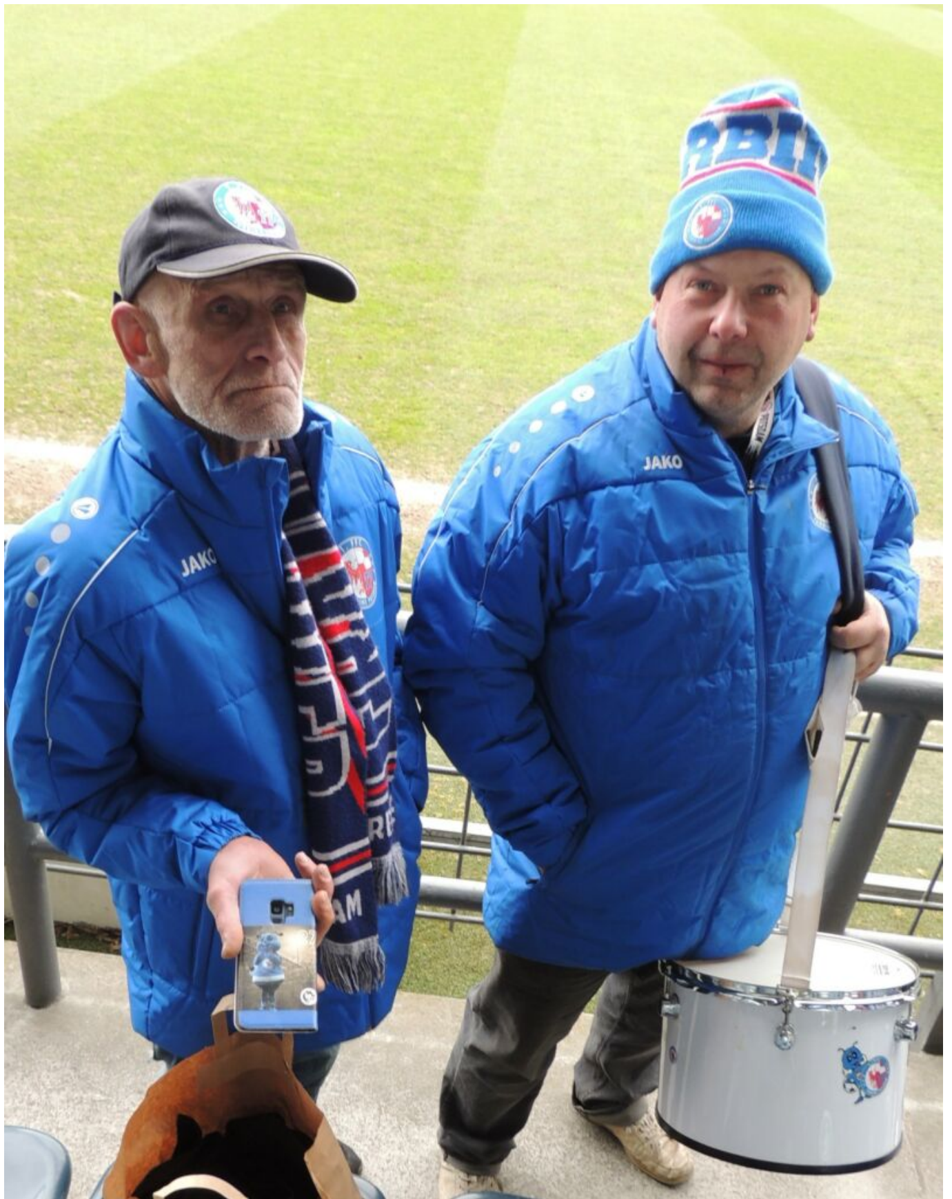
... und die Rückseite