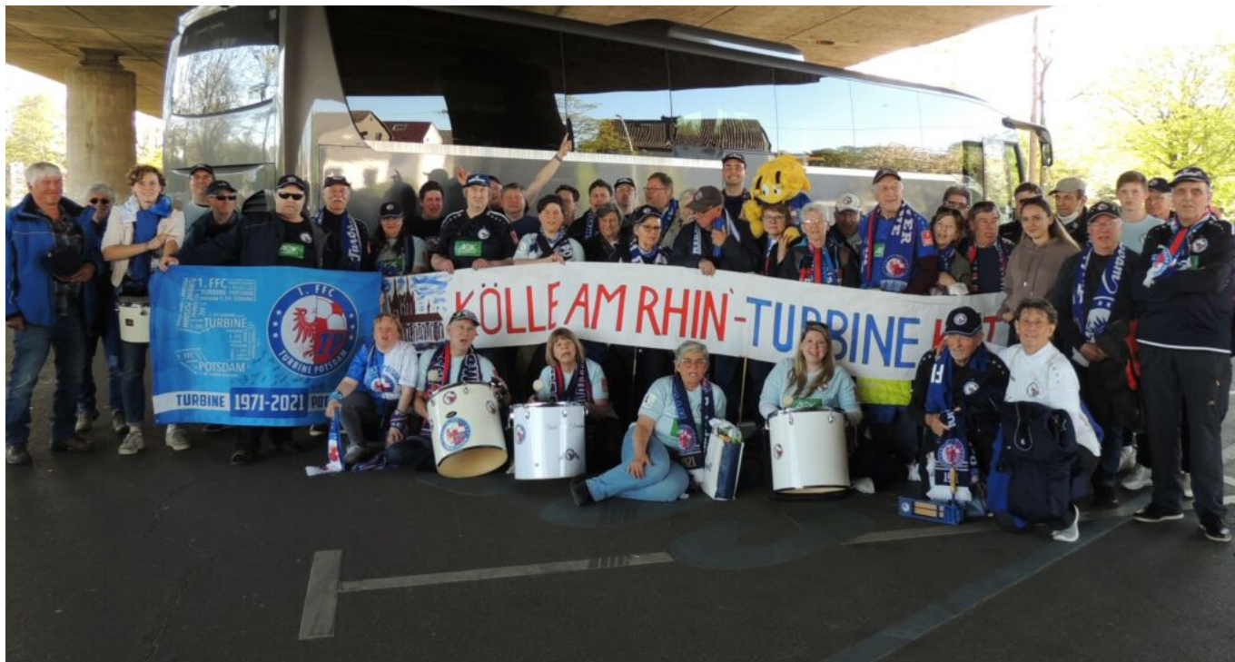
Turbinefans mit Auftrag

So voll hatte ich das Haberlandstadion noch nie gesehen - zu Ligaspielen gegen Turbine kommen im Durchschnitt 130 Zuschauer, davon mindestens die Hälfte Turbinefans.