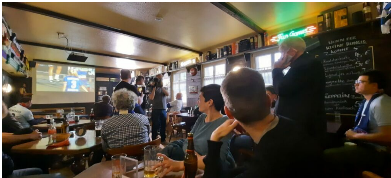
Public Viewing