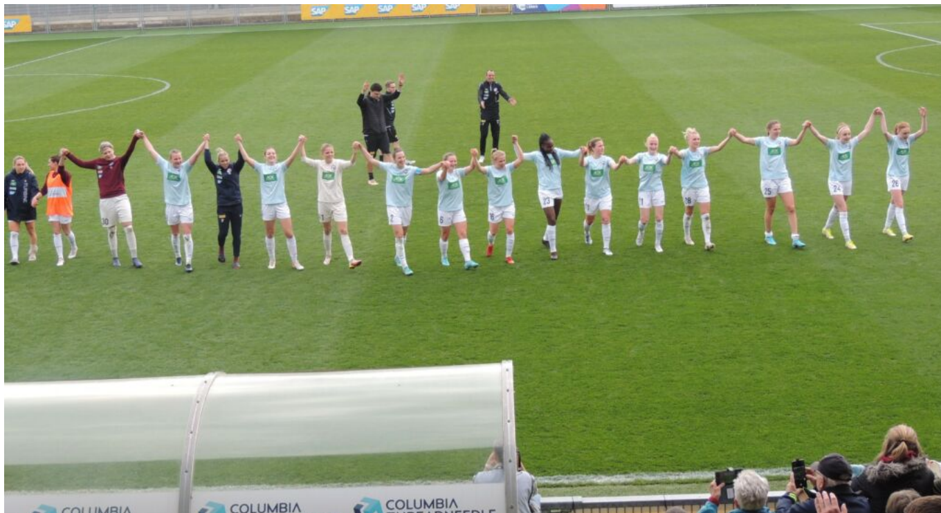
Dankeschön an die Fans

6 Punkte liegt nun Hoffenheim hinter uns, die Frankfurter aber nur 3 Punkte.