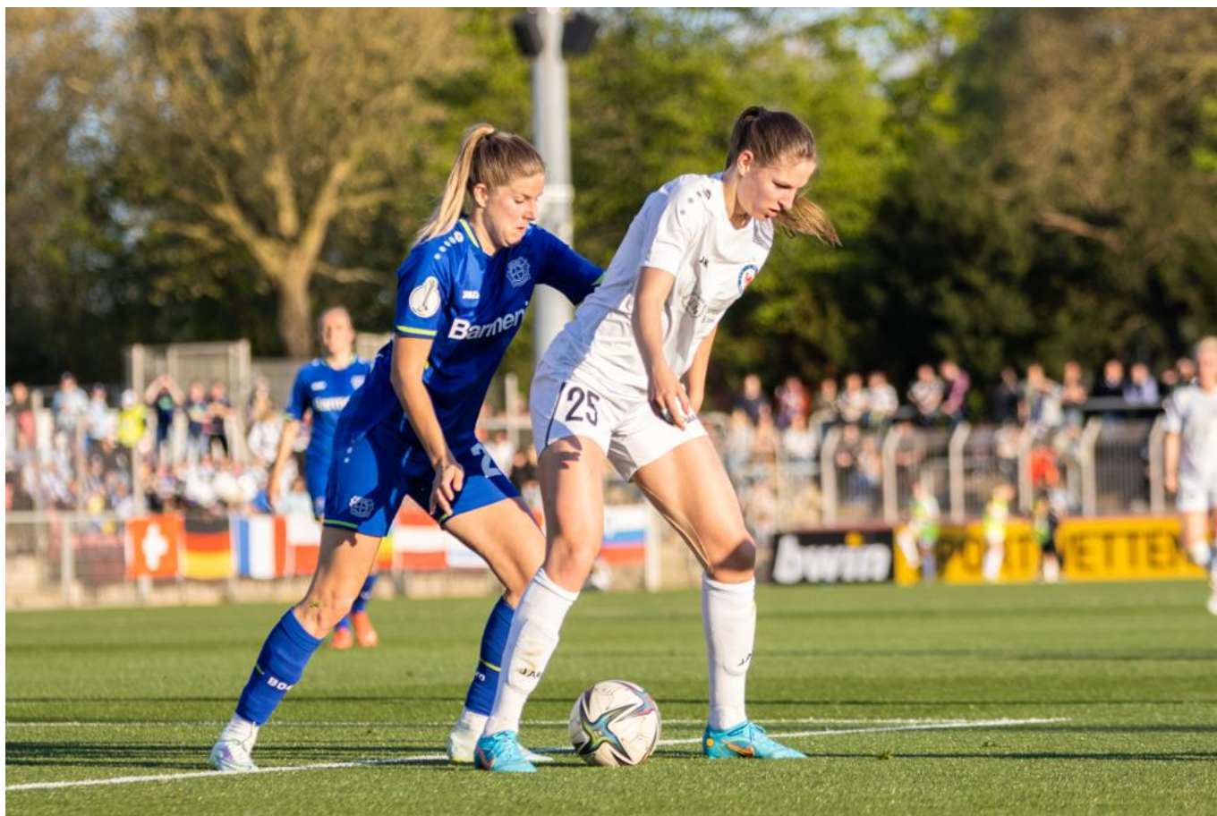
fast synchron