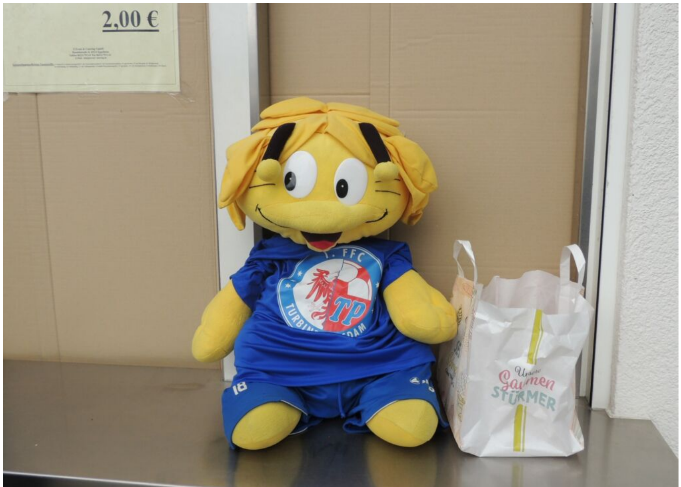
es ist vollbracht