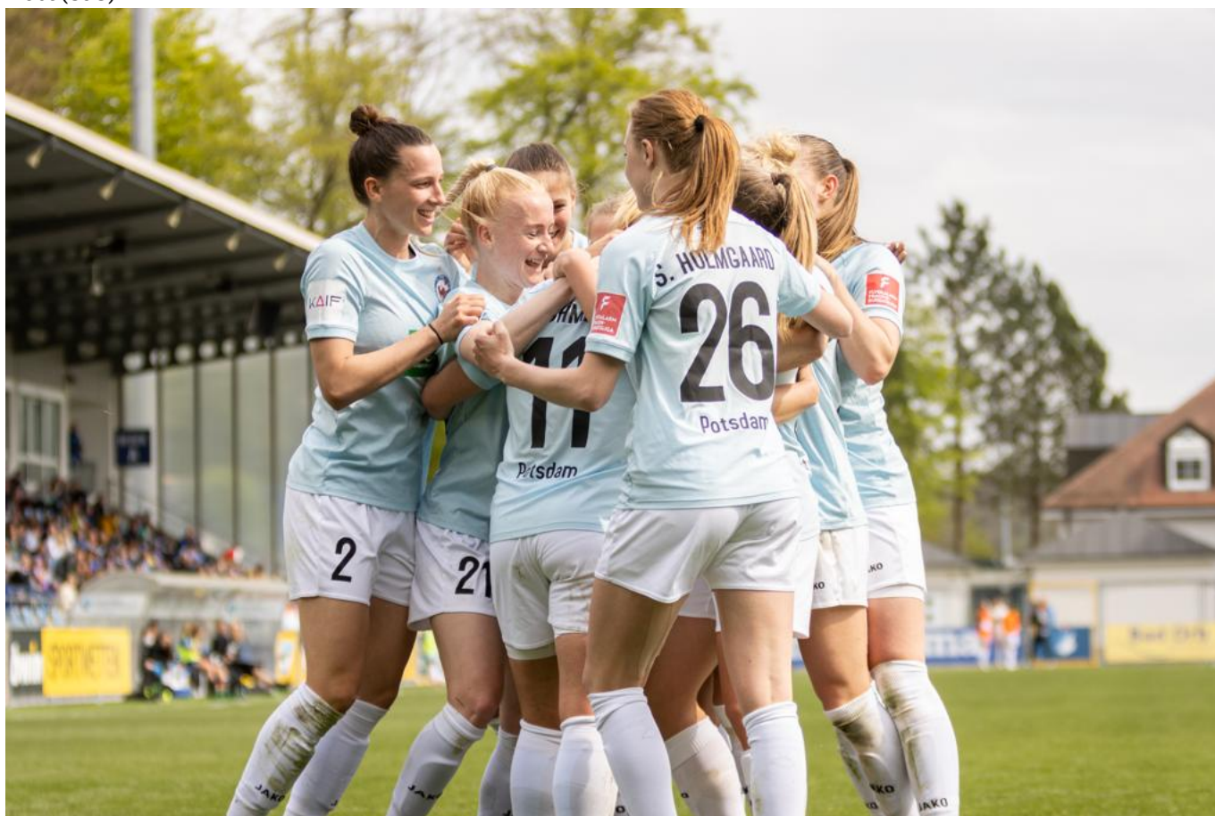
Torjubel für #11