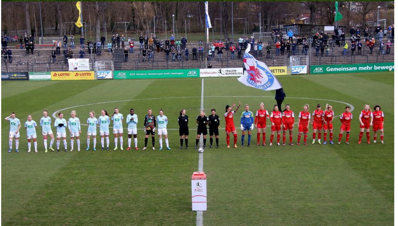
es kann losgehen