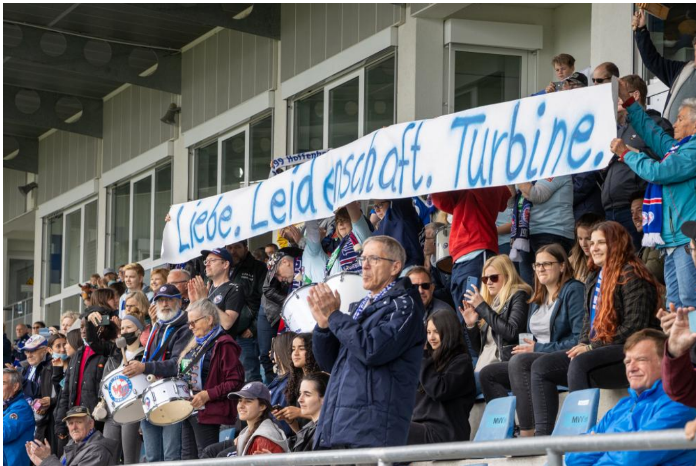
das ist Turbine