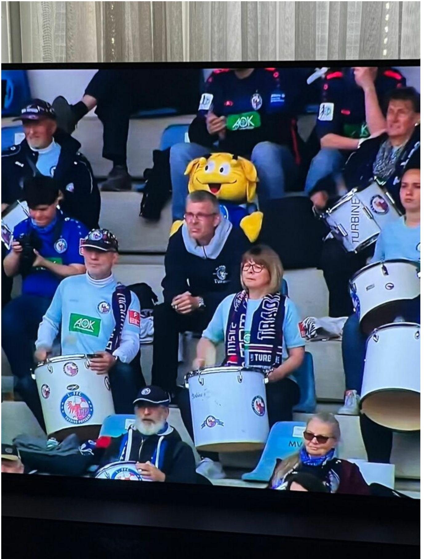
Anspannung - Foto(micha)