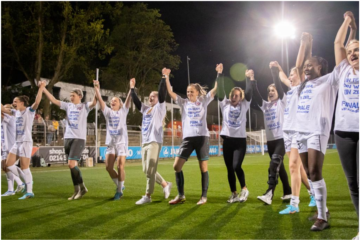
FINALE WIR KOMMEN

Sara schreit, sie rennt auf unseren Fanblock zu, die anderen Turbinen kommen dazu, alle werfen sich zu Boden. Die Fans kriegen sich nicht mehr ein, alle fallen sich um den Hals. Die Bilder und Videos können gar nicht dieses Live-Erlebnis wiedergeben. Es ist unbeschreiblich. Nun ist Pokal-Party angesagt, auch für die Turbinen sind T-Shirts vorbereitet. EIN TEAM-EIN WEG-EIN ZIEL - FINALE WIR KOMMEN