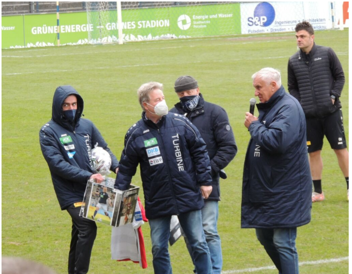
Losfee Rolf - Foto(bea)