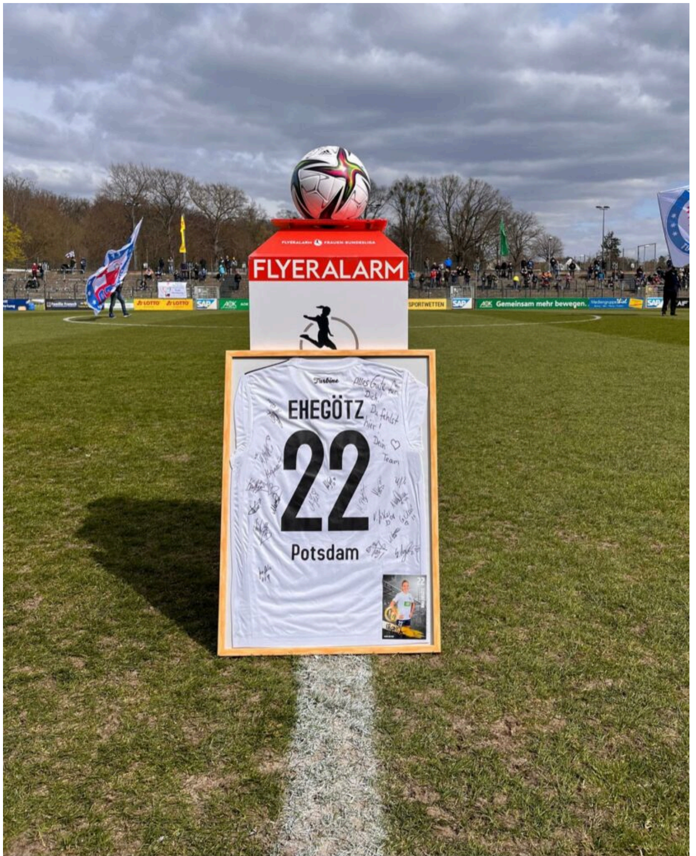
das Wichtigste in Kürze - Foto(Turbine)