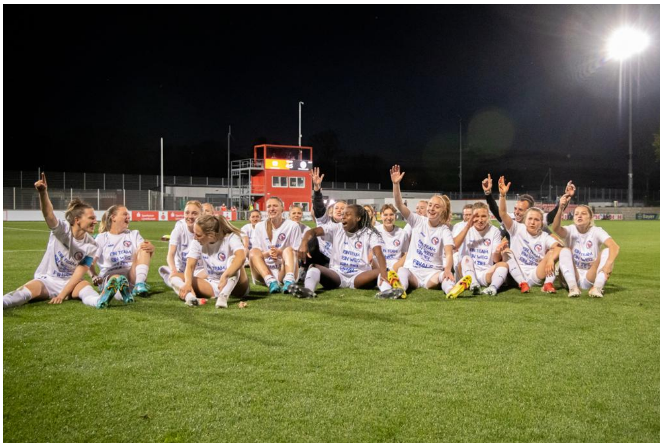
HUMBA Täterä - Foto(sas)