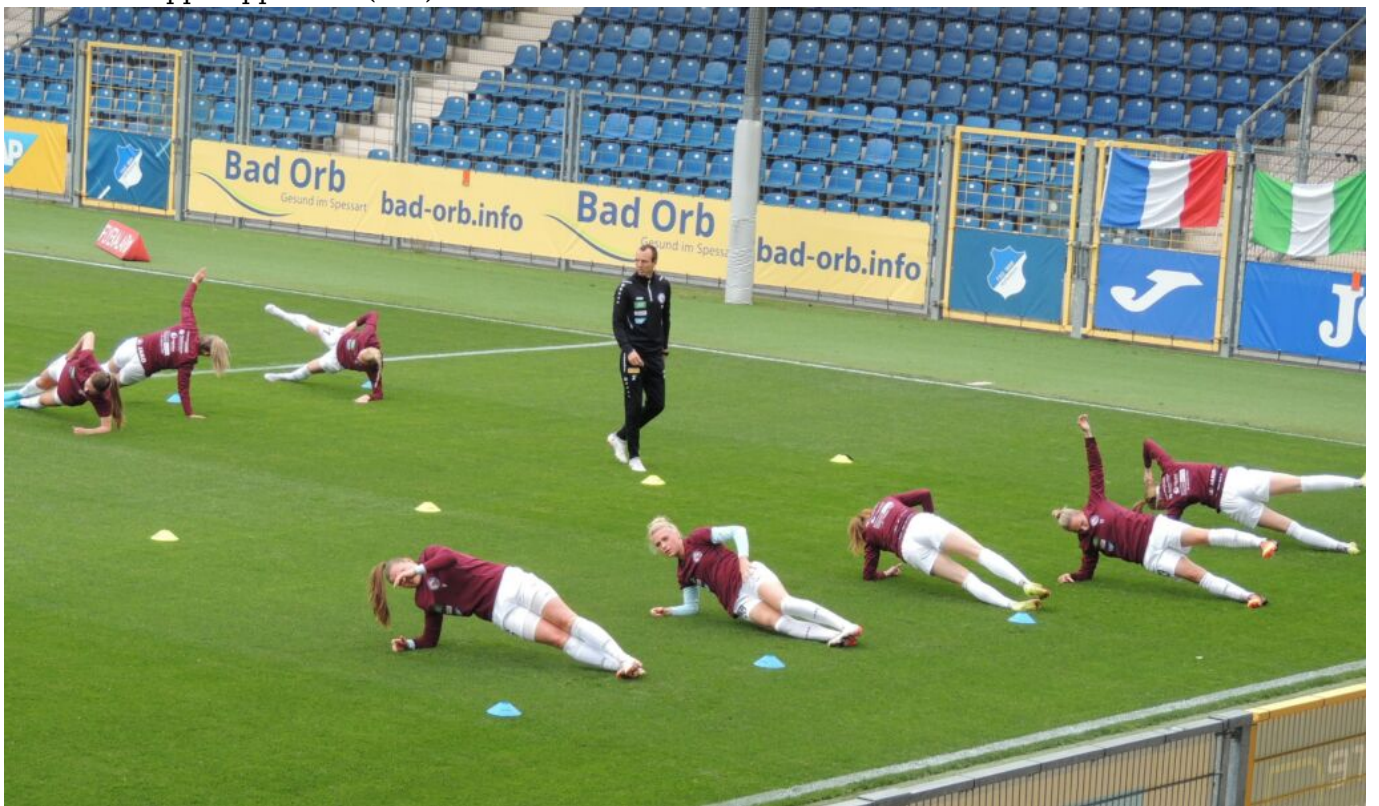
gar nicht so einfach