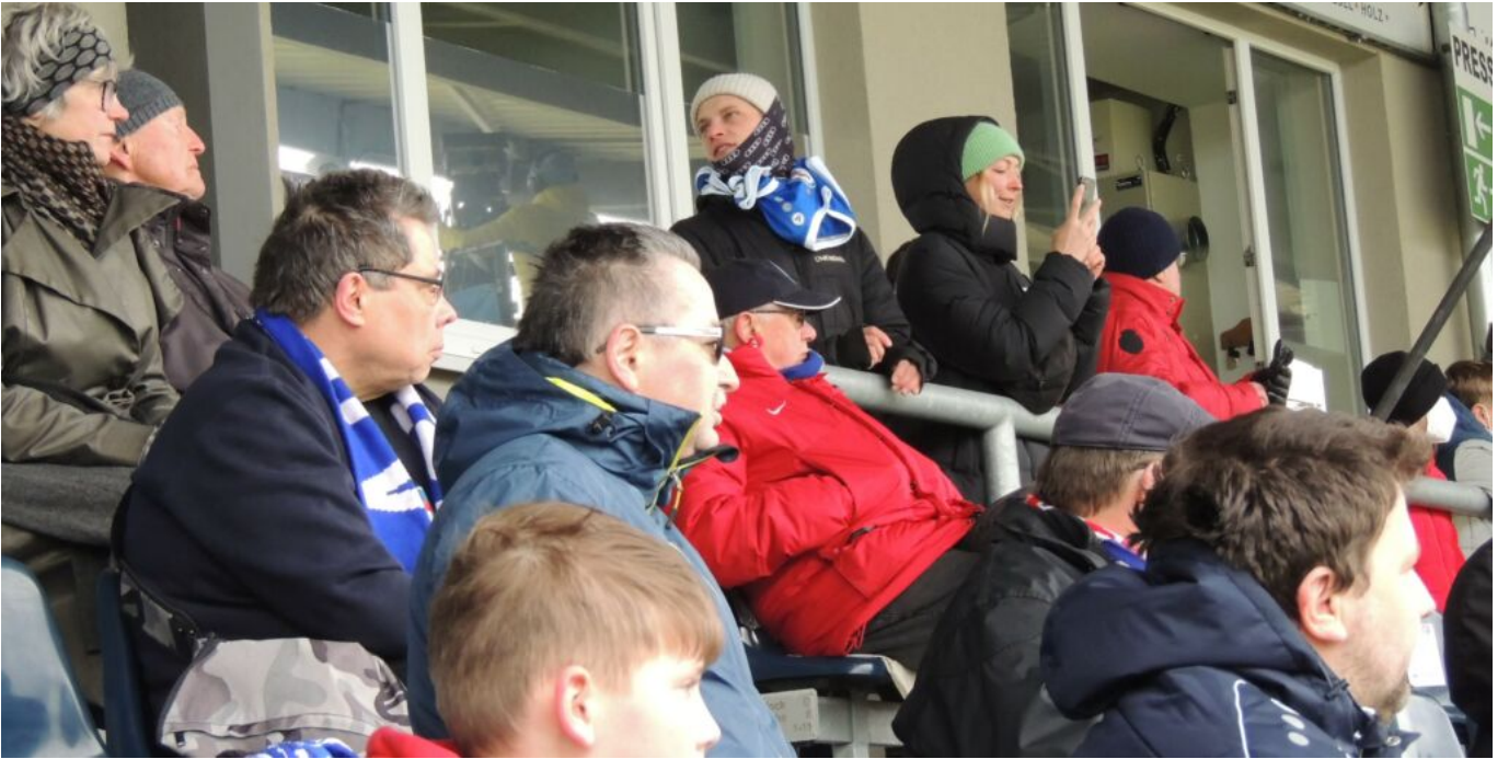
Fans unserer #6