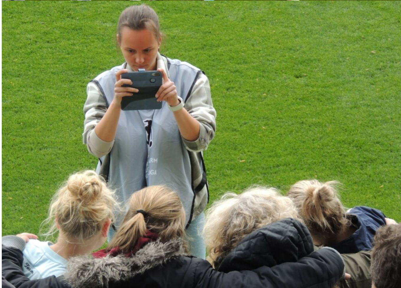
Familie Merle