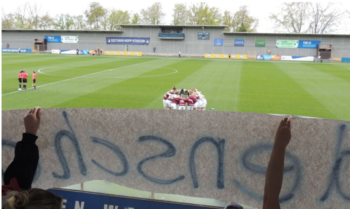
ungewohnter Blick - Foto(beat)