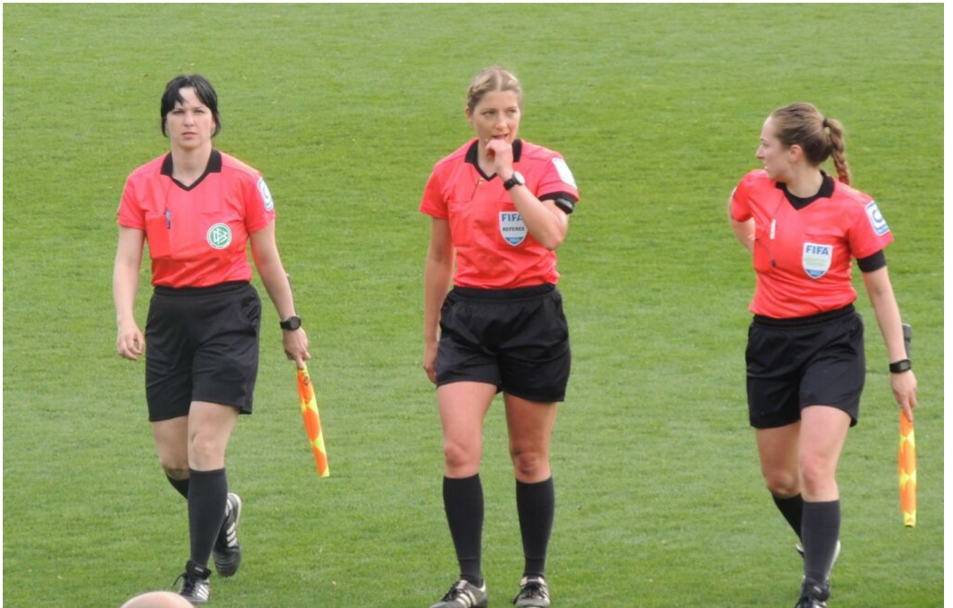
machten keine gute Figur