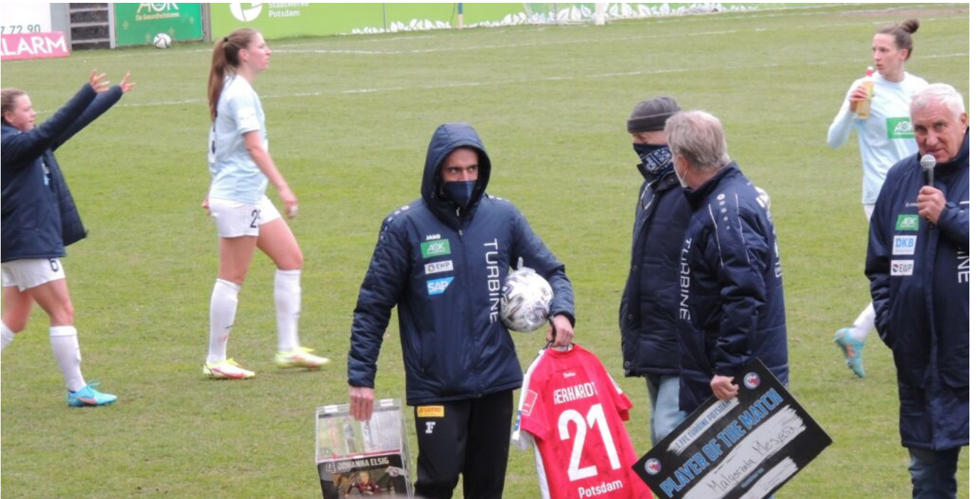
Gewinne, Gewinne - Foto(bea)