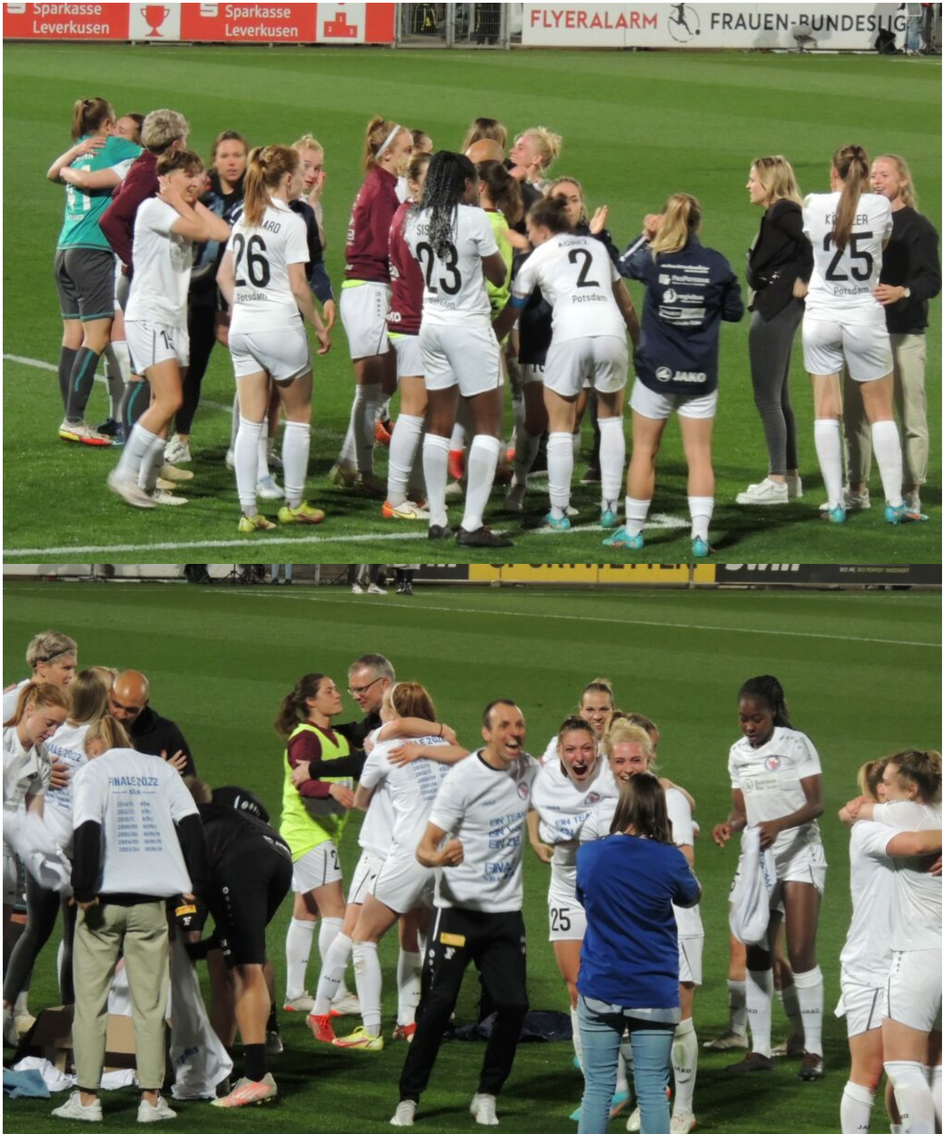
oh, wie ist das schön