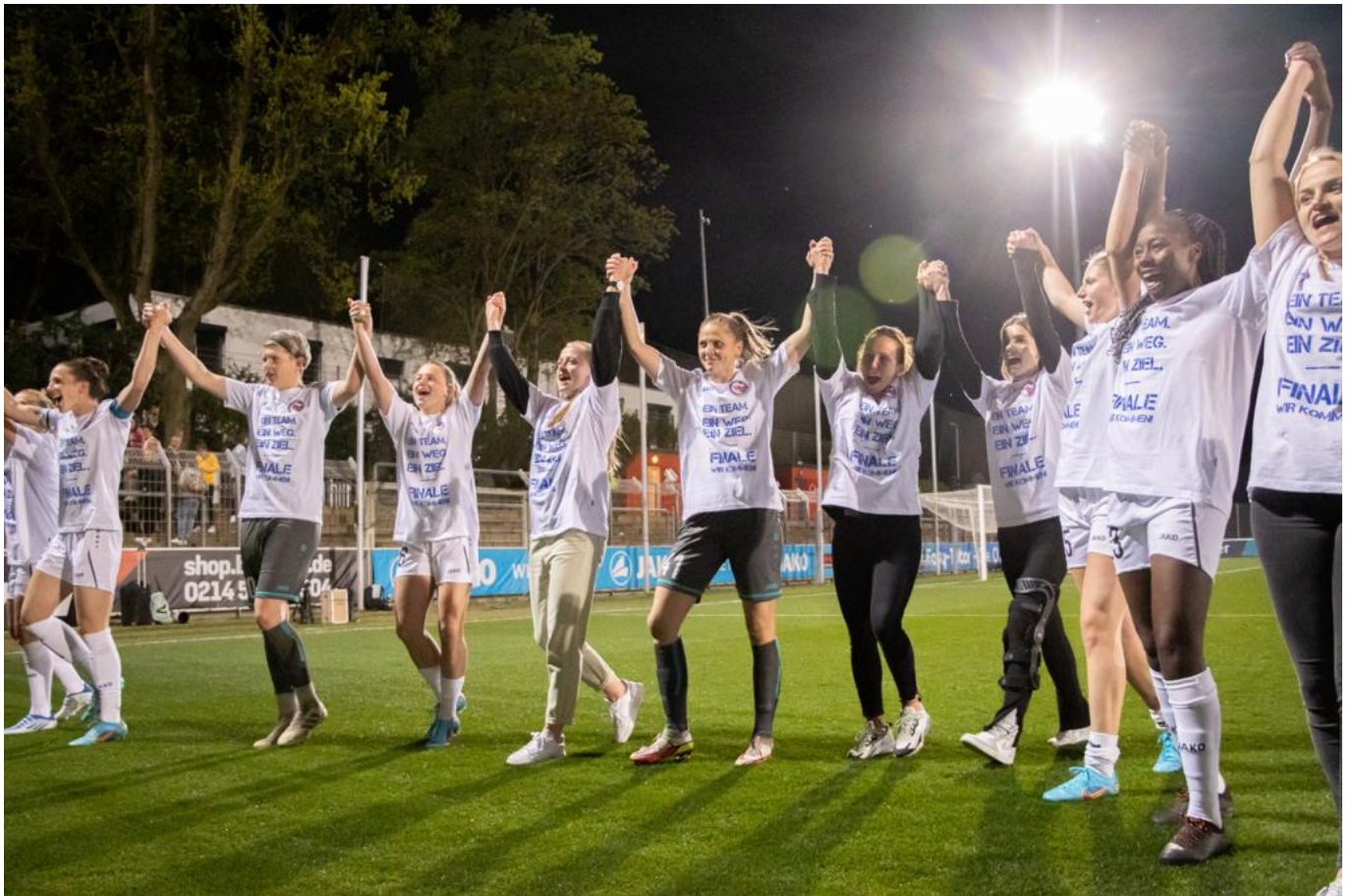
FINALE WIR KOMMEN