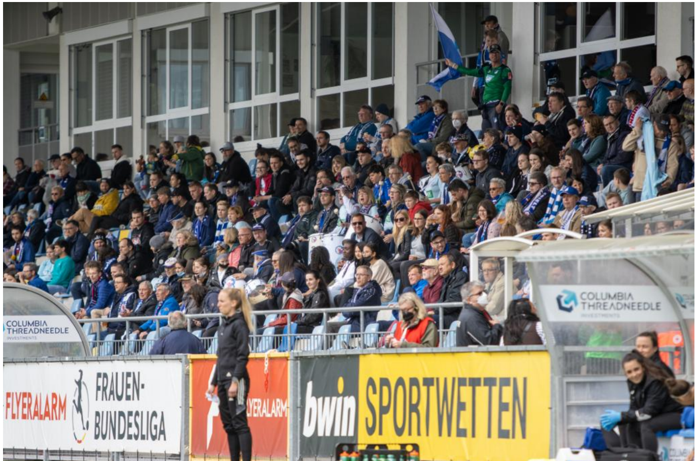
Turbine-Fan-Block