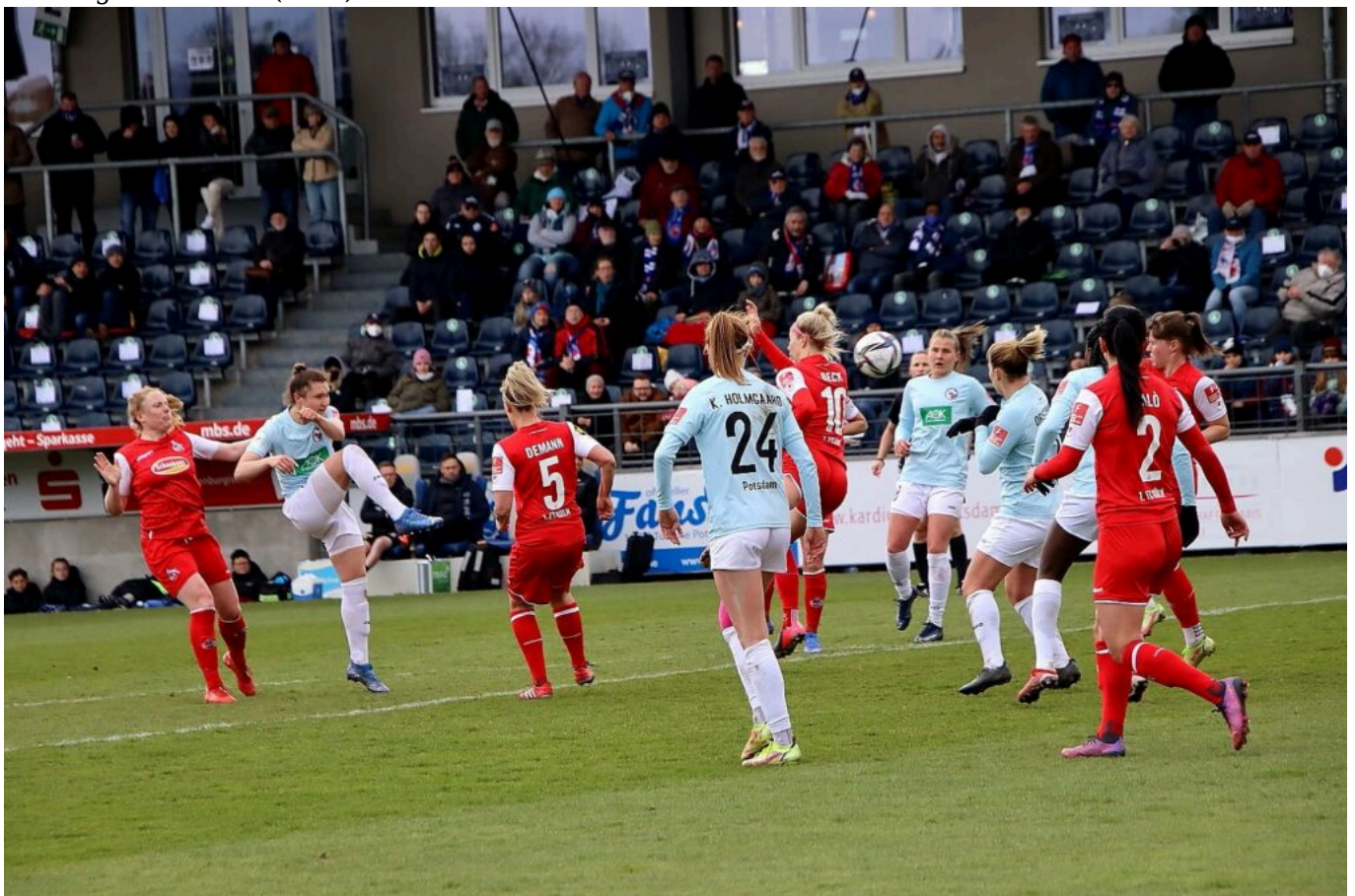
so macht man das - Foto(ferol)