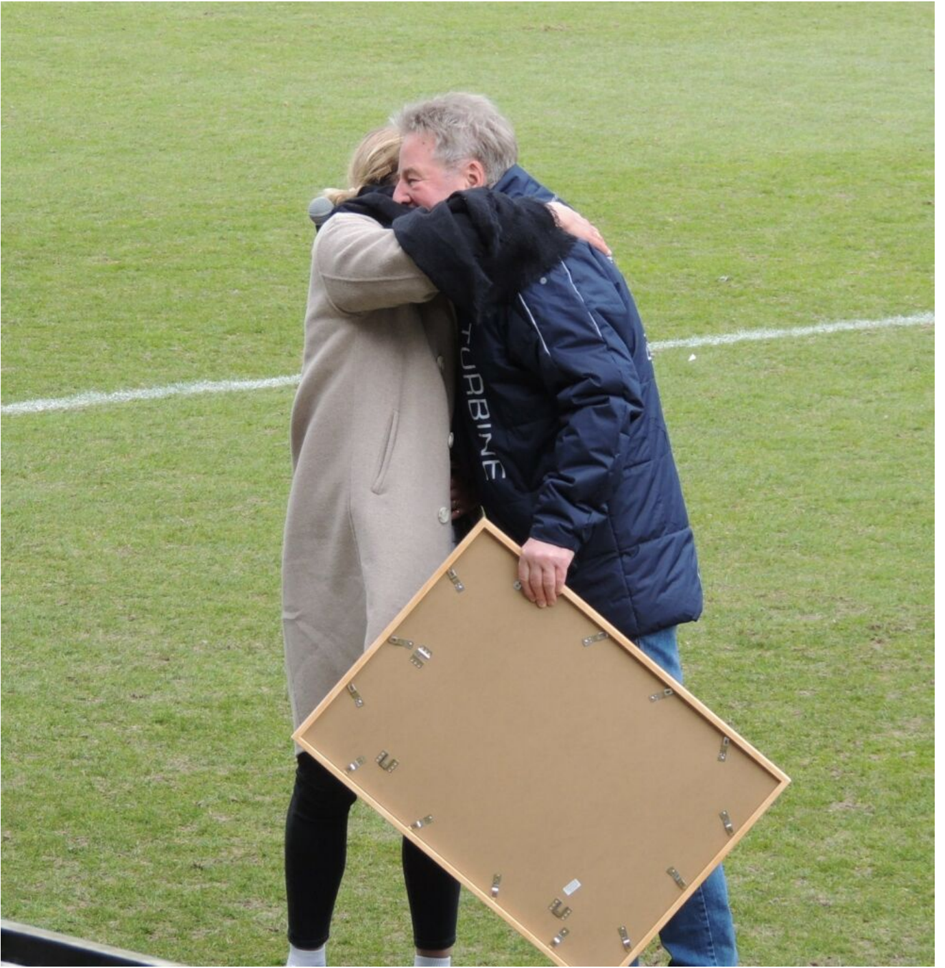
Abschied - Foto(bea)