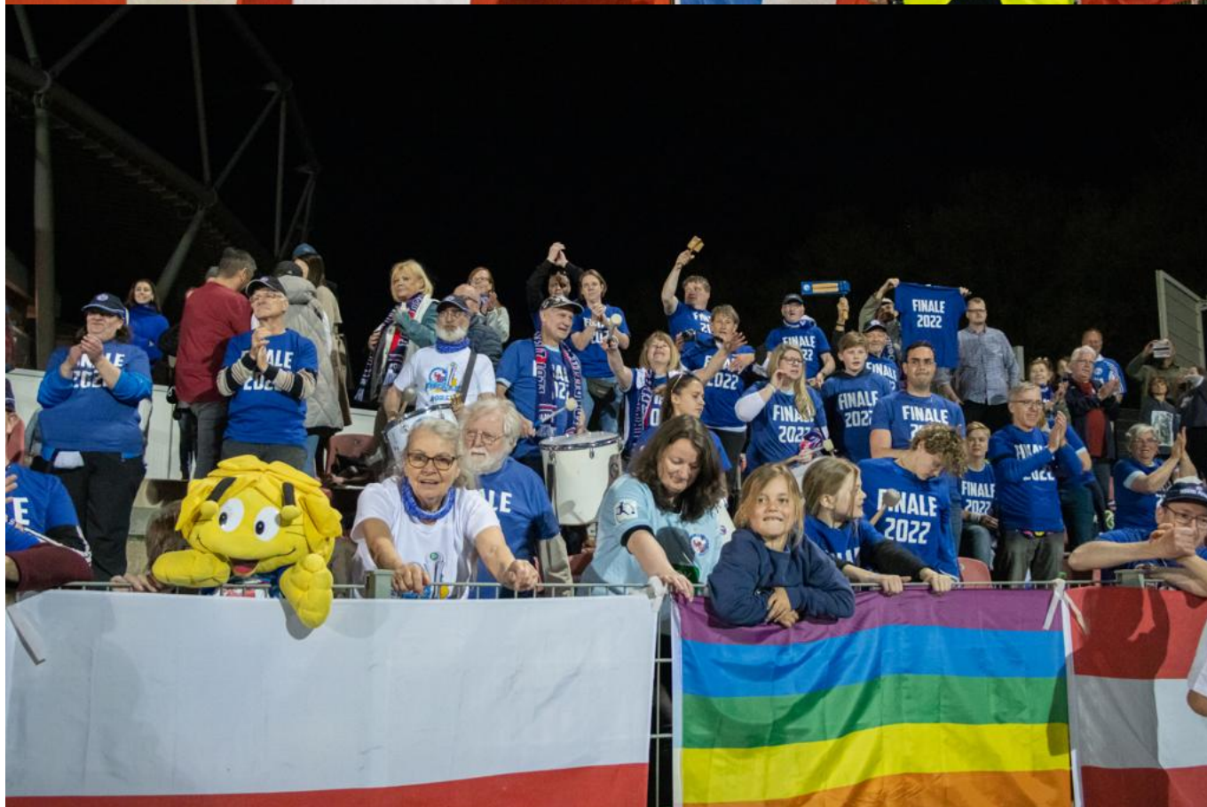
Finale 2022 - Foto(sas)

Am Samstag geht es schon wieder auf Auswärtstour nach Hoffenheim, die längste Tour, die mit dem