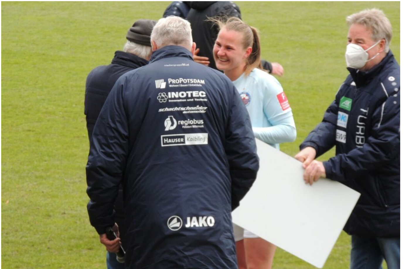
Goszas Lächeln