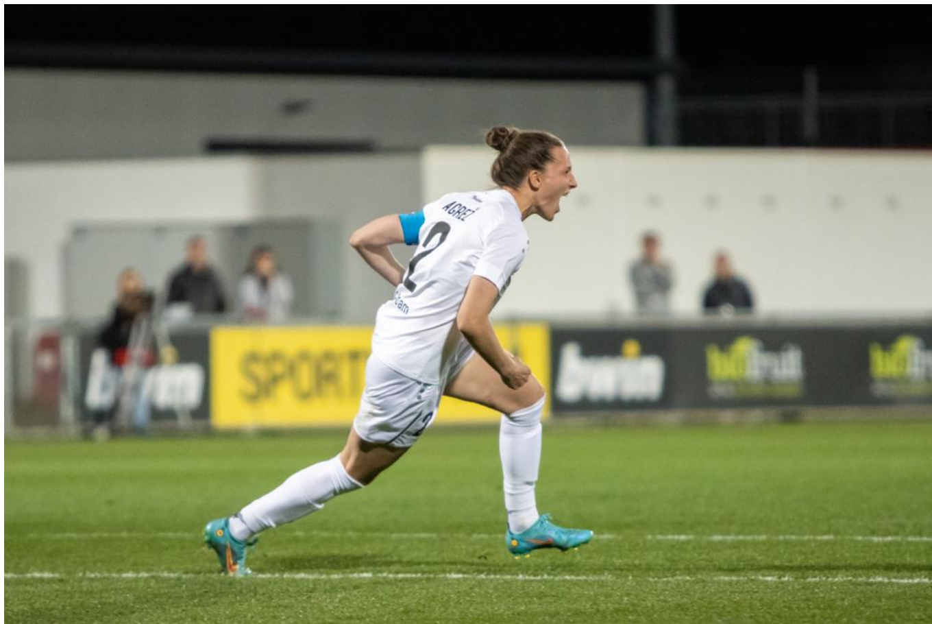
befreiender Schrei