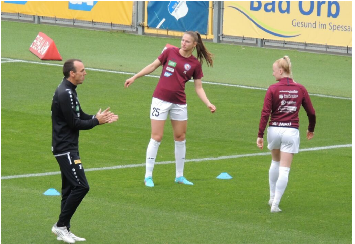
nun aber hopp-hopp - Foto(bea)