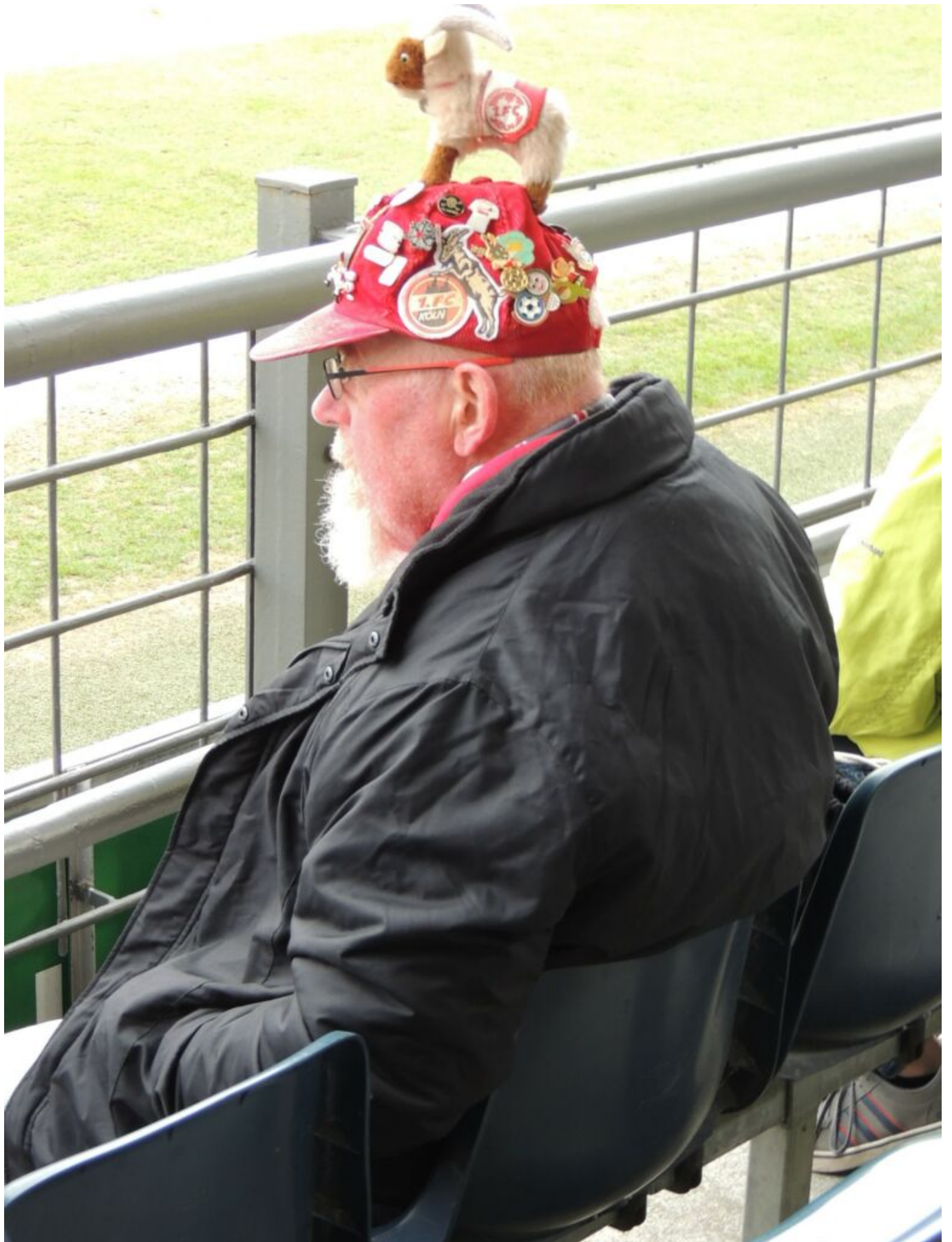
1. FC Köln-Fan