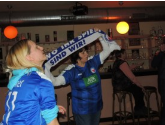
Tanz mit Schaleinlage