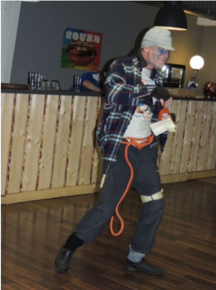
Ein Stadstreicher zu Gast