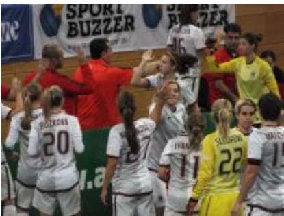
Sparta vor dem Finalantritt