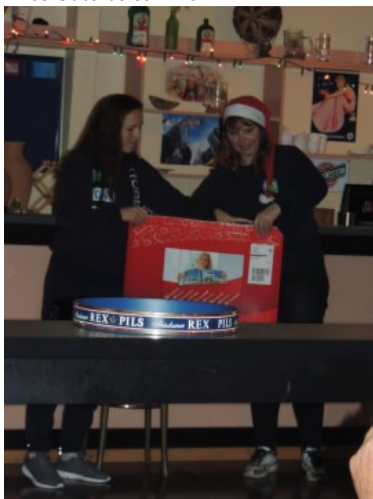
Weihnachtsgeschenk für die Mannschaft