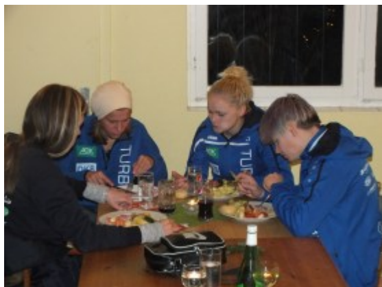
Scheint zu schmecken