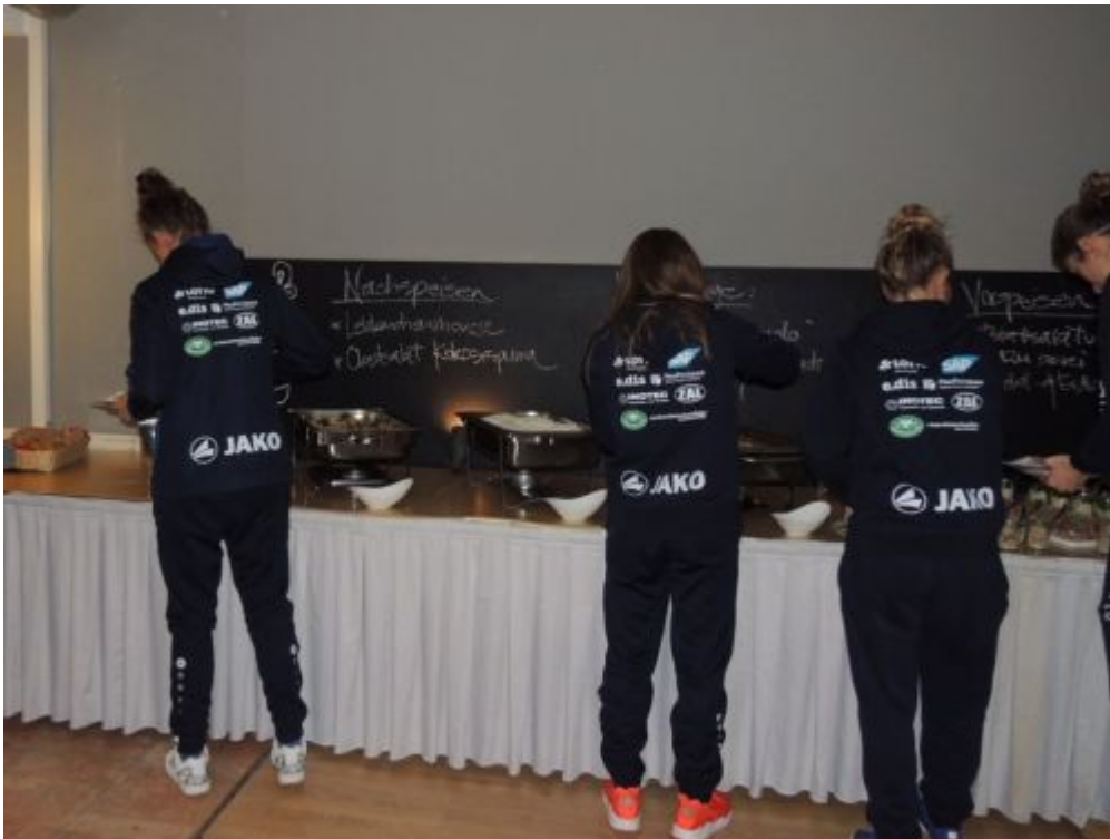
Hungerattacke am Buffet