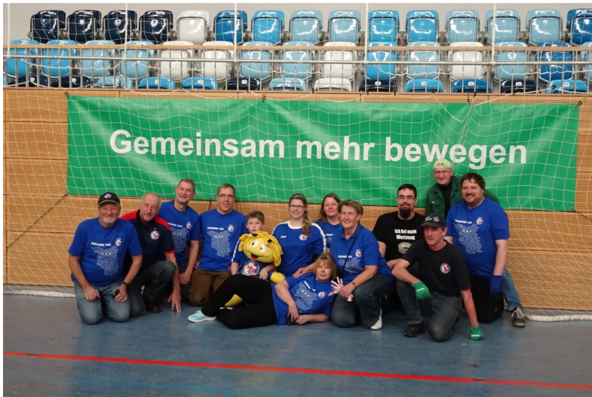
Fans on MBS-Arena-Tour

Bei der Verwandlung der sterilen MBS-Arena in eine grüne Turbine-Hallencup-Arena halfen einen Nachmittag-Abend-Nacht vor der Eröffnung des Turniers auch 16 Fans mit. In-door-Rasen säen, sprengen und beim Wachsen zusehen, Fußballtore und Banden aufbauen - nach ca. 8 Stunden Arbeitseinsatz kann man nun die Fußballmädels aus 7 Nationen willkommen heißen.