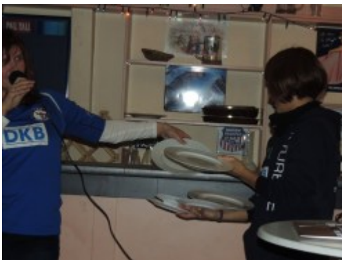
Asanos sechs auf einen Streich