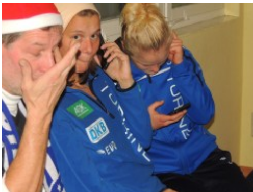
Herstellung des Kontaktes zur Außenwelt