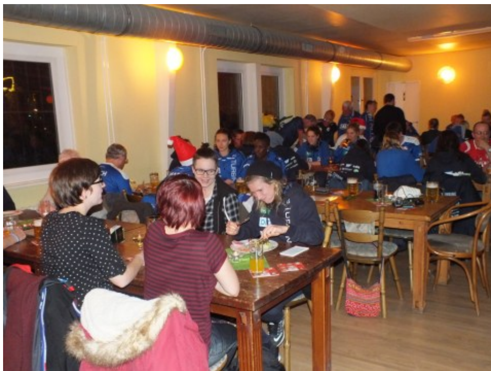
Alles Gute beisammen