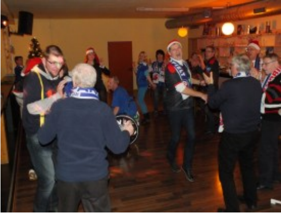
Wienern der Tanzfläche