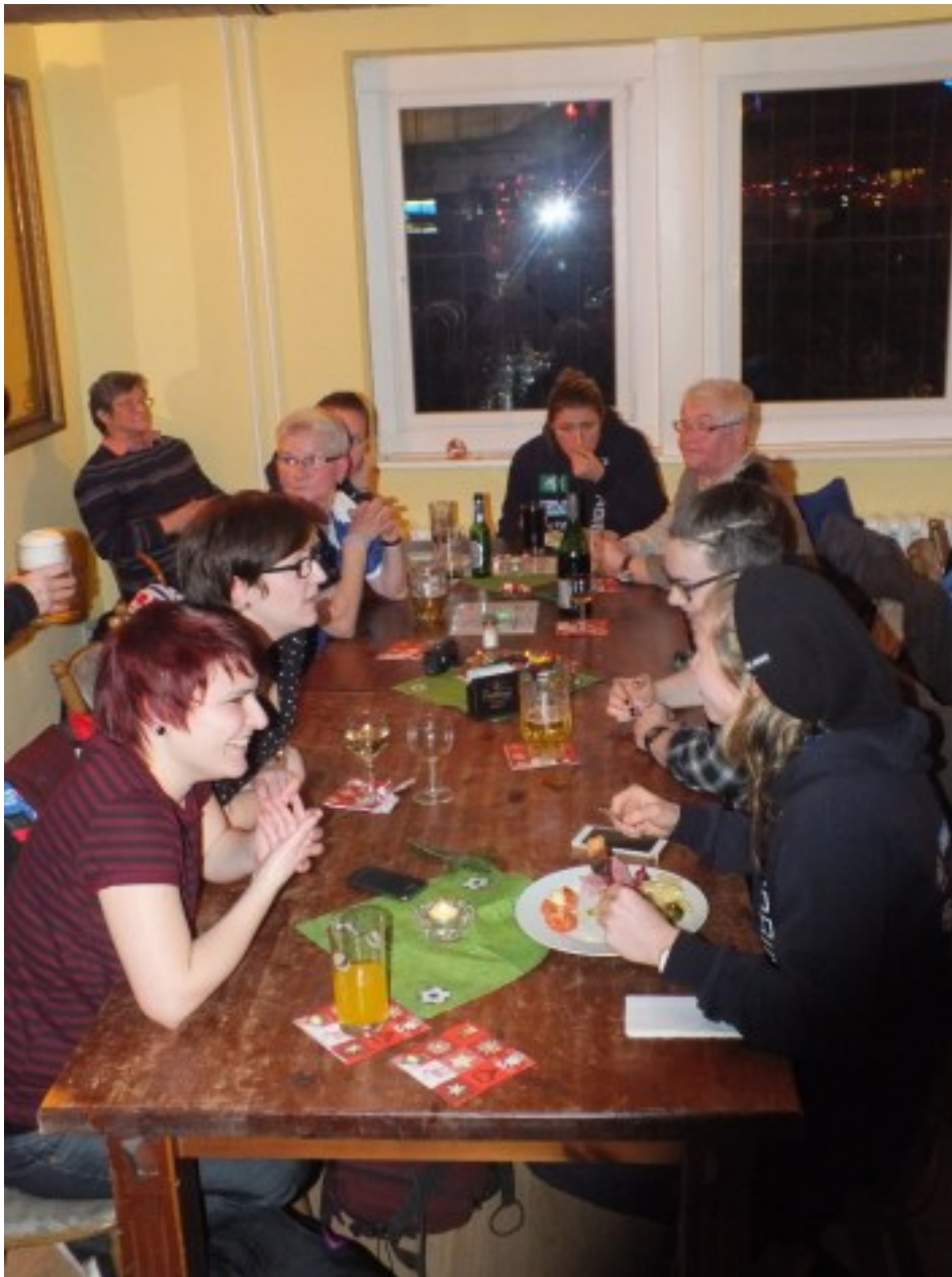
KK im Dialog