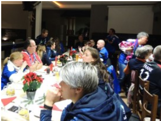
Fans und Fischer