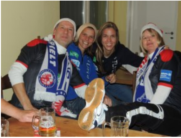
Fanfoto des Abends