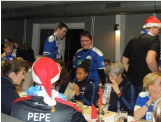
Bescherung der Torbienen durch die Fans