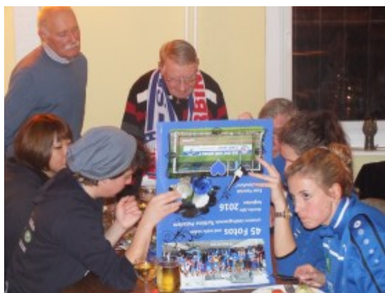
Dekoartikel für Mannschaftskabine