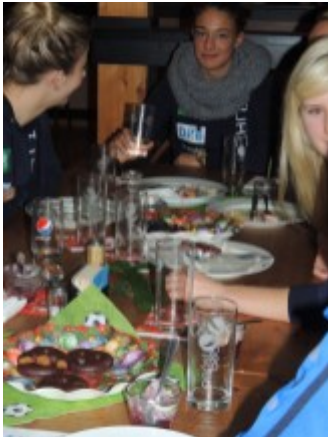
Schön, dass ihr da seid