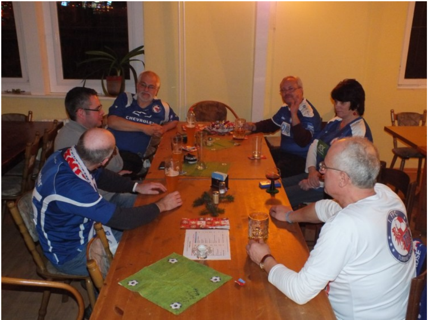
Die letzten machen das Licht aus