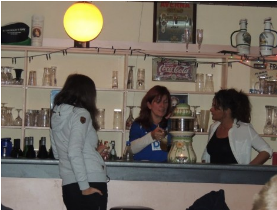
Frisch gezapft ist halb gewonnen