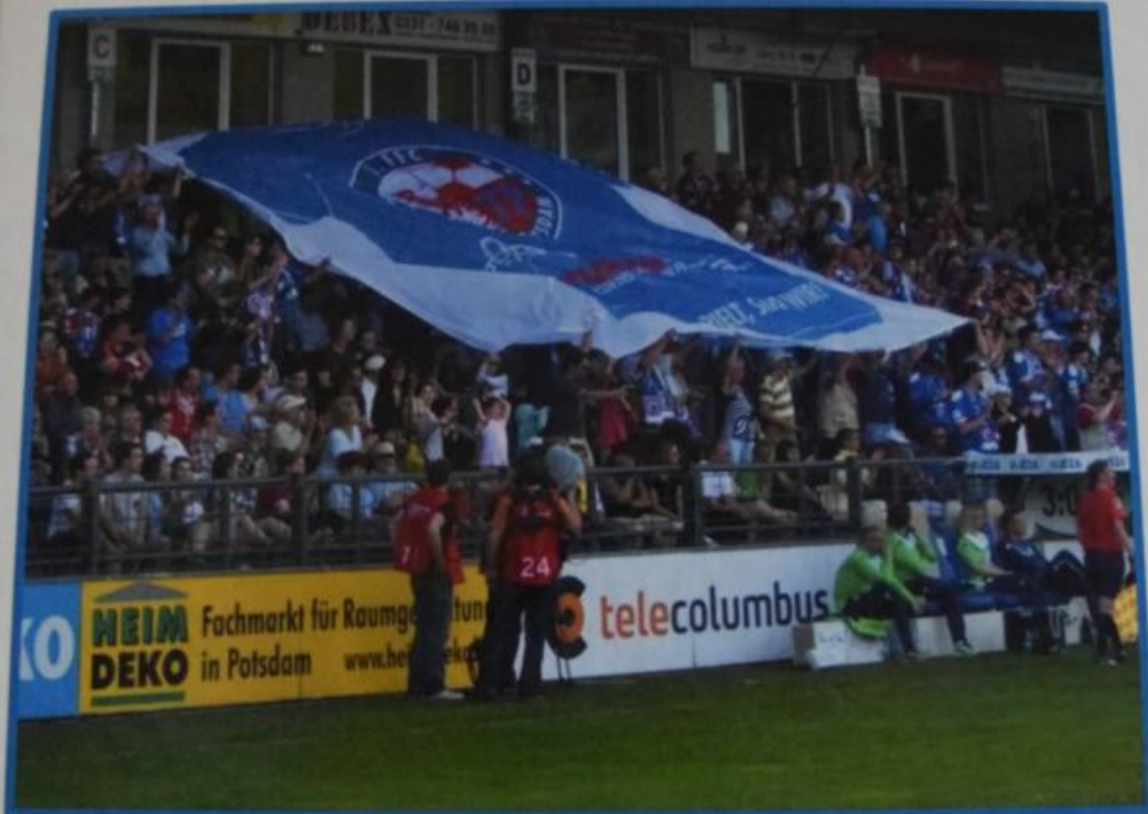
Blockfahne des Fanclubs „Da, wo ihr spielt, sind wir.“

2008 - 2018 10 Jahre gewachsene Fankultur in Potsdam