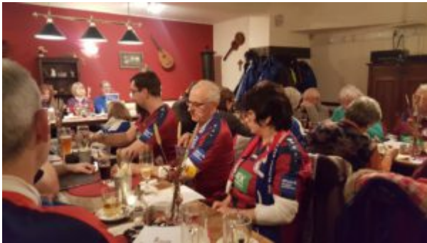
Begeistert zuhörende Mitglieder