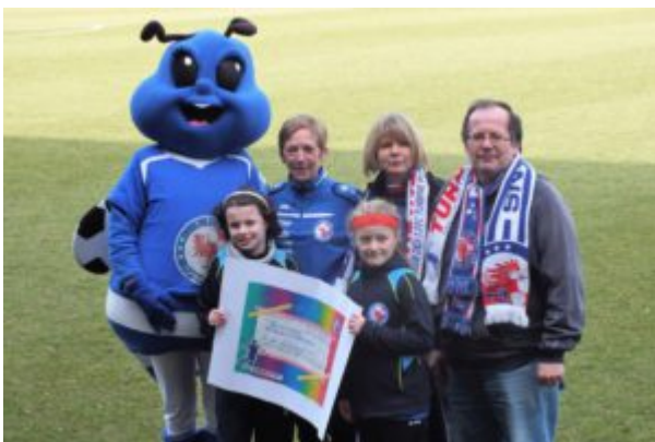
Spendenübergabe an den Nachwuchs von Turbine Potsdam

Fanblock-Kartenbestellung für den Turbine- Hallencup am 27./28. Januar