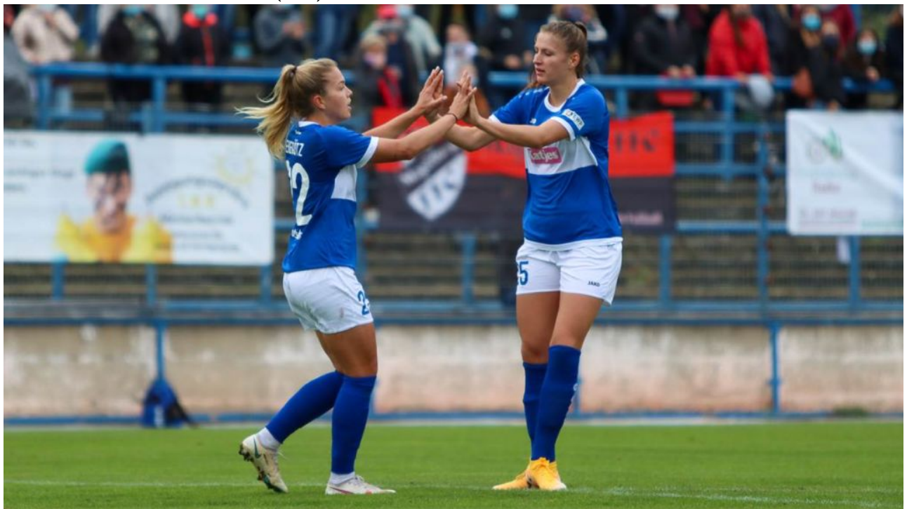
• verhaltener Jubel