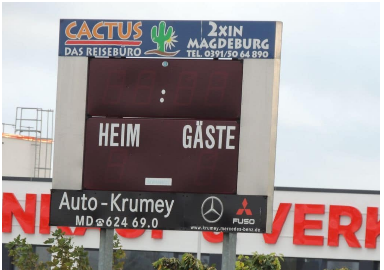
• leider nicht in Betrieb