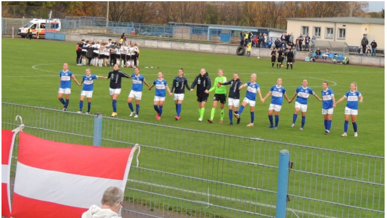
• Danke den Fans