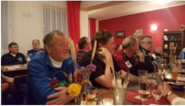
Begeistert zuhörende Mitglieder