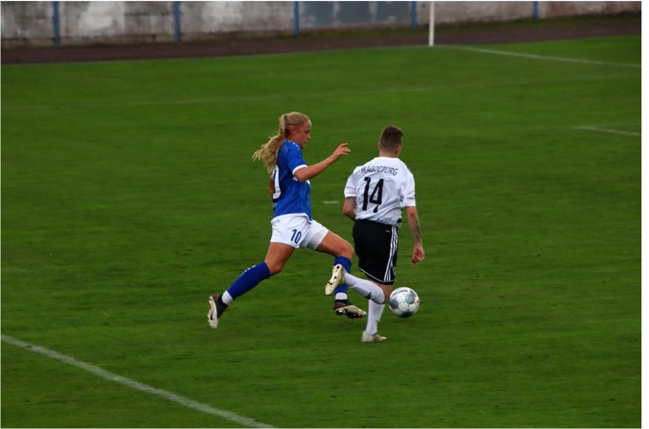
• Karos Chance - Foto(fer)