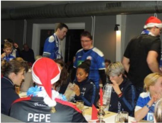
Bescherung der Torbienen durch die Fans