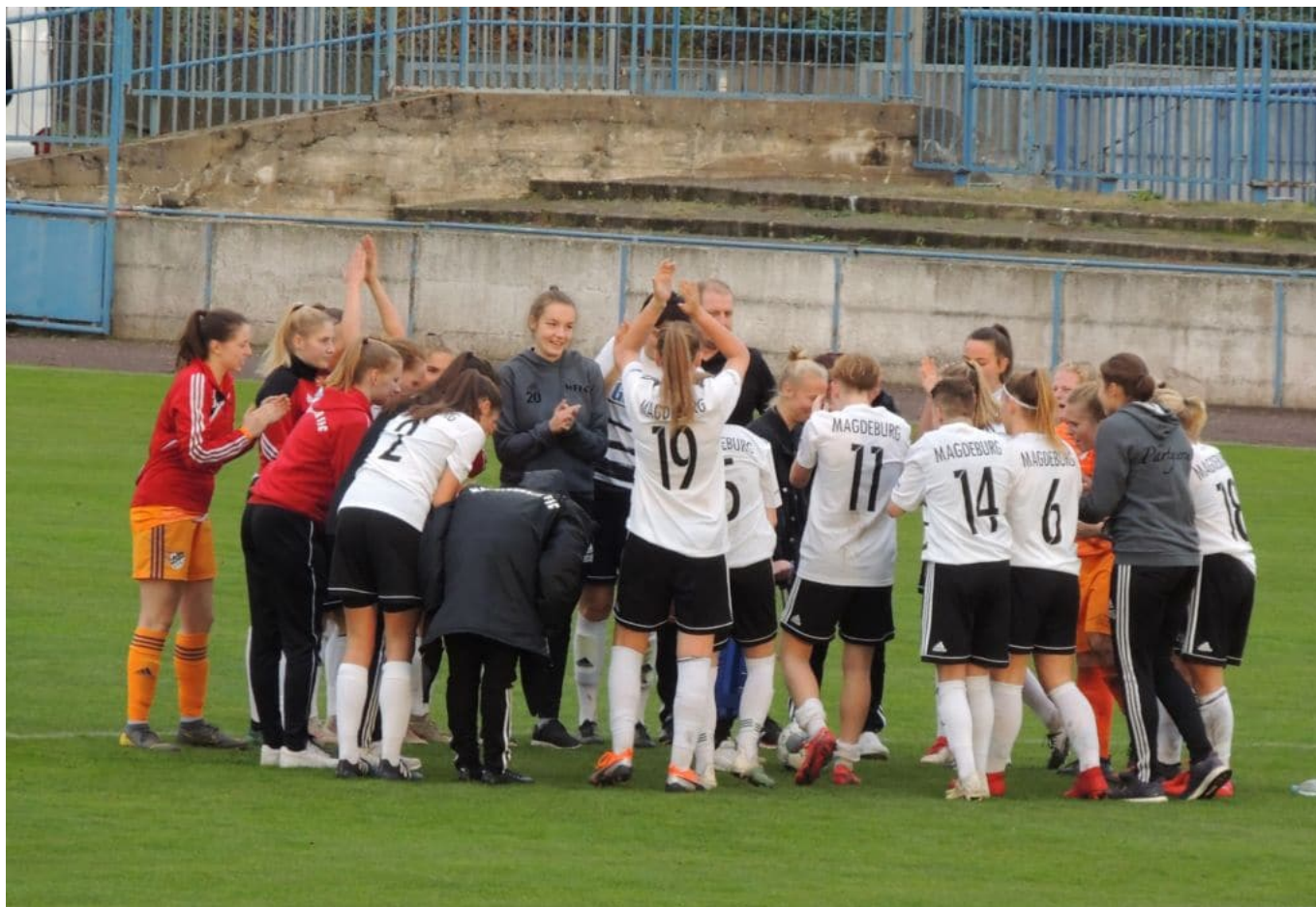
Freude nach dem Spiel - Foto(bea)

DANKE an die Spielerinnen des Magdeburger FFC, die ein starkes Spiel zeigten, sich nicht unterkriegen ließen. Dass sie trotz der Niederlage sangen und tanzten, war auch für uns eine neue Erfahrung.