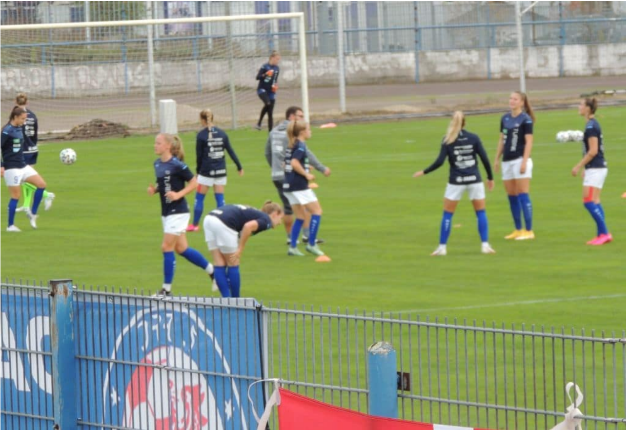
• Warm Up