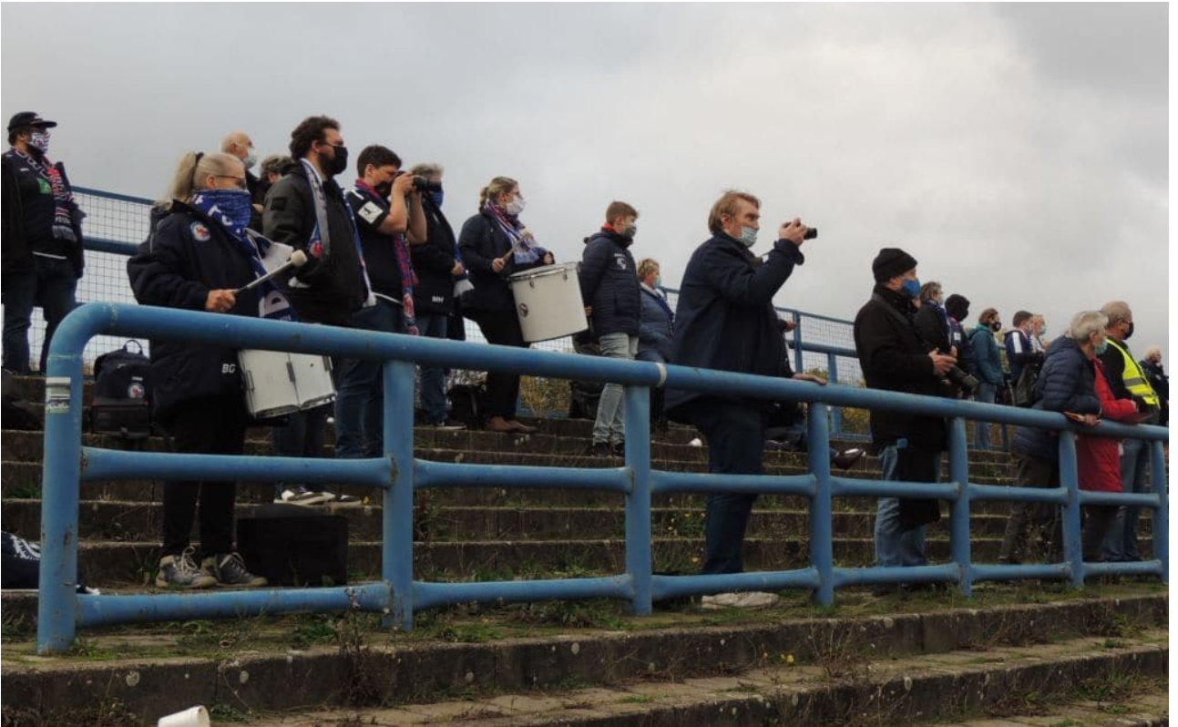
Fans mit Abstand