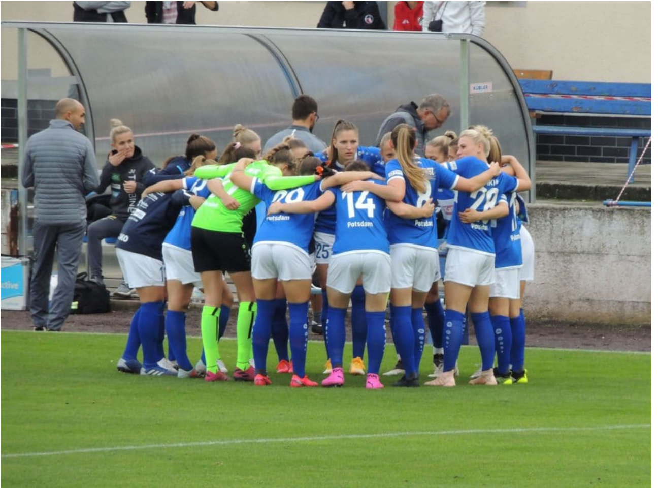
• es kann losgehen