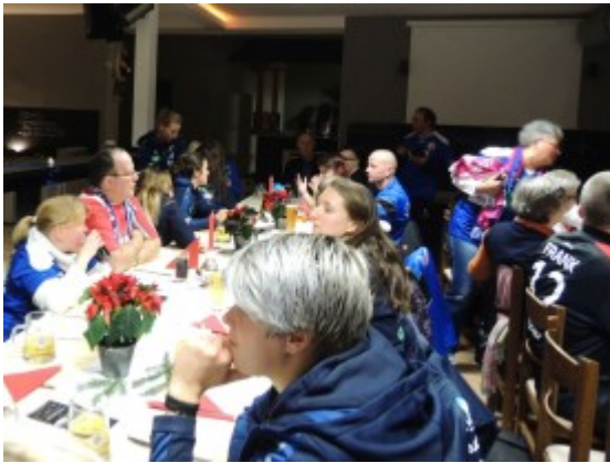
Fans und Fischer