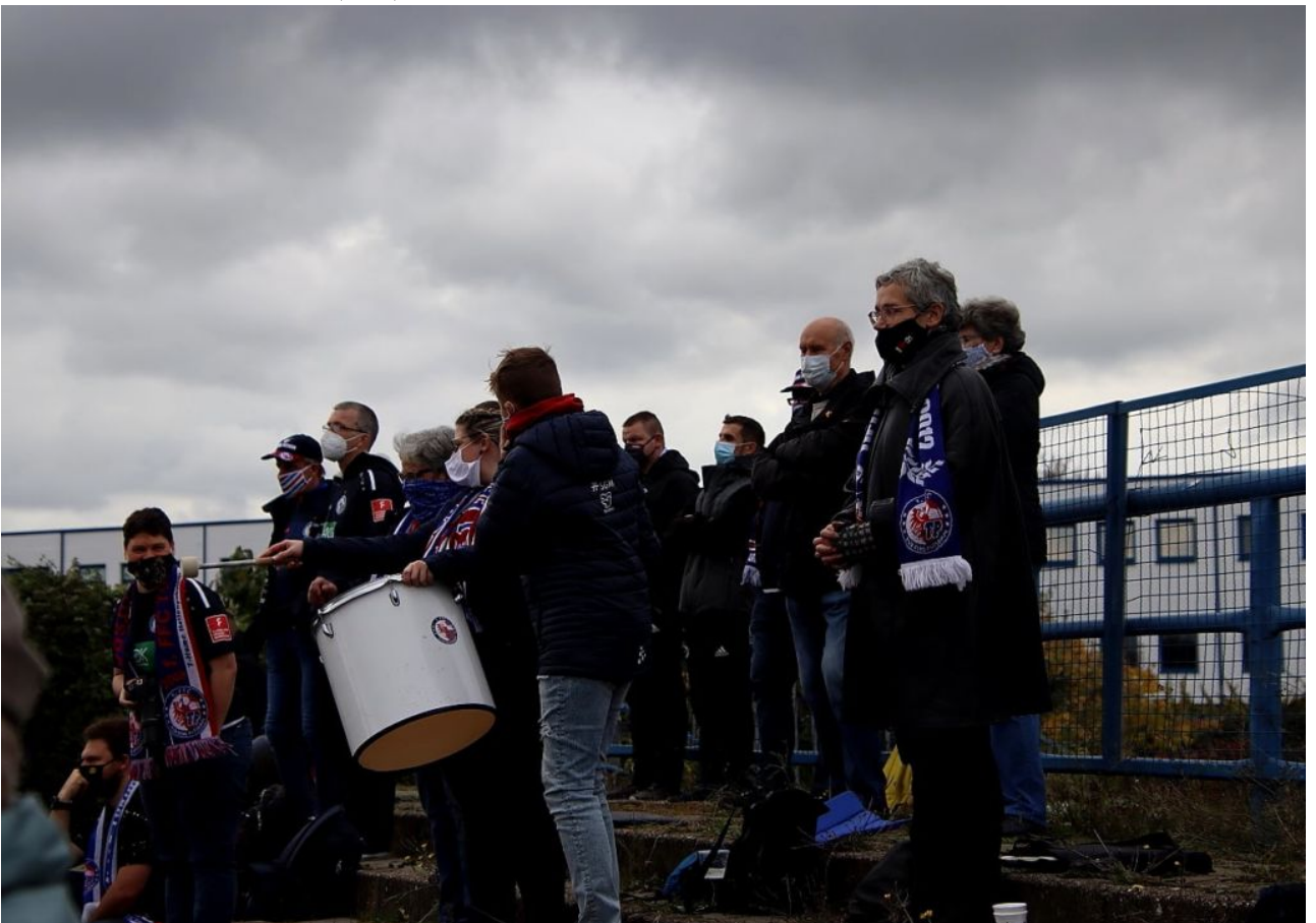
Fans - Foto(fer)