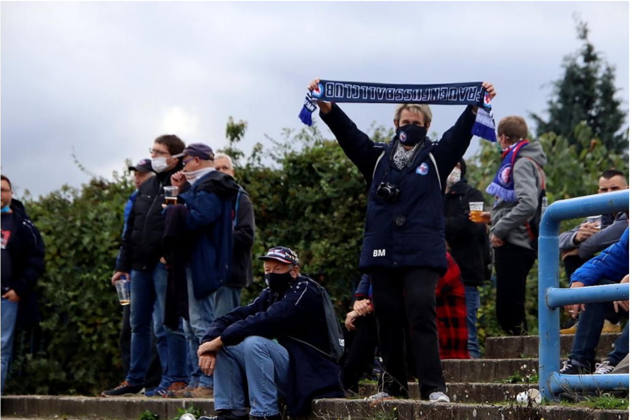
• der Schal leider verkehrt herum, es musste schnell gehen