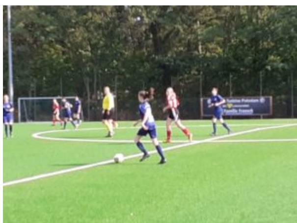
Merle nimmt Anlauf