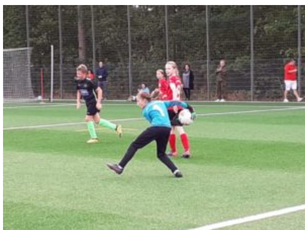
Und ab geht er !