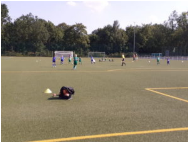
Auri (6) und Emma (rechts) gehen drauf