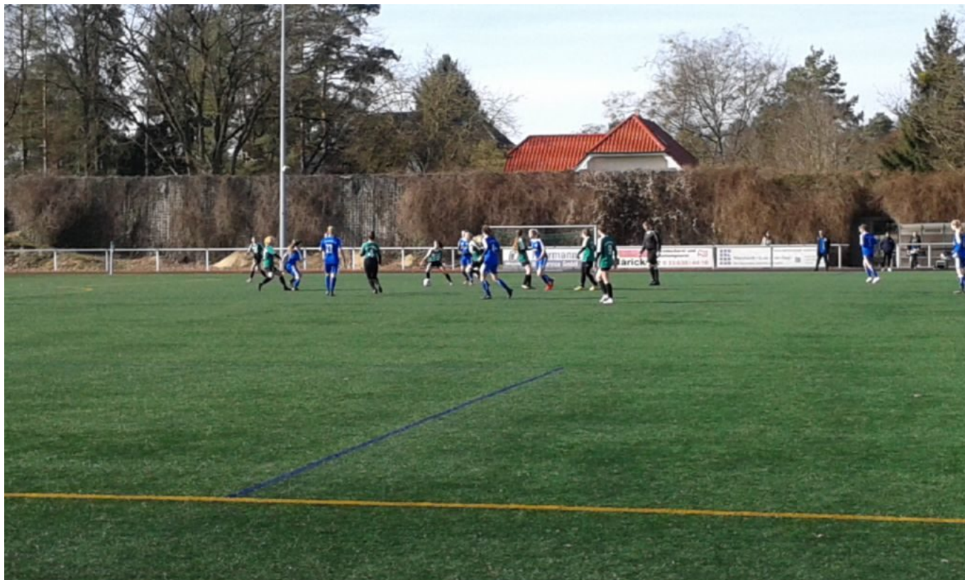
Alle auf einem Haufen