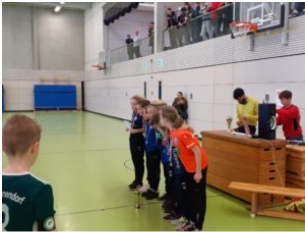
Während der Siegerehrung