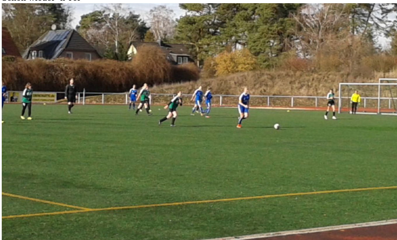
Der nächste Angriff rollt