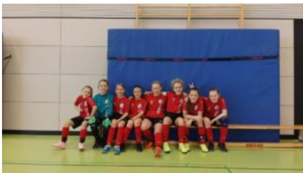
Alle auf einer Bank