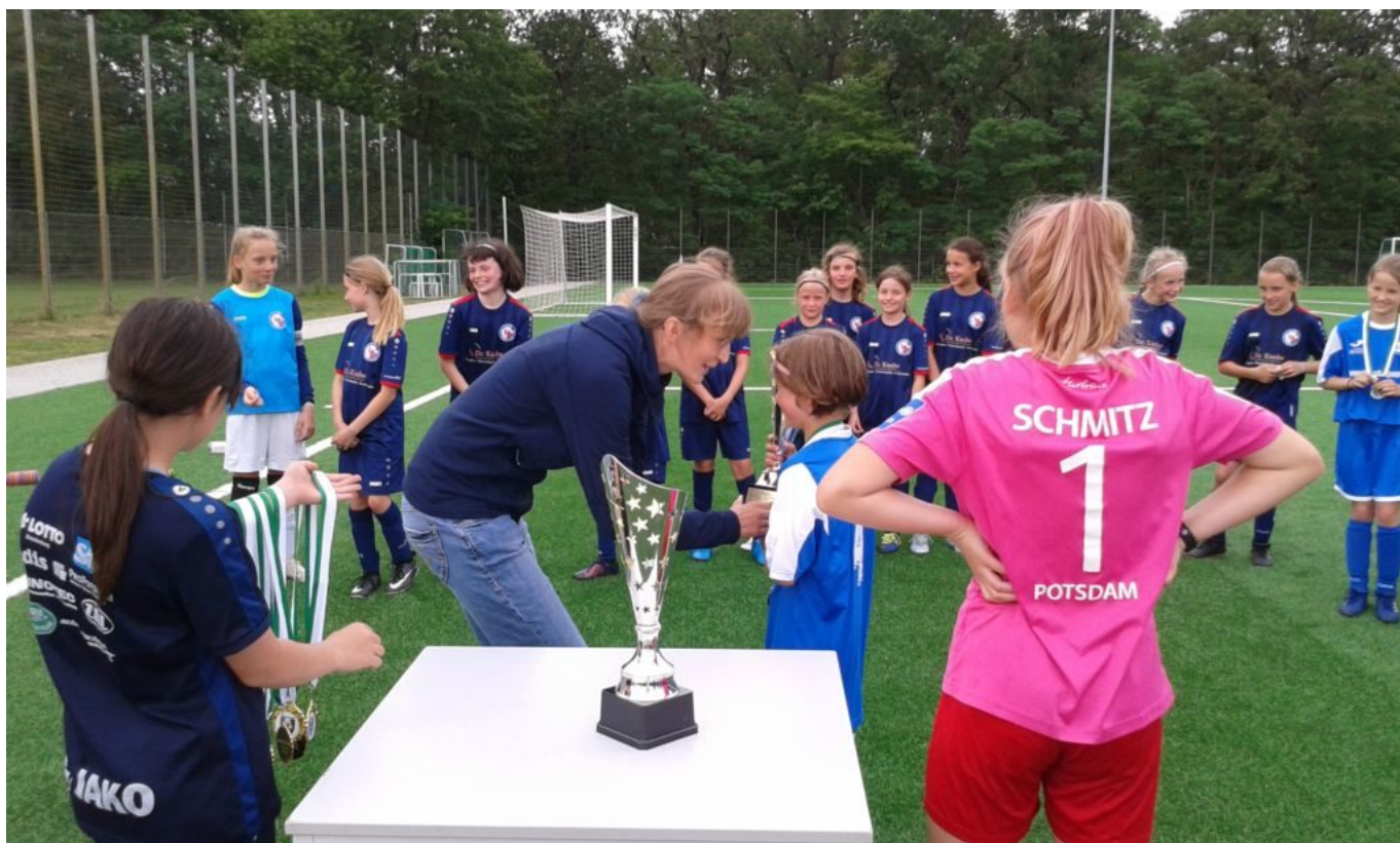
Auch die Unterlegenen bekommen eine Auszeichnung

Ich möchte auch an dieser Stelle die unterlegene Mannschaft, dem RSV Eintracht 1949, zum 2. Platz gratulieren. Sie haben zwar verloren, aber auch gut mitgehalten und hervorragend gekämpft und den kleinen Pokal + Medaillen geholt. Herzlichen Glückwunsch.