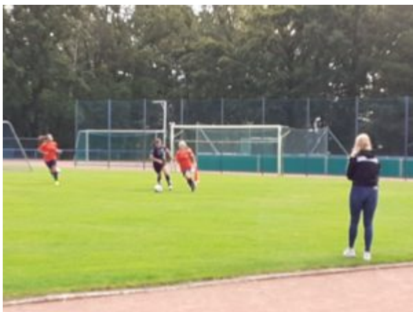
„Leg‘ dich nicht mit Jojo an !“