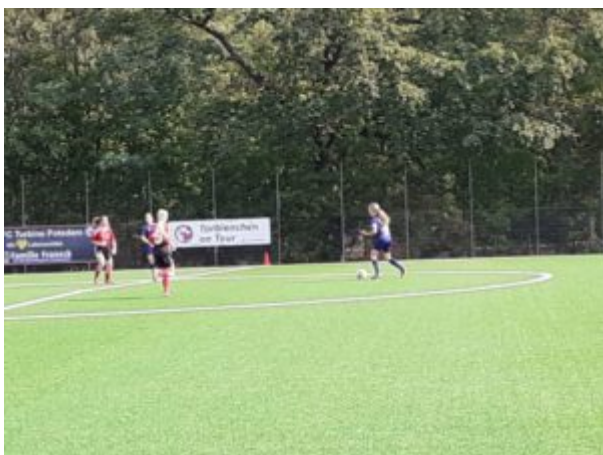
Jojo „kommt doch her, wenn ihr euch traut !“