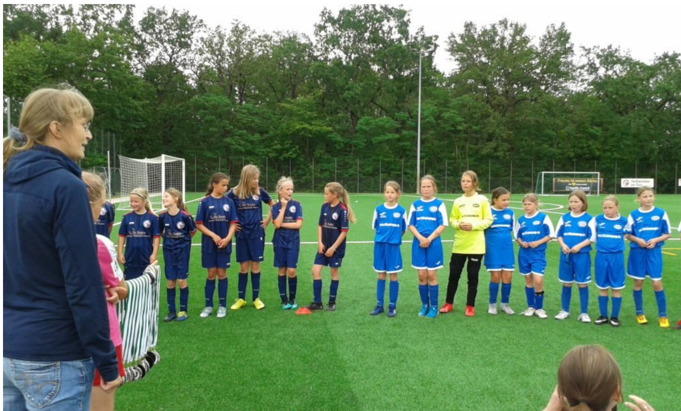
Warten auf Godot, ääh den Pokal