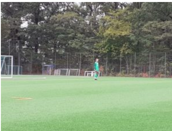
Amy: „Hier stehe ich! Ich kann nicht anders! Gott helfe mir! Amen!“

Eine Szene ist noch zu erwähnen: der RSV blieb immer am Ball und versuchte seinerseits, zum Erfolg zu kommen. Aber zum Einen wusste unsere Abwehr Das zu verhindern, und zum Anderen hatte der RSV auch Pech: einmal kamen sie doch durch. Ihr Schuß knallte an den rechten Pfosten, trudelte an den Linken und zurück ins Feld. Aber wär's ein Tor geworden, hätte es nicht gezählt - der Schuß kam aus dem Abseits. Da nicht mehr Viel passierte, endete das Spiel mit dem 3:0-Sieg für unsere Turbinen.