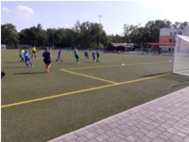
Emma (links) geht dazwischen