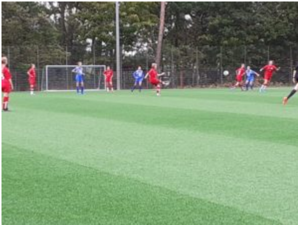
Franzi beim Freistoß