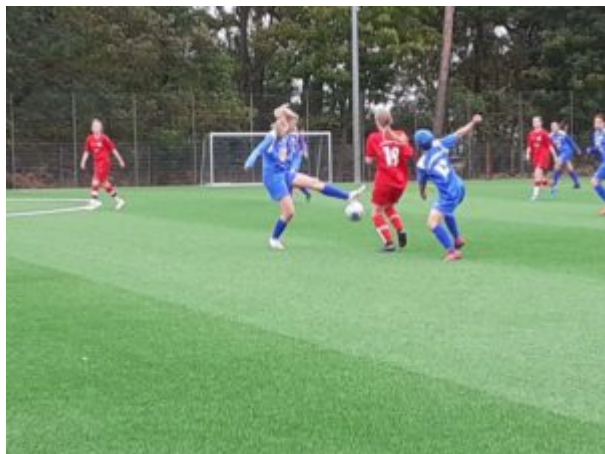
Jetzt machen sie Ballett