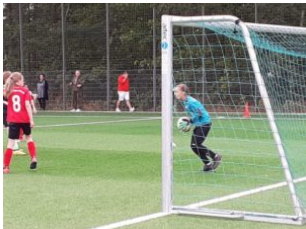
Malli hat ihn sicher !