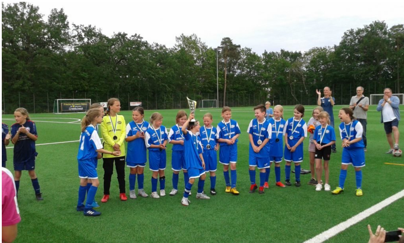
Auch die RSV-Mädels können noch lachen