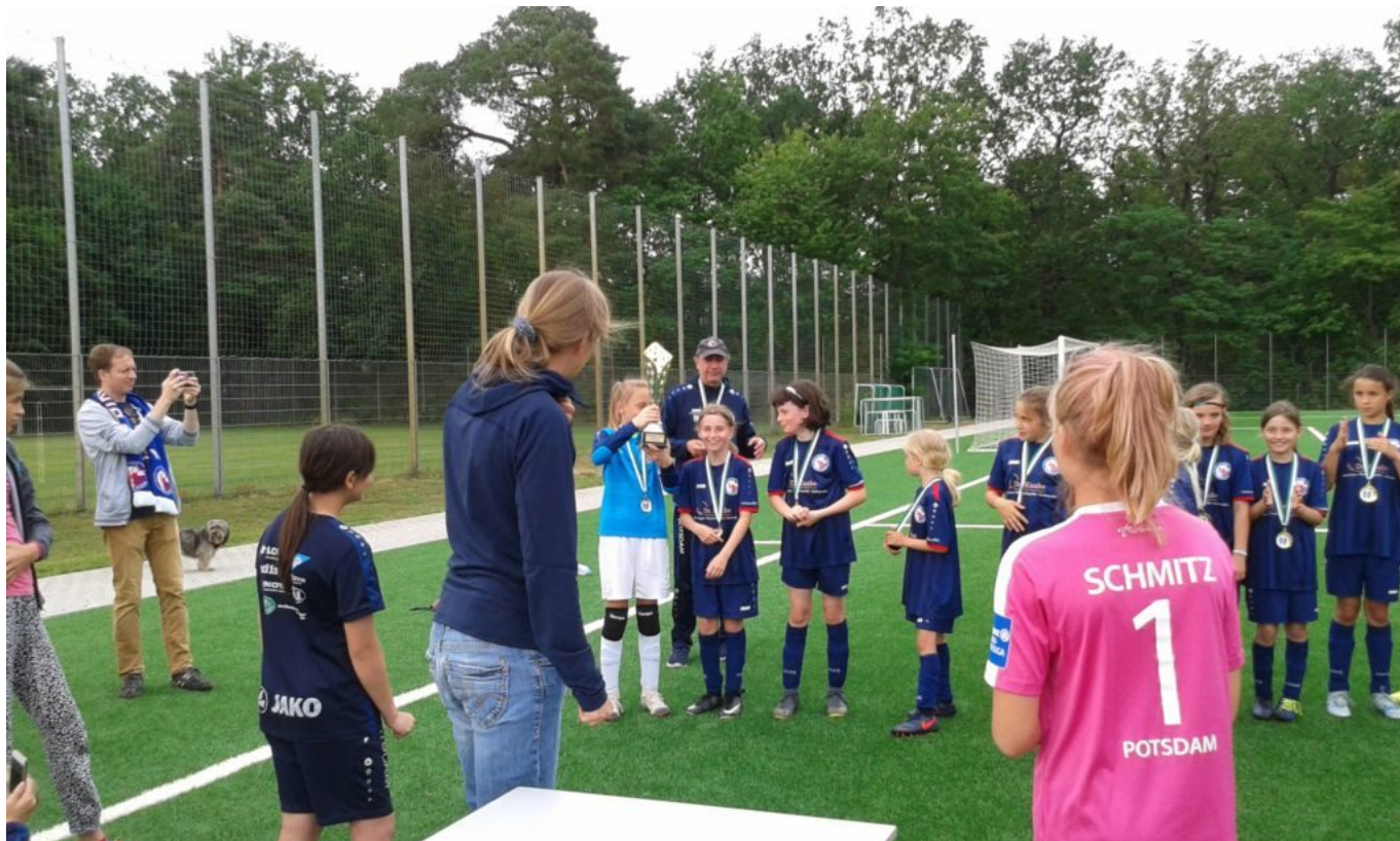
Schaut her, ich hab den Pokal

Ich möchte auch an dieser Stelle die unterlegene Mannschaft, dem RSV Eintracht 1949, zum 2. Platz gratulieren. Sie haben zwar verloren, aber auch gut mitgehalten und hervorragend gekämpft und den kleinen Pokal + Medaillen geholt. Herzlichen Glückwunsch.