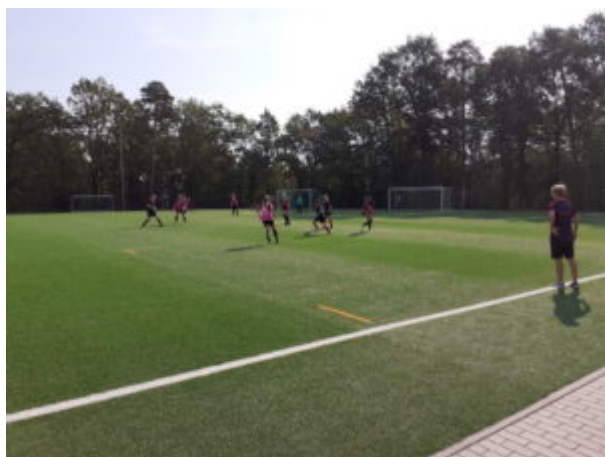
Elli nimmt Fahrt auf