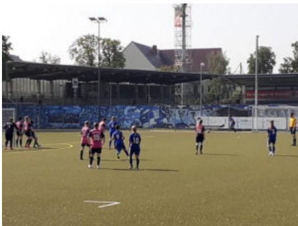
In Erwartung einer Ecke