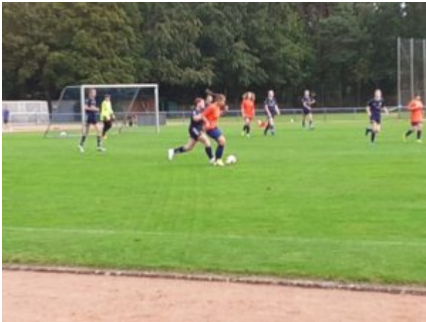
Ball, Medi, Gegnerin