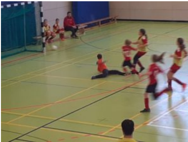
Uii, das war knapp