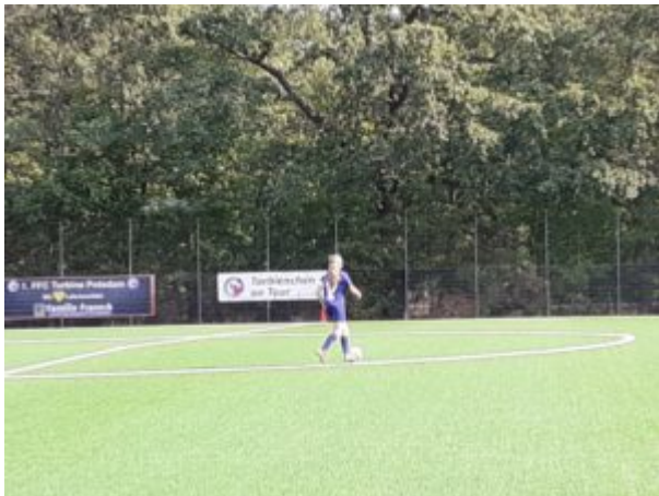
Jojo allein zu Haus