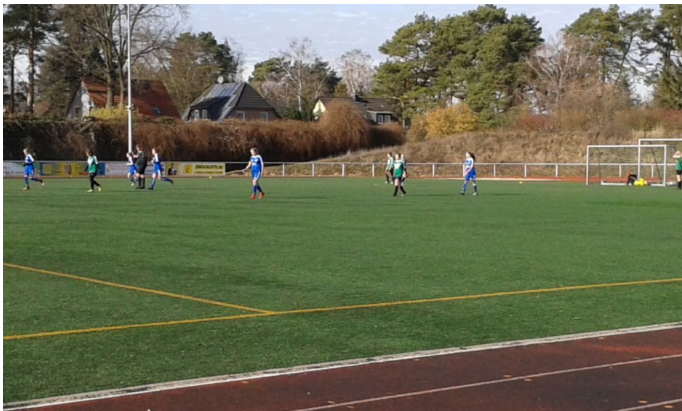
Schon wieder 'n Tor