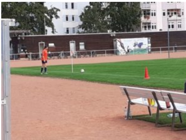
Aimie beim Eckball