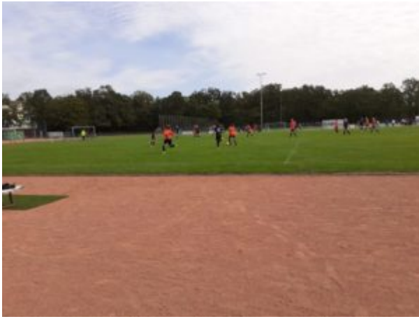
Maxi (3) zieht los.....