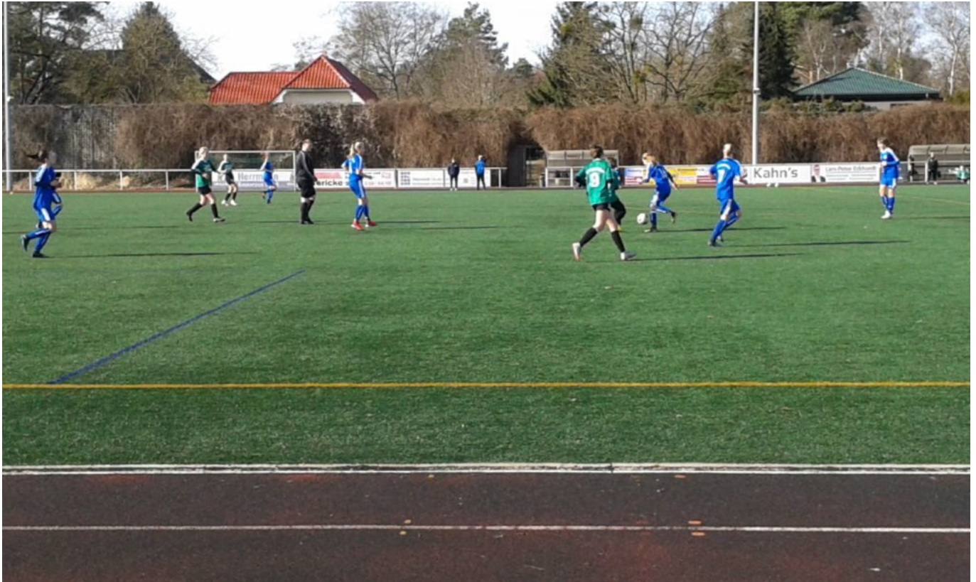
Darleen schließt die Lücke