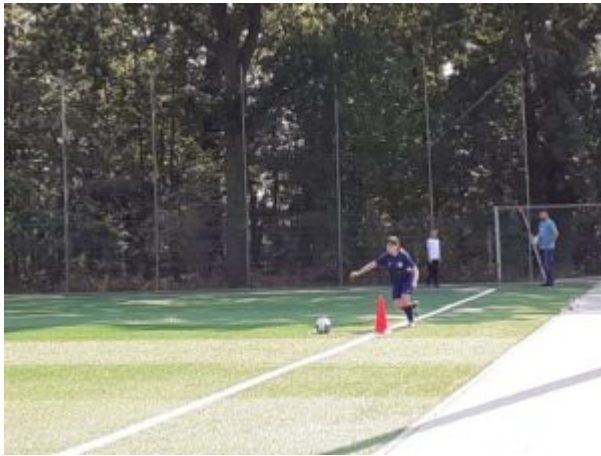
Elli beim Eckball