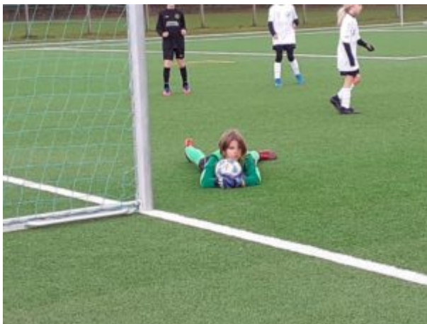
„Ich hab ihn“