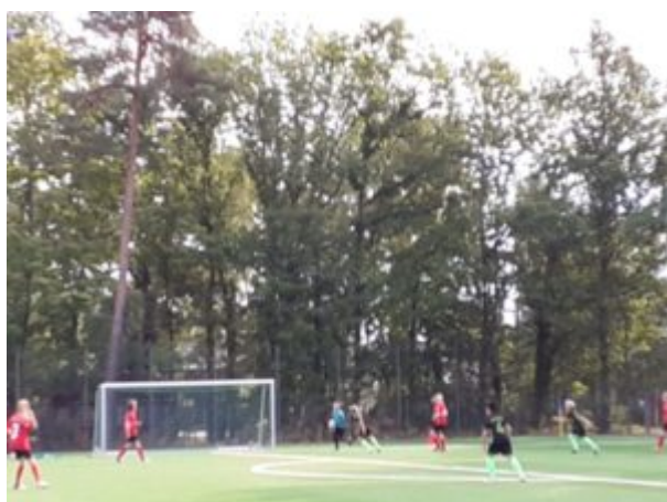
Malli ist schneller am Ball