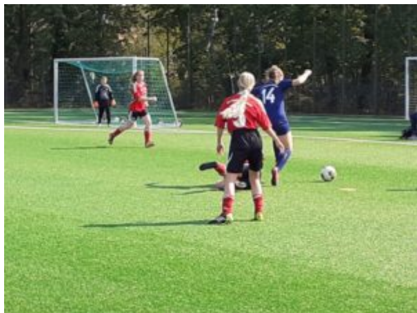
Romy (14) ist nicht zu bremsen