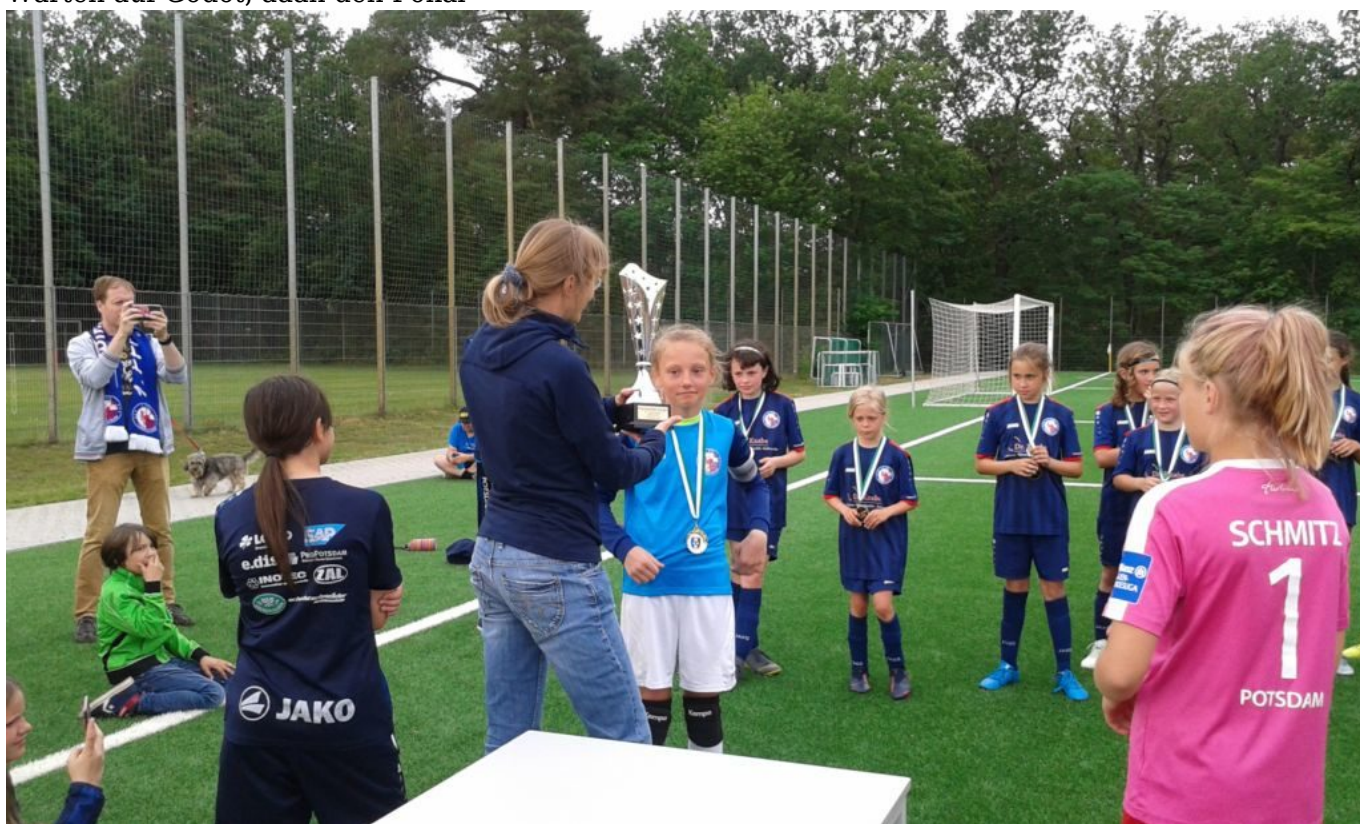
Bei der Pokalübergabe