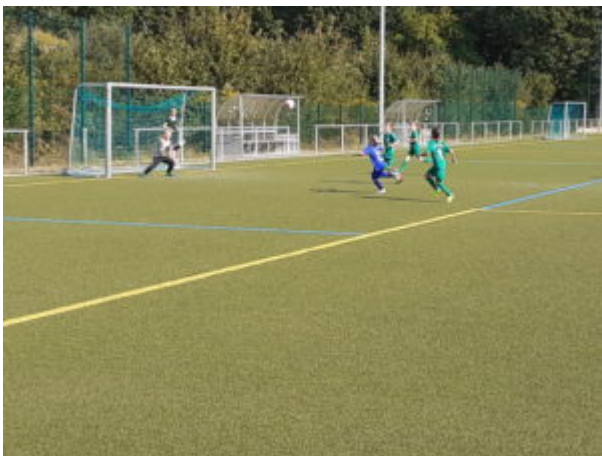
.....und hat gleich noch 'ne Chance