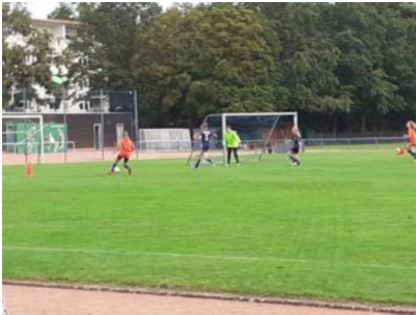
.....und Keiner hält sie auf !!