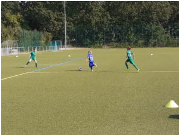
Sari hält Keiner auf !