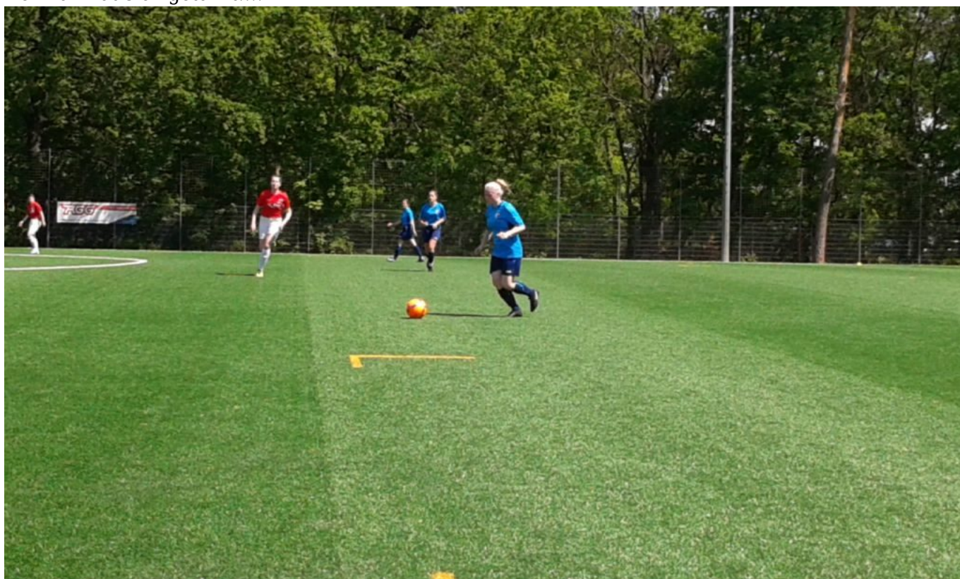
.....da isser ja. Nessi hat ihn gefunden.