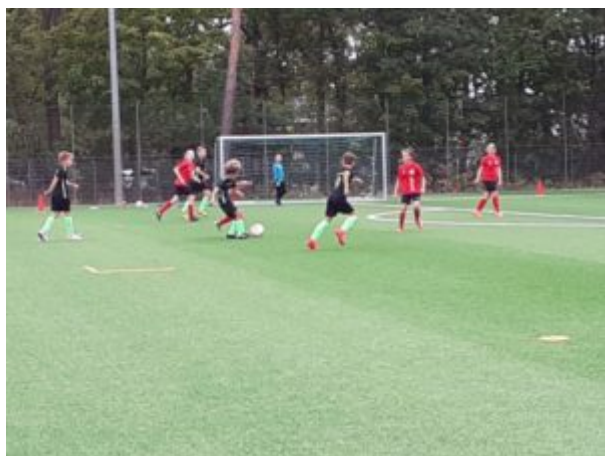
„Krieg‘ ich deine Handynummer ?“