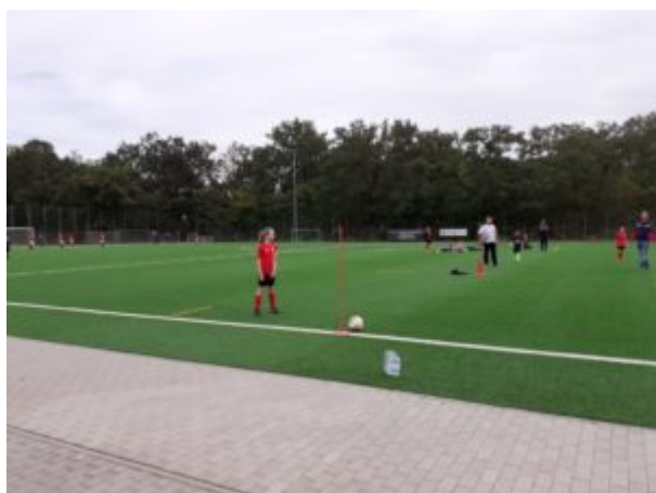
Rieke beim Eckball