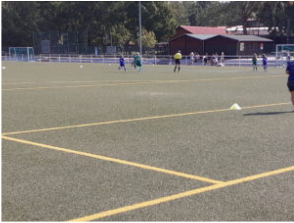
Und los geht's !