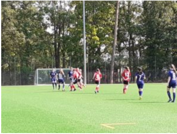
Alle auf einer Linie