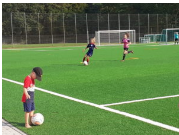
Wieder ist Maxi eher dran