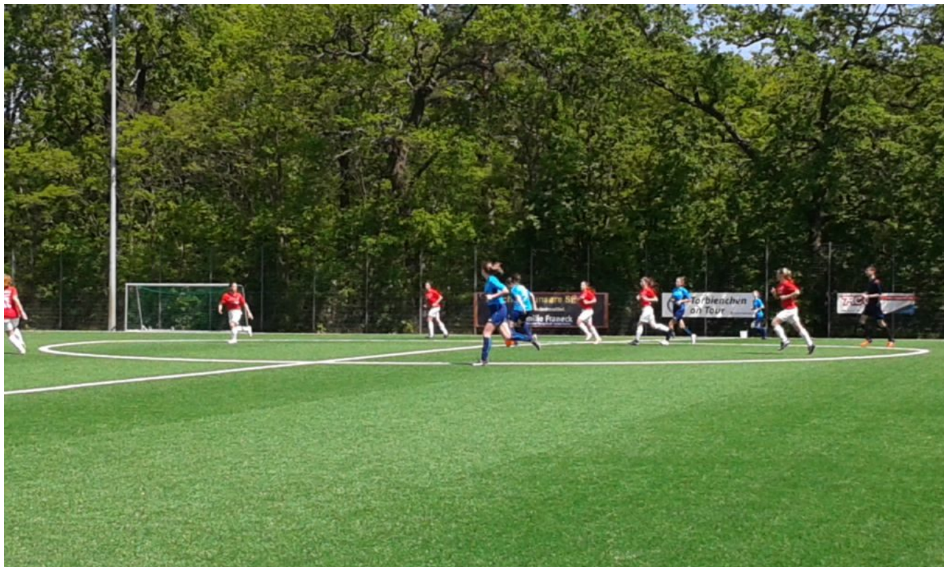
Der Ball hat sich getarnt....