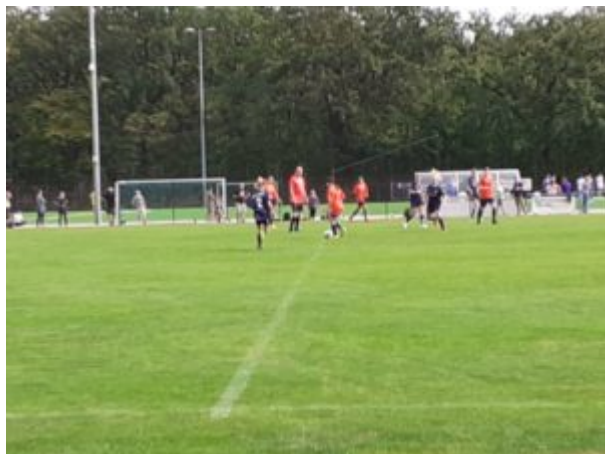
Elli sucht 'n Anspielpunkt