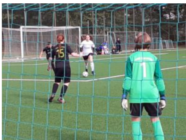
Fritzi mogelt sich nach vorn