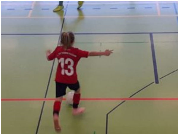
Da geht's lang !

Im vierten Spiel ging es gegen die Jungs von Viktoria 1889 aus Berlin-Lichterfelde. Sie hatten bis dato alle Spiele gewonnen und kein einziges Gegentor kassiert. Es war ein sehr kampfbetontes Spiel beider Mannschaften. Viktoria wollte den Sieg, aber unsere Abwehr hielt stand und brachte die Jungs zur Verzweiflung. Summa sumarum endete dieses spannende Match torlos 0:0.