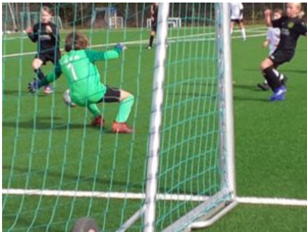
Rumms ! Da schlägt es ein