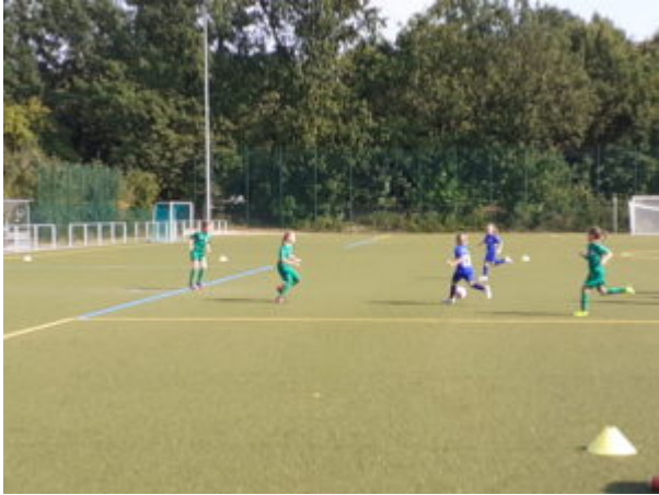
Sari (13) zieht ab.....