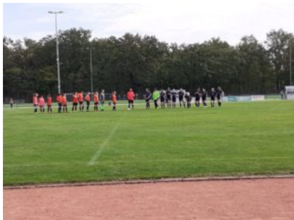
Die Gladiatorinnen wählen die Waffen