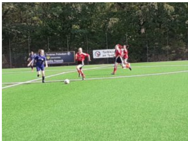
Die Gegnerin kommt zu spät