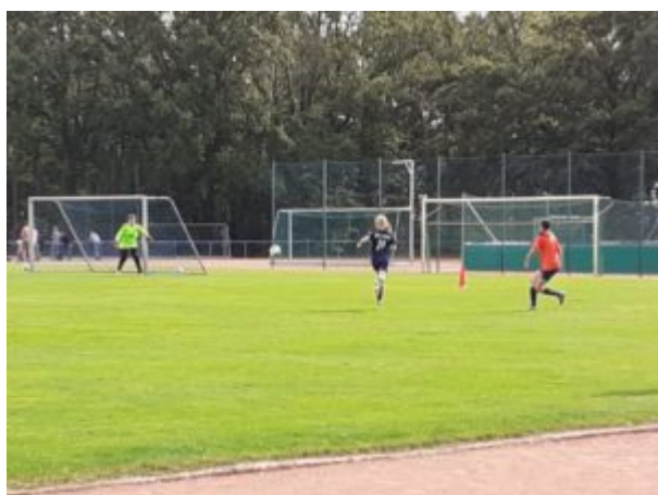
„Na Aimie, wo fliegt der Ball hin ?“