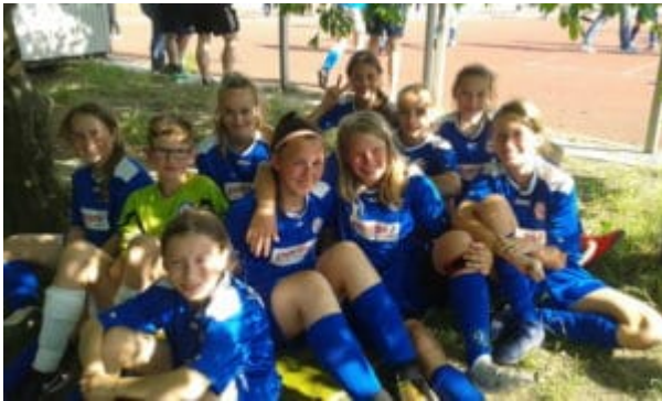
Dieses Foto sagt mehr als 1000 Worte