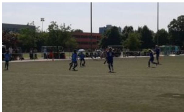
Was führt A.K.(9) im Schilde?