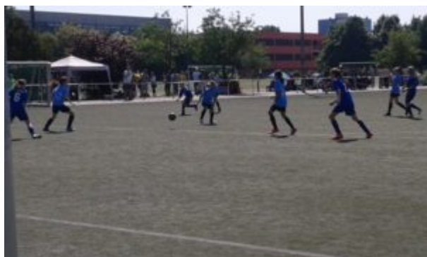
Der Ball schwebt