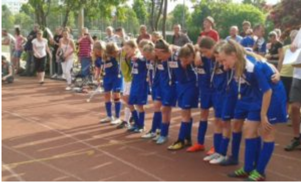
Bei der Siegerehrung „Turbine.....Potsdam“

der Siegerpokal überreicht war, ging das Team sofort zu Helena, um ein vernünftiges Siegerfoto zu machen. So handelt ein Team ! Da hatte dann selbst der Wettergott ein Einsehen. Erst als die Siegerehrung beendet und alle Fotos geschossen waren, schickte er einen kräftigen Gewitterschauer auf die Erde. Das tat aber der guten Laune beim Turbineclan keinen Abbruch.