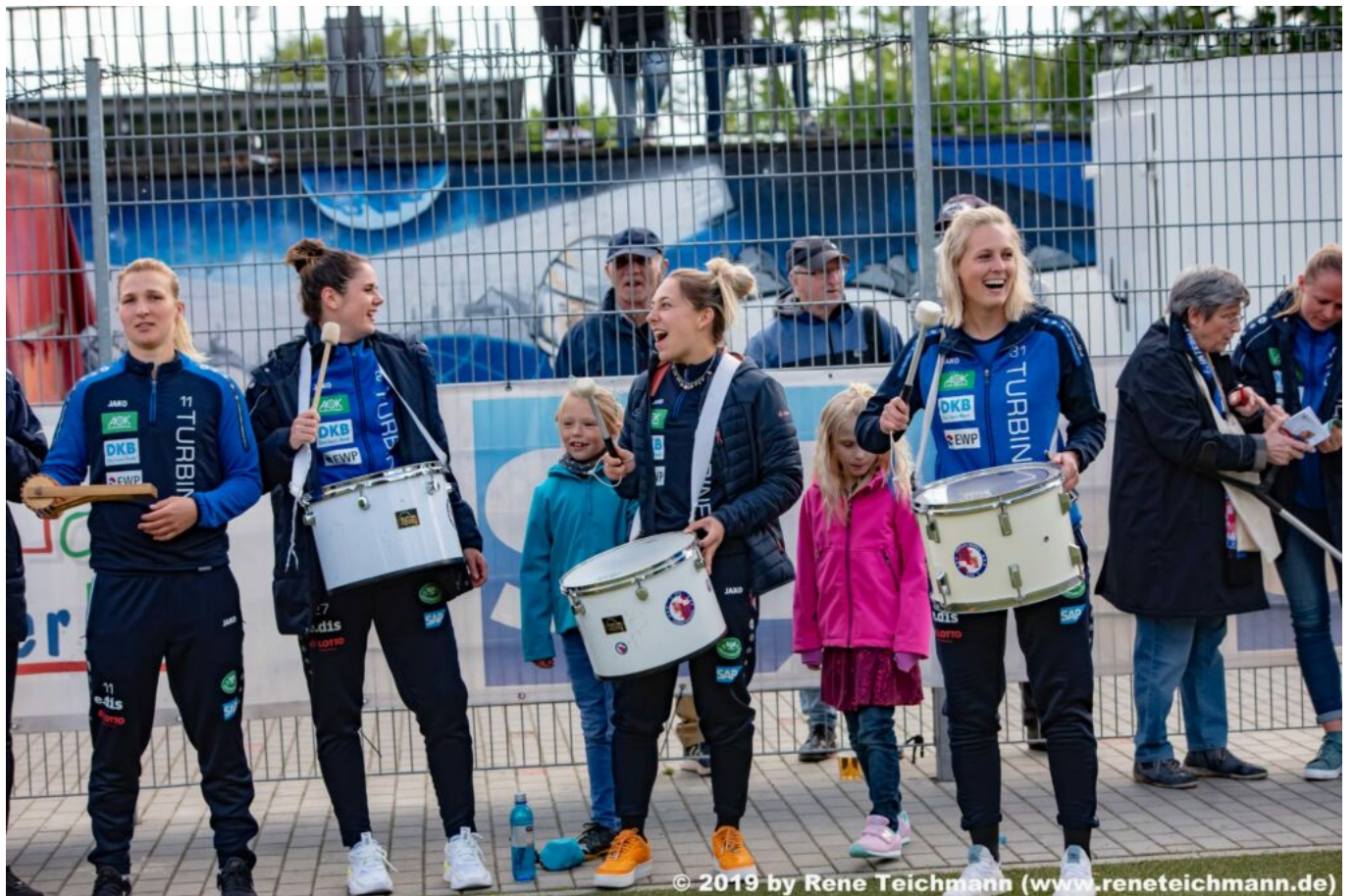
© 2019 by Rene Teichmann (www.reneteichmann.de)