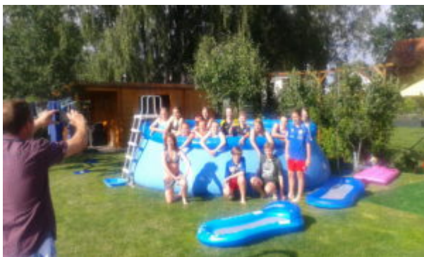
Unsere U13 im und am Pool

Am nächsten Morgen hatte ich noch ein Privileg: das gemeinsame Frühstück mit der Mannschaft und den Eltern ! Welcher Fan erlebt schon so Etwas ? So erfuhr ich viel Wertschätzung für meine Arbeit und konnte meinerseits feststellen, daß unsere U13-Mädels untereinander und auch mit ihren Trainern ein „verschworener Haufen“ sind. So wird der Begriff „Turbinefamilie“ mit Leben erfüllt.