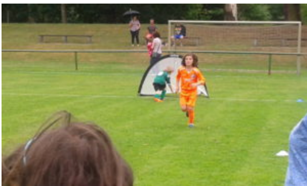
Tor durch Mada