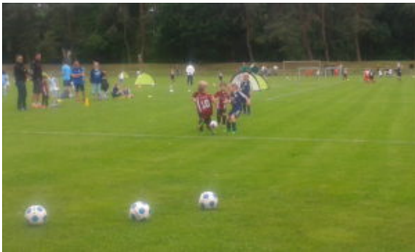
Wenn drei sich streiten.....freut sich die Turbine