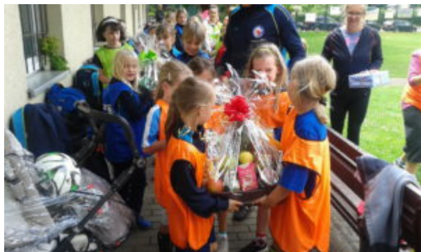
Unsere Grashüpfer sagen Danke.....

Zunächst wollten unsere Grashüpfer ganz lieb „Danke“ sagen.