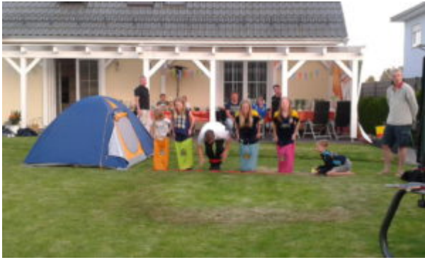
Einmal hin und zurück