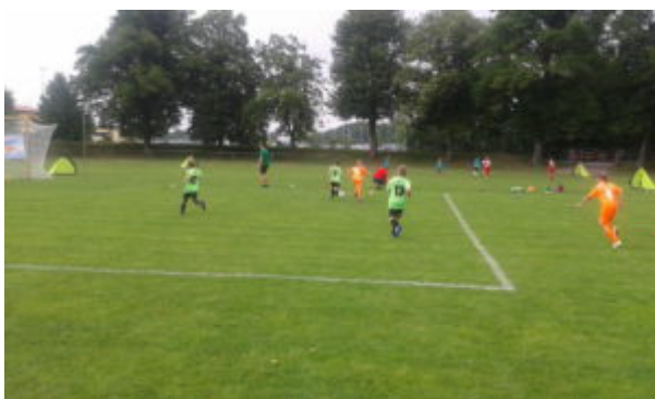
Fine im Zweikampf