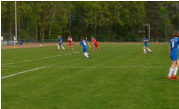
Die Gäste greifen an

Hier und da gab es dann aber auch Szenen, wo man merkte, daß die Spannung doch etwas nachließ und ein bisschen die Konzentration fehlte. So in der 12. Minute, als der SSC eine schönen Angriff bei zu wenig Gegenwehr zum 1:2-Anschluß nutzte.