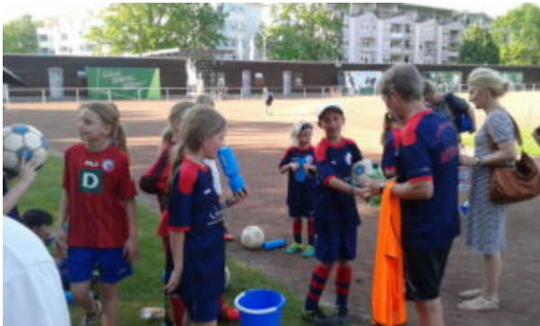
Danke für deinen Einsatz