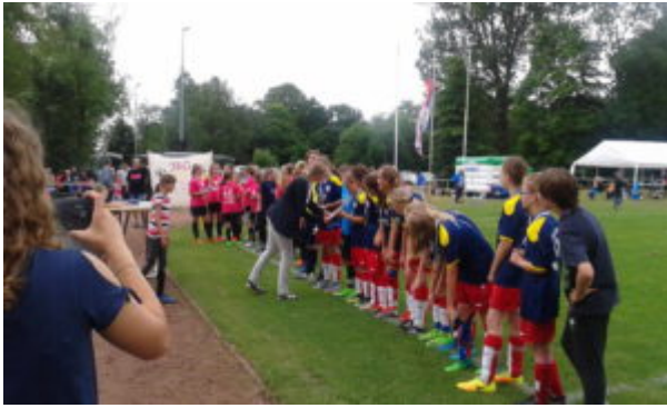
.....und die Schale (ein Wanderpokal)