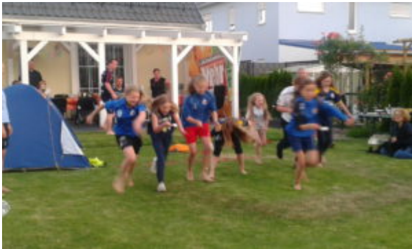
Eierlaufen - immer sehr beliebt

Die „Großen“ durften natürlich mitmachen, aber auch zum Abchillen war Gelegenheit.