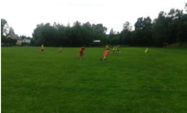
Jetzt wird gespielt