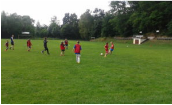
„Den Großen zeigen wir’s“