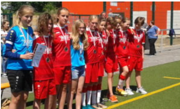
Bei der Siegerehrung

Noch einmal ging's gegen Glienicke-Nordbahn. Eine minimale Chance blieb unseren Mädels noch - aber dazu benötigten sie erst einmal einen hohen Sieg. Nun ja, bis hierher hatten sie in drei Spielen nicht getroffen, so hielt sich mein Optimismus in Grenzen. Aber wie ich es in dieser Saison schon öfter erlebte: wenn das Turnier praktisch gelaufen war, zeigten sie plötzlich, was sie können. Sie ließen die Gegnerinnen kaum zur Entfaltung kommen, zumal bei Diesen auch die Kräfte nachließen. Aber sie wehrten sich nach Kräften und hatten eine klasse Keeperin. Die 3. Minute: Fefe zieht ab. Nach einer klasse Parade kommt der Ball zu Mary, deren Schuß die Keeperin zur Ecke lenkte. Lya brachte die Ecke zu Mary - und es stand 1:0. Zwei Minuten später trat Lya erneut eine Ecke. Die kam scharf hinein und dabei unterlief den Gegnerinnen ein Eigentor - 2:0. Unsere Mädels drückten weiter und die Glienicker Keeperin konnte sich mehrfach auszeichnen. In der 11. aber kam der Ball aus der Zentrale quer nach rechts zu Jona, die mit einem strammen Schuß auf 3:0 erhöhte. Den Endstand stellte Lya in der Schlußminute (15.) her. Sie setzte ein Solo an und zog ab - 4:0. Das war erstmal erledigt. Da aber der 1. FV Wandlitz/Basdorf sein Spiel gegen Glienicke mit 3:0 gewann, wurden die Gastgeberinnen Landespokalsieger. Dazu herzlichen Glückwunsch !