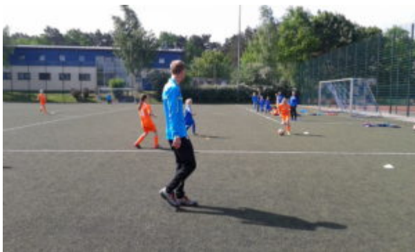
Leo geht ab