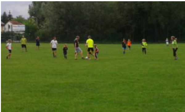
Alle auf einmal

Aber es gab auch andere Beschäftigungsmöglichkeiten.