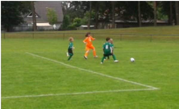
Piri zieht ab „Oooch, die kann ja schießen“