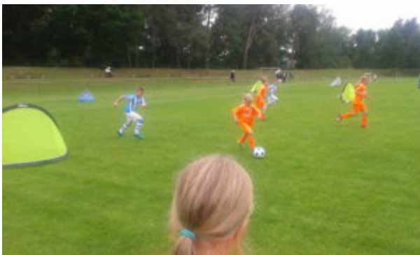
Leni zieht los