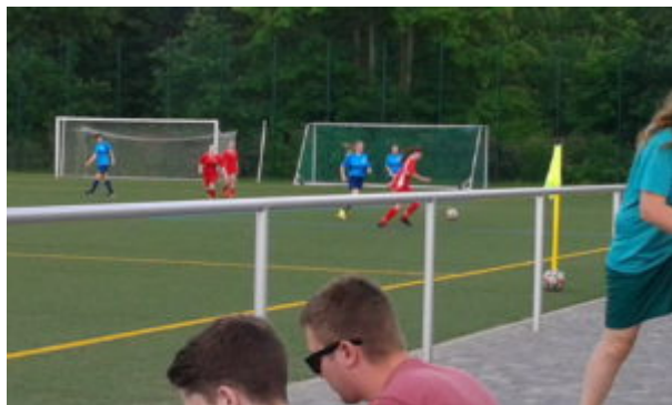
„Hier kommst Du nicht vorbei“