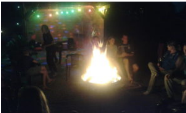
Gemütlichkeit am Lagerfeuer