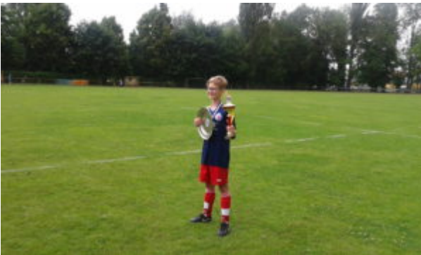
.....Mathi (in Frankfurt/Main geboren - mit Turbine Triplesieger ! Äätsch !!!).....