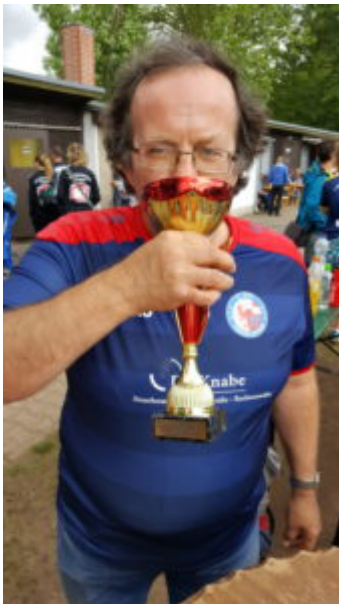
Auch an mir ging der Kelch nicht vorüber. Prost !

Dann gab's doch noch das komplette Siegerfoto und irgendwann war es Zeit, loszufahren. Ach, ich hätte mit den Mädels gern noch weitergefeiert, aber ich wurde ja in Töplitz von unseren Grashüpfen erwartet.