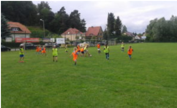
„Wir gegen Uns“