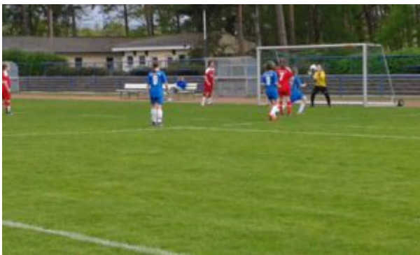
Diesmal hat sie Ihn

Aber unsere Turbinen schluckten diese Pille, denn schon im Gegenzug stellte Pani die Gästekeeperin auf die Probe.