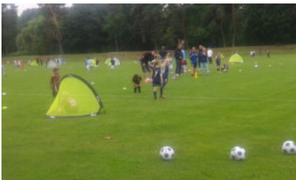
Und wieder 'n Tor (Maali Nr. 7)