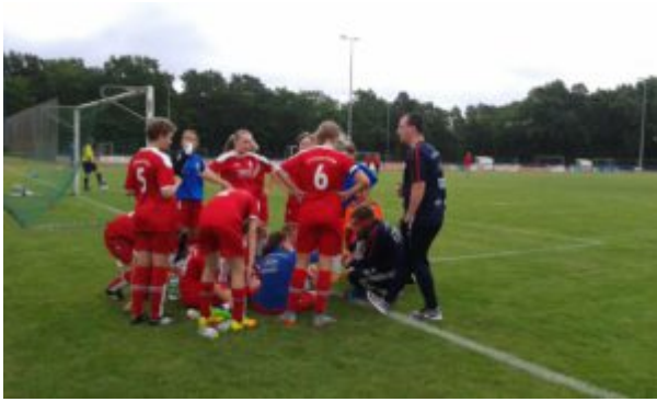
Besprechung vor dem Anpfiff

Zwar war am Treffpunkt zunächst noch das Landespokalturnier in Wandlitz das Gesprächsthema. Es wurde aber als bald von einer Nachricht abgelöst, welche das ganze Wochenende für Lacher sorgte und mich auf obige Überschrift brachte. Aber dazu später Mehr.