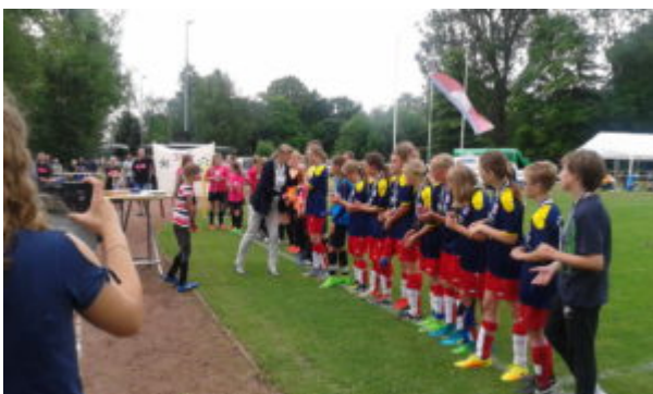
.....Den Pokal (dürfen die Mädels behalten).....