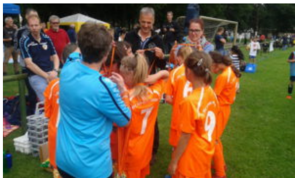
Zur Erinnerung 'ne Medaille