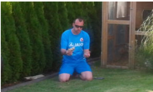
„Essen und Beten gleichzeitig?“ .....und das im Ramadan (grins)

Ich für meinen Teil konnte nicht nur mit den Mädels feiern, sondern hatte auch ausgiebig Gelegenheit, bei manch gutem Tropfen mit den Eltern und Trainern über Allerlei zu quatschen. Natürlich war auch hier jene ominöse Trainerentlassung in Spanien (s. „Wenn selbst ein vergebener Strafstoß....“) ein heiteres Thema. Aber Chris erzählte mir auch, warum er manchmal was zu Meckern hat, selbst wenn die Mädels zweistellig gewinnen. Seine Argumente sind voll nachvollziehbar und so kann ich ihn besser verstehen. Auch erfuhr ich das ein oder andere Private.