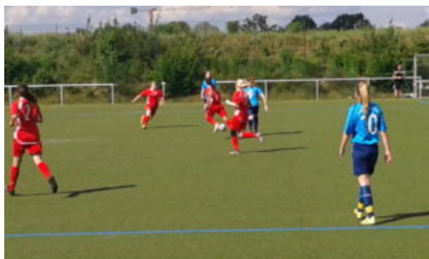
Die Gegner am Ball