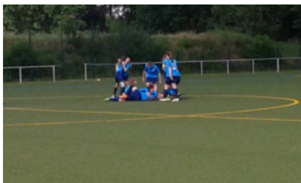
....und Alle auf Eine

Nun hatten sie das Double aus Kreismeisterschaft und Landespokalsieg geschafft. Dazu unseren herzlichsten Glückwunsch, Mädels ! Sie können am 25.6. um 10 Uhr in Jüterbog bei einem Sieg im