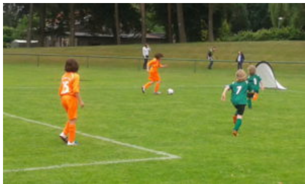
Piri auf dem Weg zum nächsten Tor