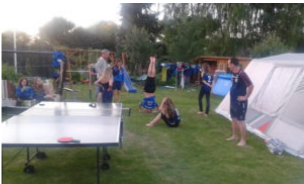
.....und steht Kopf