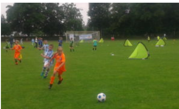
Den Ball im Visier