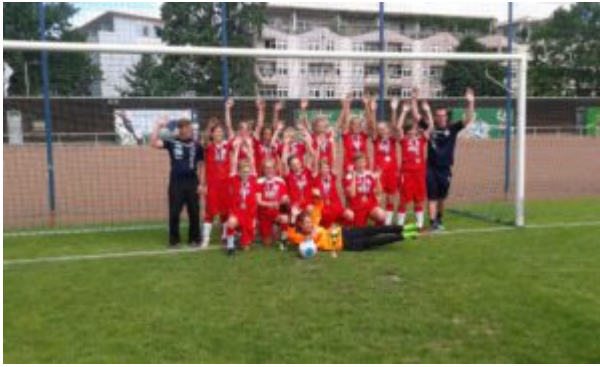
So sehen Meister aus !