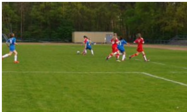
Zweikampf im Mittelfeld

So blieb es bis zur Pause. Einerseits hatte ich das Gefühl, daß trotz des knappen Resultat's hier nix anbrennt. Andererseits machte ich mir doch Gedanken über die kleinen Konzentrationspausen unserer Mädels und den damit verbundenen Nadelstichen, die die Gäste setzen konnten.