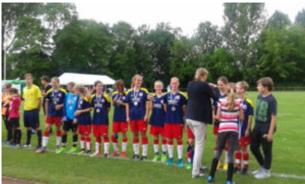
Geschafft, nun gibt's die Medaillen.....