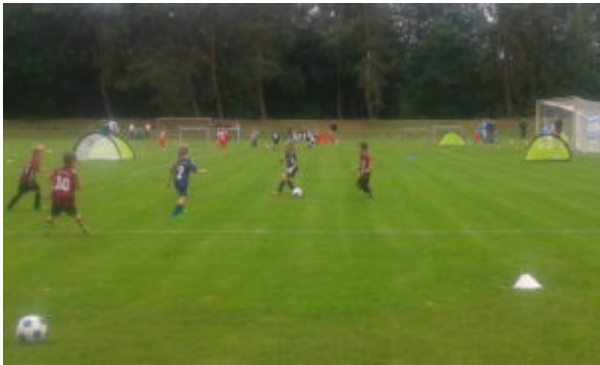
Maali sagt: „Danke für den Ball“