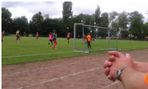
Schade, der ist weg