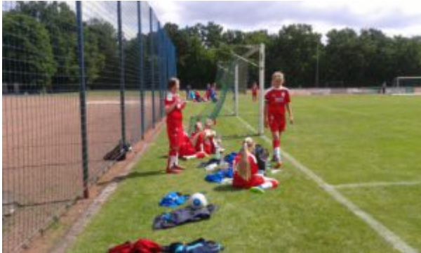
„Voll konzentrierte “ Auswechsellspielerinnen