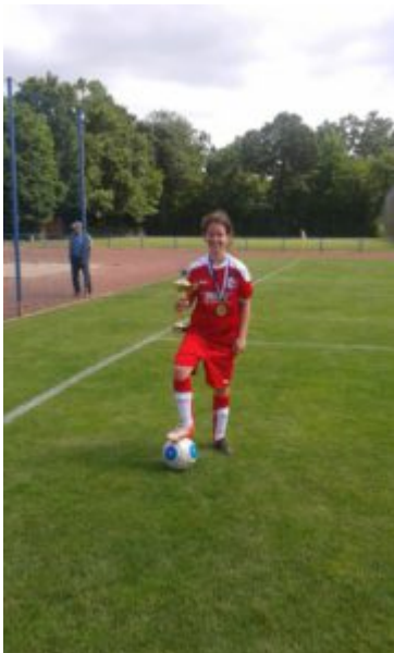
Torequeen Lya (47 Tore)