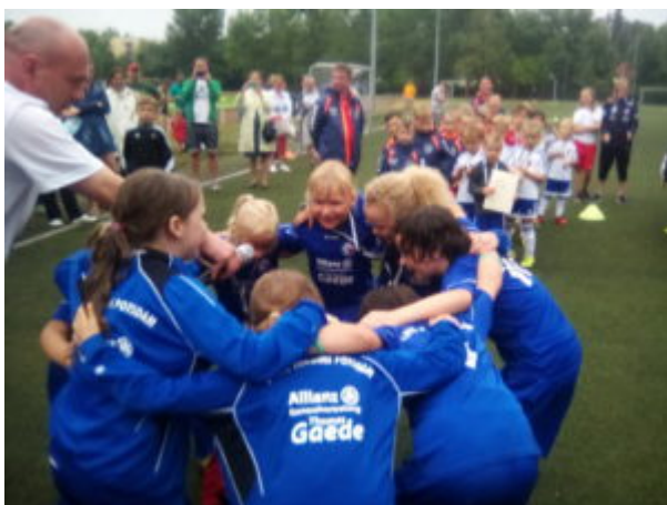
Der berühmte Kreis