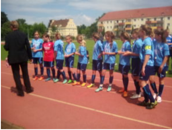
Gut gekämpft Mädels