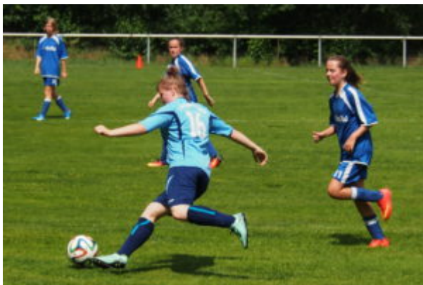
Vanessa nimmt Maß