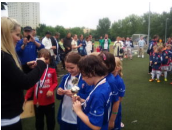
Pokal und Medaille

Dann war auch das Turnier zu Ende und es erfolgte die Siegerehrung: Sieger wurde Hertha 03 Zehlendorf mit 16 Punkten, gefolgt von Turbine Potsdam mit 11 erreichten Punkten. Den 3. Platz belegten die Jungs des Teltower FV 1913 mit 10 erzielten Punkten.