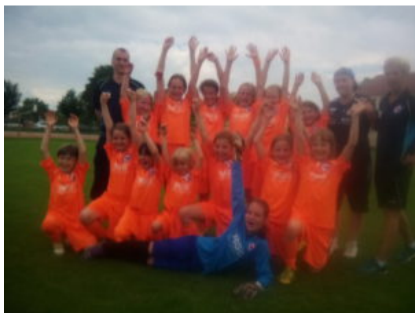
So sehen Sieger aus