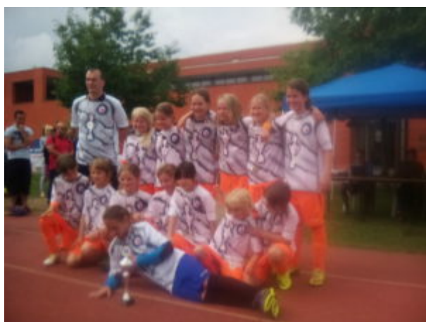
nach der pokalverleihung