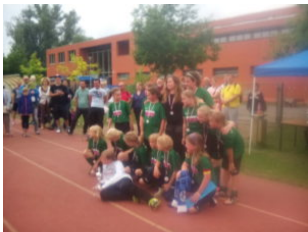
Glückwunsch auch den Unterlegenen