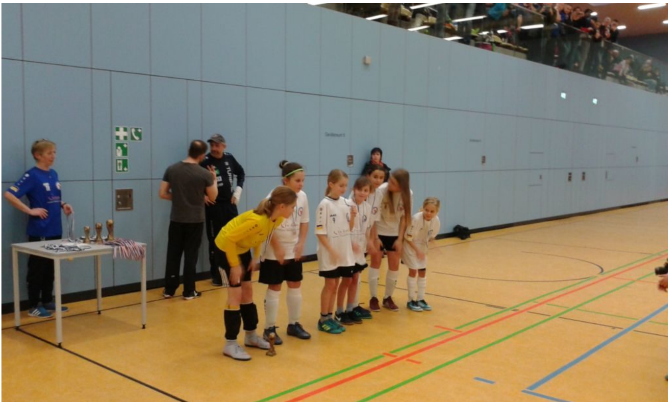
Der Spruch bei der Siegerehrung: die EII....