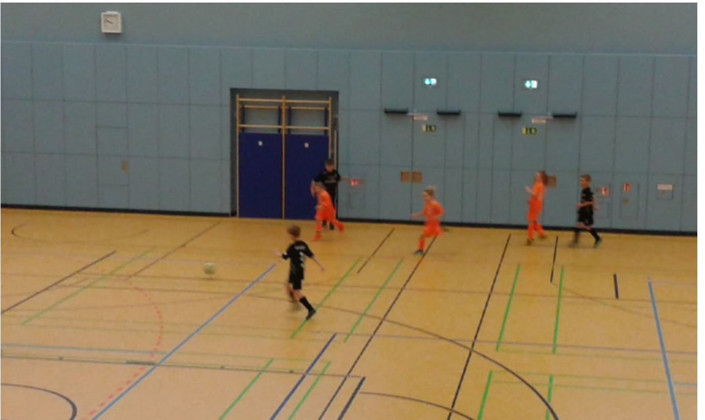
Ein magisches Dreieck