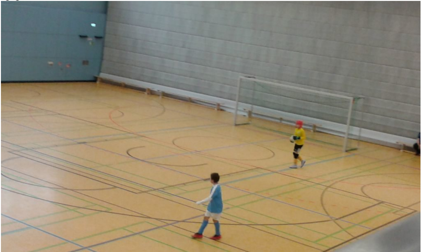
Celine baut neu auf

„gegen Leni hast Du doch eh keine Chance“