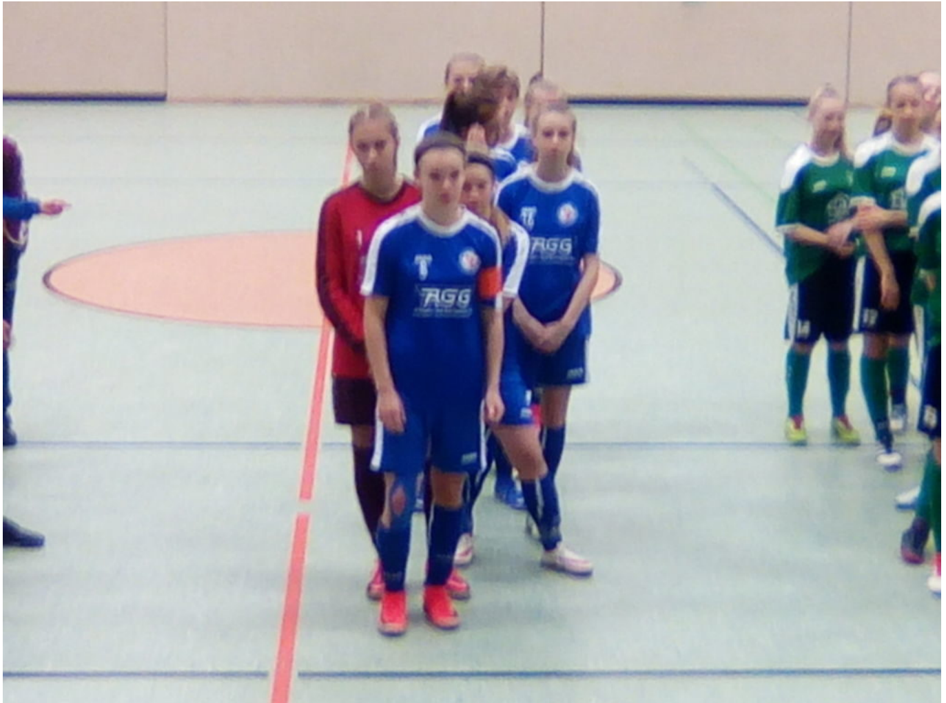
Antreten zum Appell ääh Turnier