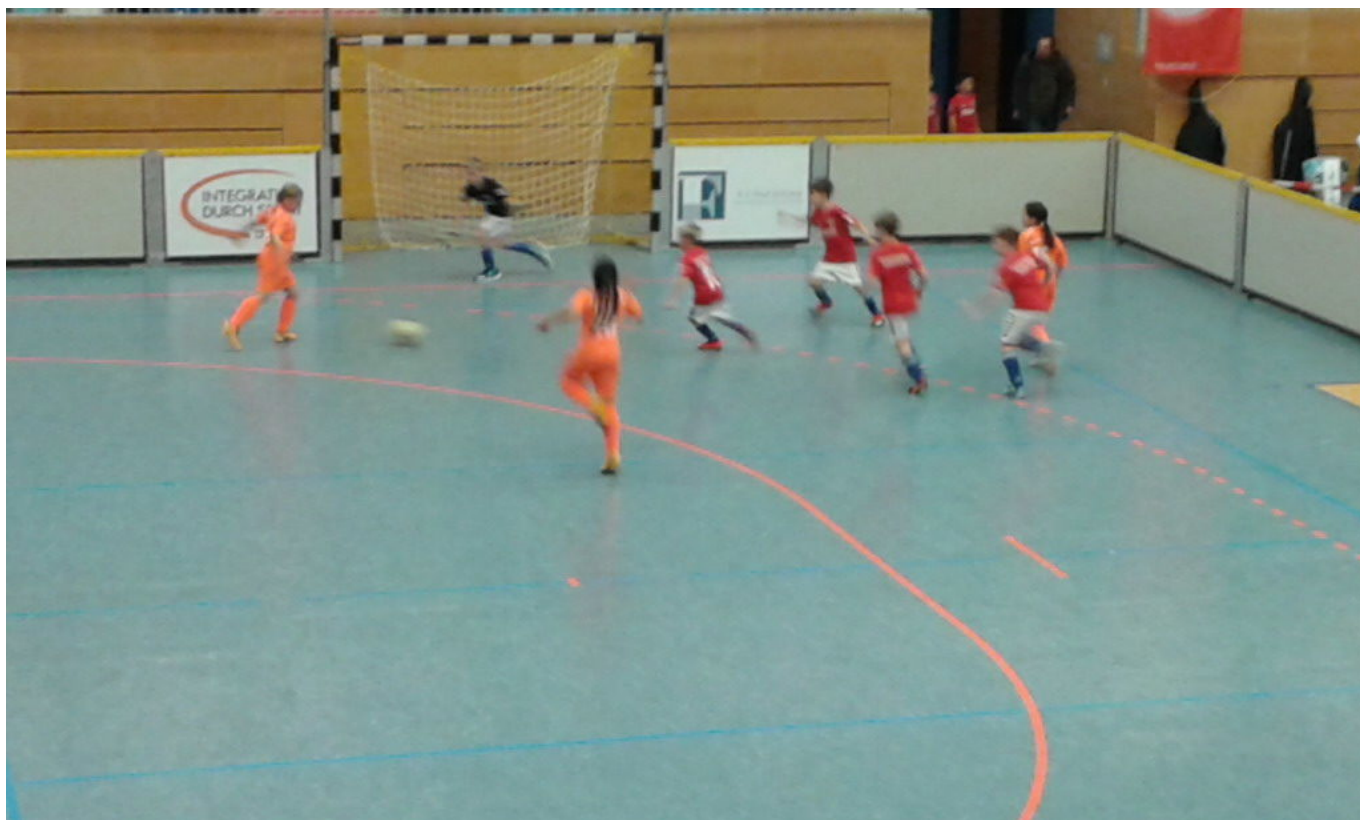
Sieht gut aus, wird aber leider Nix