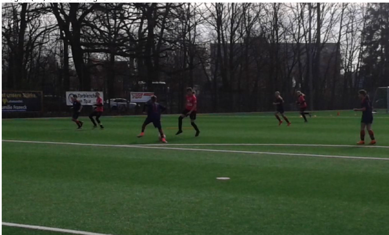
Schon wieder Magda mit „Begleitung“