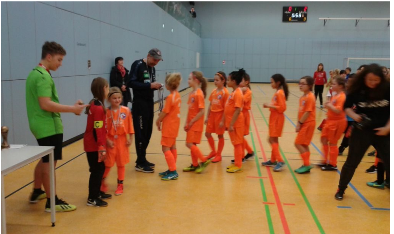
..... und unsere Bambinis.....