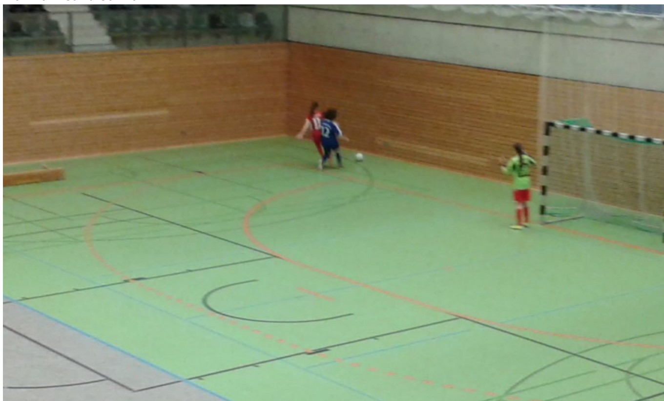
„.....und jetzt ab durch die Wand !“