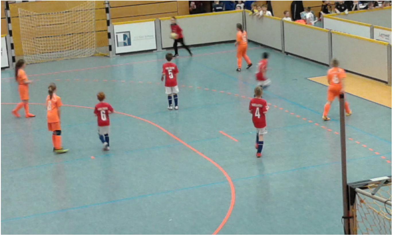
Malli hat Ihn