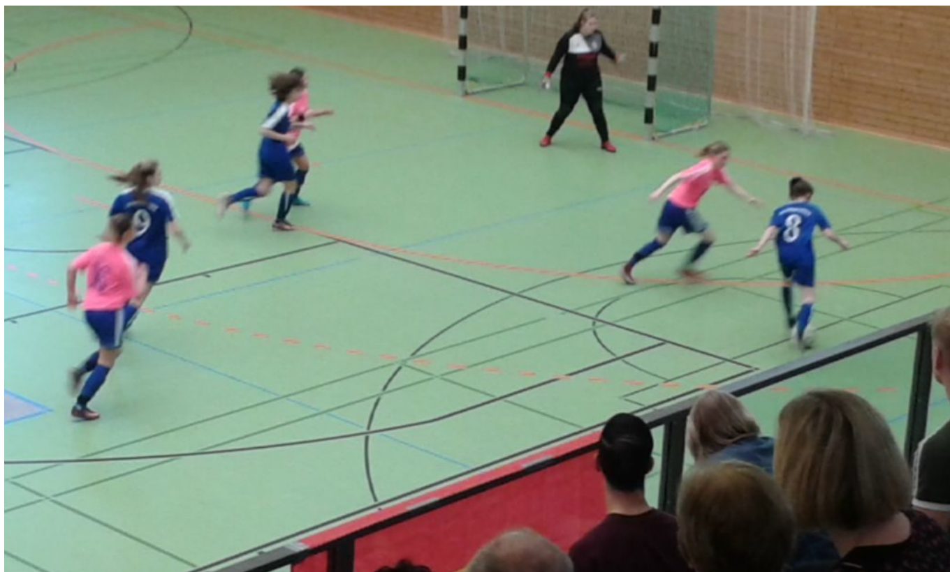
Thea rauscht heran

Der zweite Gegner hieß RB Leipzig. Nach den Männern wird dort auch der Frauen- und Mädchenfußball Stück für Stück nach vorn gebracht. Beide Teams neutralisierten sich weitestgehend. So gab es kaum Torchancen, obwohl unsere Turbinen mehr Zug zum Tor entwickelten. Aber mehr als ein abgeblockter Freistoß in der 8. Minute sprang nicht heraus. So passierte es dann in der Schlußminute, als unsere Mädels bei einem Leipziger Gegenzug nicht aufpassten und das 0:1 kassierten, was dann auch der Endstand war. Bei allem kämpferischen Einsatz unserer Mädels war auch in diesem Spiel die mangelnde Hallenerfahrung zu sehen.