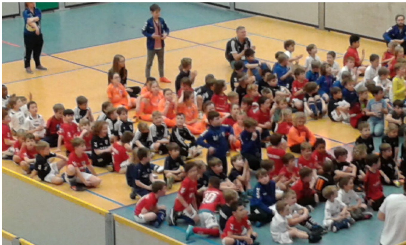
Sitzblockade ? Oder warten auf den Bonbonregen