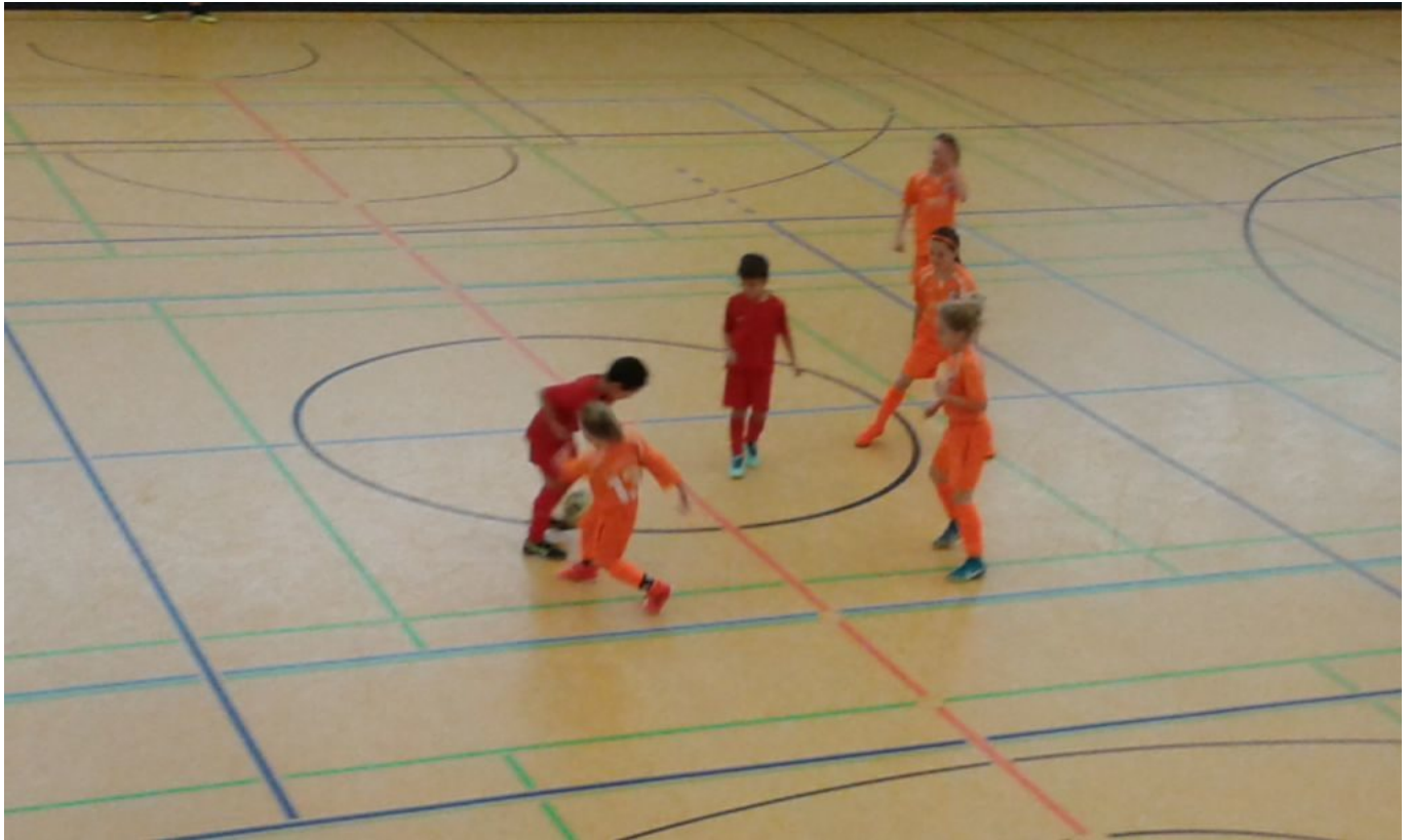
Sari im Zweikampf, vier Andere schauen zu und lernen