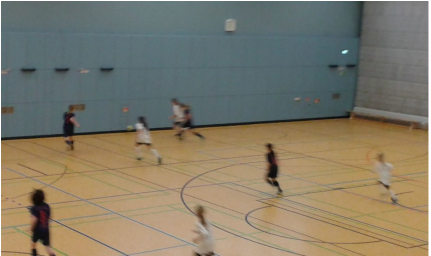
Die Wand spielt mit