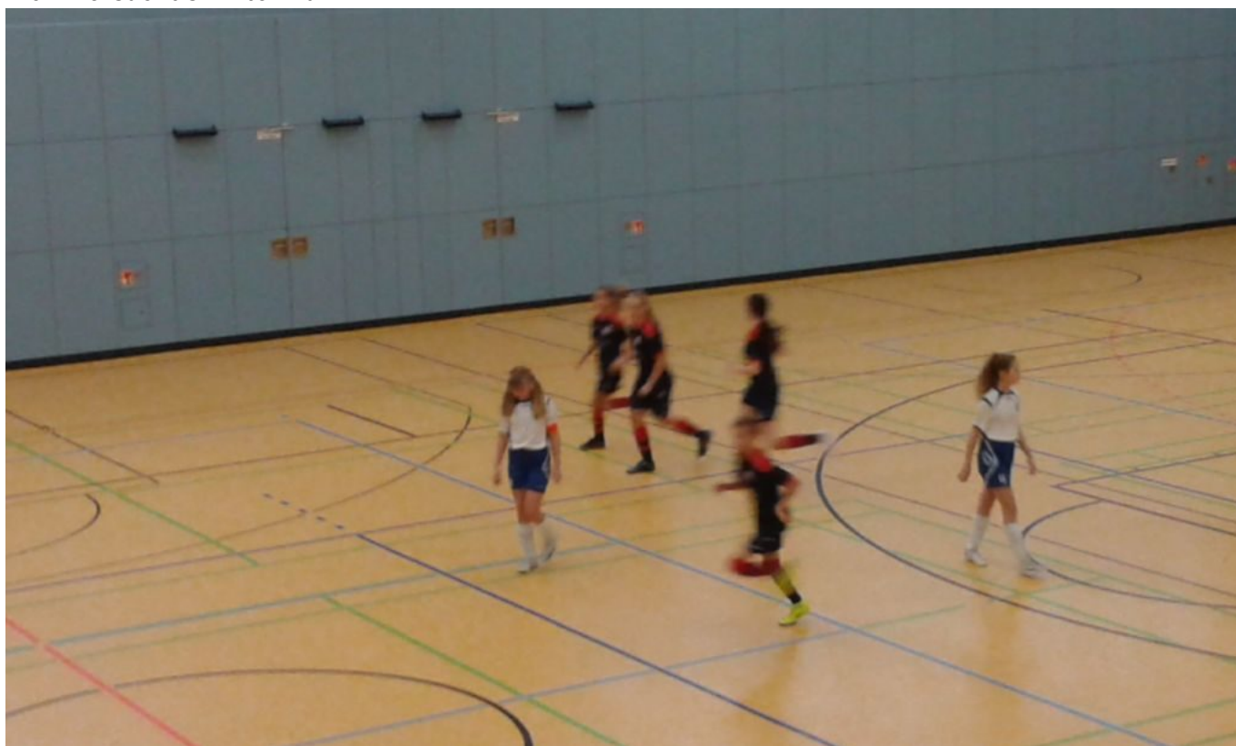
Torjubel bei unseren Turbinen, hängende Köpfe beim SC Staaken