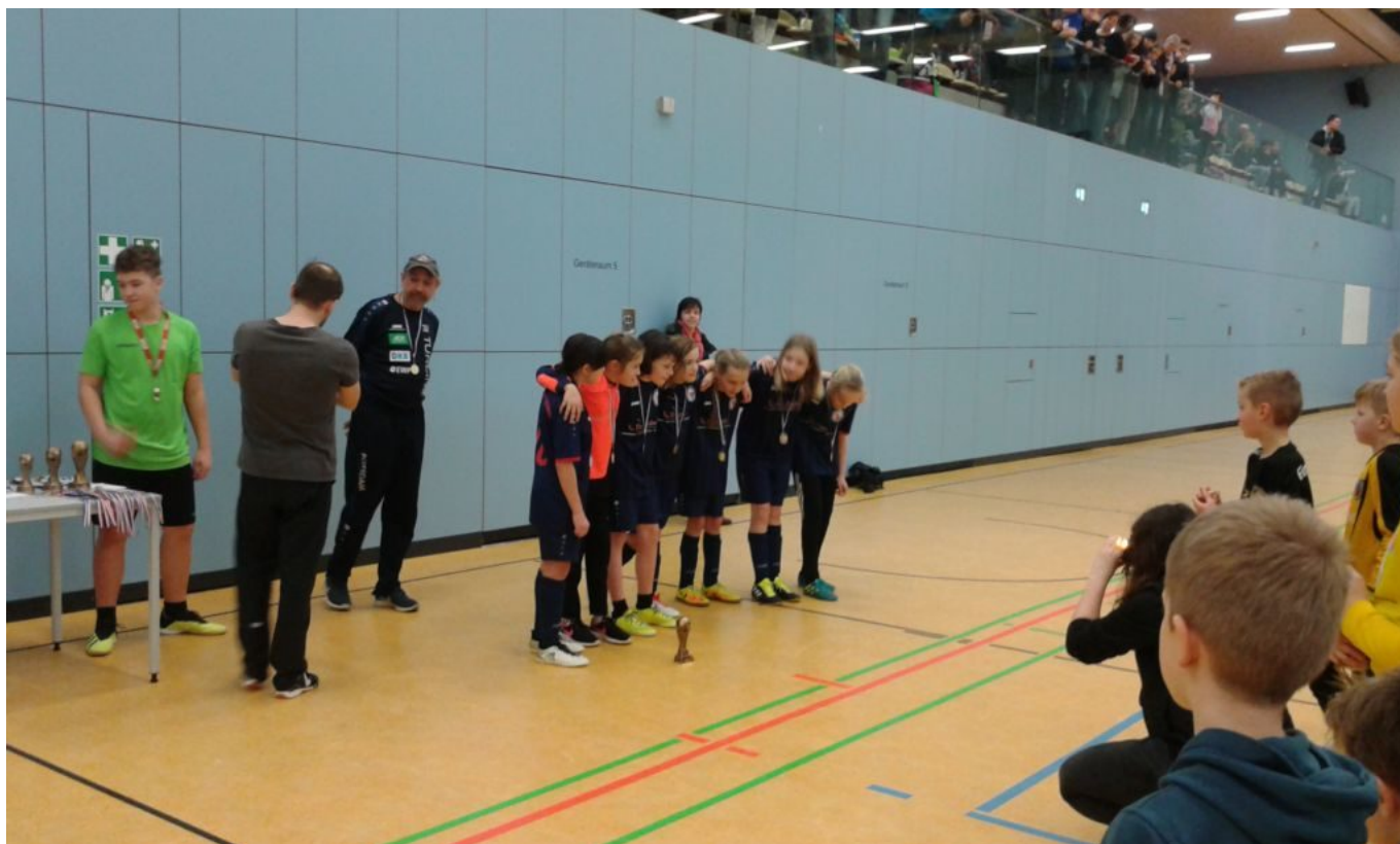
.... die EI.....