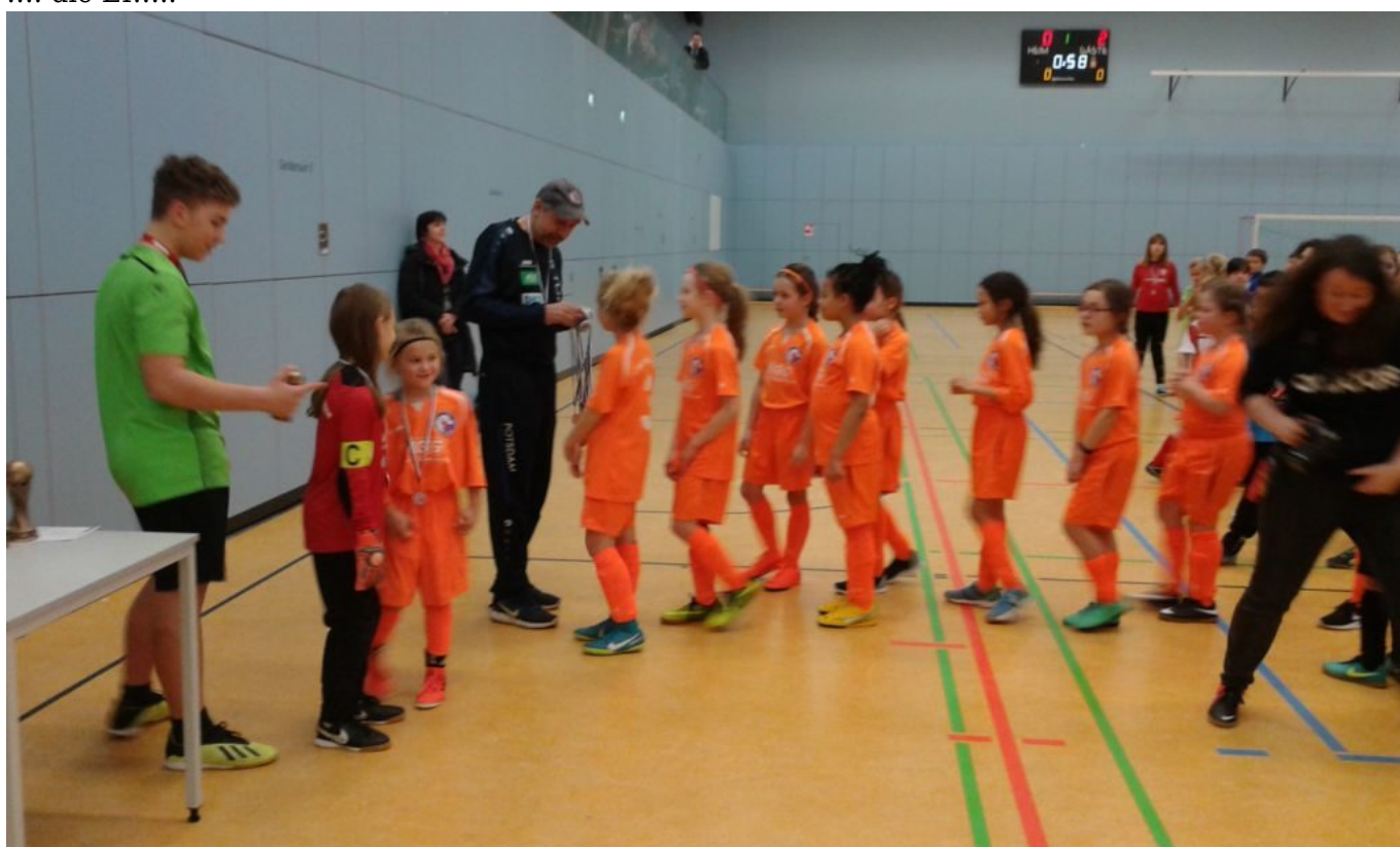
..... und unsere Bambinis.....