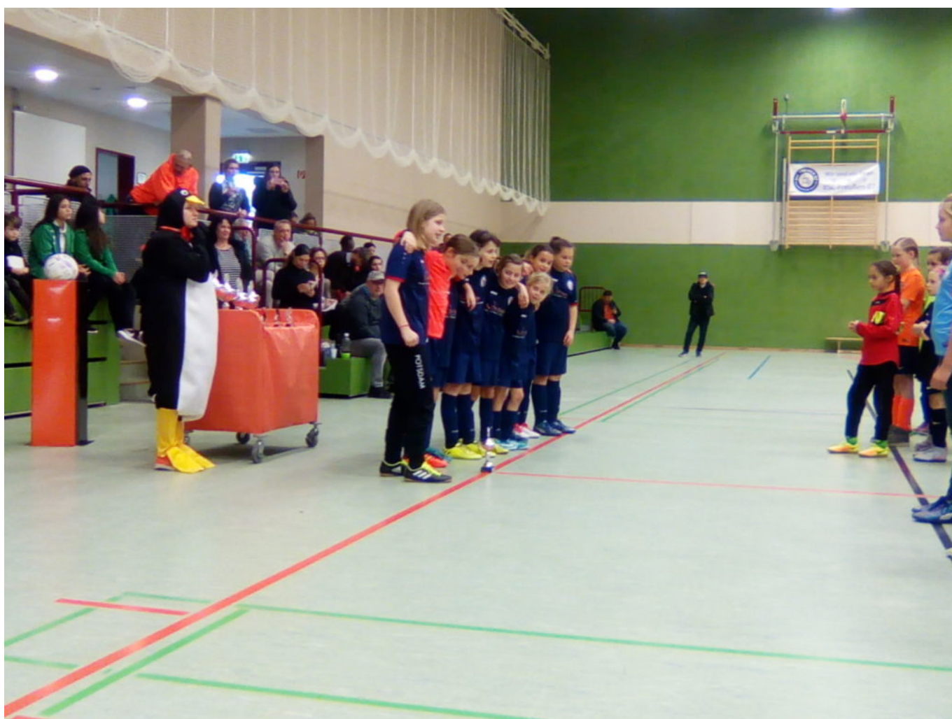
Unsere Turbinchen mit kleiner Trophäe

Das zweite Spiel gegen den 1.FC Internationale sollte 'ne lösbare Aufgabe sein. War es auch, Schon in der 1. Minute kam Piri zentral nach vorne, bediente Nicky und sie fackelte nicht lange und schob zum 1:0 aus Turbinesicht ein. Unsere Turbinchen hatten nun das Kommando übernommen und spielten den Gegner förmlich an die Wand, nur ließen sie viele Torchancen ungenutzt. Erst in der 6. Minute hat es geklappt: Leni mogelte sich nach vorn und schob zum 2:0 ins lange Eck ein. Eine Minute später das 3:0 durch Piri und in der Minute durfte sich Lara, die sonst nur mit Defensivaufgaben beschäftigt war, auch mal in die Torschützenliste mit eintragen. Sie erzielte den 4:0-Endstand. Somit hatte Turbine 6 Punkte in der C-Gruppe und das heißt in der Endabrechnung Platz 7.