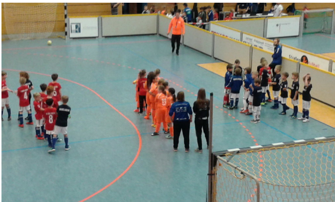
Antreten zur Begrüßung