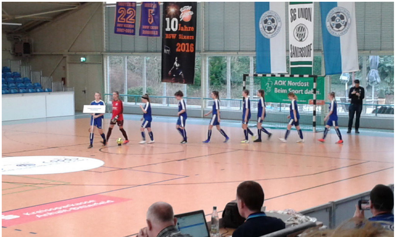
„Einmarsch unserer Gladiatorinnen“