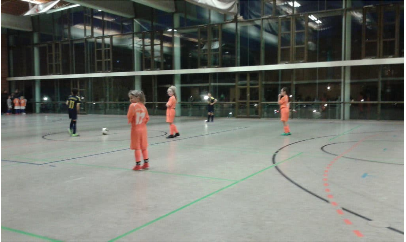
Anstoß zum Finale

Im Finale (jetzt 1×12 Minuten) mussten unsere Mädels, wie in der Vorrunde, erneut gegen den SC Siemensstadt antreten.