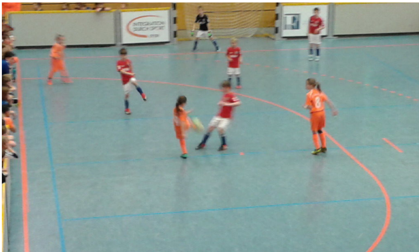
Emma holt aus

Dafür hatte Malli im Tor kaum zu tun. So tat es schon weh, daß in der 7. Minute ein Schuß der Jungs abgefälscht wurde und ins Tor ging, als Malli schon in Gegenrichtung unterwegs war - 0:1. Dabei bleib es. Zwar schade, aber man sah: auch heute geht hier Was !