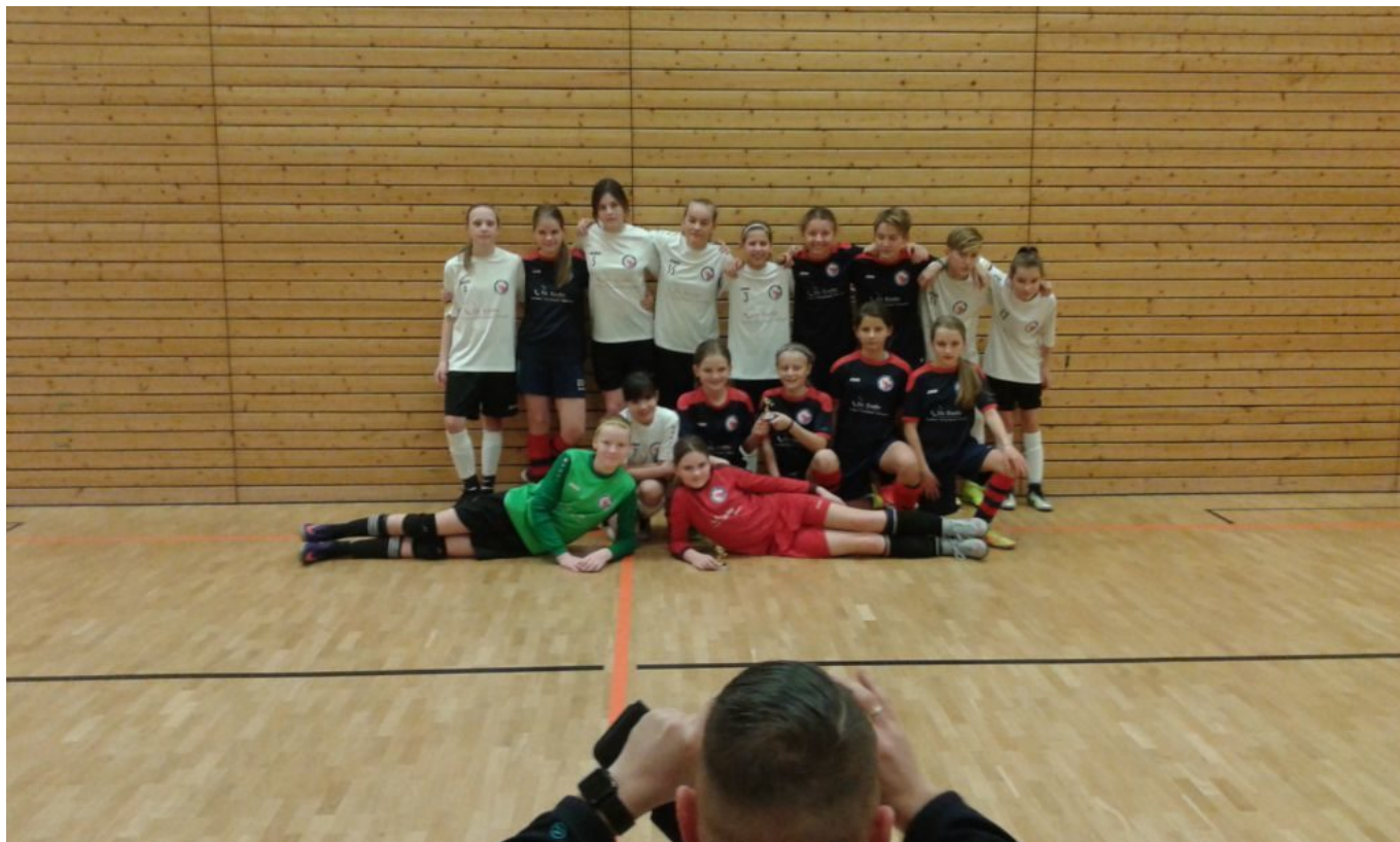
Unsere beiden Sieger