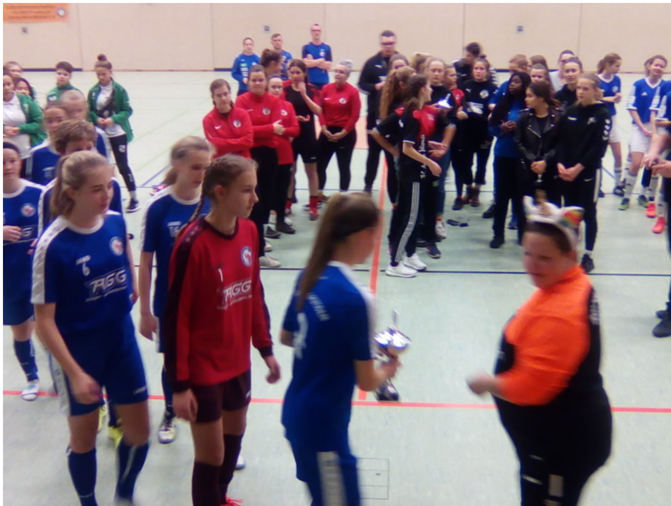
Bei der Pokalübergabe