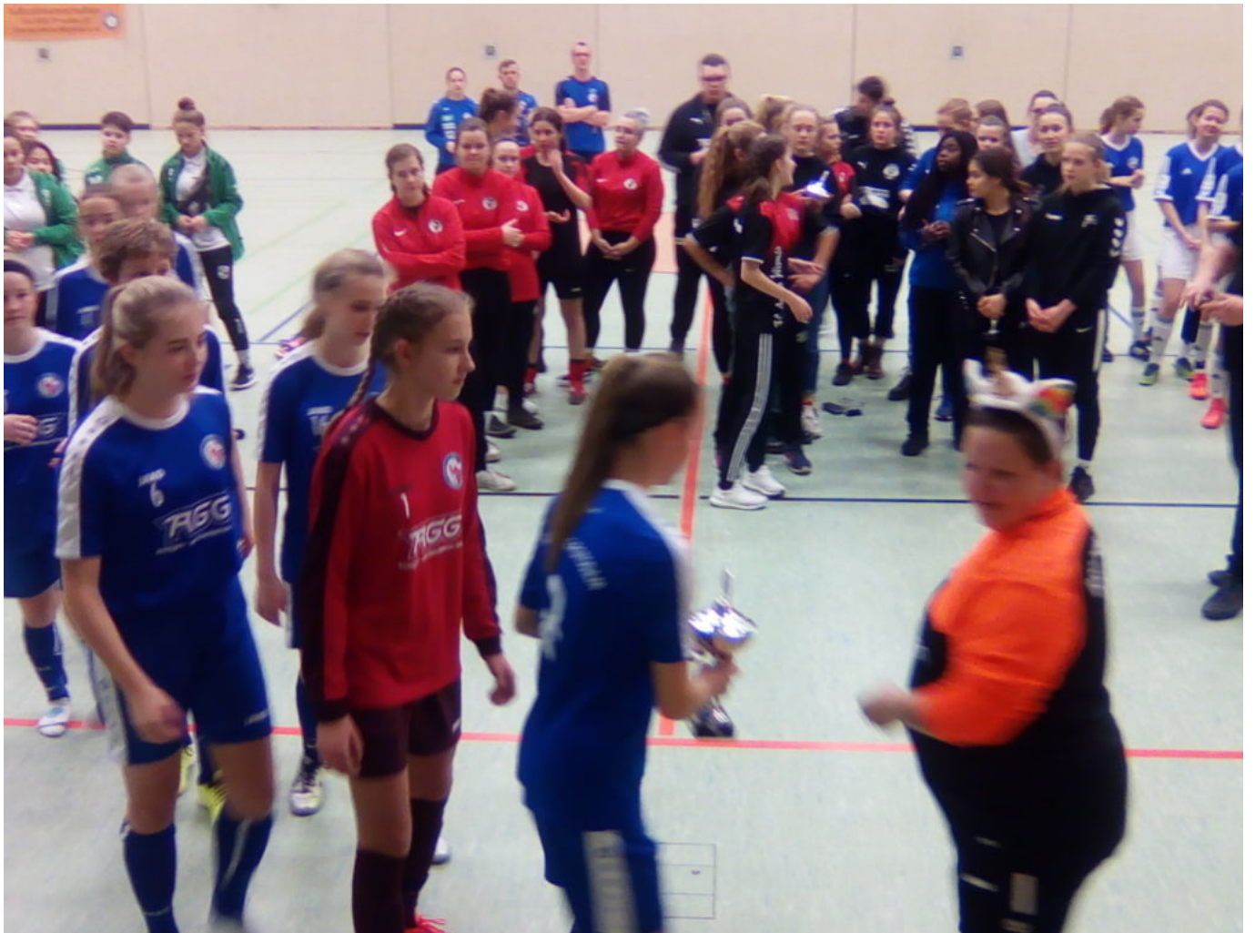
Bei der Pokalübergabe