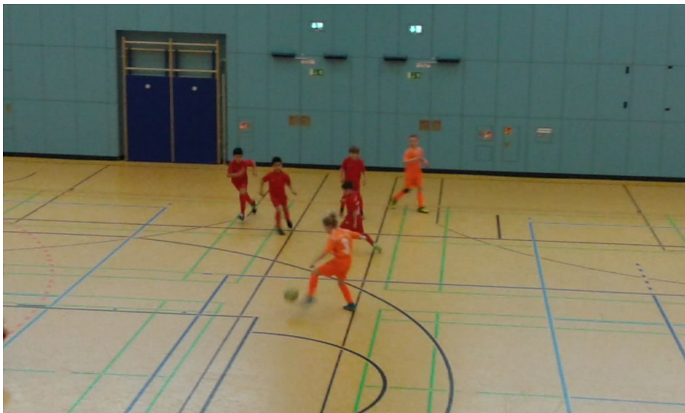
Lotte hat freie Bahn