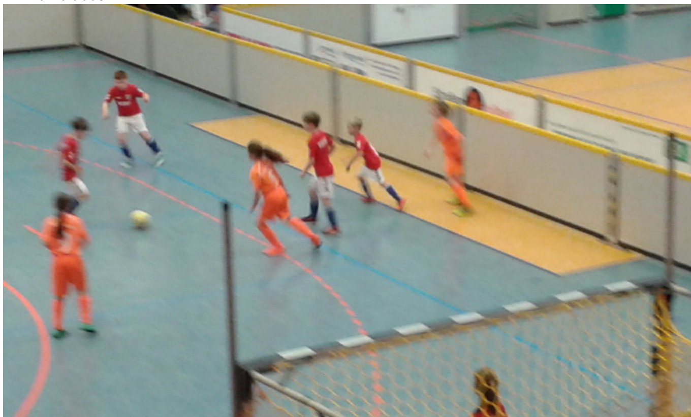
Die Jungs sind am Zug