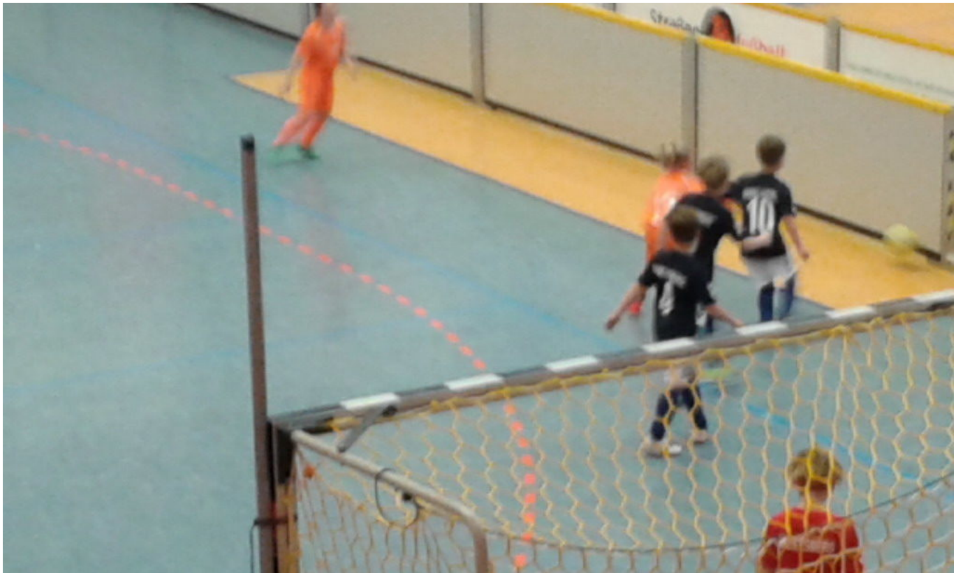
Auch Sari gegen Drei