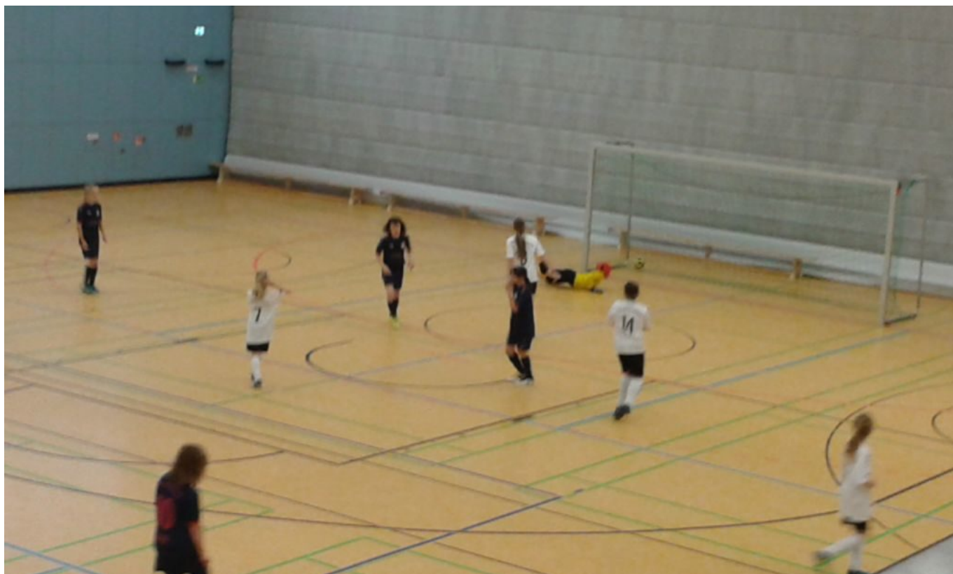
Piri hat getroffen (dunkel h.2.v.l. )