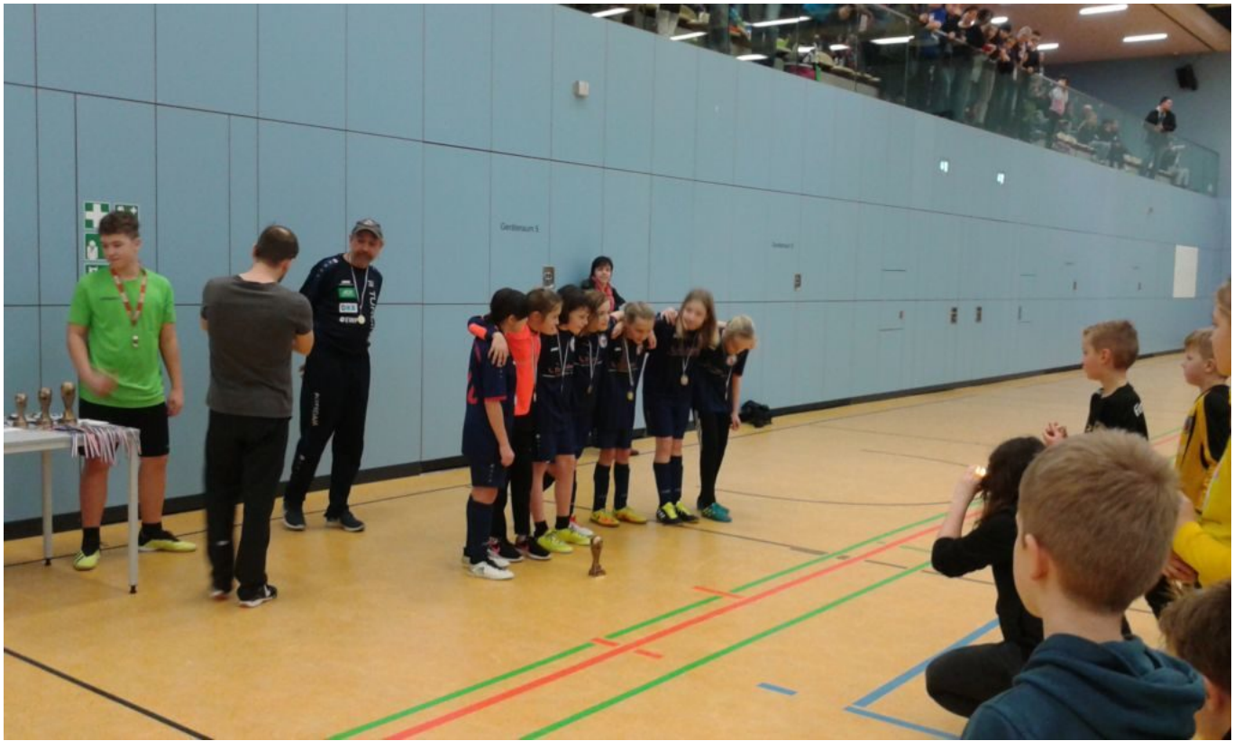
.... die EI.....