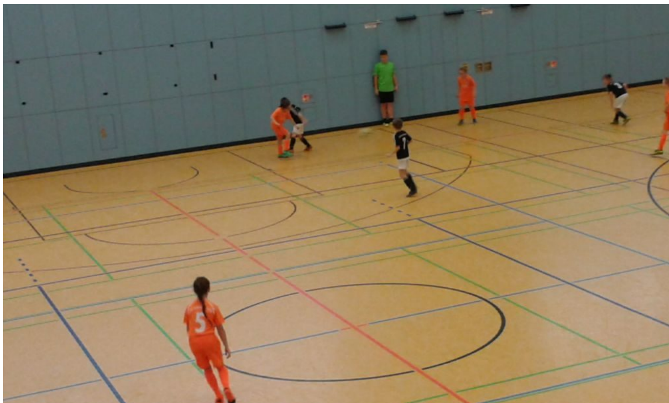
Pass zum Schiri (der spielt doch gar nicht mit)