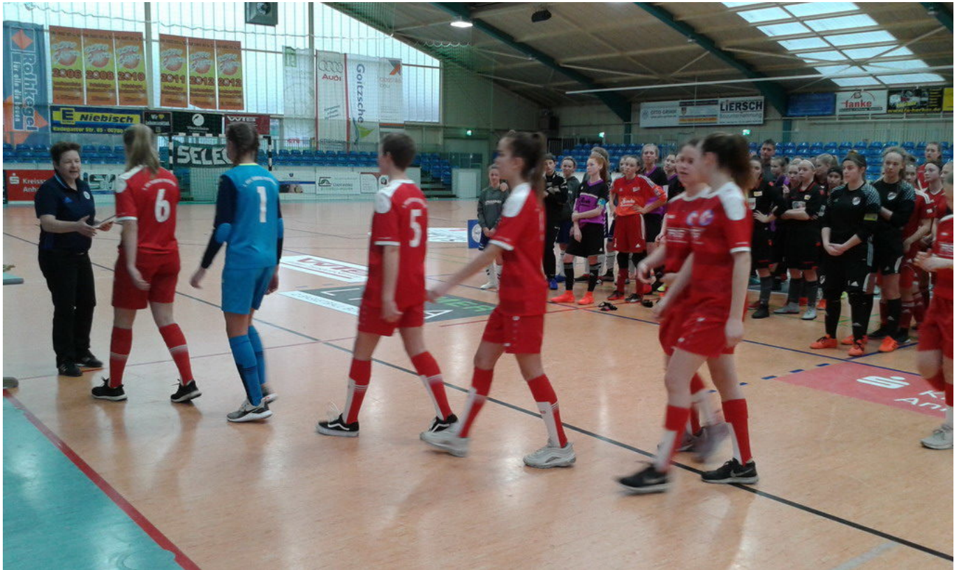
Anmarsch zur Siegerehrung