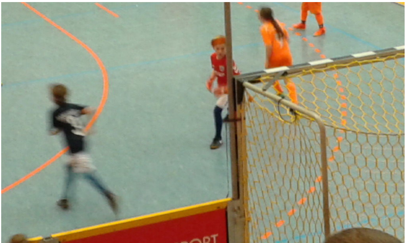
„Rumms“ - da kann der Keeper nur hinterherschauen