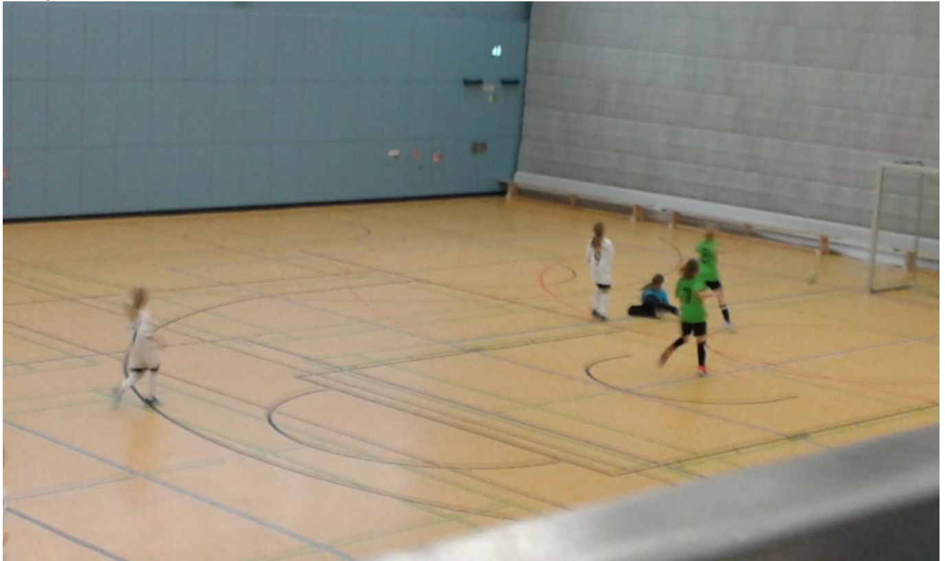
„Dicht daneben ist auch vorbei“

Den Abschluß bildete das Spiel unser EI-Mädels gegen die jungen Damen vom 1.FC Schöneberg. Um für Turbine Platz 1 und 2 zu sichern, musste mindestens ein Punkt her. Unsere jungen Ladies ließen