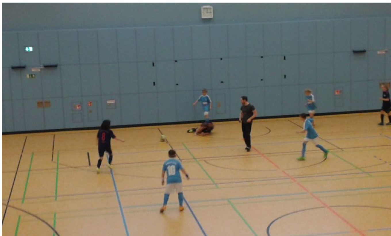
„Das haut Einen glatt um“