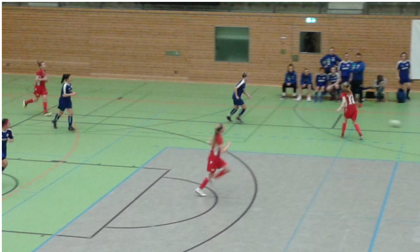
Der Ball ist zu schnell