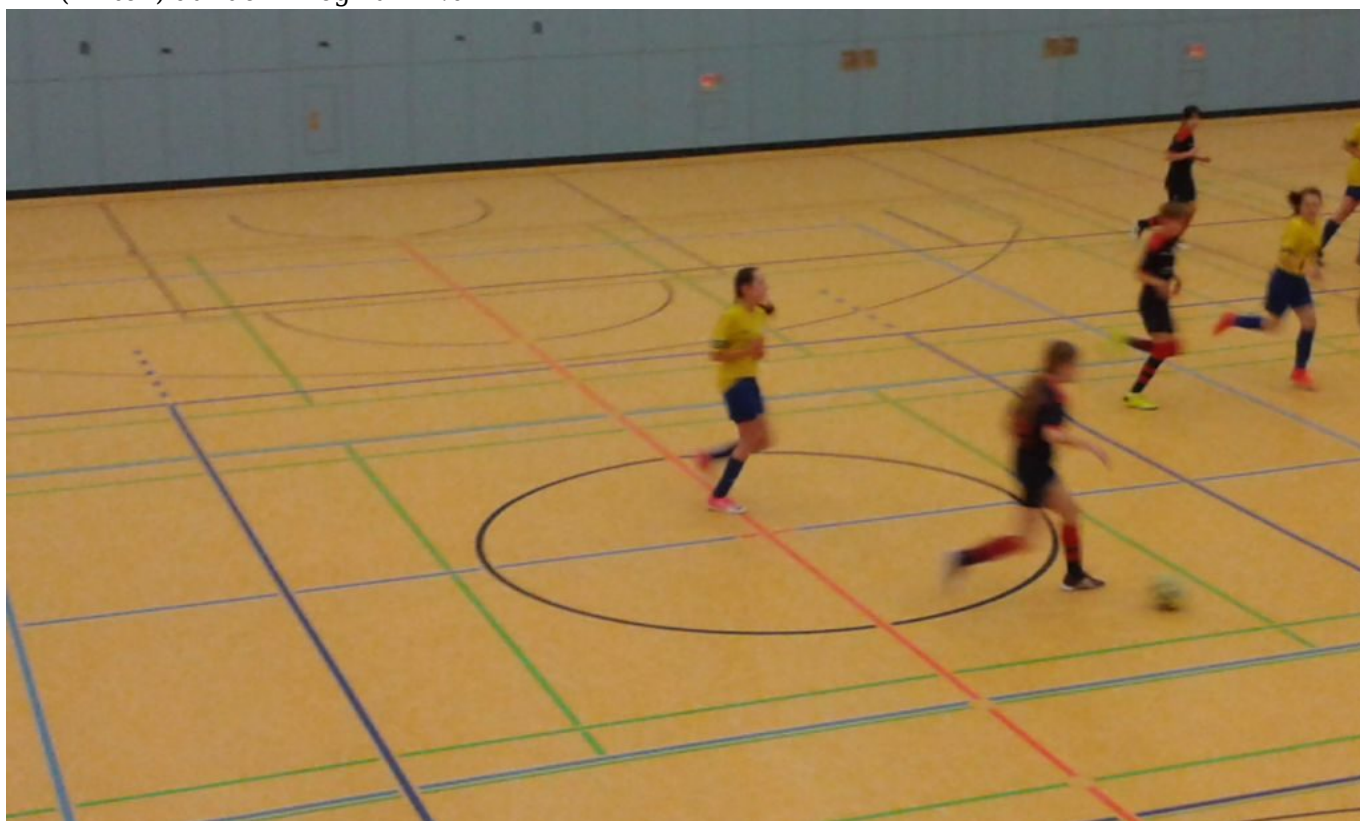
Fritzi nimmt Anlauf

Die beiden Platzierungsspiele endeten jeweils 0:0. So setzten sich dann um Platz 7 Viktoria Brandenburg mit 3:2 gegen Berolina Mitte sowie um Platz 5 der 1.FC Schöneberg mit 4:2 gegen den BSC Preußen 07 jeweils im 9-Meter-Schießen durch. Im kleinen Finale um Platz 3 zeigte der SC Staaken nochmal eine „staake“ Leistung und siegte mit 2:1 gegen den Heideseer SV Fortuna. Der anschließende Freudenknäuel der „staaken“ Mädels zeigte, daß die Welt für sie wieder völlig in Ordnung war und ich freute mich mit Ihnen.