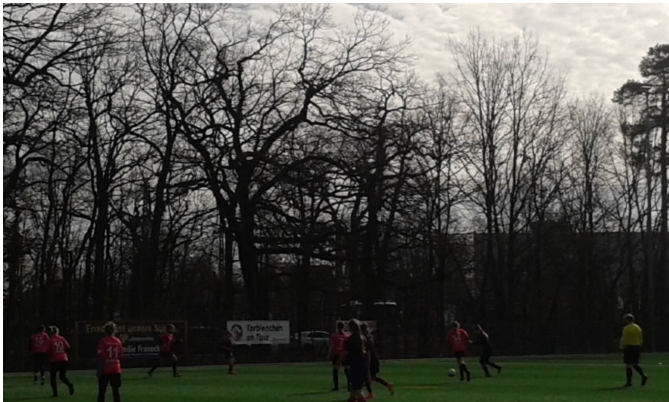
Ab nach vorn