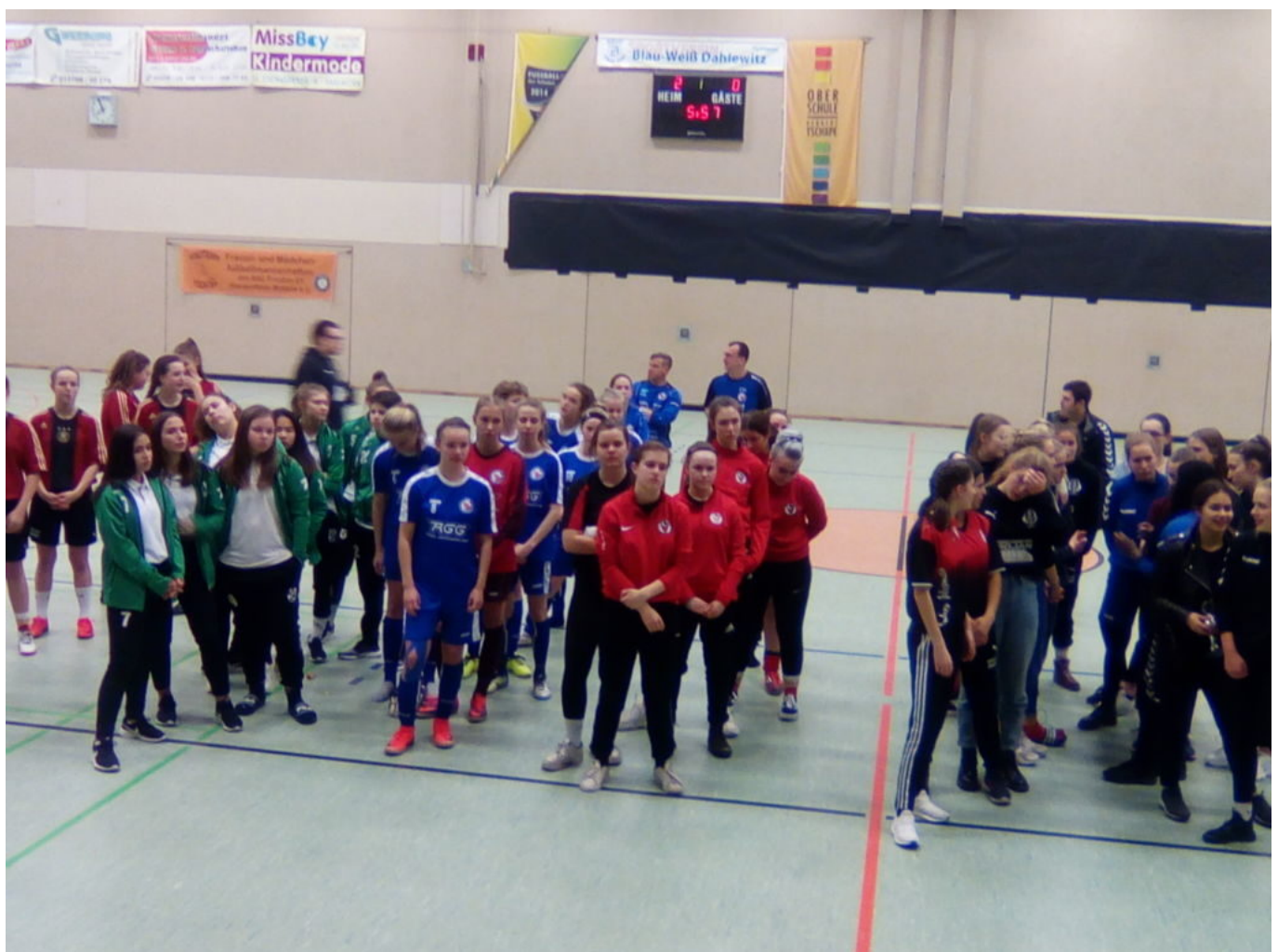
Vor der Siegerehrung