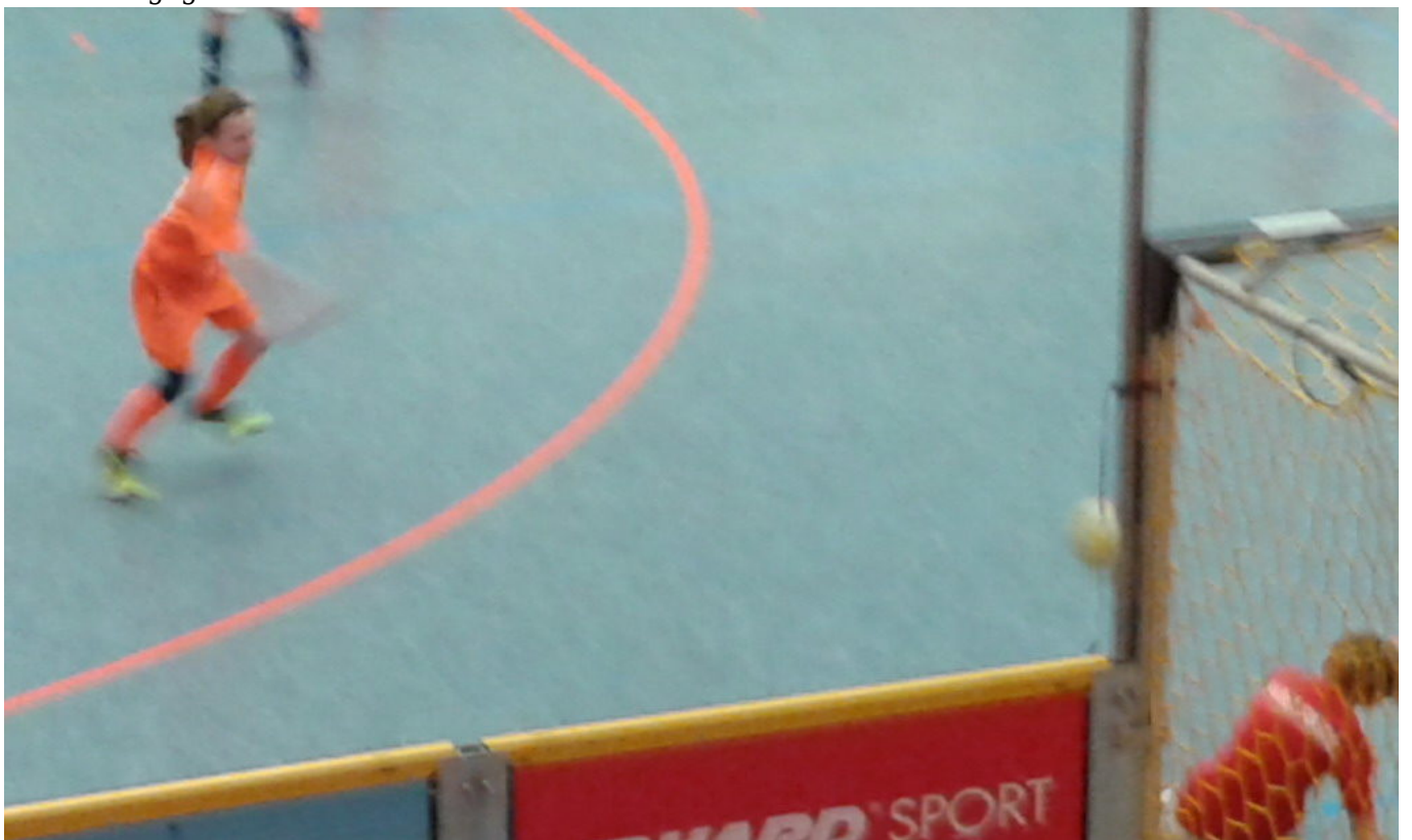
Rieke zieht ab .....