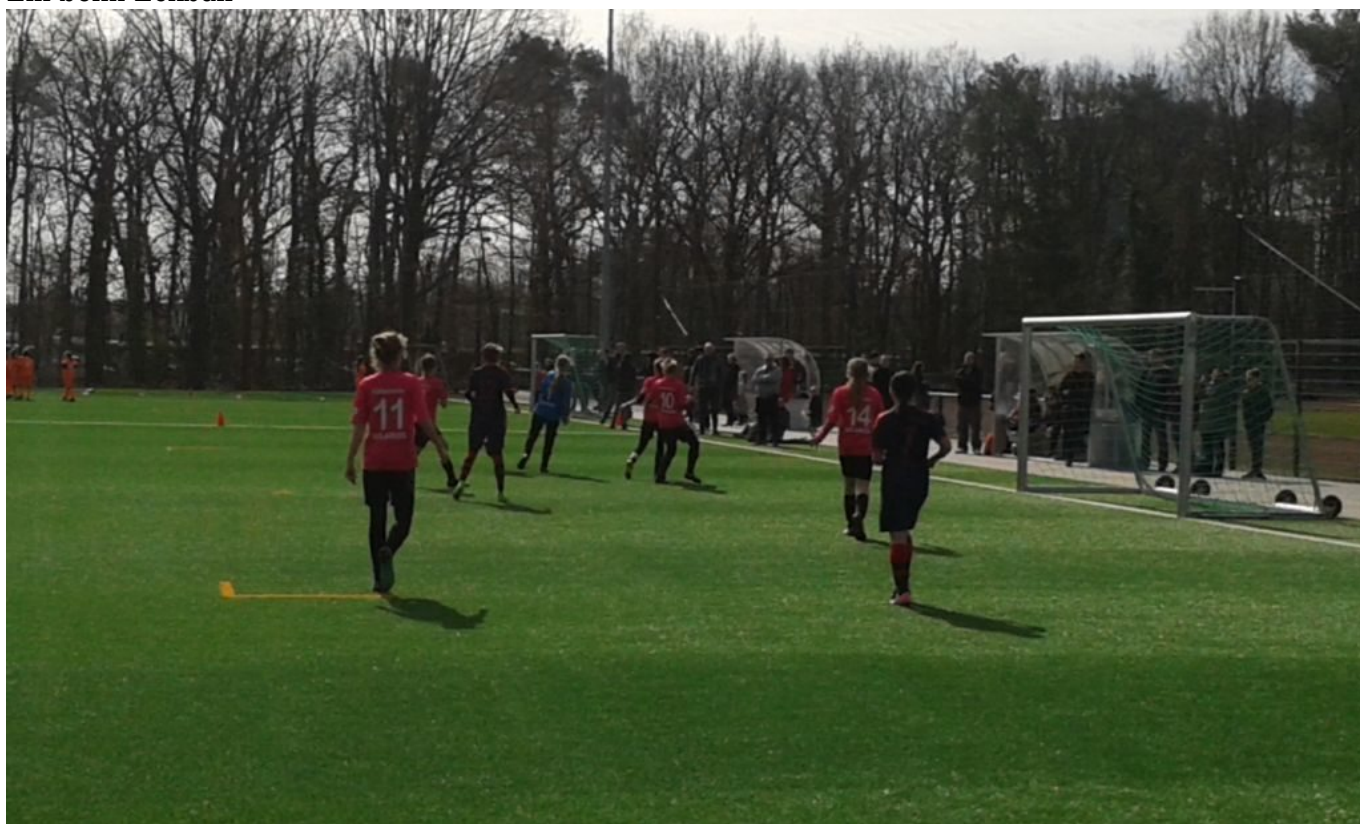
Wo ist der Ball ? .....oder gibt's an der Eckfahne Freibier ?