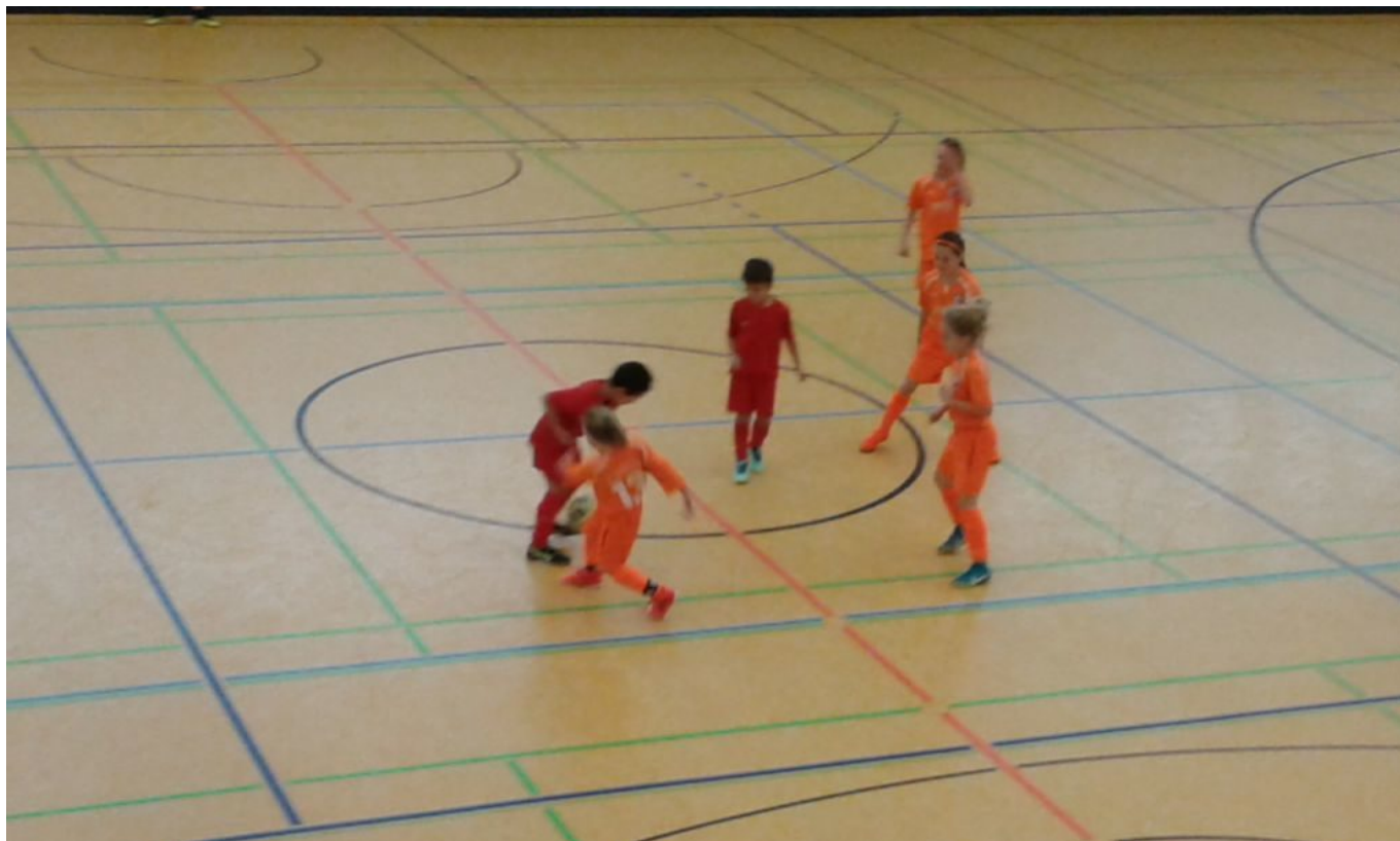
Sari im Zweikampf, vier Andere schauen zu und lernen