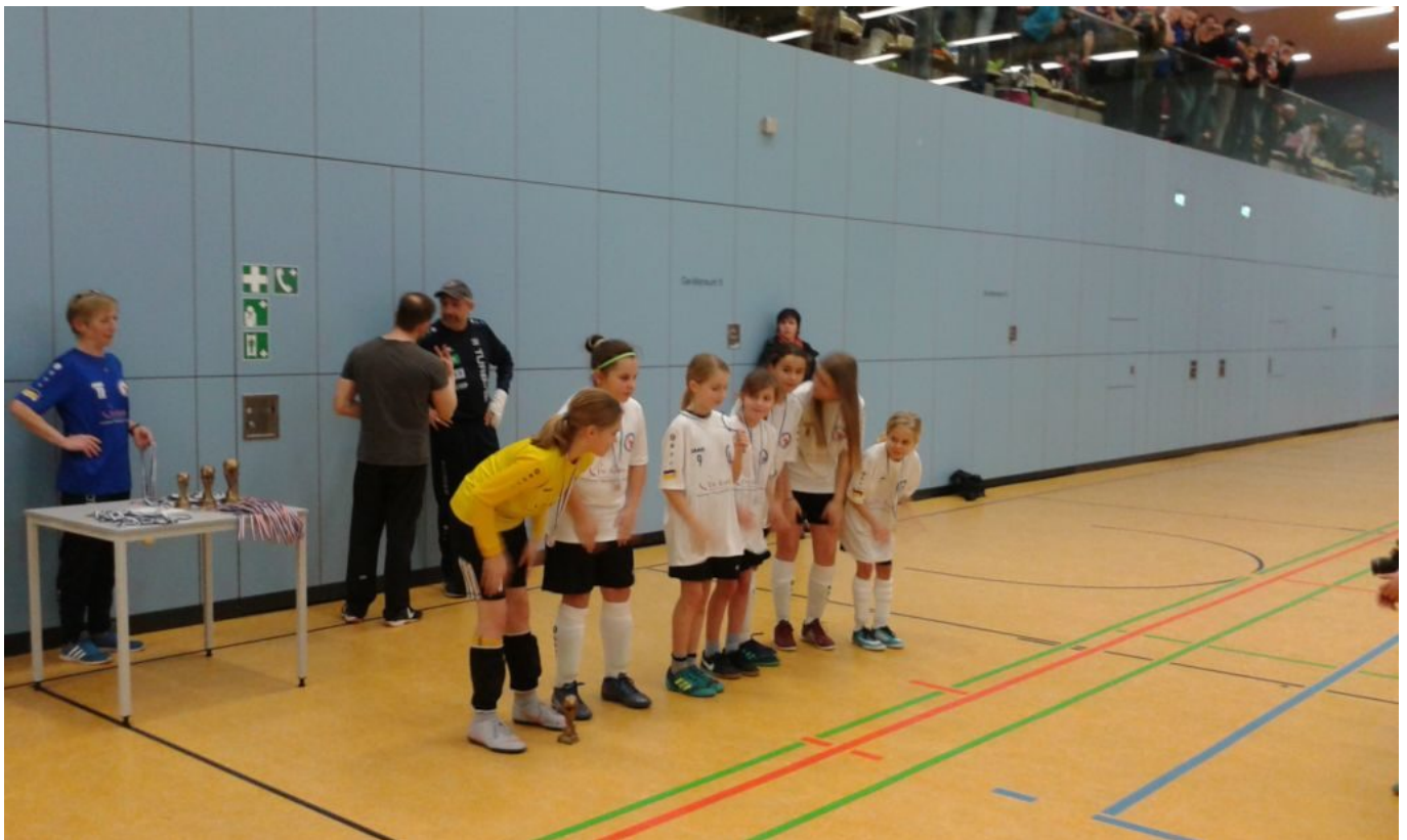
Der Spruch bei der Siegerehrung: die EII....