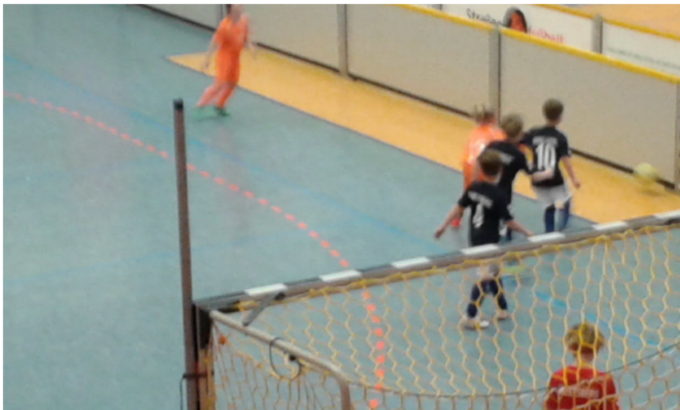
Auch Sari gegen Drei