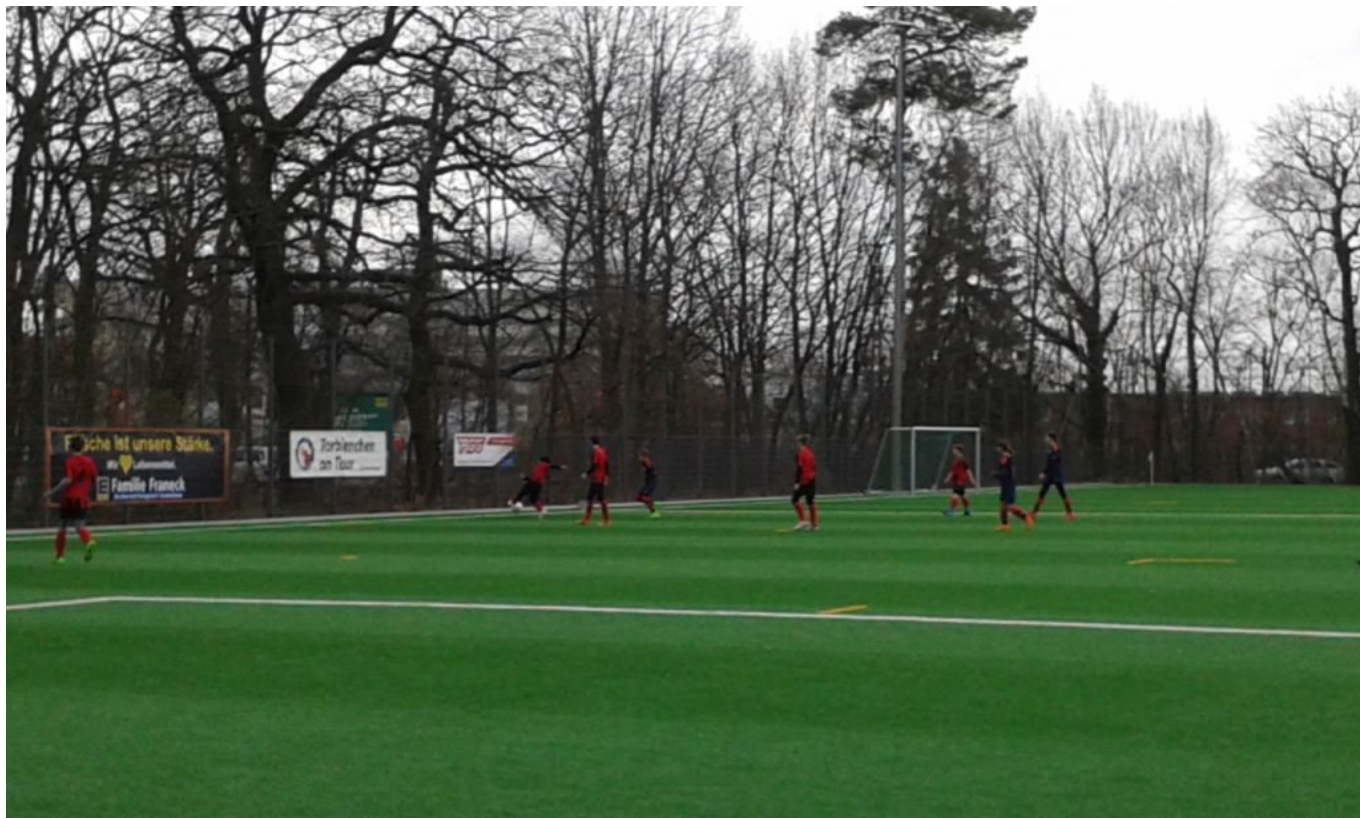
Jeder Quadratzentimeter wird ausgenutzt