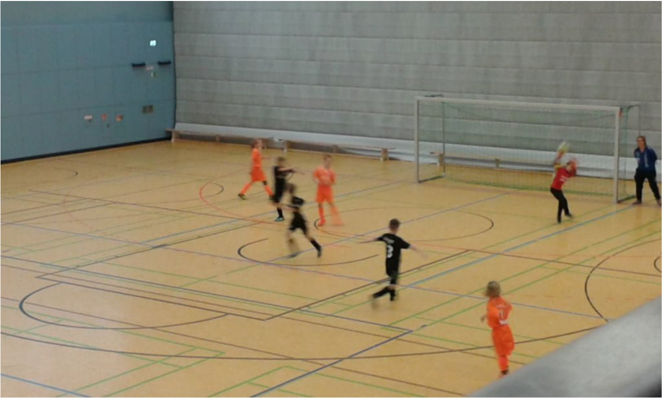
Malli hat die Hand dran