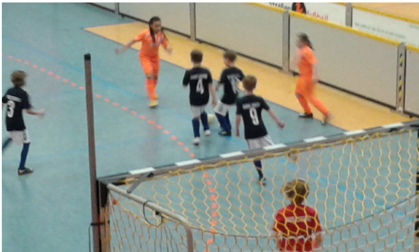
Shakira nimmt's mit Dreien auf