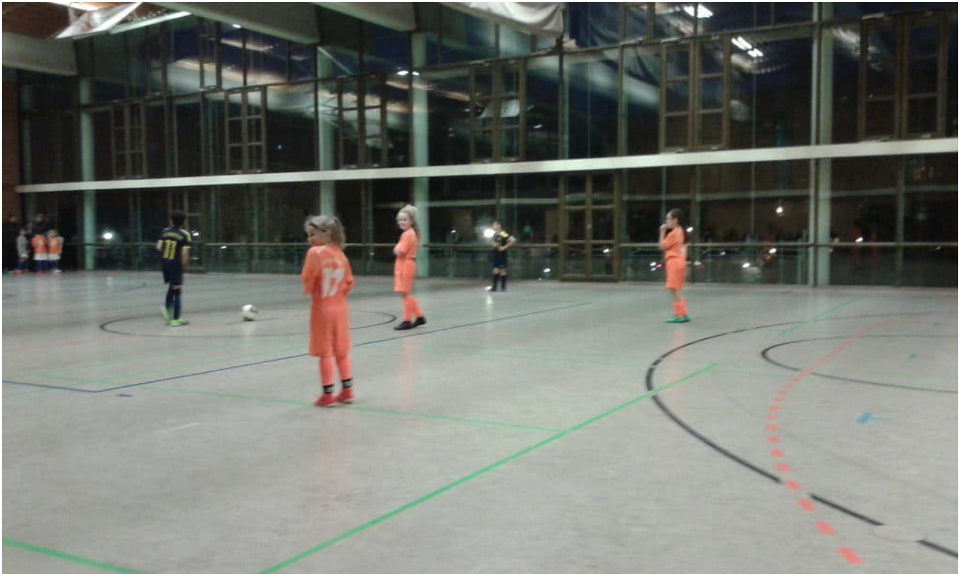
Anstoß zum Finale

Im Finale (jetzt 1×12 Minuten) mussten unsere Mädels, wie in der Vorrunde, erneut gegen den SC Siemensstadt antreten.