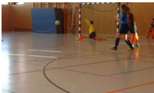
Grad noch den Fuß dran