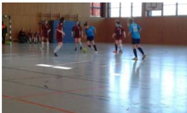
Wo ist die Lücke ?