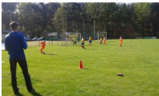
„Einmal um die eigene Achse, bitte!“