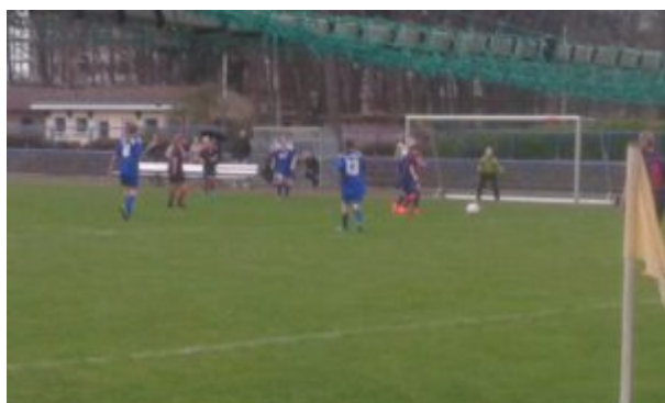
Den Ball fest im Visier