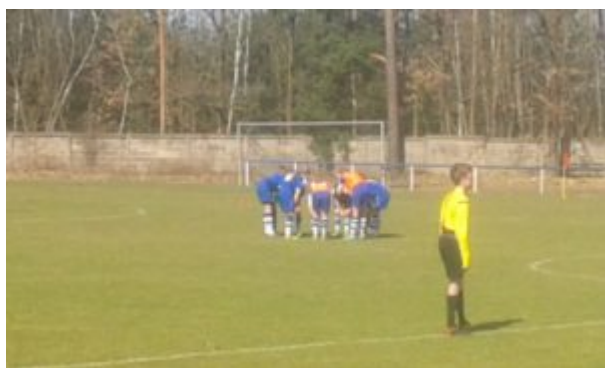
Der Motivationskreis unserer Turbinen

Bei meinem sonntäglichen Support in Eberswalde ergab sich die Gelegenheit, auf Deutschland's einzigem O-Bus-Netz (wie Tram, nur ohne Schienen) zum Stadion zu fahren. Es fährt sich irgendwie weicher. Auch zu empfehlen: der Eberswalder Zoo. Klein, aber fein mit einer begehbaren Glaskuppel mitten im Löwengehege. Auge in Auge mit der Mietze....aber ich war ja zum Fußball hier !