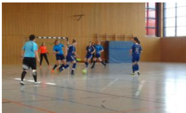
Hertha 03 greift an

Anschließend musste unser Team 2 ran. Gegner waren die Mädels von Hertha 03 Zehlendorf. Na, und die sind bzw. waren eine Klasse für sich. Aber dazu später mehr. Für unsere Mädels vom Team 2 war Hertha 03 einfach eine Nummer zu groß. So sehr sich die Turbinen auch mühten - am Ende stand es 0:7. Es konnte also nur besser werden.