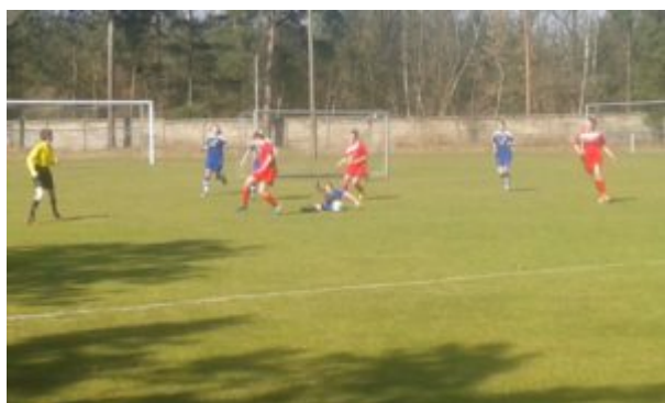
„Huch, weggerutscht !“