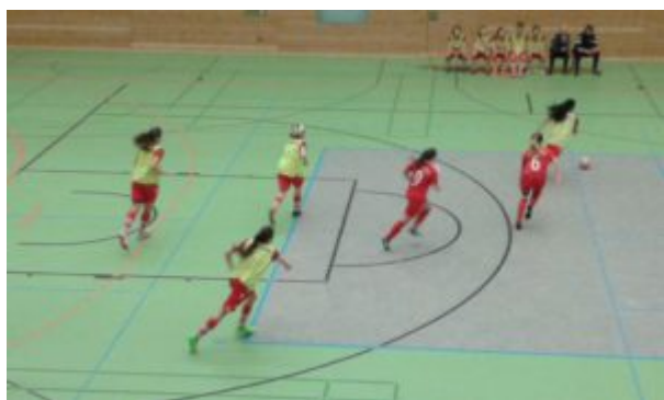
Union nimmt Anlauf.....