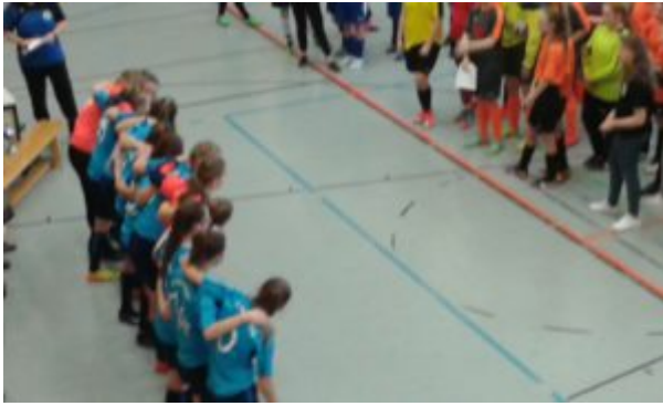
Die Turbinen gemeinsam bei der Siegerehrung