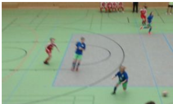
Rasant und selbst für die Kamera zu schnell

versprach. Ein rassistes Spiel mit vollem Einsatz, auch Körpereinsatz. Man fühlte sich an die Frauen-Bundesliga erinnert.