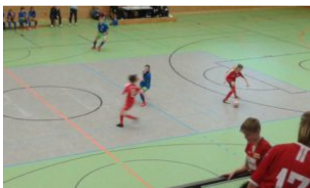
Im Rücken der Abwehr und schon ist sie frei