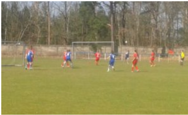
Die Ecke kommt rein....