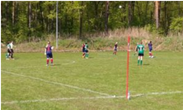
Und jetzt hoch zum Kopfball