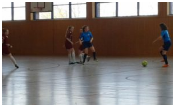
Den Blick auf den Ball