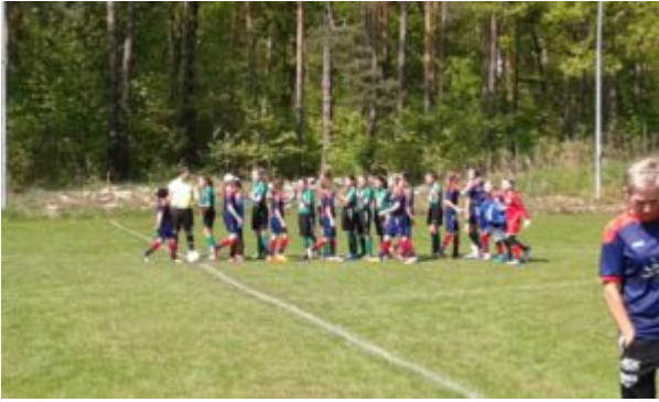
Handshake mit den Gastgeberinnen

am Ende mit 9:6 ! Man sieht, wenn man diese Turbinchen reizt, verstehen sie keinen Spaß. Aber was war nun gestern in Fürstenwalde los ?