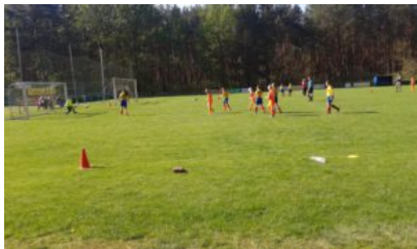
Diesmal hat sie ihn