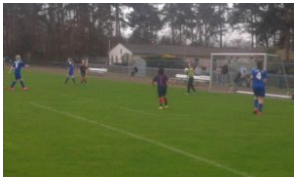
Ditte hat den Ball sicher