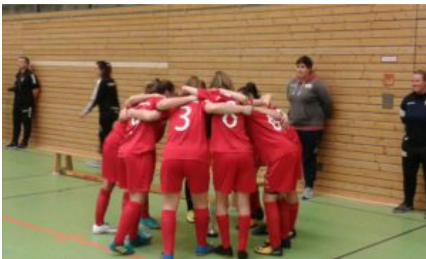
Der Siegerkreis mit Absingen der Turbinehymne

Eines will ich unbedingt erwähnen: klar wurde vor jedem Union-Spiel und bei jedem Torerfolg der Eisernen Ladies die Union-Hymne angespielt. Das ist auch richtig so. Aber es freute mich sehr, beim Torerfolg unserer Mädels und erst Recht nachdem gegen Union gewonnenen Finale (!) unsere Turbine-Hymne von 2009 zu hören. Ich denke, hier kam auch die gegenseitige Wertschätzung zum Ausdruck. So ließen es sich unsere Turbinen nicht nehmen, bei der Siegerehrung den Refrain der Turbine-Hymne noch einmal live zu singen.