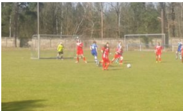
.....solch ein Gewimmel möcht' ich sehen....