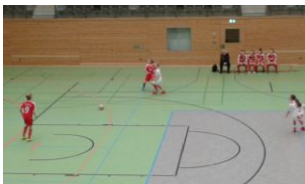
Mit allem Einsatz

So ging es im letzten Gruppenspiel gegen den 1.FC Köln auch um den Gruppensieg. Und sicher wollten beide Teams im Halbfinale den jungen Wölfinnen aus dem Weg gehen, die ihre Spiele in Gruppe A zwar knapp gewannen, aber auch ohne Punktverlust und Gegentor blieben und so Nervenstärke zeigten. Aber zum Thema „Gruppensieg“ hatte ich mich ja unlängst geäußert. Das Spiel gegen den „Effzeh“ ging schon bescheiden schön los: Köln hatte Anstoß, trieb den Ball vor's Turbinetor und vollendete zum 0:1, ohne daß irgendeine Turbine an den Ball kam. Scheiße !! Nun waren kämpferische Qualitäten gefragt.