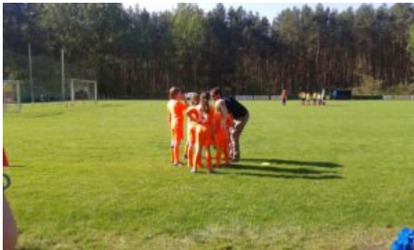
Besprechung vor dem Spiel