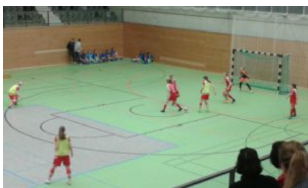
„Na, kriegen sie den Ball weg?“ (Union mit Leibchen)

Unsere Mädels hatten noch genug Kräfte. Das war auch nötig, denn es ging gleich voll zur Sache. Es wurde um jeden Ball und jeden Zentimeter Boden gekämpft. Eines Finales eben würdig!