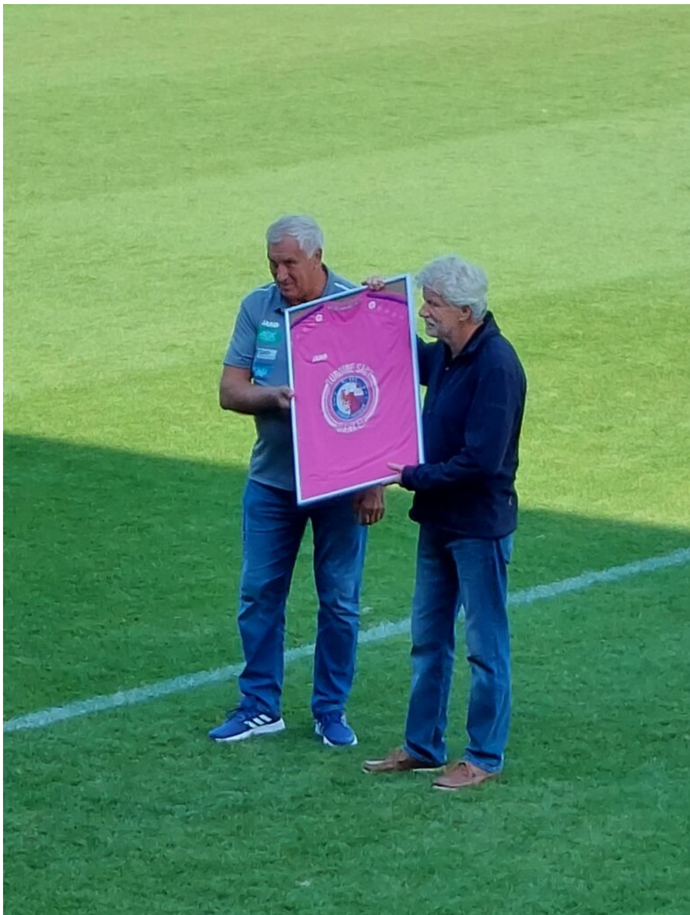
Abschied - Foto (bea)