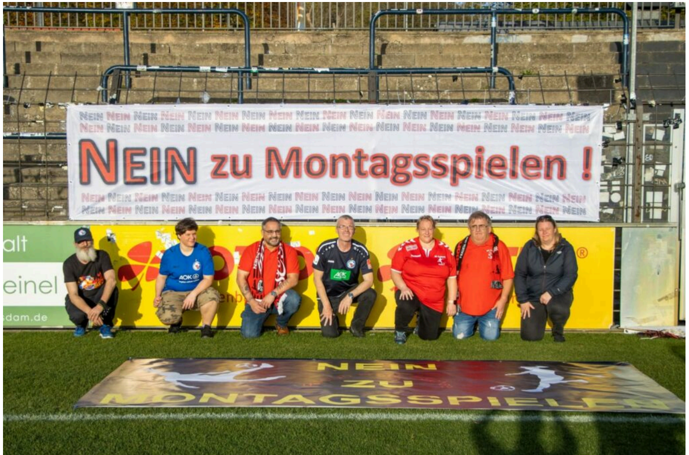
„SC Freiburg Frauen Fanclub Rote Füchse & Fanclub Turbinefans e.V. gemeinsam gegen Montagsspiele (sas)

Viel war nach den begeisternden Auftritten der Frauen-Nationalmannschaft bei der Europameisterschaft 2022 in England zu hören und zu lesen. Man wolle die Euphorie um den Frauenfußball mit in die Flyeralarm-Bundesliga nehmen. Man wolle den Frauenfußball attraktiver machen.