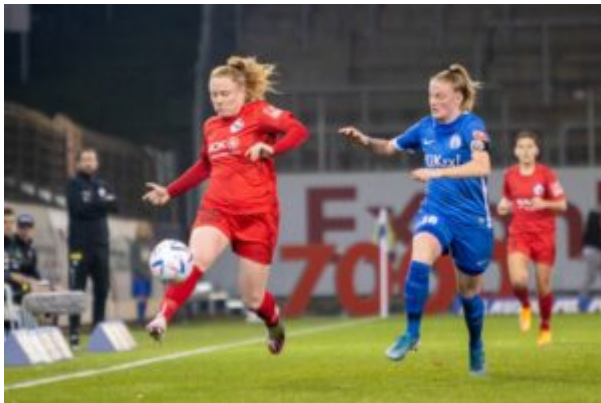
Mit Turbinedampf

Nach dem Spiel legte sich leichter Nebelschwaden auf dem Spielfeld nieder nach dem Motto, Schleier über das Spiel.