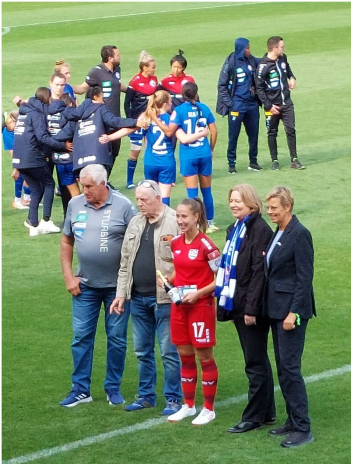
player of the match