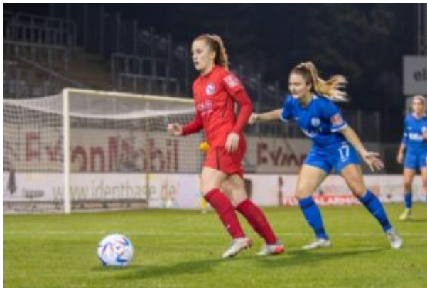
Potsdams Ball