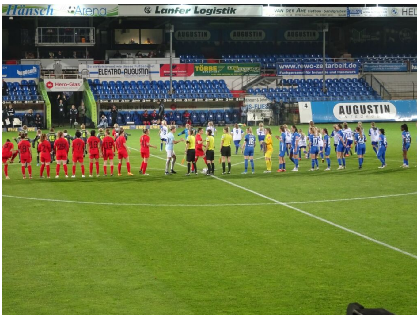
Mannschaftsaufstellung - Potsdam in Rot

Spielbericht zum Bl-Spiel SV Meppen gegen Turbine Potsdam am 21.10.2022