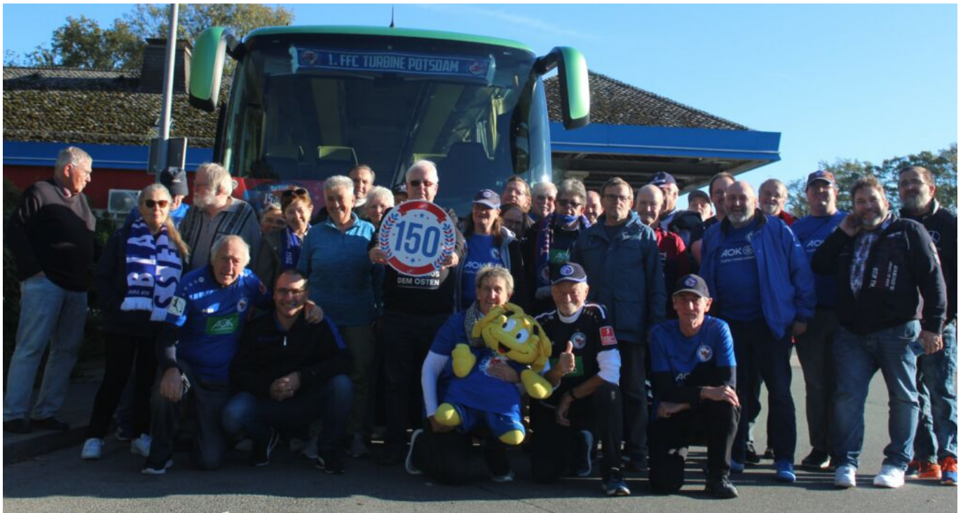
die 150. FanBus-Fahrt

Für die Turbinefans stand die einige Male verlegte 150. Fanbus-Fahrt an. 150 Fahrten in 15 Jahren zeugt doch von einer stolzen Fankultur.