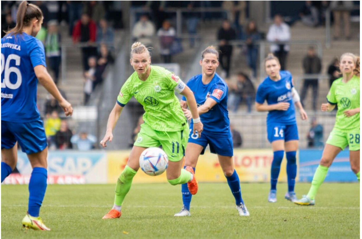
Alexandra Popp