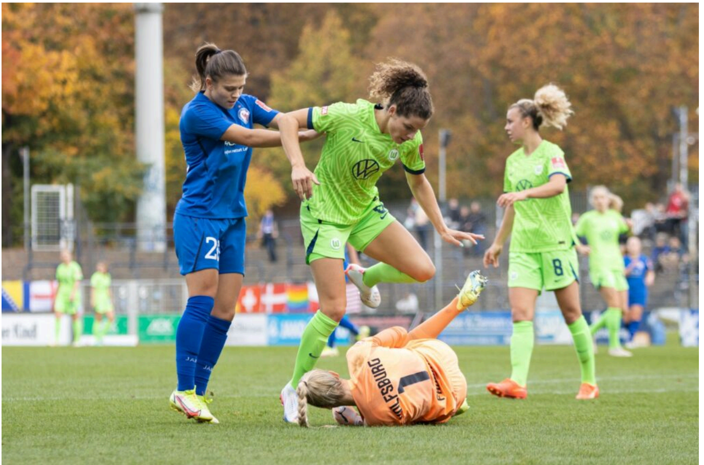
Nicht geschubst