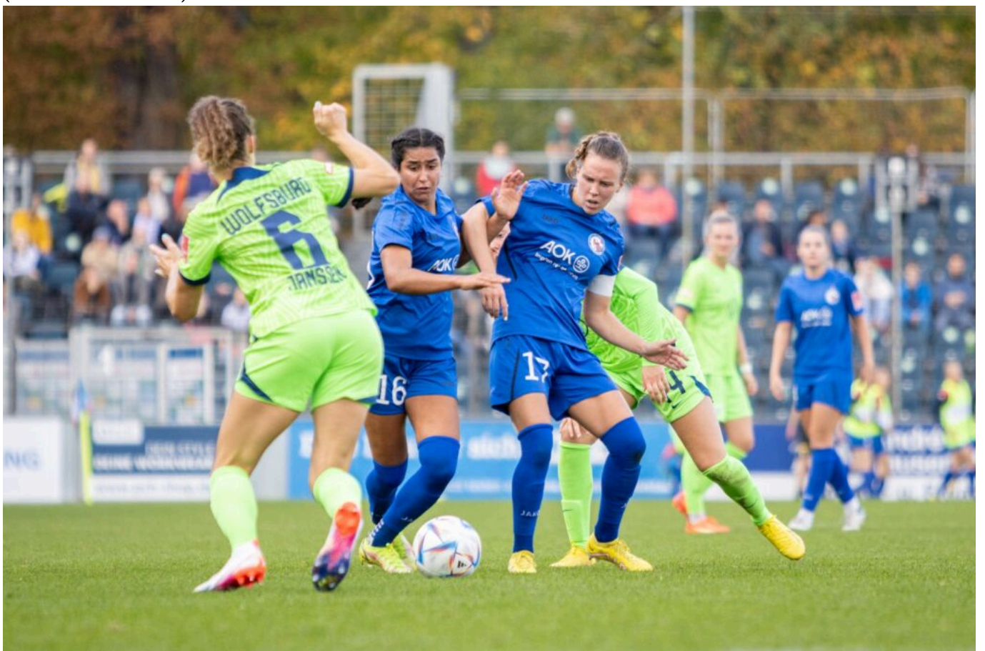
Missverstandener Zweikampf