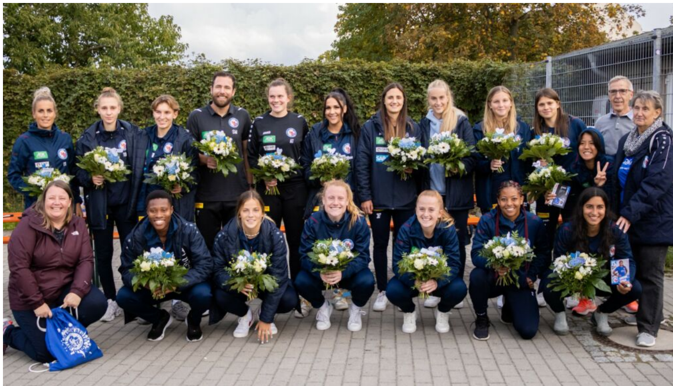
die Neuen

Den 3. Spieltag bestreiten die Turbinen am Samstag gegen den FC Köln. Dorthin fährt kein Fanbus, da sich nur eine kleine Anzahl an Mitfahrern angemeldet hat, und der Fahrpreis dadurch für den einzelnen Fan viel zu hoch ist.