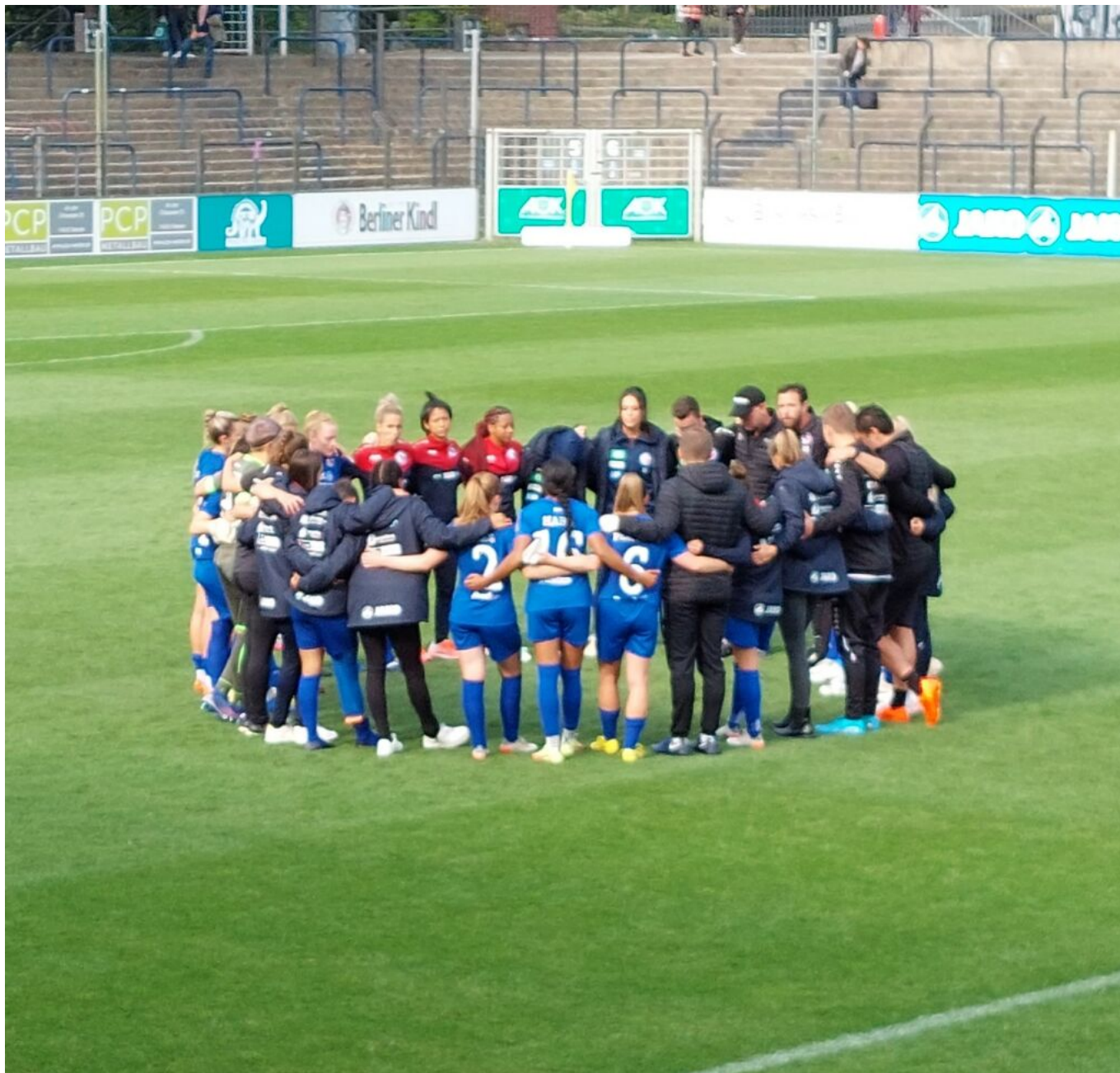
Nachbereitung - Foto (bea)