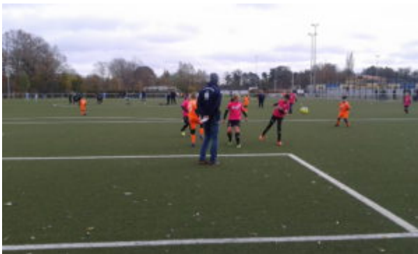
Der Ball im Rücken der Gegnerinnen