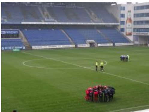
Kurz vorm Anpfiff