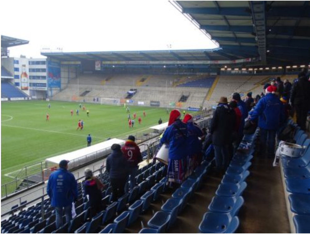
Während des Spiels