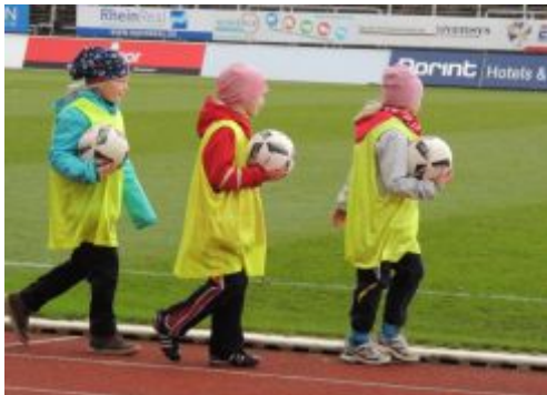
An die Arbeit!