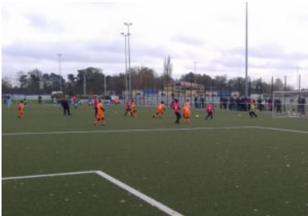
1 2 3 wer hat den Ball ?