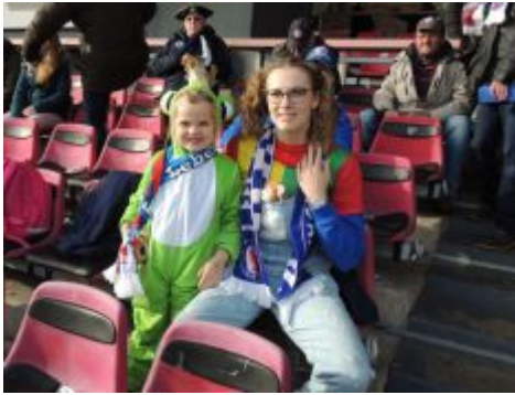
Jüngste Fanbusmitfahrerin mit geringem Akkuverbrauch