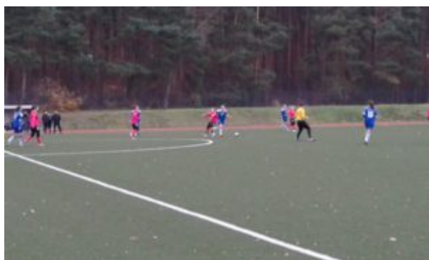
Ein gewonnener Zweikampf

Damit war das Spiel entschieden, denn unsere Mädels hatten die Spielkontrolle und der FSV konnte nach vorn kaum mehr Akzente setzen.