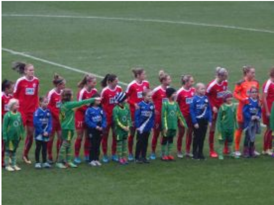
Guckt mal, da!