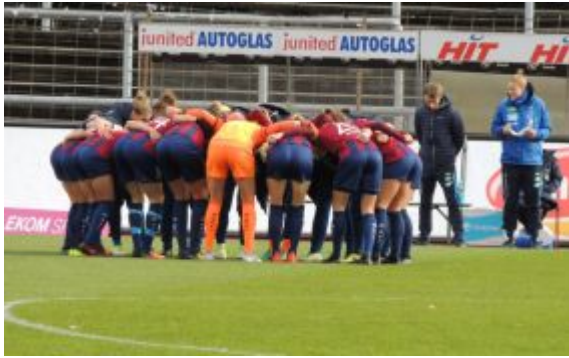
Mission. 3 Punkte