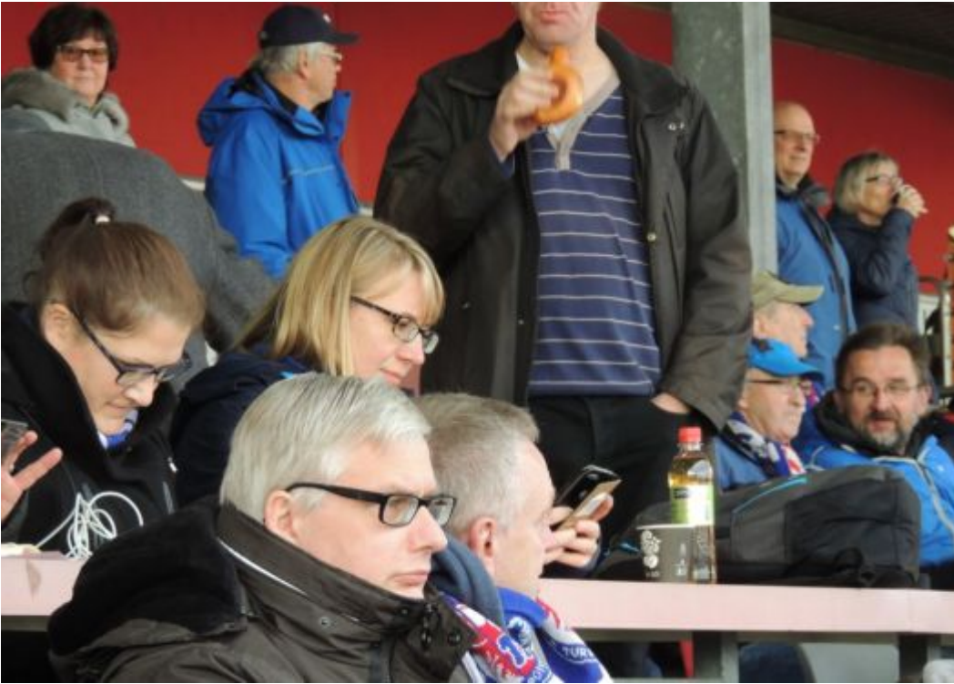
Ronnys letzter Liveticker