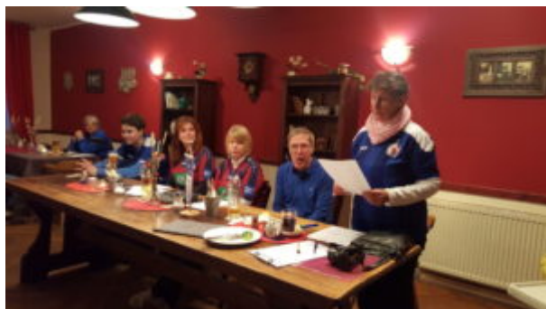
Vorstand des Fanclubs