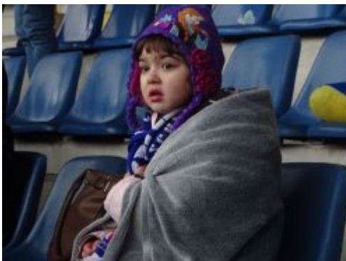
Warm verpackter treuer Fannachwuchs