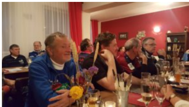
Begeistert zuhörende Mitglieder

Der Vorstand des Fanclubs „Turbinefans e.V.“