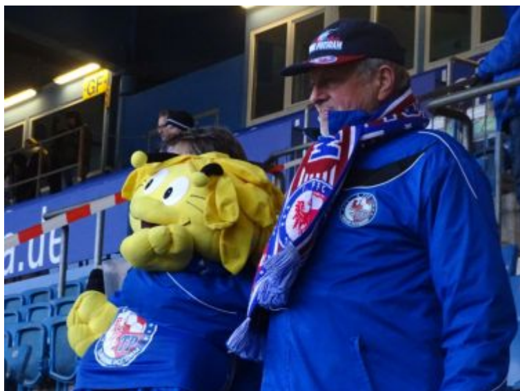
Es und er