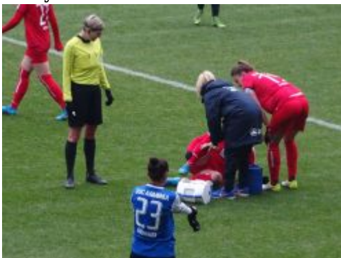
Tabbi verletzt auf der Rasenheizung liegend