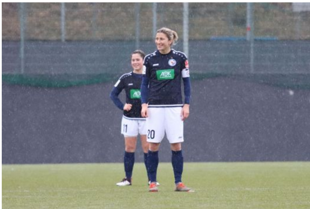
Oh captain, my captain