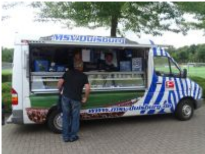
Fanshop des MSV Duisburg