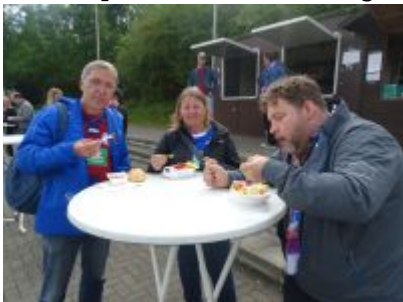
Stärkung vor Spielbeginn