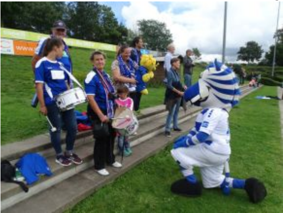
Kniefall vor Potsdamer Fans