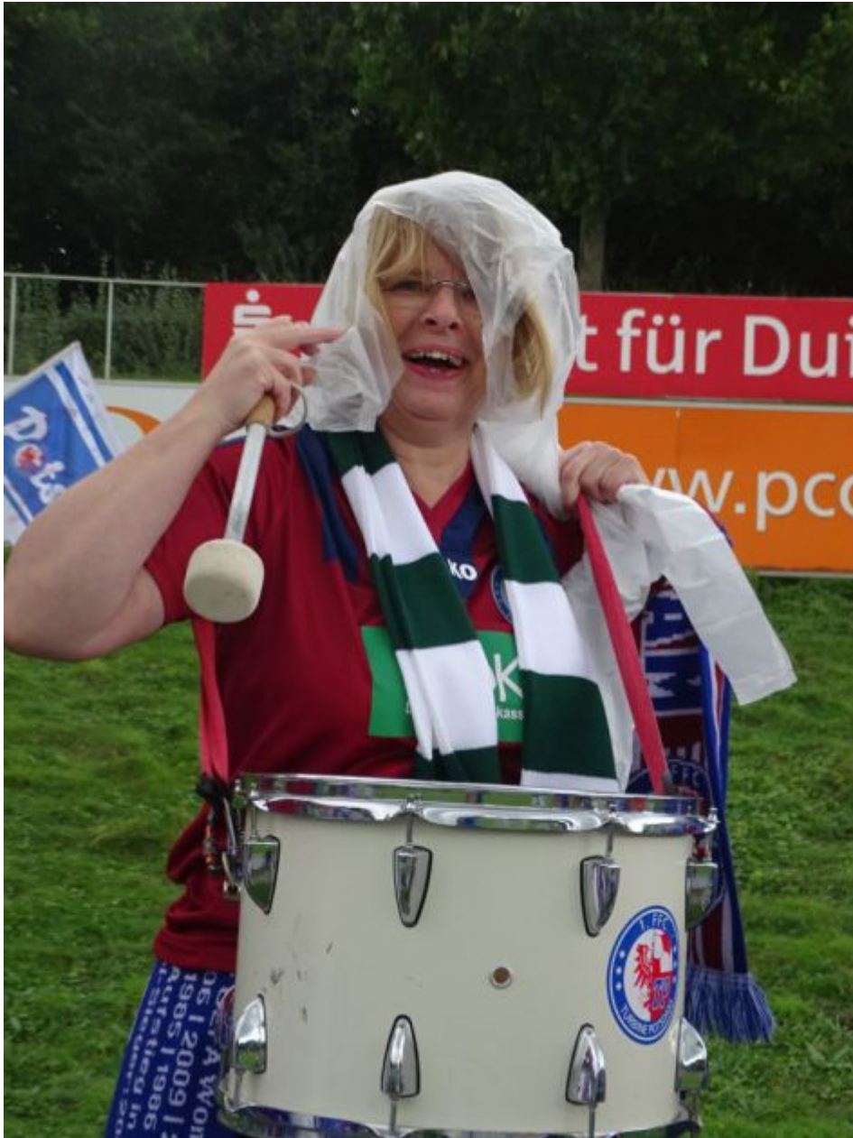
Vom Winde verwehter Regenschutz