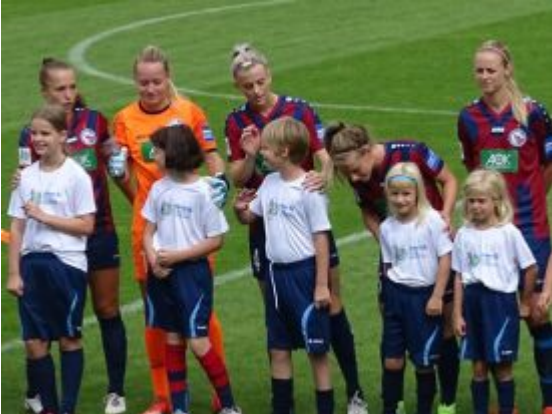
Nachwuchs mit Vorbildern