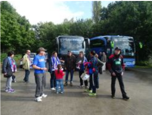
Kuz vor der Rückreise