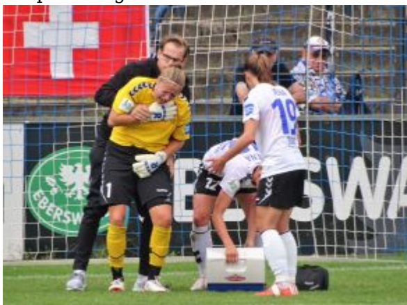
Verletzte Torhüterin J. Odeurs