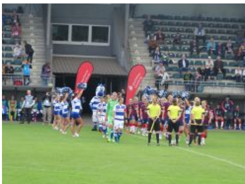
Gleich geht's los