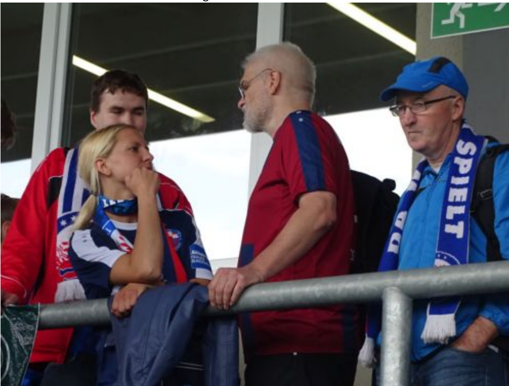
Analysegespräche nach dem Spiel