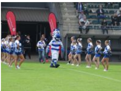
Gepuselter Einzug der