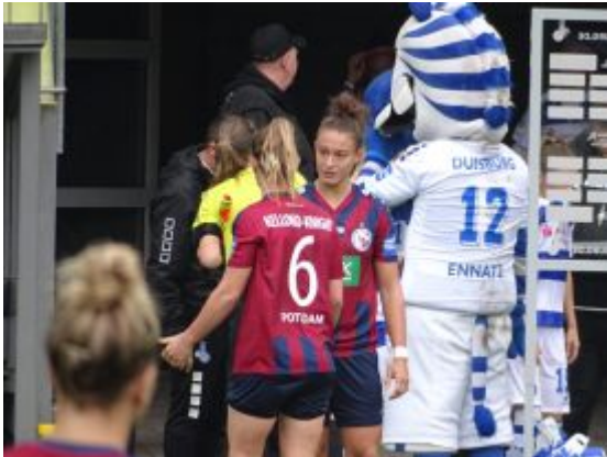
Auf zur zweiten Halbzeit