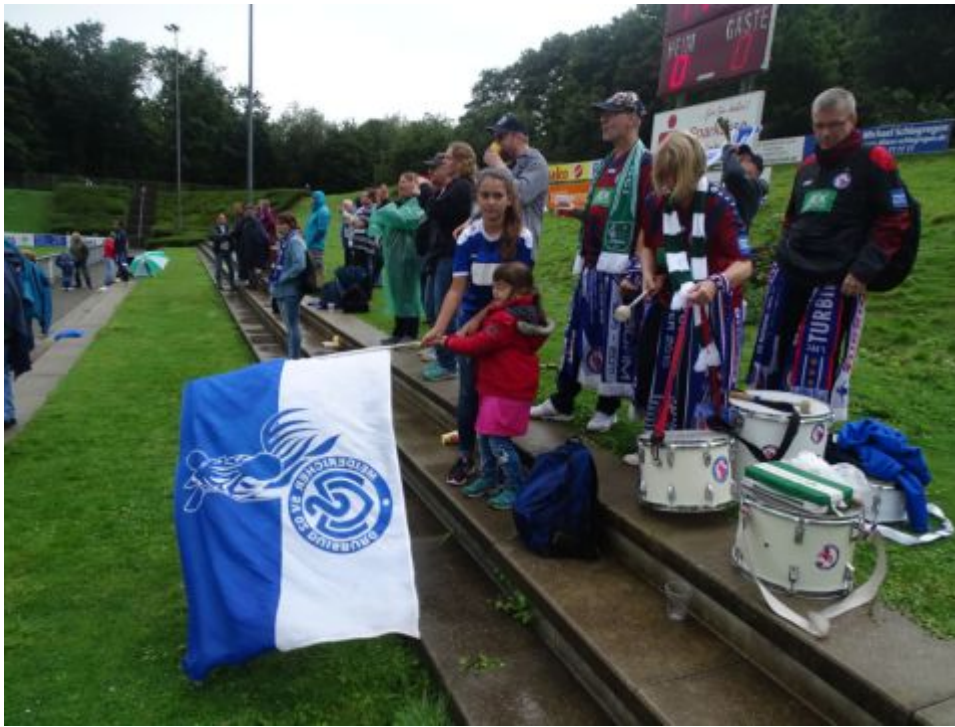
Nach dem Spiel