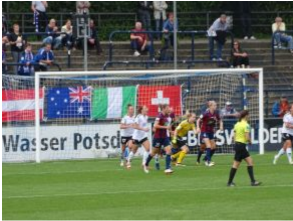
Ansammlung vorm Jena-Tor