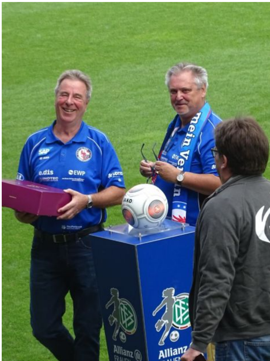
Jubiläumstorte für den Vereinspräsidenten

*DFB-TV-Deutsch (siehe Kommentator der Liveübertragung bzw. der Highlights der Begegnung)