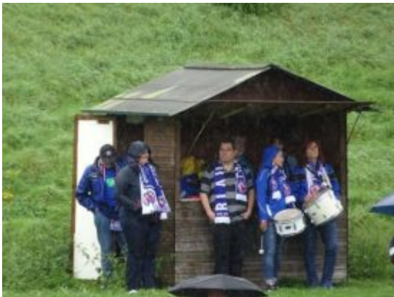
Und sie suchten diese Herberge wiederholt auf