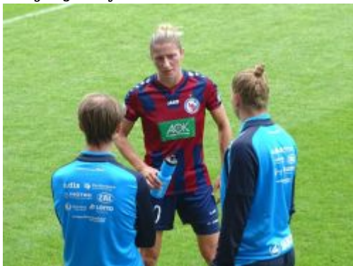
Besprechung vor dem 1.Tor