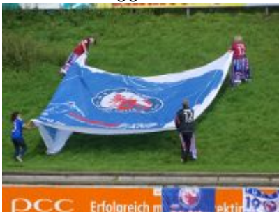
Die Blockfahne wird enthüllt