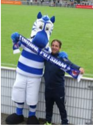
Fotoshooting während des Spiels