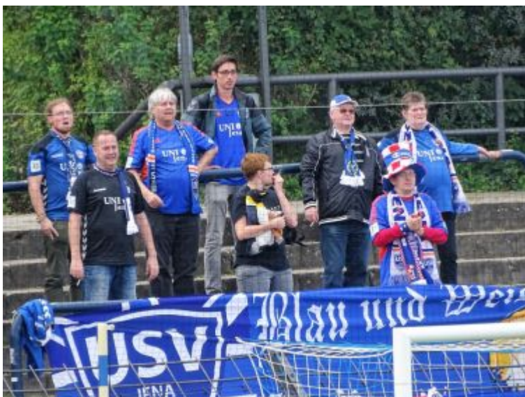
Fanblöckchen aus Jena