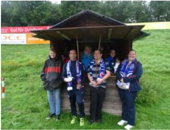
Und sie fanden eine Herberge