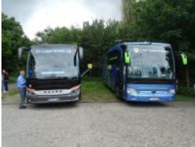
Fanbus und Mannschaftsbus in trauter Nachbarschaft