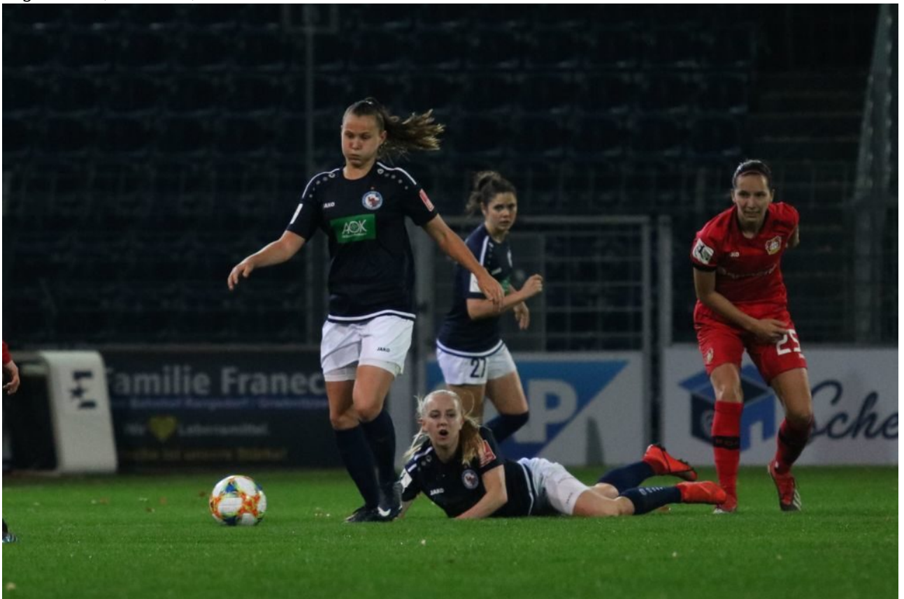
Tsss - die eigene Spielerin gefoult