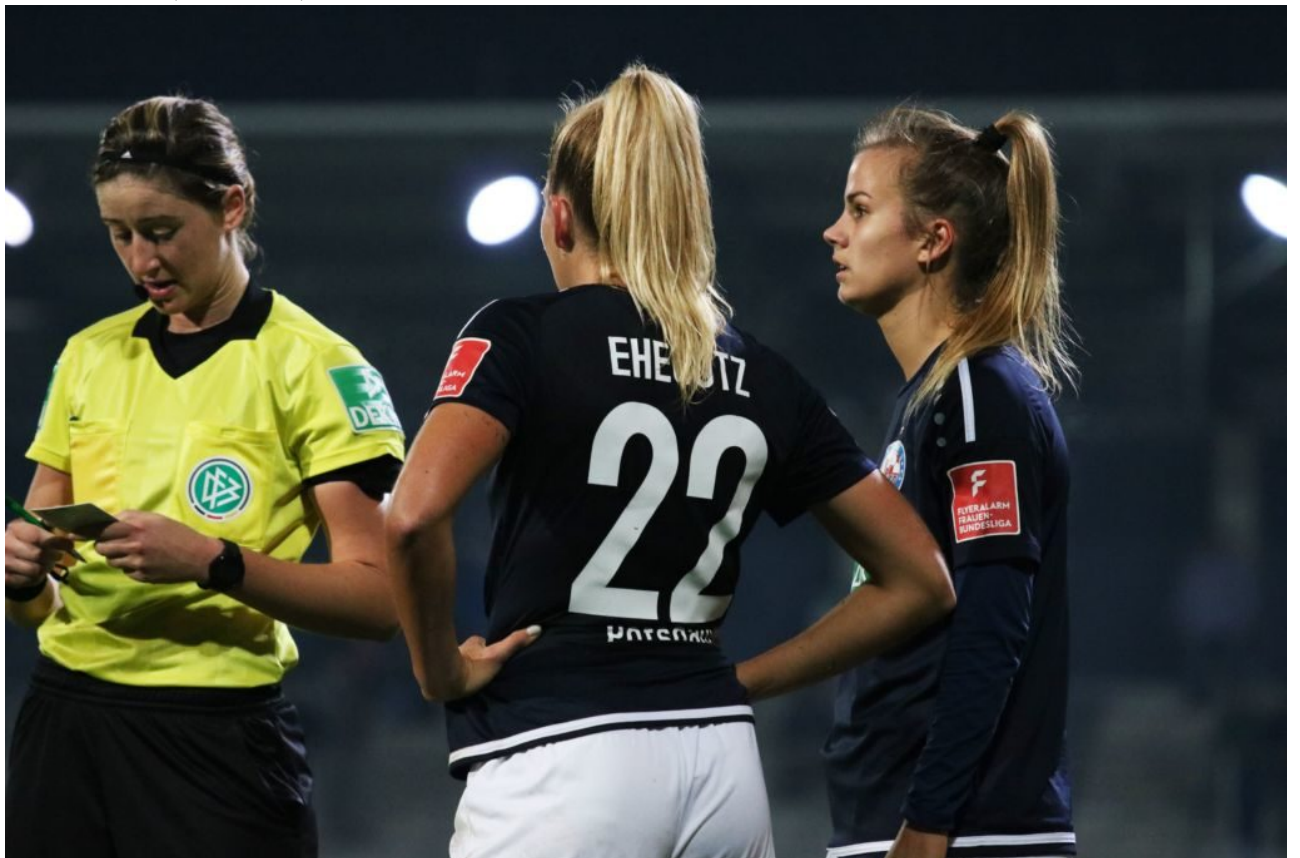
• Ich notiere mir das gleich mal: „Das war kein Abseits“