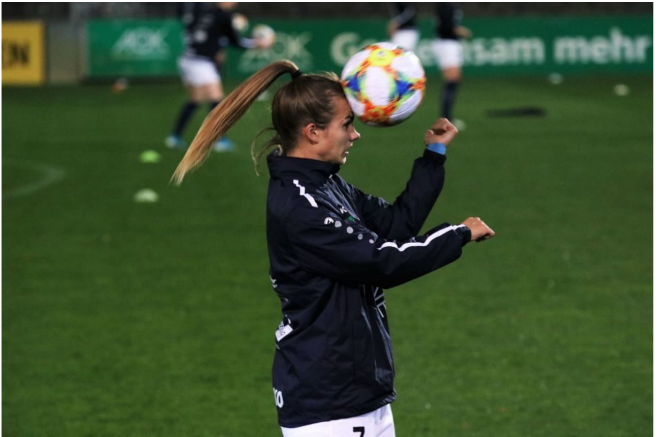
• Lieber einen Ball statt Brett vorm Kopf