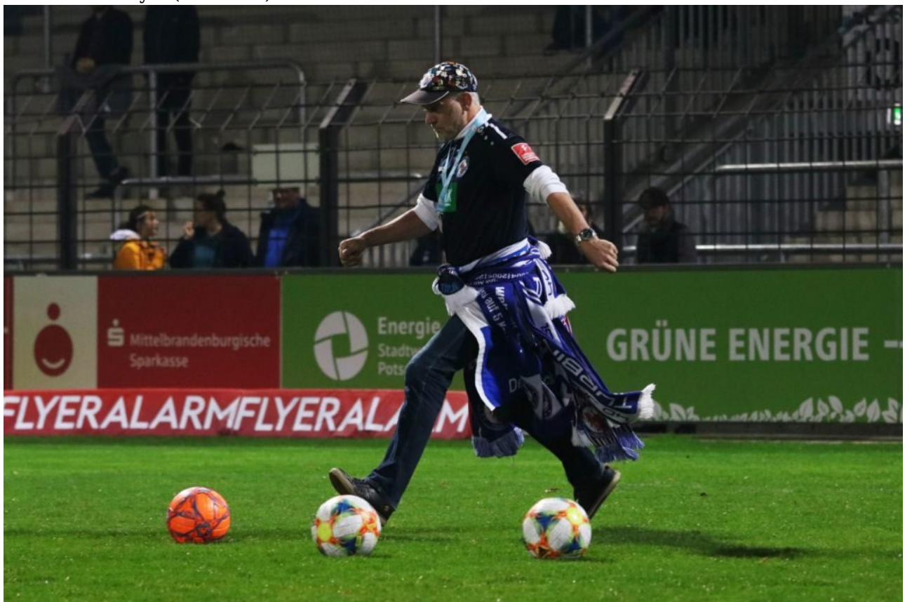
• Mit fliegenden Fahn.. äh Schals zum Sieg