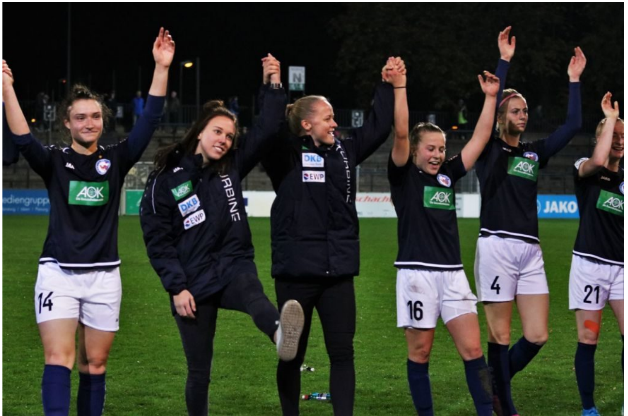
Tory im Cancan-Feeling