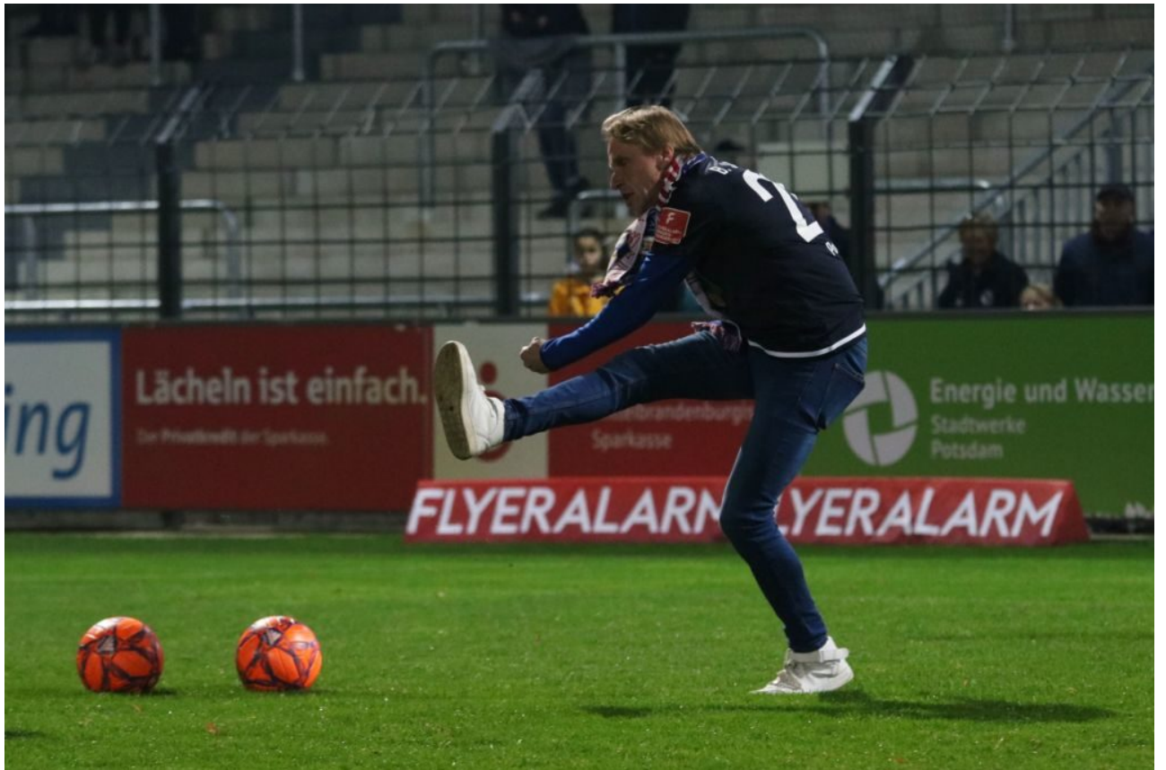
• Totaler Profistyle