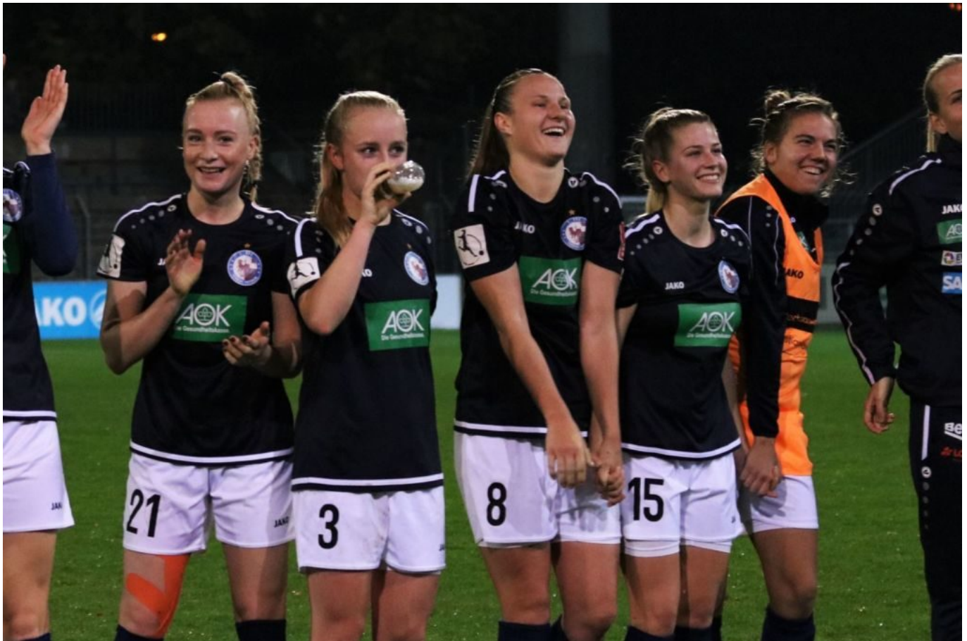
Auf den Zittersieg eine Nuckelflasche

Der Sportbuzzer verkündete Stunden später euphorisch, dass Turbine Potsdam nun auf den 8. Platz gesprungen sei. Aber da verweilten das Team bereits vor dem Spiel. Somit wäre es korrekter zu verkünden, dass Turbine derweil auf dem 8. Platz herumspringe.