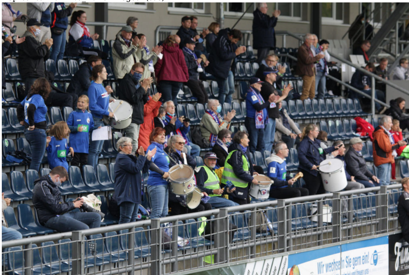
Turbinefans feiern das 2:0 (cna)