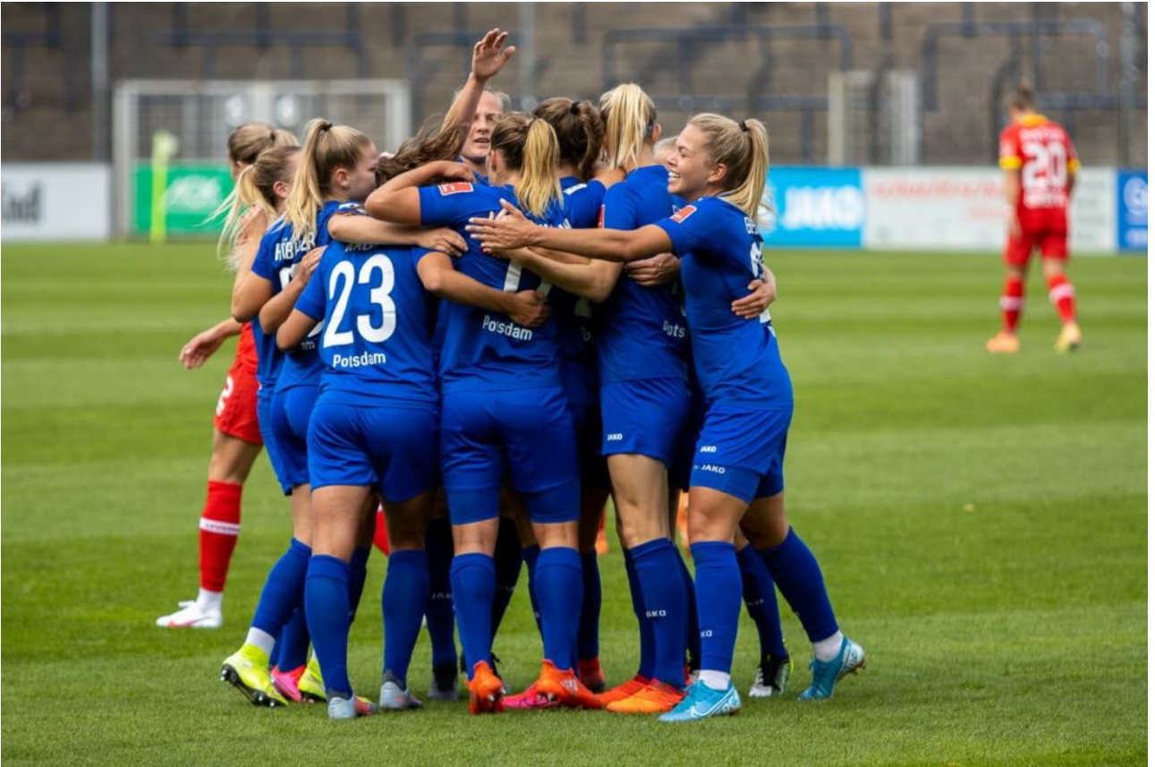
• Torjubel (sas)