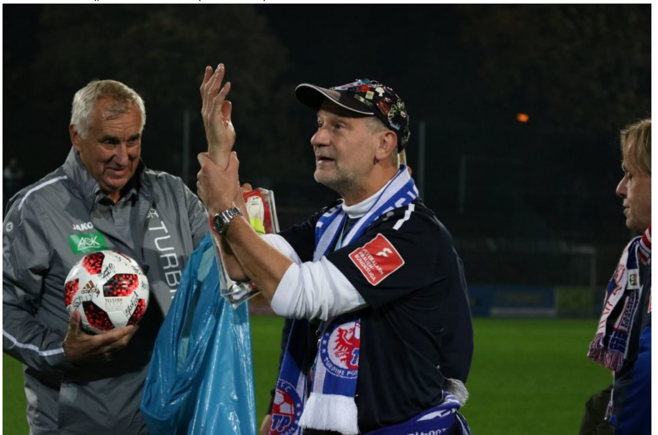
• Zwar keine goldenen Füße, aber für goldene Hände