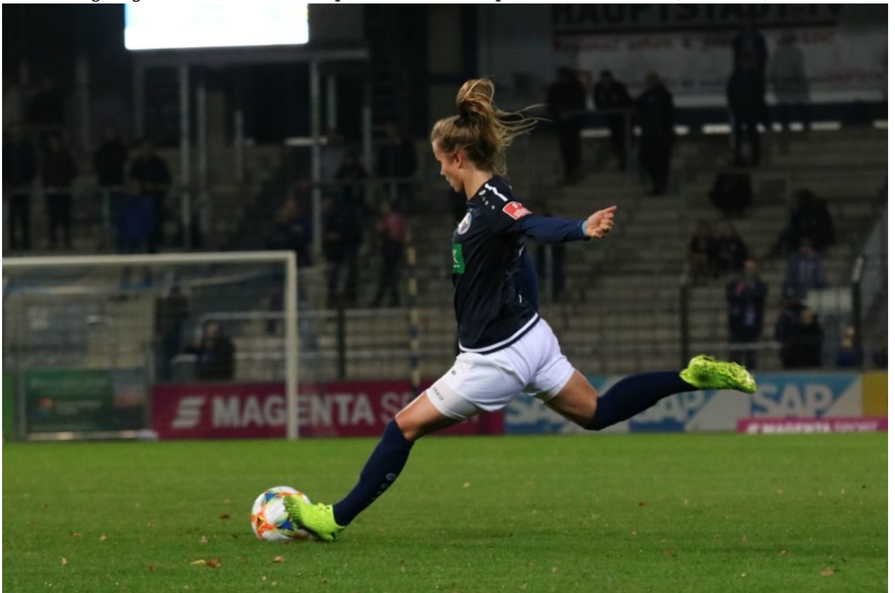
• Feuer frei aufs leere Tor