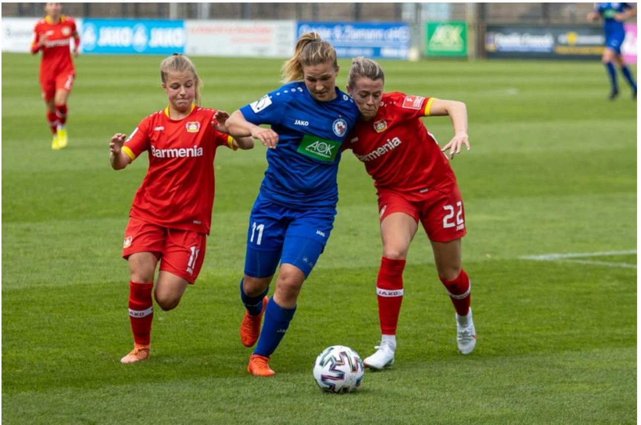
• In die Zange genommen (sas)