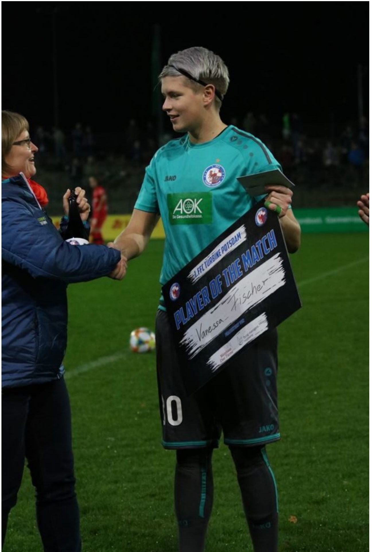
• Wer sonst, wenn nicht die, die keine Schmerzen kennt