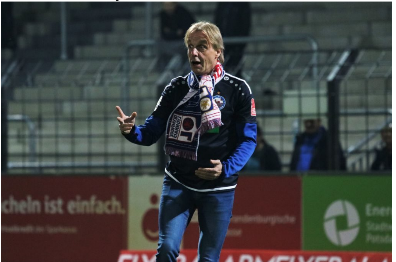
• Was - dreimal daneben?!