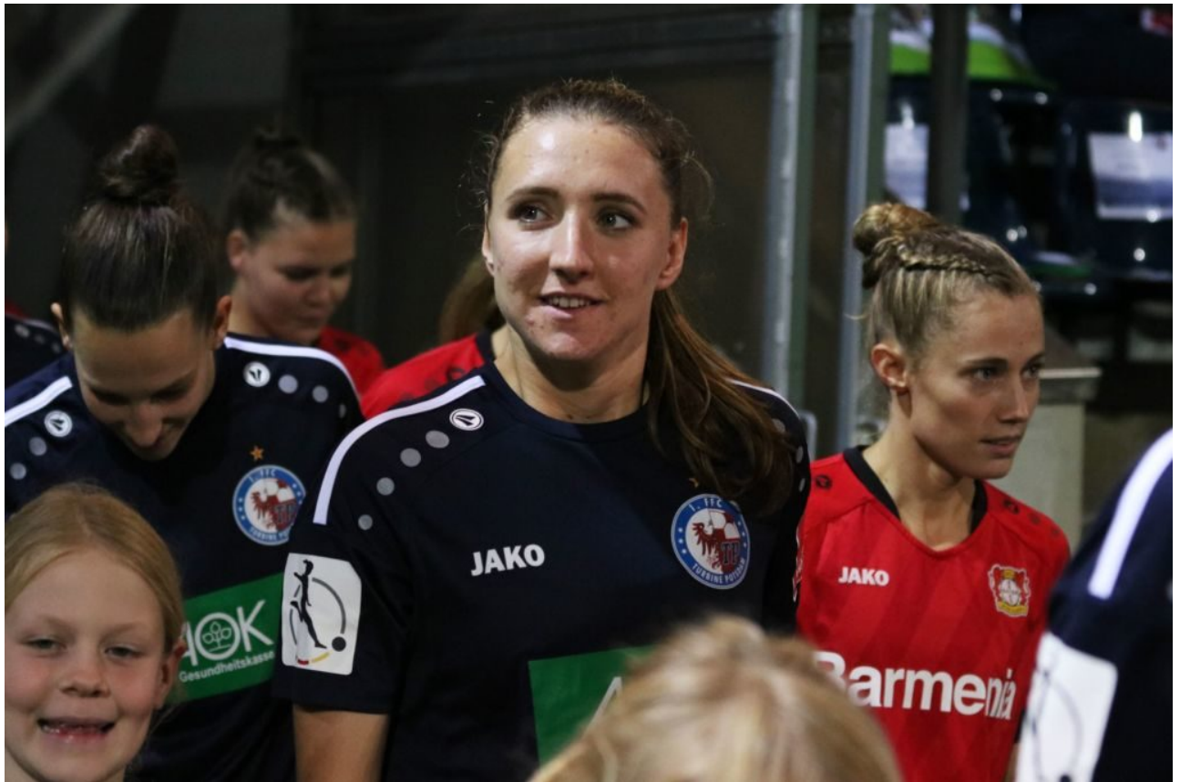
Lara am Start