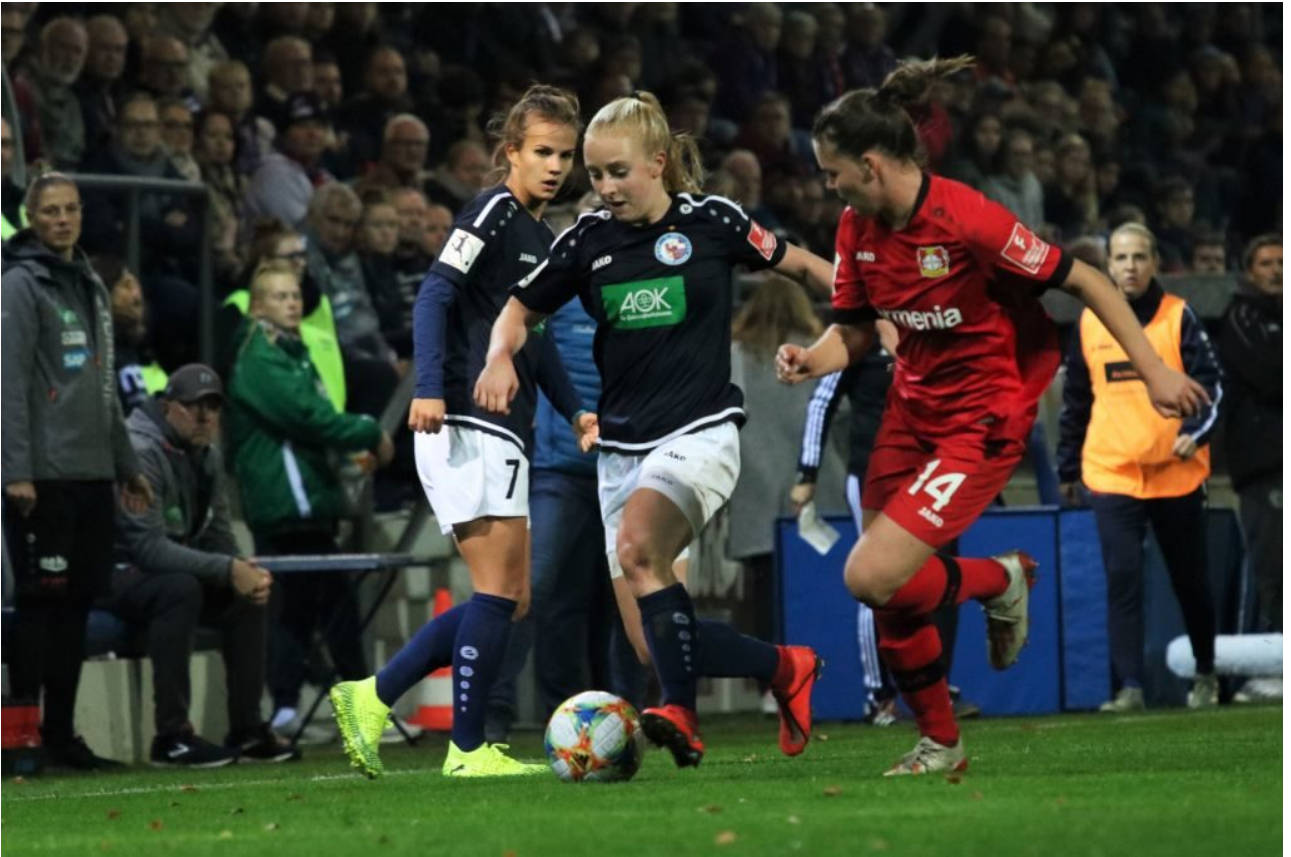
• Zweikampfsiegerin mit Garantie