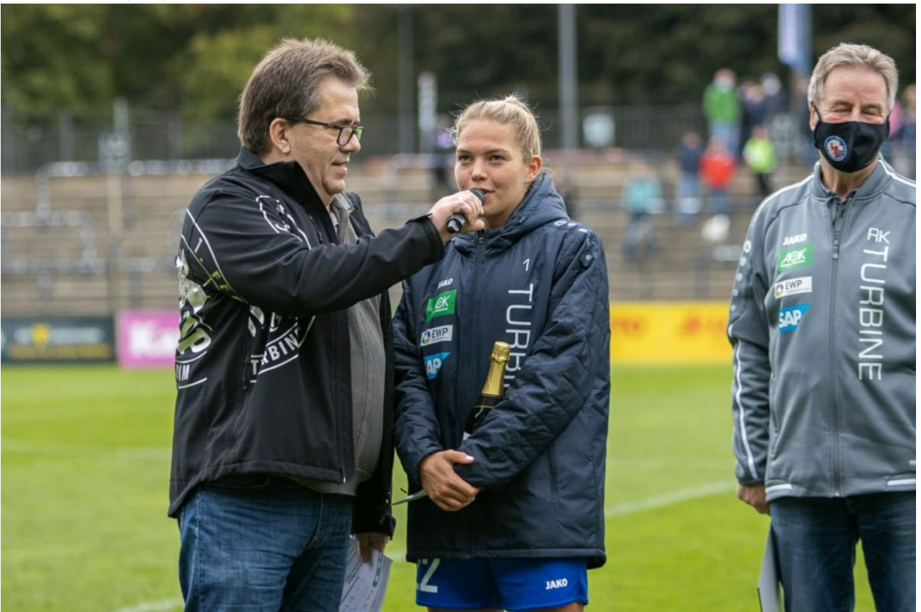
• Nina Spieleinschätzung (sas)