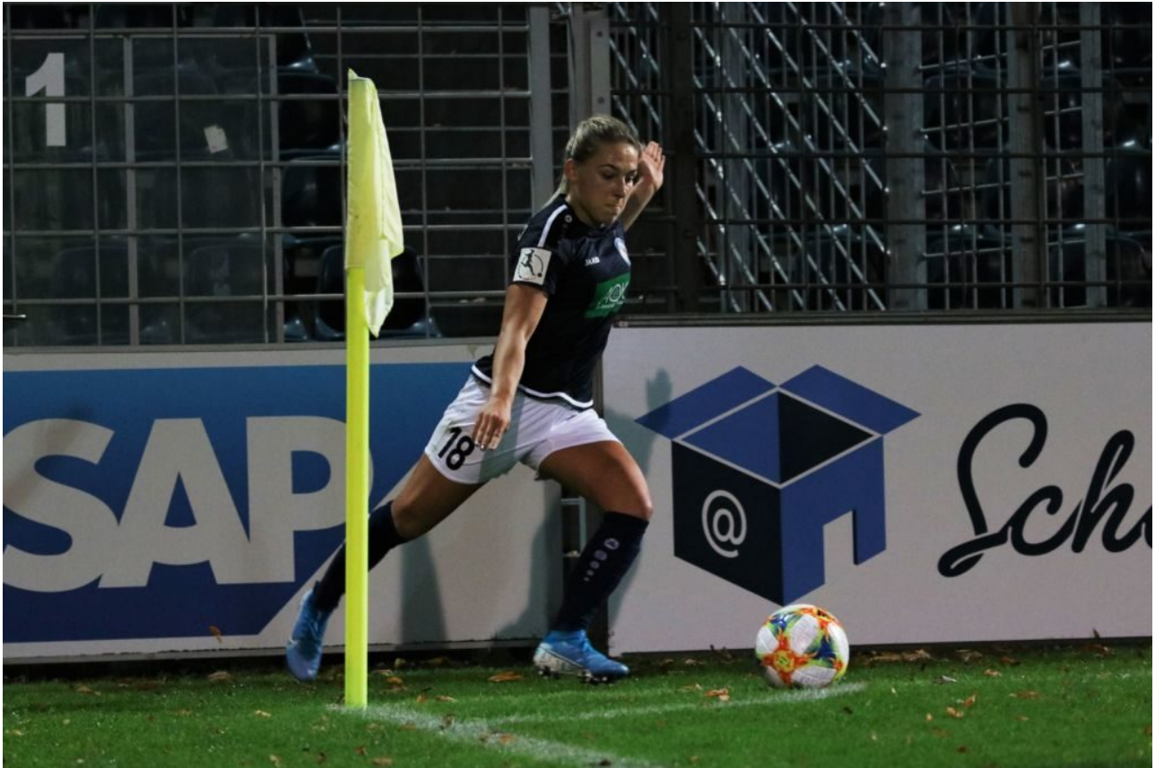
• Stretching an der Eckfahne