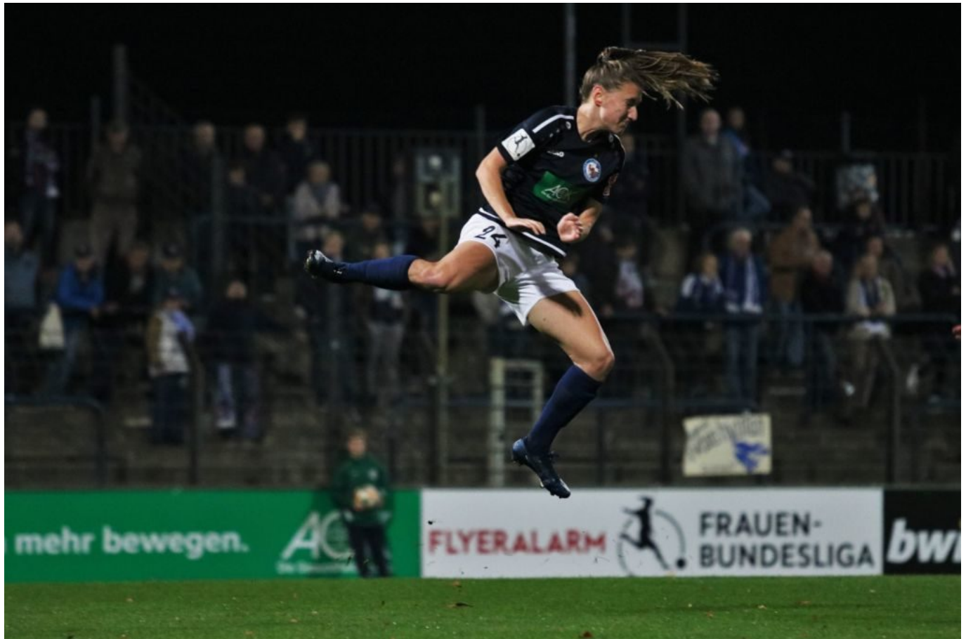
Werbung für Flyeralarm