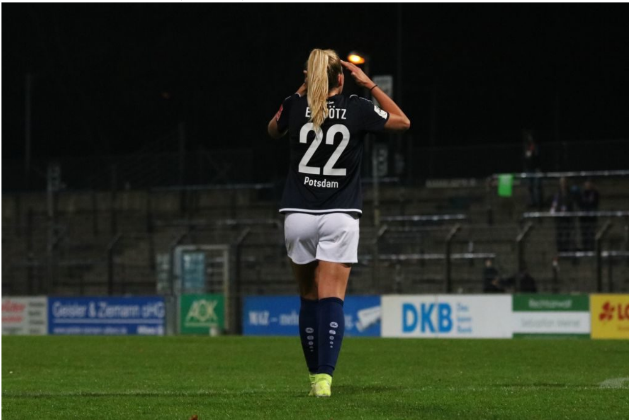
• Das ist so bescheuert