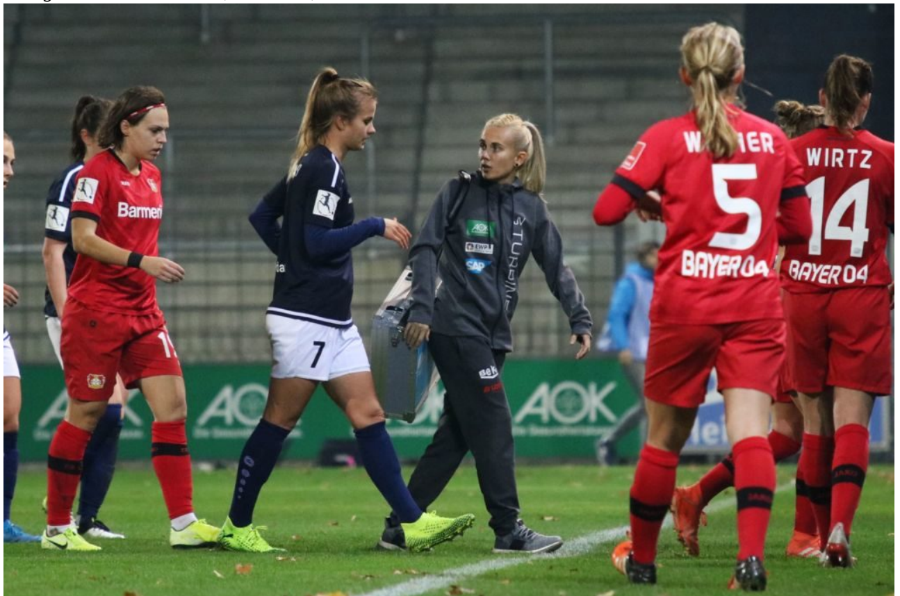
Immer gut betreut