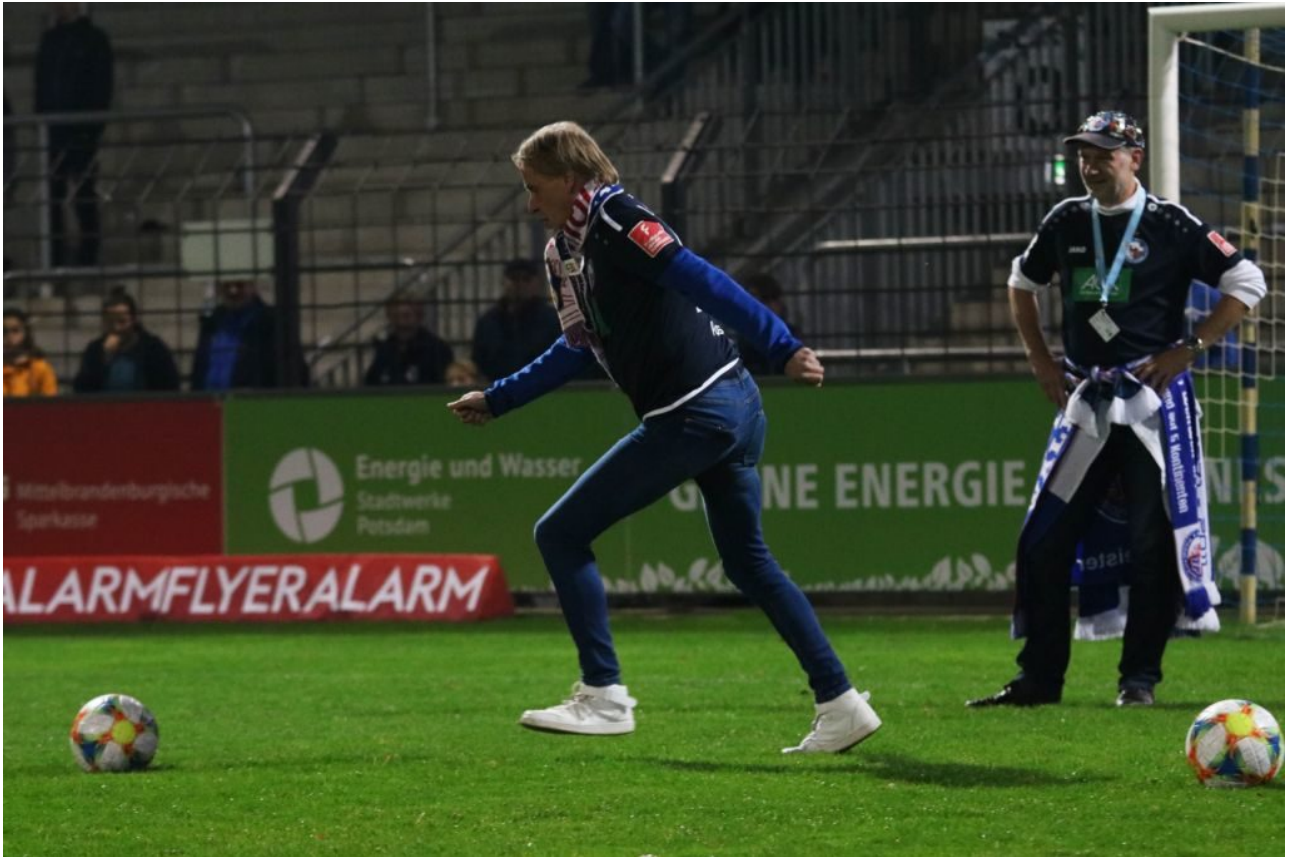
• Alles eine Sache der Haltung