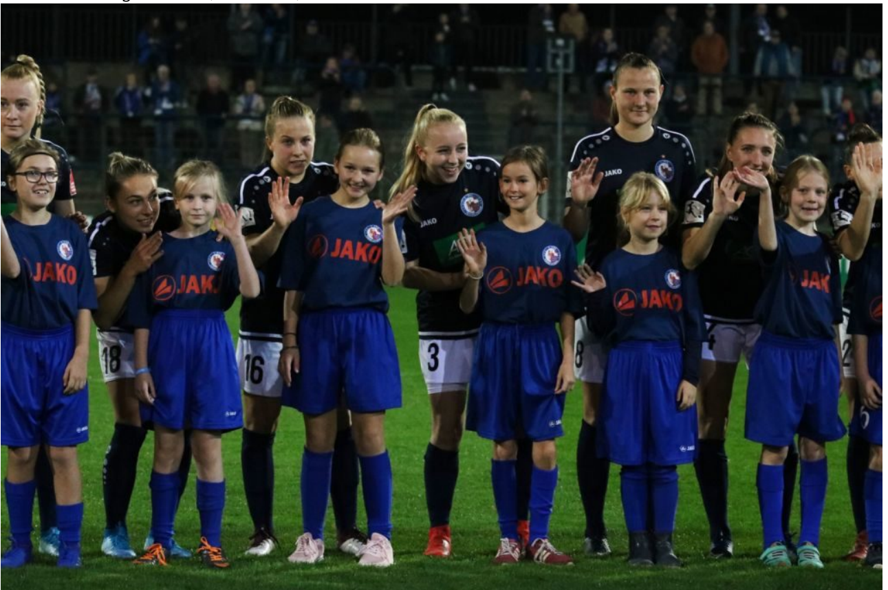
• Fröhliches Herumgewinke