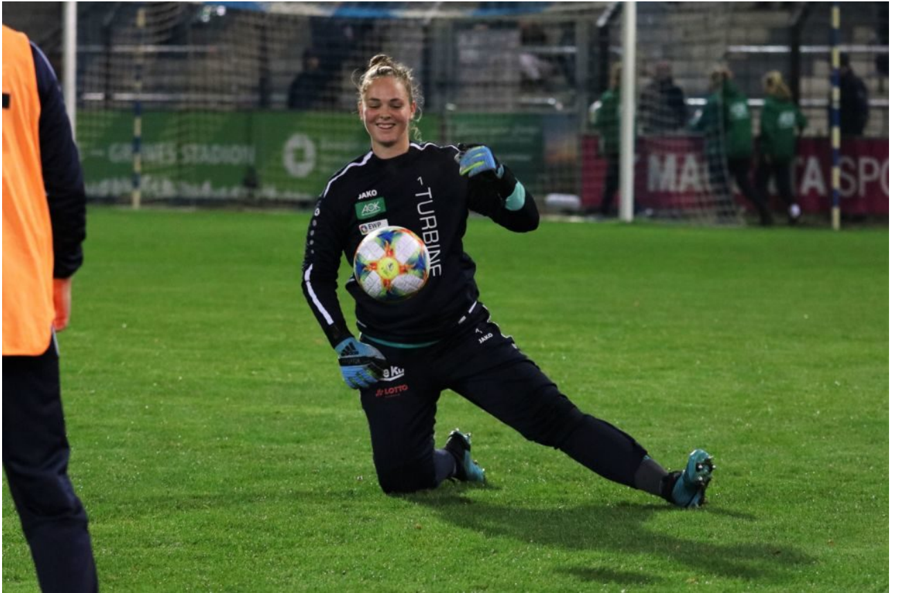
• Magische Ballbeschwörung