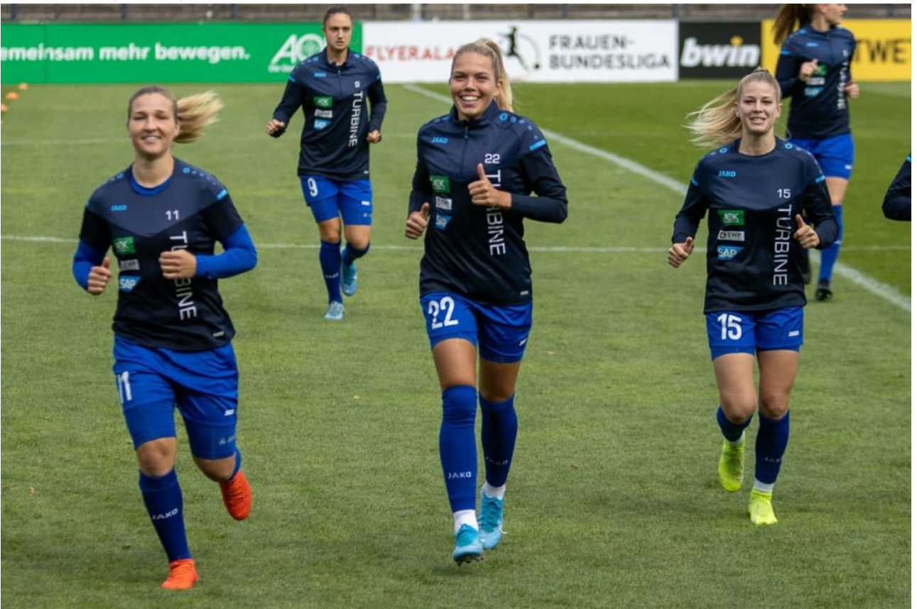
• Lächelndes Einlaufen (sas)