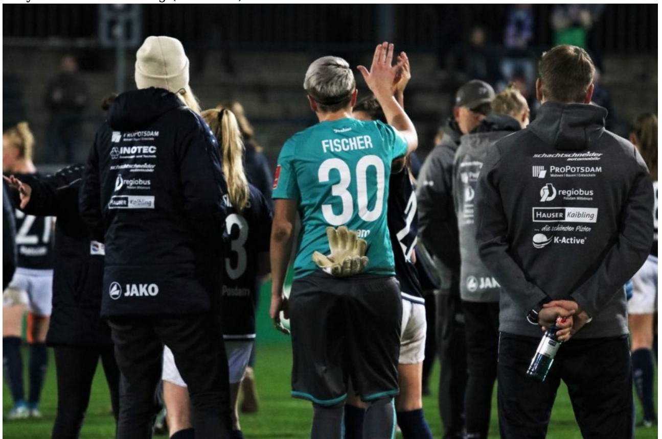
Fischis großer Abend