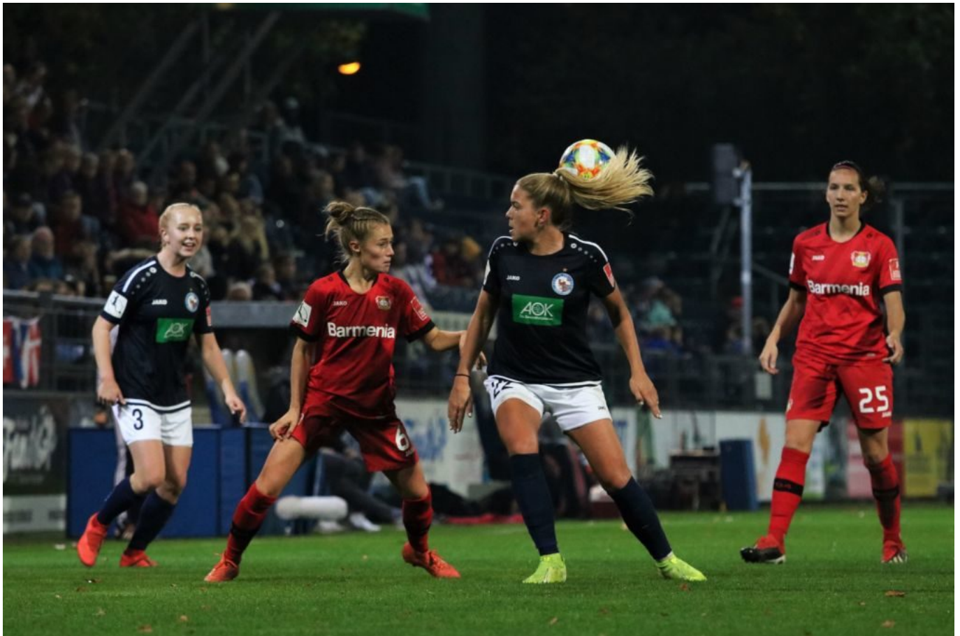
Der neue Haarstyle der Frauenbundesliga

Leverkusen präsentierte sich als „gefühlte Elf“ und kämpfte unverhohlen weiter. Und je weiter der Minutenzeiger tickte, agierten die Potsdamerinnen immer nervöser. In den vergangenen Spielen hatten die blutjungen Torbienen gelernt, wie man souverän mit fetten Rückständen umgeht. Aber wie man ebenso cool eine 1:0-Führung nach Hause holt, das schien ihnen fern.