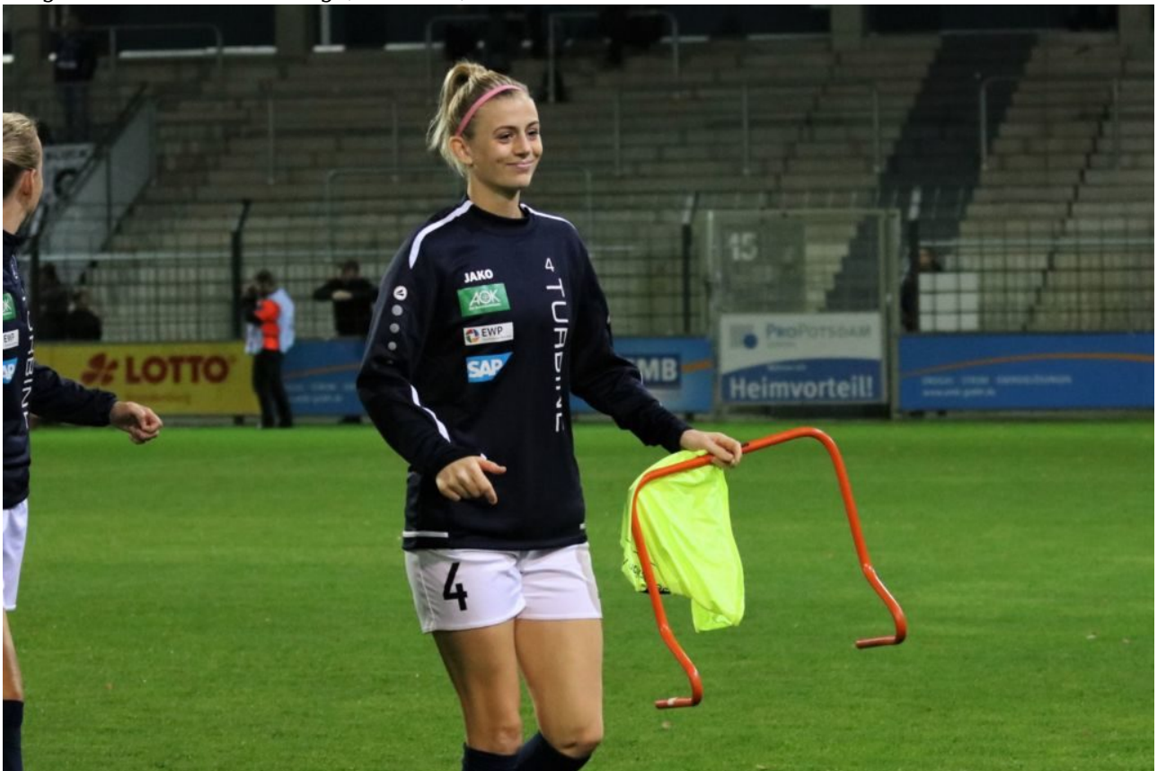
• Ist zwar kein Feuerreifen, mag aber trotzdem jemand durchspringen?