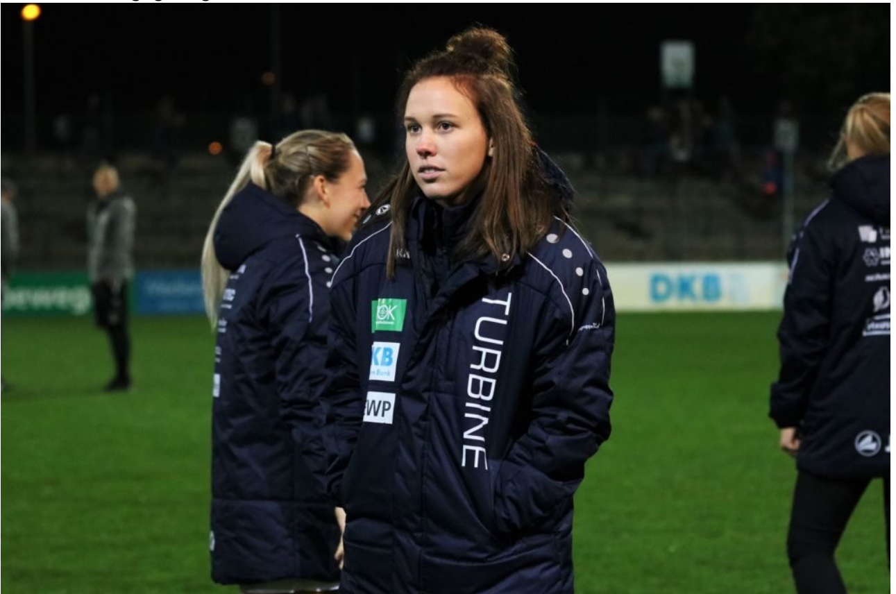
• Mach hinne, Tory, wir brauchen dich!