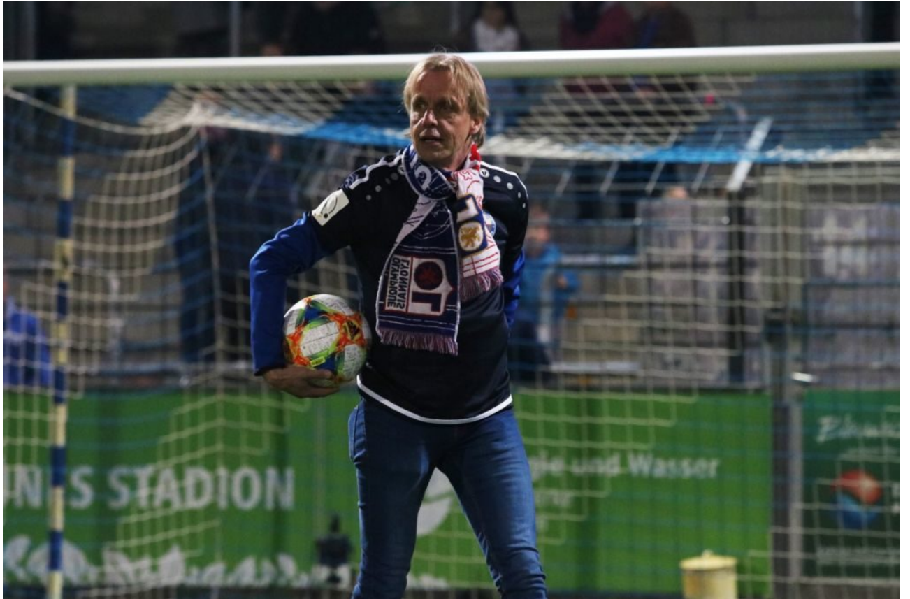
• Den nehme ich zum Andenken mit