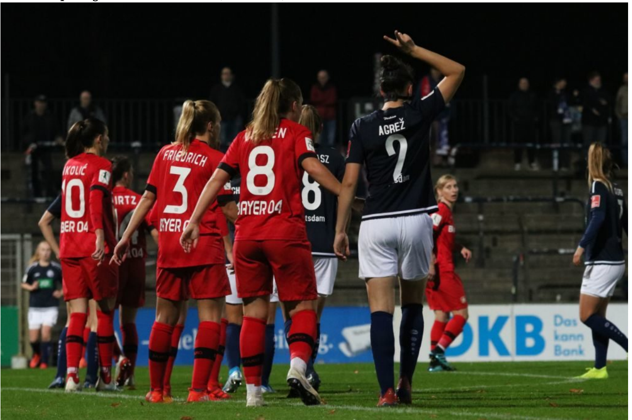
• Erst Victory - dann Kopfballtor