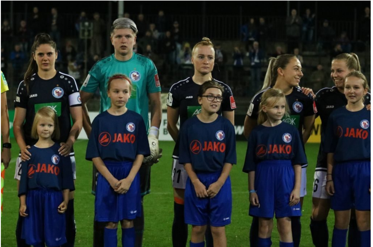
• Drei mit Fokus, zwei ohne