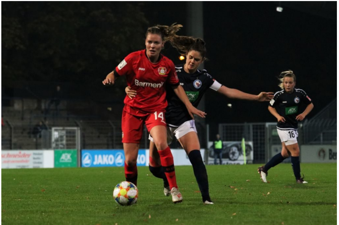
• Rutsch mal kurz ein kleines Stück beiseite