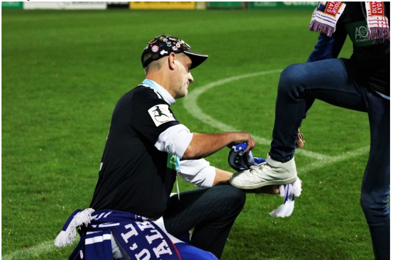
• Schuheputzen der Giganten