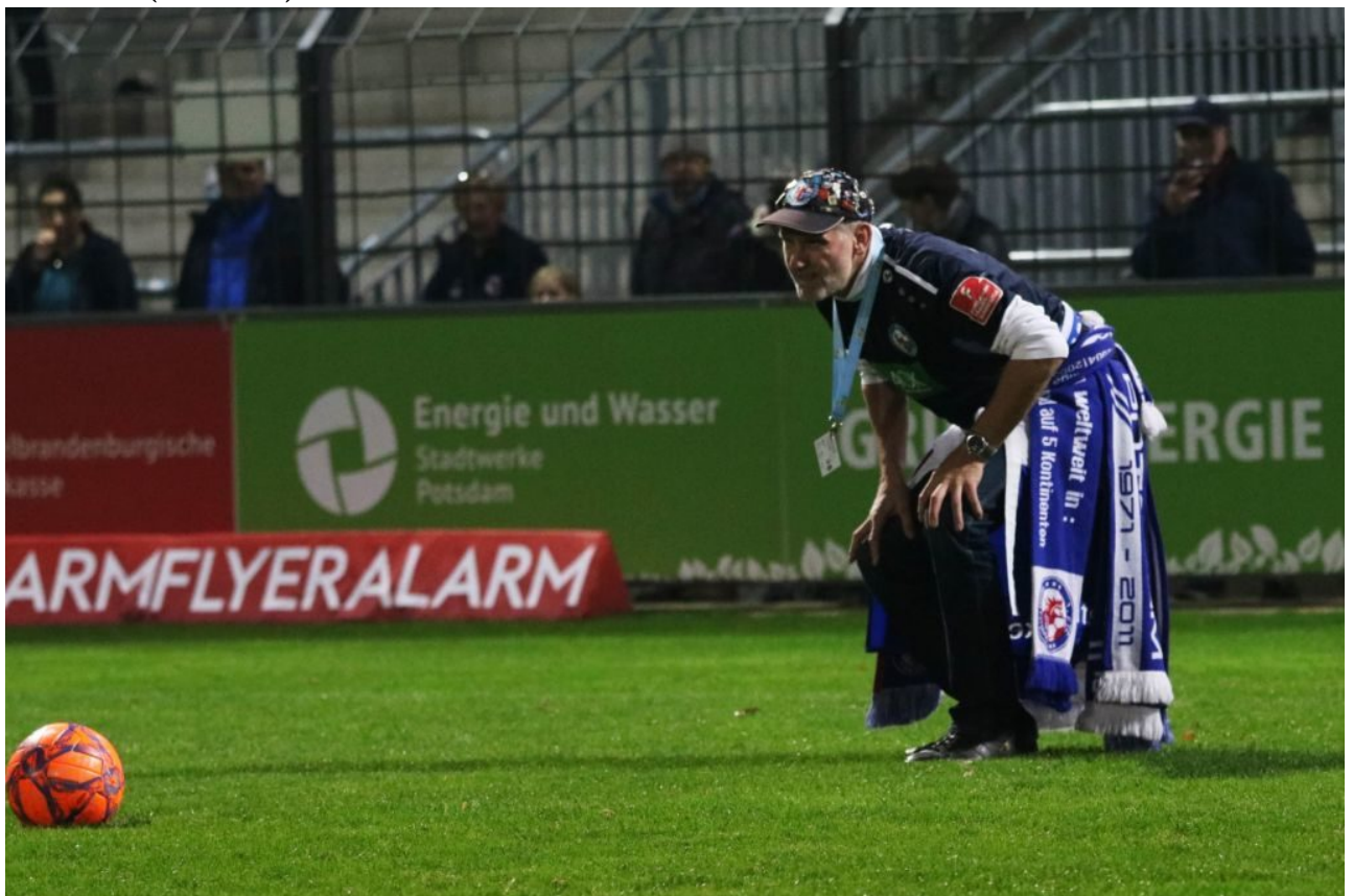
• Rasen-Curling (Daggi hat den Schrubber)