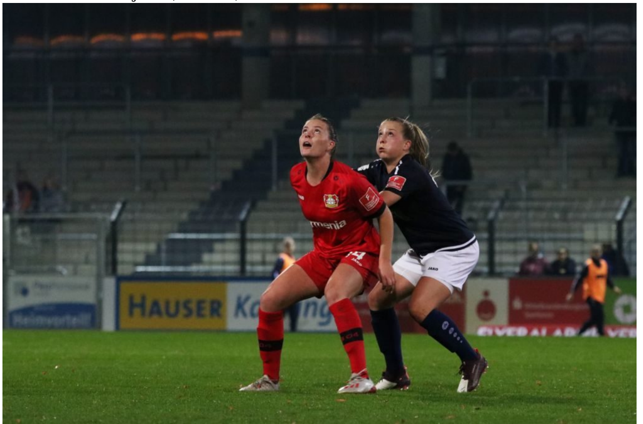
• Stoßgebet gen Flutlichthimmel