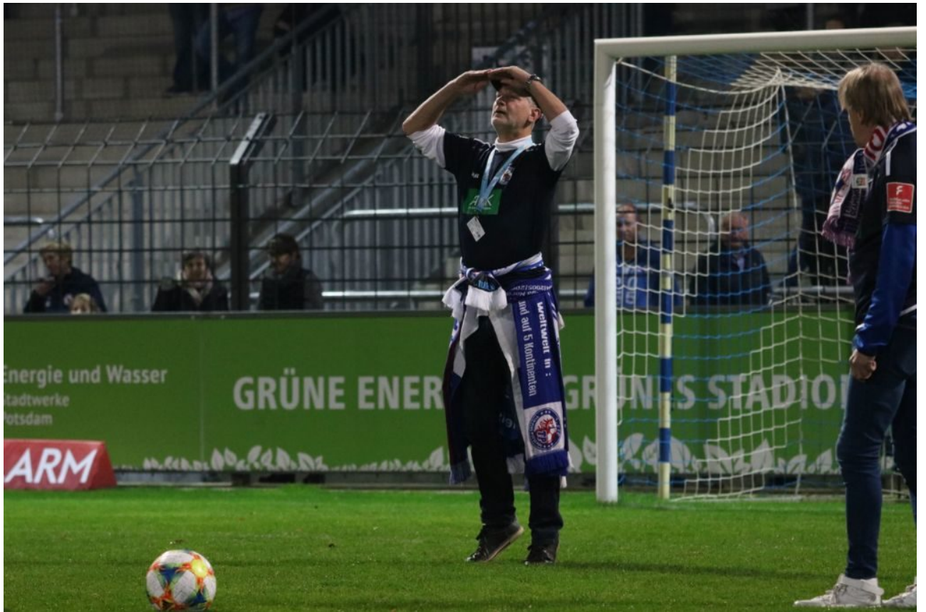
• Wo steht der „Rasen-Audi“?