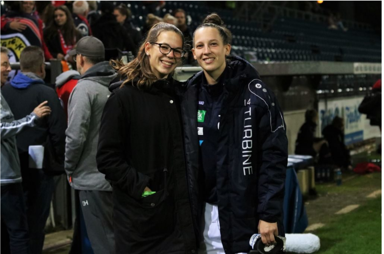
• Freudvolle Begegnung