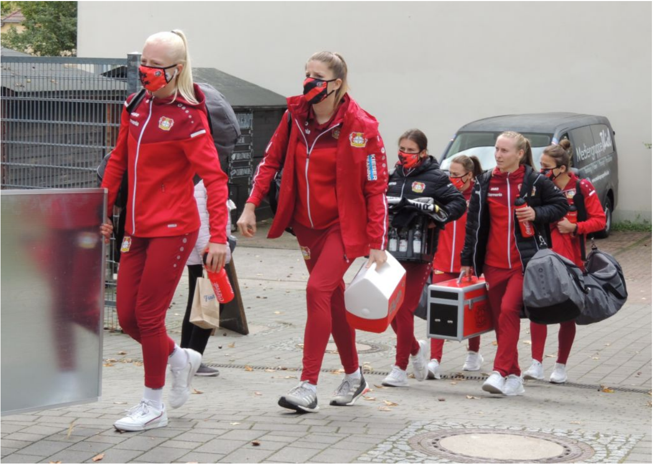
• Corona-Elf (beama)