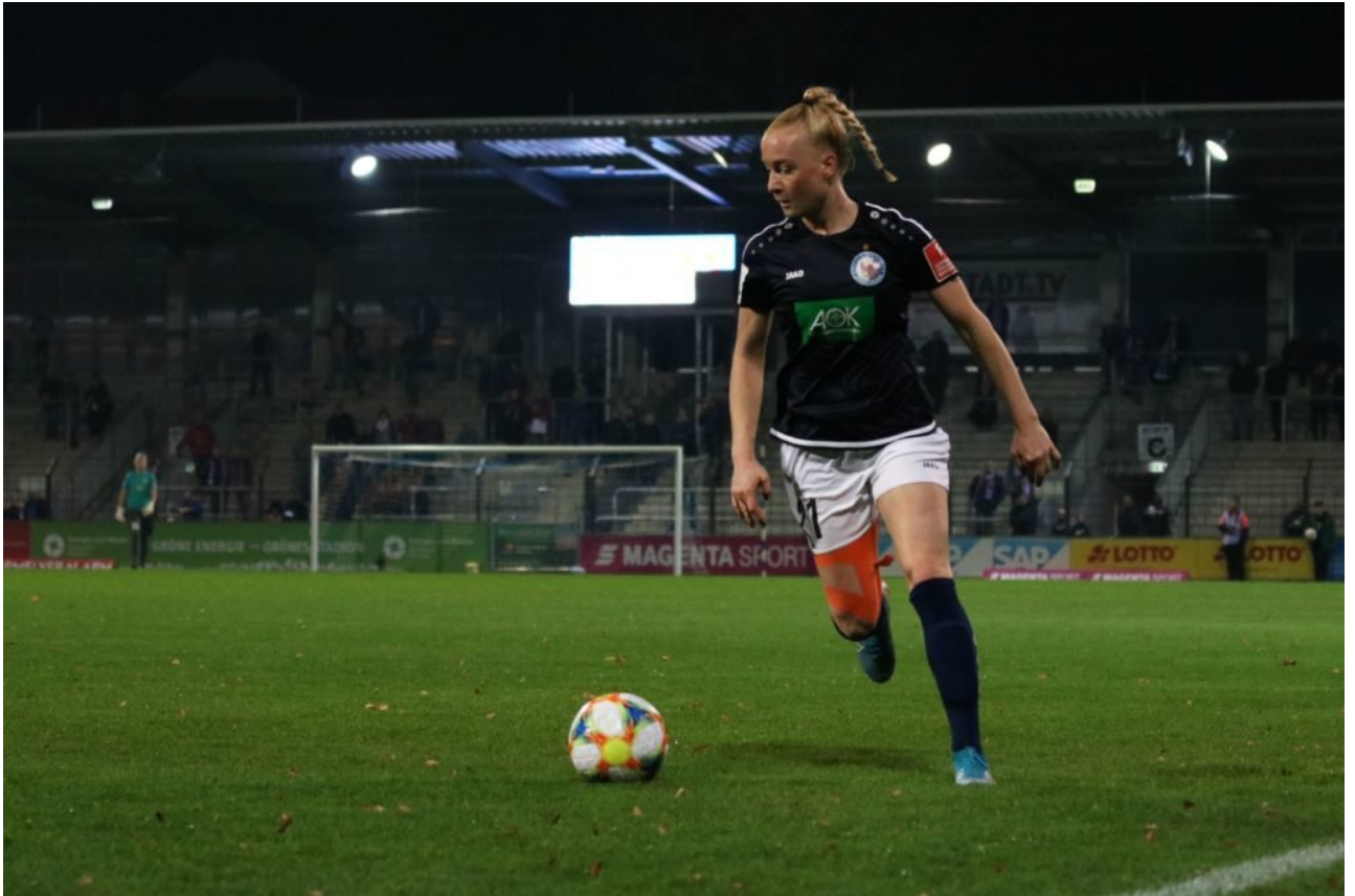
• Die Anzeigetagel ist seit Wochen kaputt - und das Tape lässt auch nach