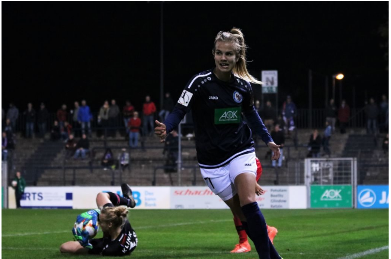
• So'n Mist