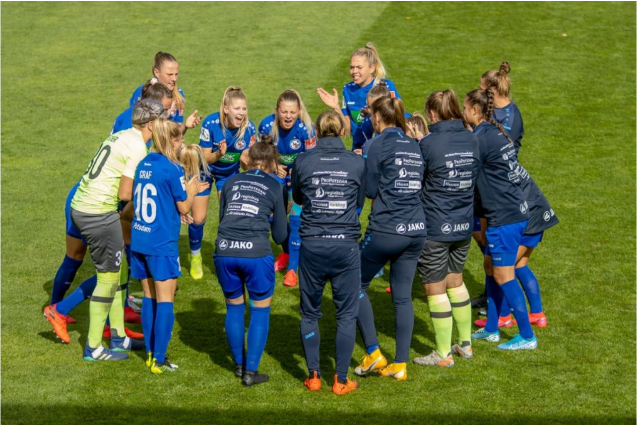
Motivationskreis ohne Regen (sas)