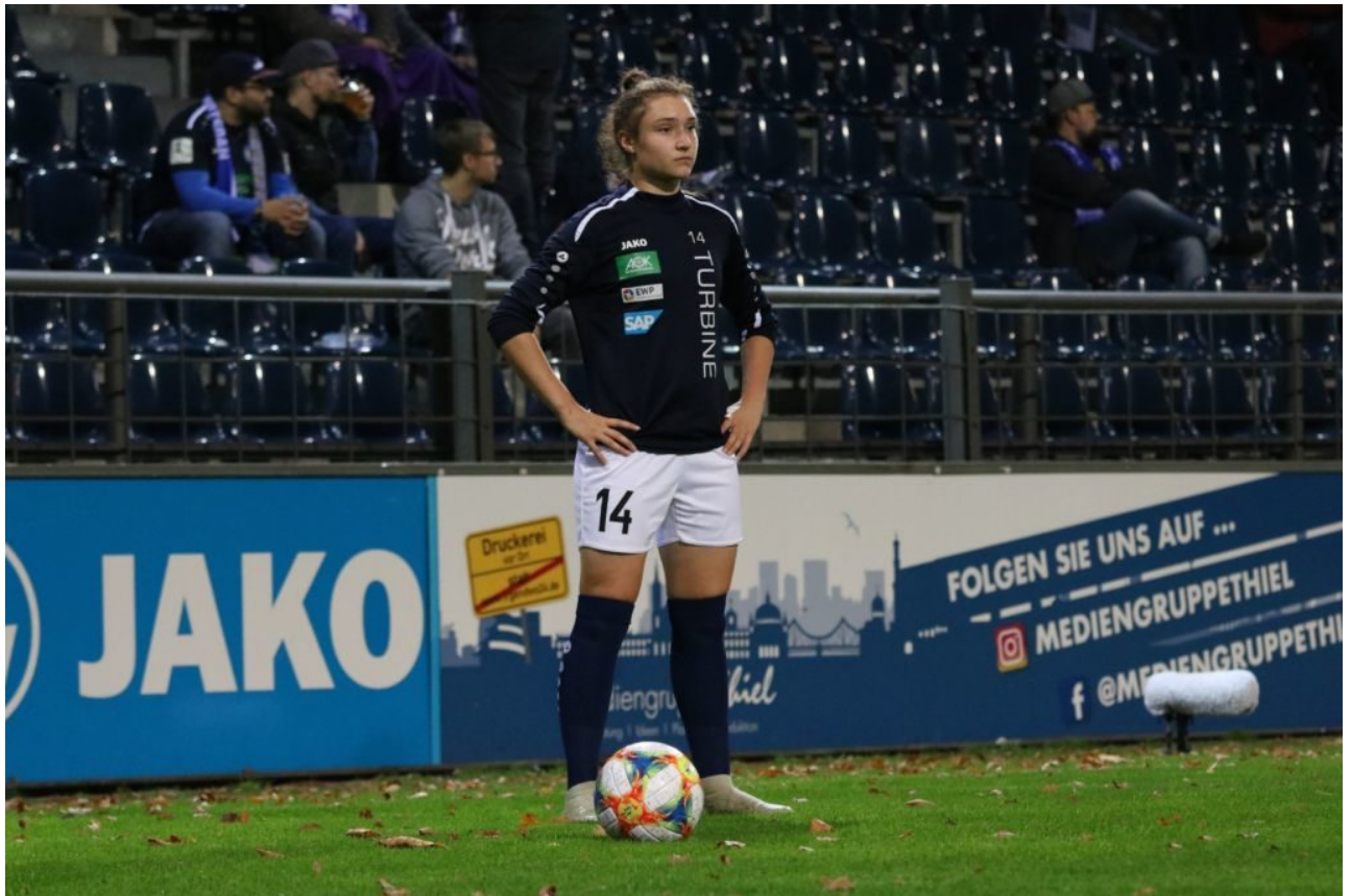
• Blick in eine grandiose Zukunft