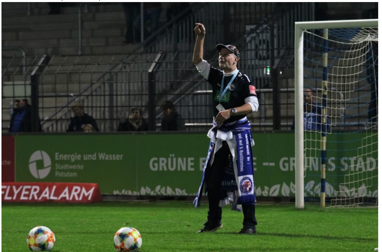
• Er kann bestimmt beidfüßig und gleichzeitig