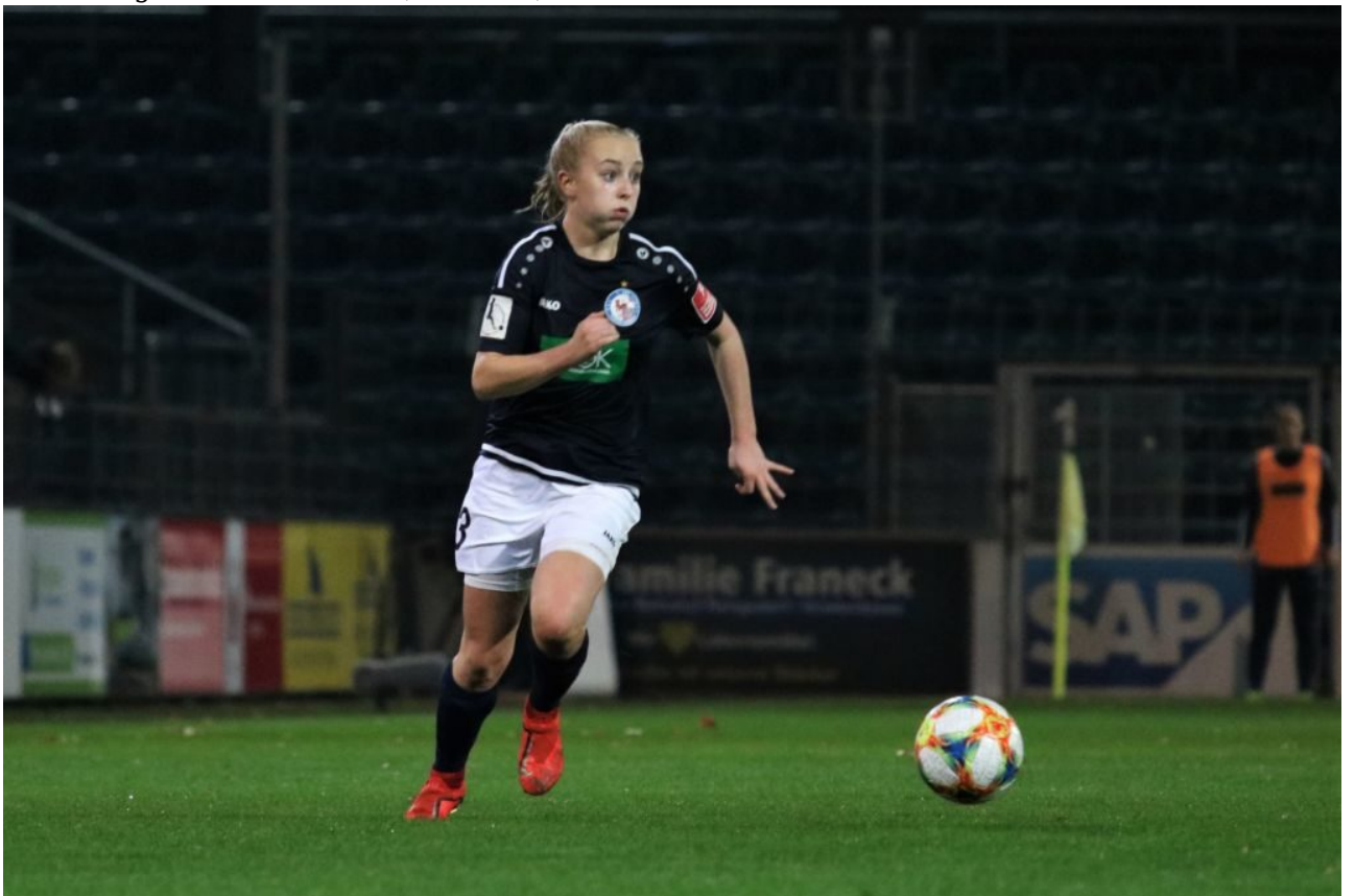
• Plusterbacke - Caros Markenzeichen