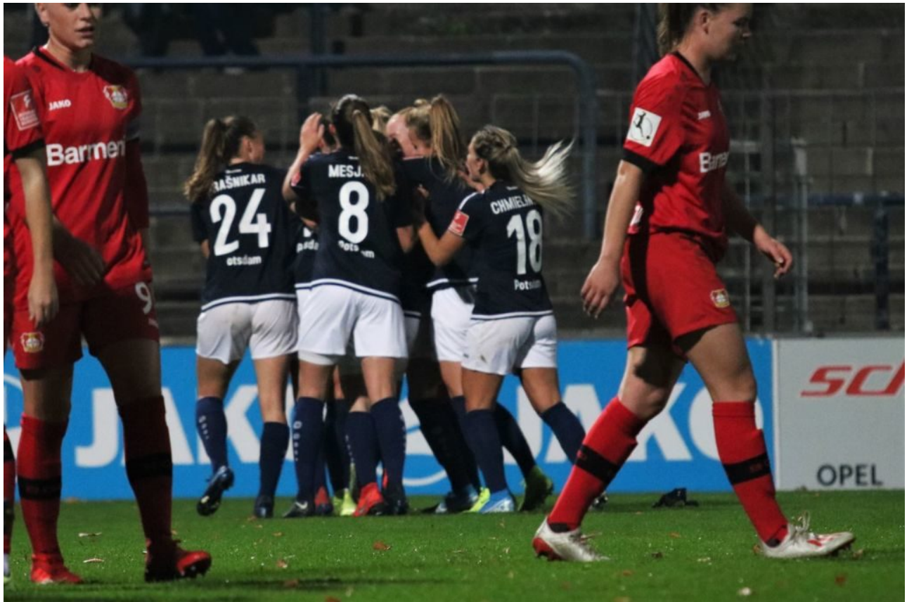
• Dazwischen ein Torjubel