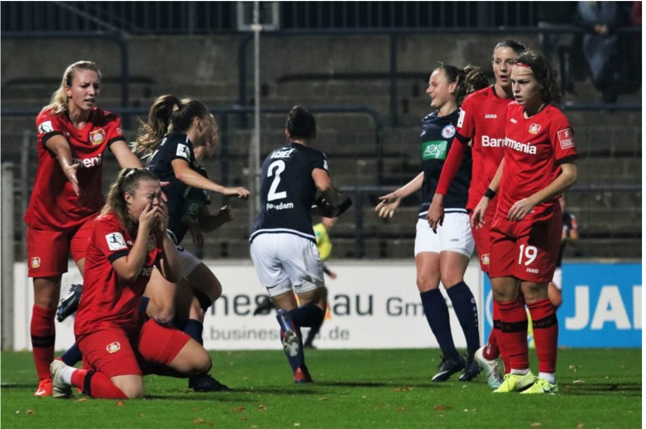
• Freud und Leid liegen dicht beisammen