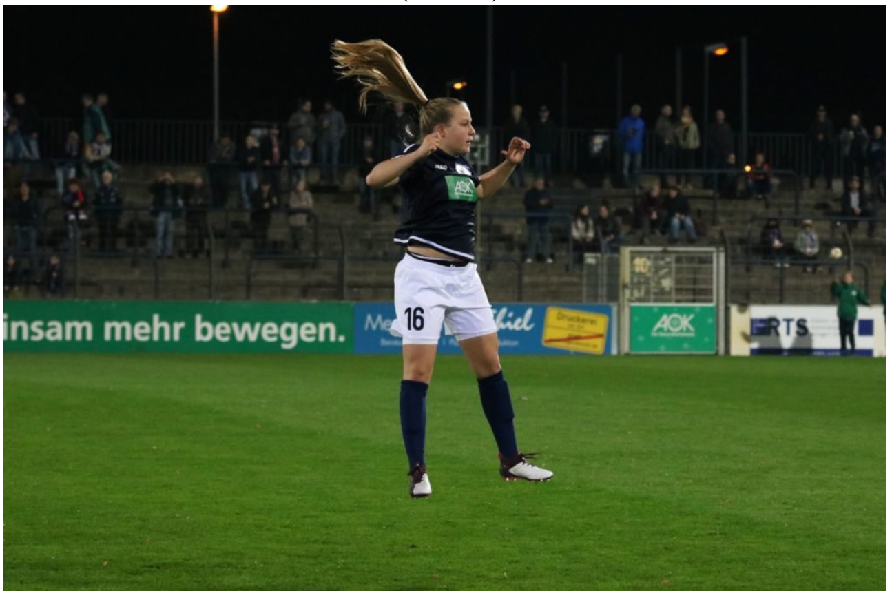
• Luca mit Schweif