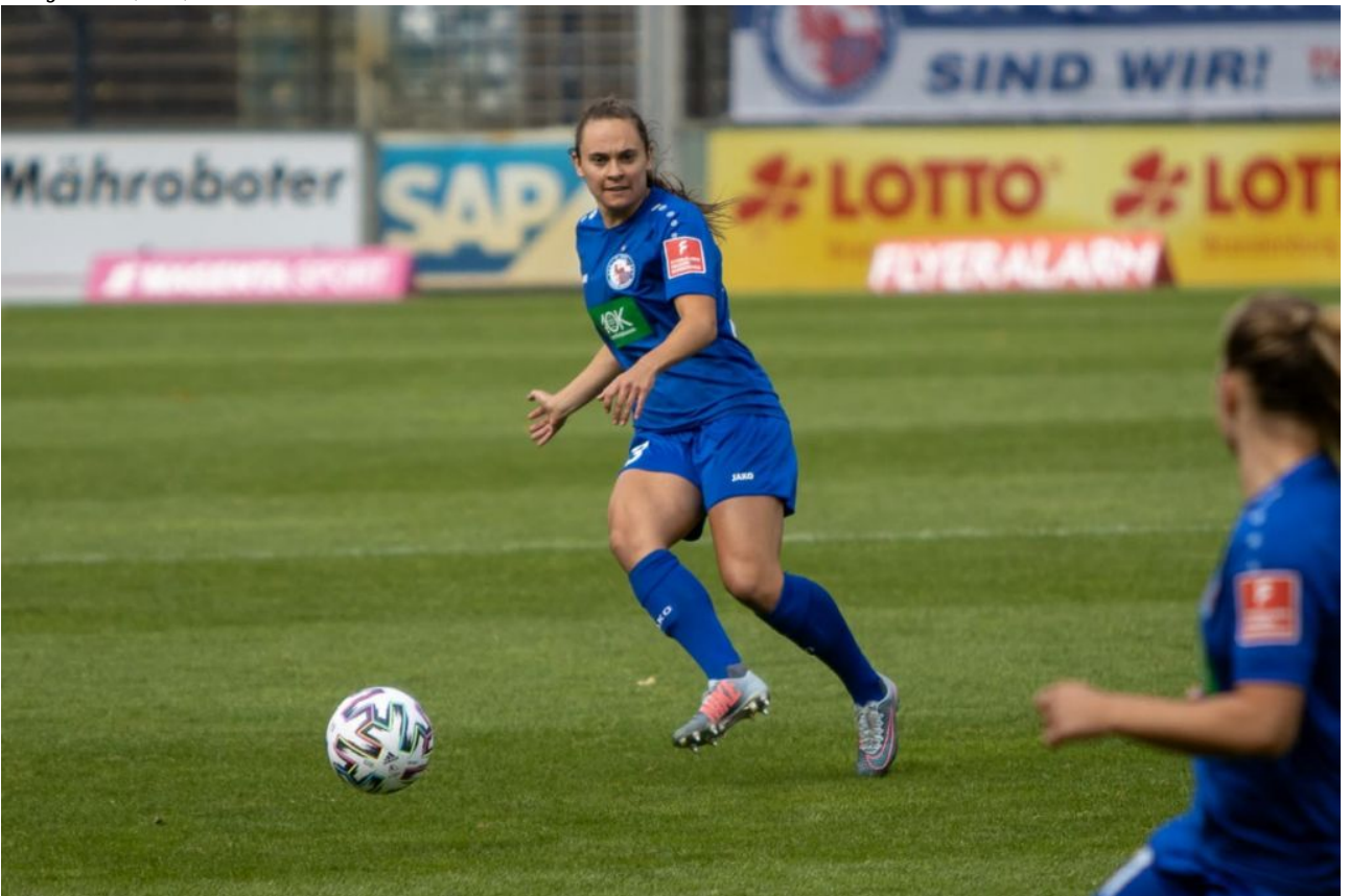
• Debütauftritt (sas)