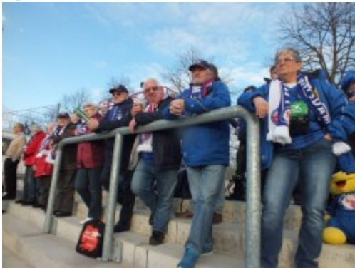
Fans am Start