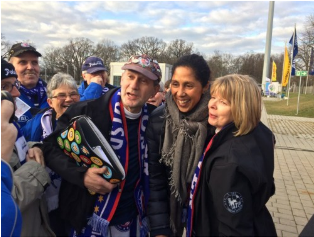
Immer wieder gern gesehen - Steffi Jones bei den Turbinefans

Wir sehen uns am 12. März, wenn sich der „Karli“-Rasen frühlingrün färben wird.