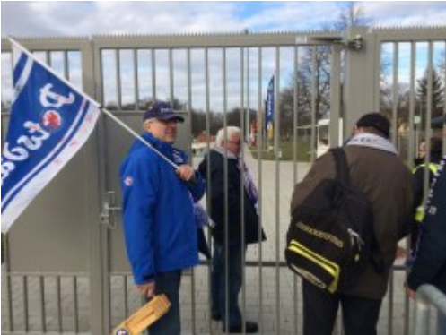
Vor und hinter Gittern