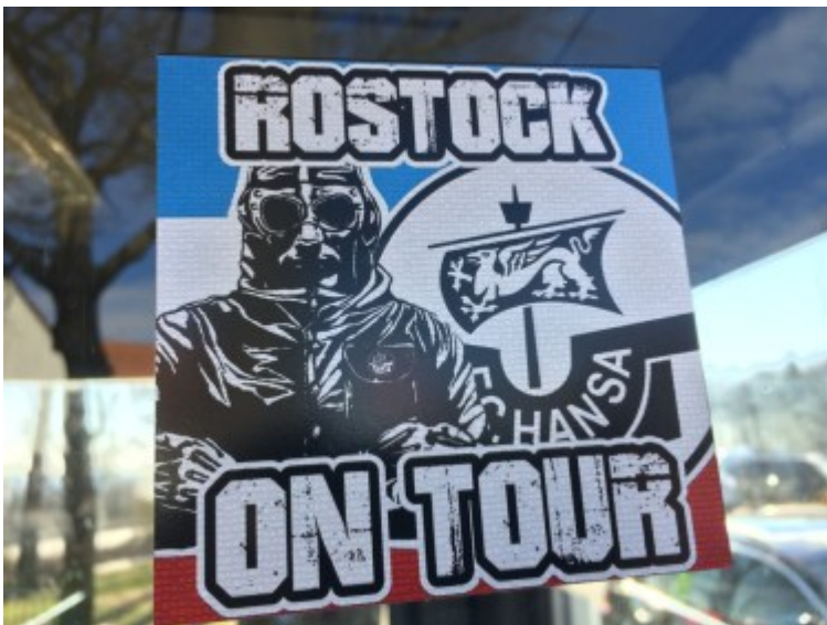
Aufklebergrüße von unterwegs