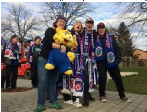
Jubel, Trubel, Heiterkeit