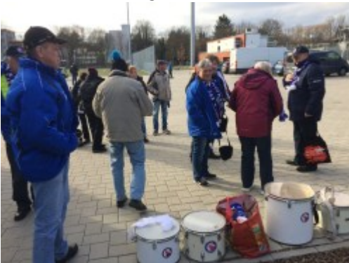
Ankunft in Frankfurt