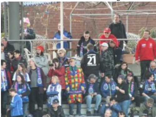
Clown-Auftritt zur Karnevalszeit