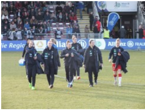
Die Ersatzspielerinnen laufen auf