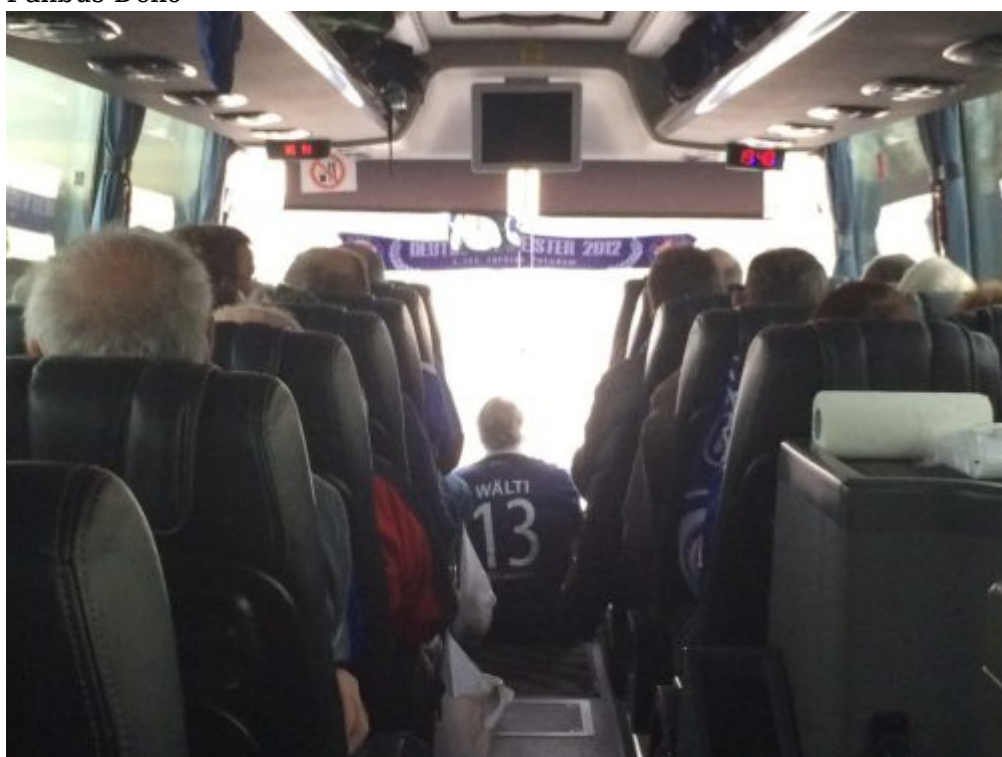
Lia an Bord