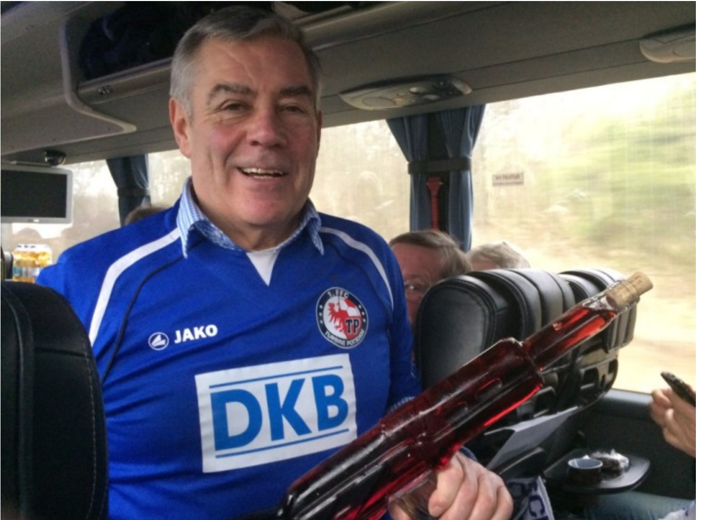
Bewaffnet - doch als Friedensheld