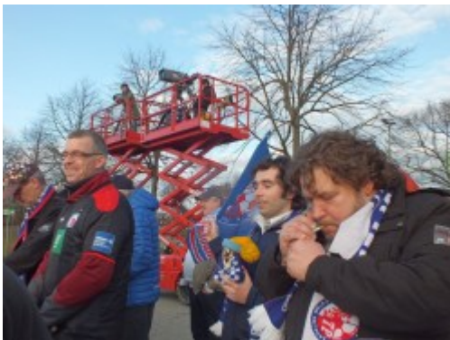
Mit Fernsehturm im Hintergrund