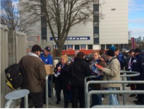
Warten auf die Stadionöffnung