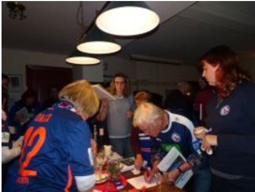
Große Nachfrage beim Fanbuch-Verkauf