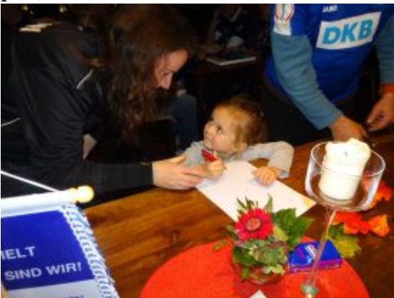
Turbinenachwuchs-Fan trägt sich in die Bestellliste ein