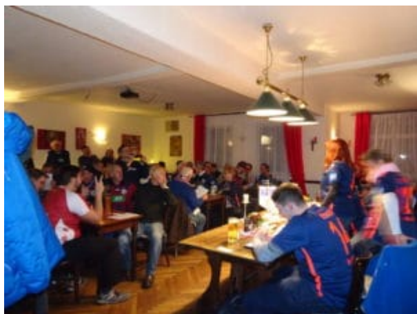
Mitgliederversammlung