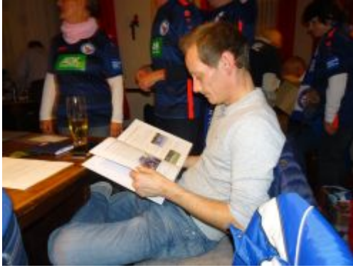
Der Geschäftsführer Sport von Turbine Potsdam ist vom Fanbuch vermutlich angetan