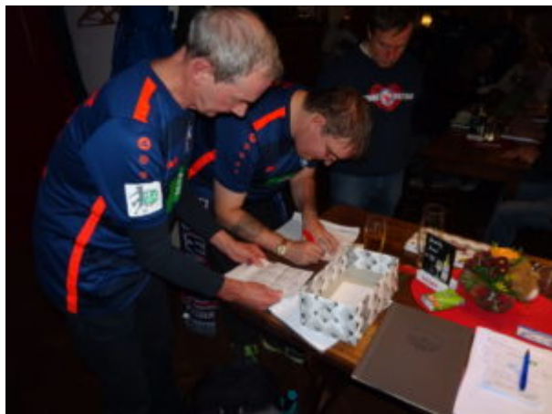
Auszählung der Stimmen