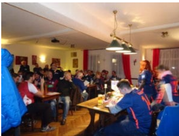
Mitgliederversammlung