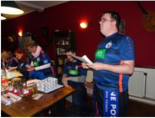
Die Wahlkommission in Aktion