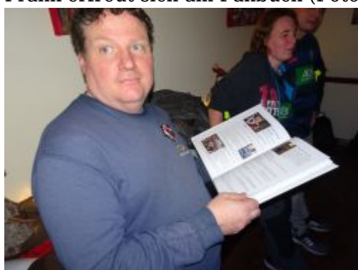
Dexy überlegt, sich unkritisch übers Fanbuch zu äußern