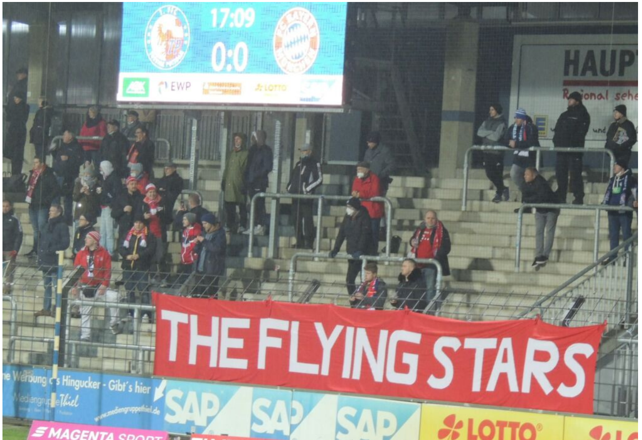
• neuer überdachter Standort der Bayern-Fans