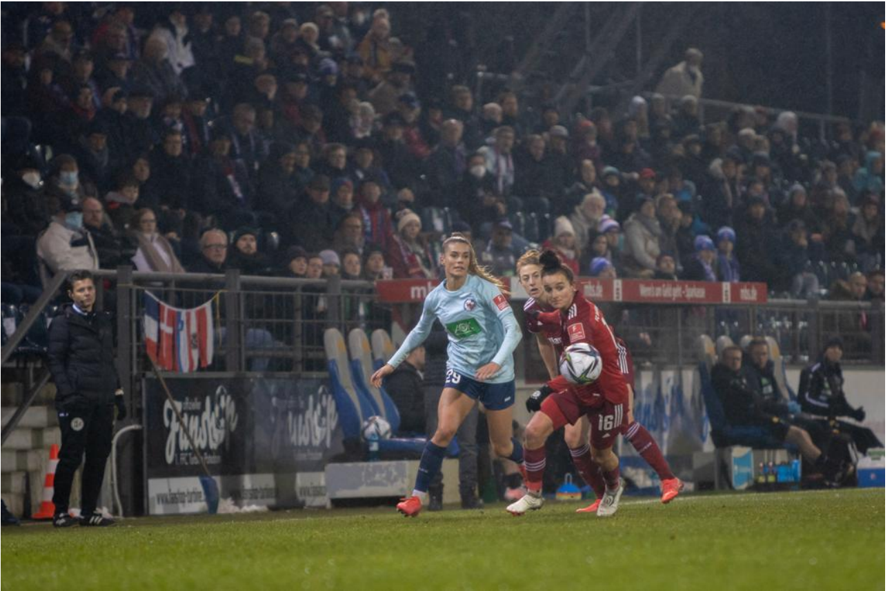
• Ein Ball - drei Blicke