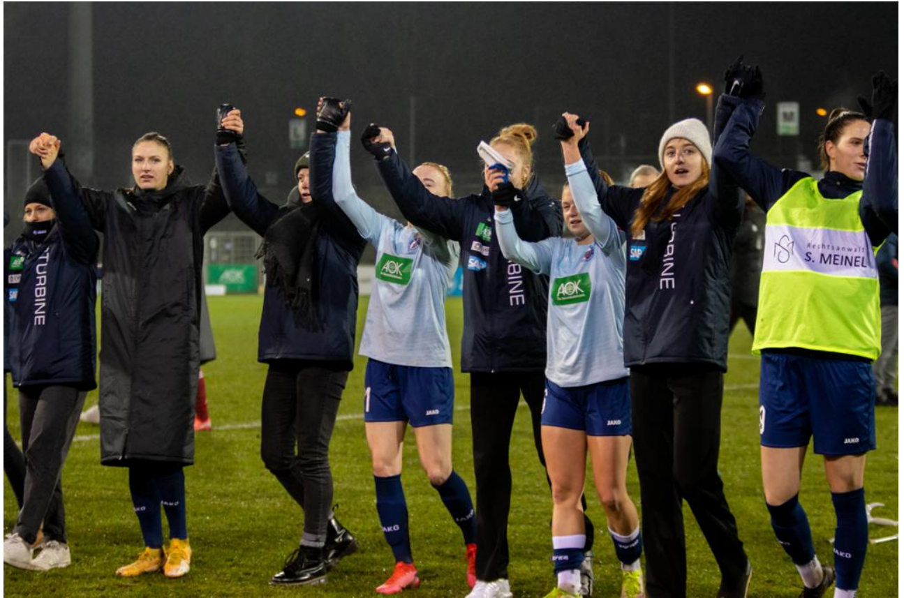
• Danke an die Fans