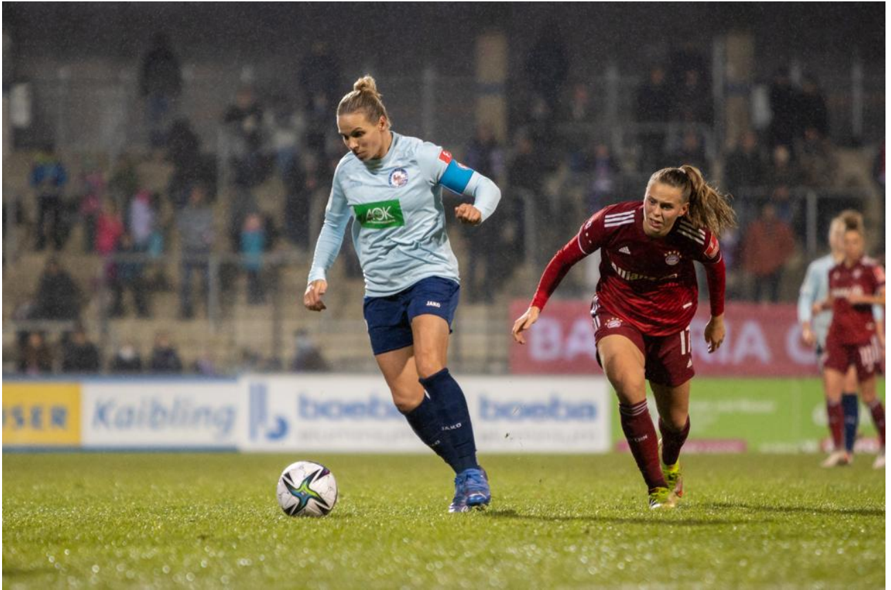
• Isy lässt nichts anbrennen