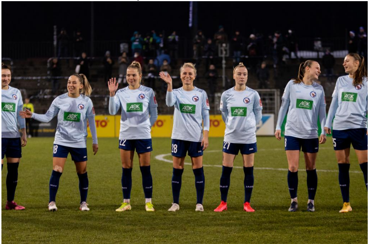
• Alle lachen, außer eine

1098 Zuschauer:innen fanden ins Stadion nach Potsdam-Babelsberg. Darunter auch einige bayrische „Männer“-Fans aus der Brandenburgischen Region, die Gefallen am Frauenfußball finden und