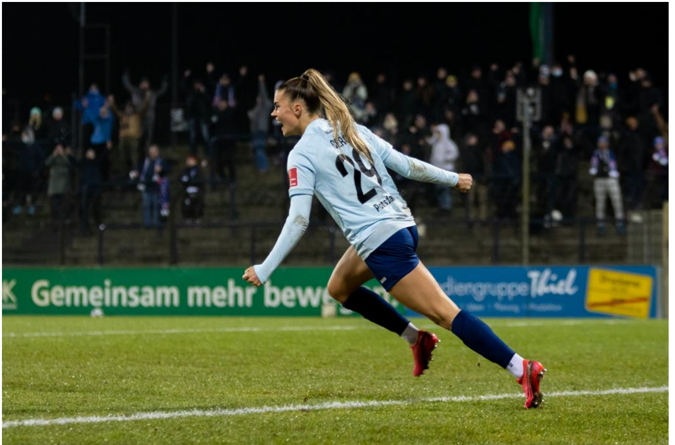
Jubilierende Torschützin