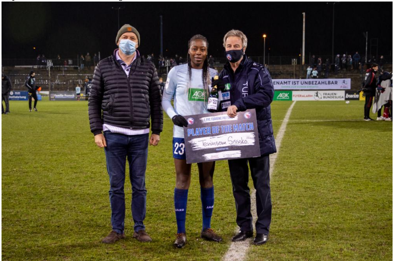
• Player of the match