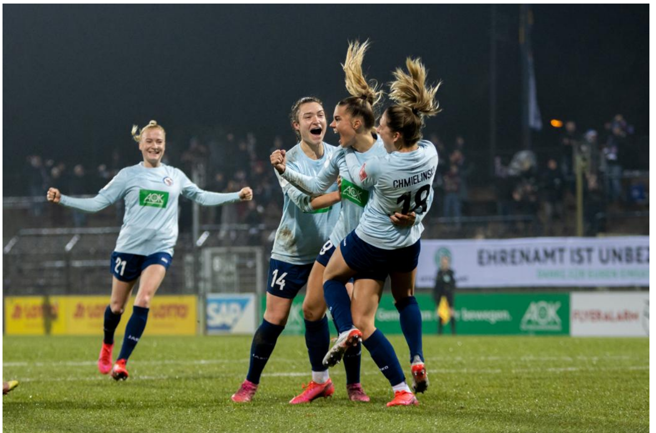
Frauenpower aus Potsdam