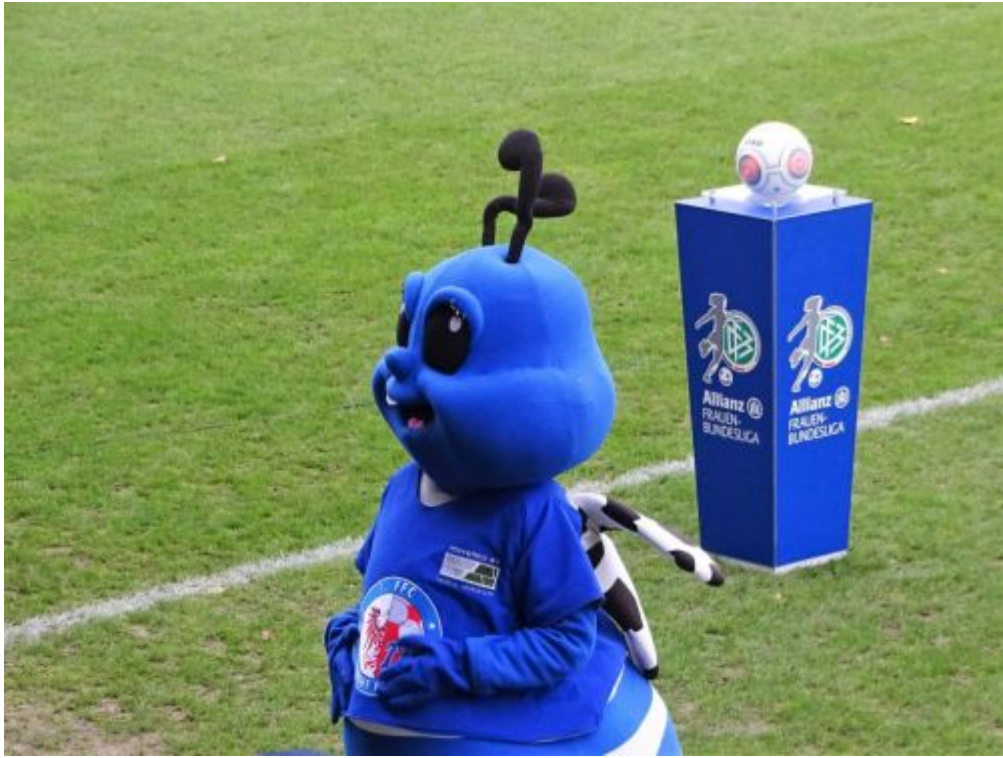
Turbinchen und der Ball