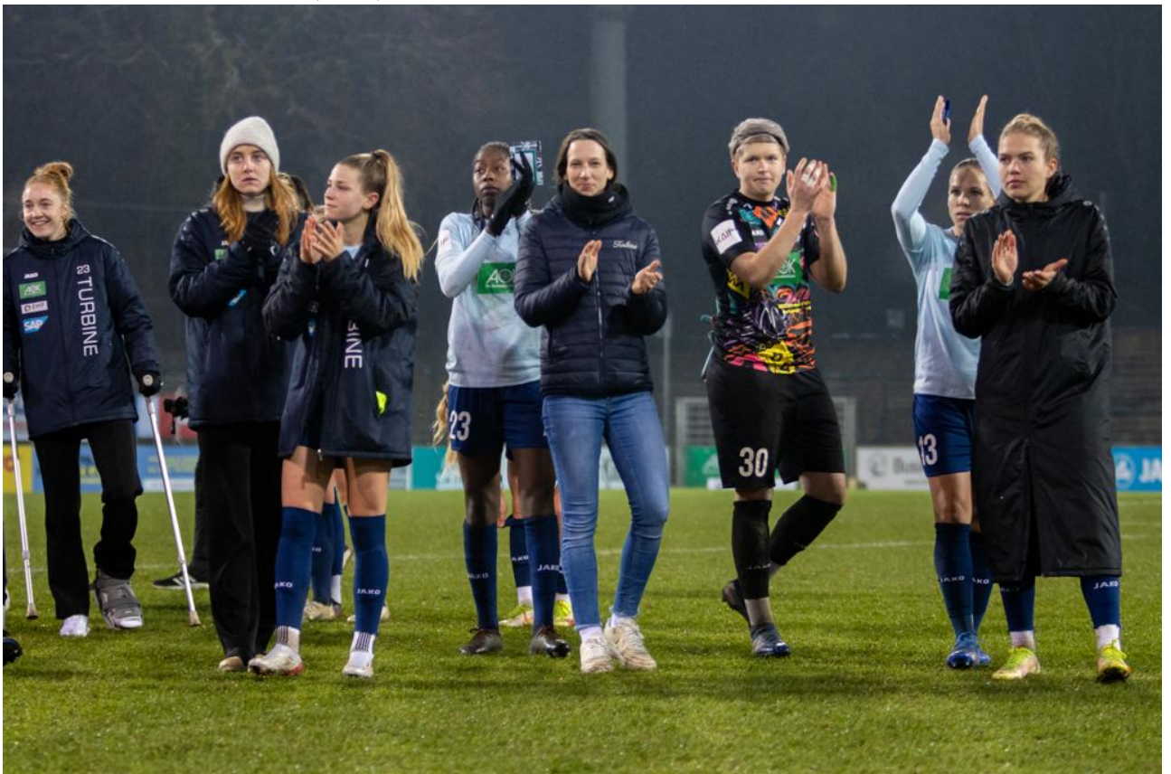
• Danke an die Fans