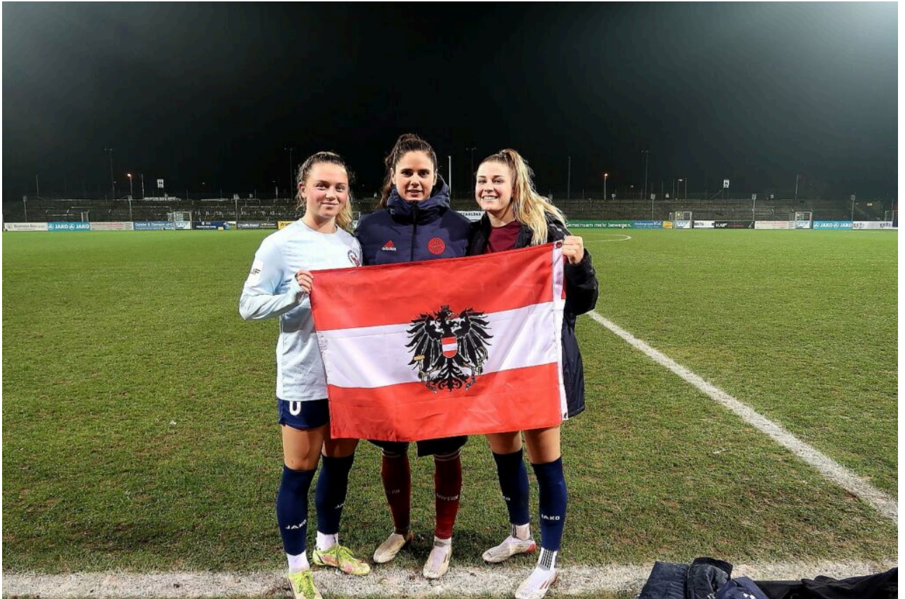
• Österreich hoch 3 - Foto (ferol)