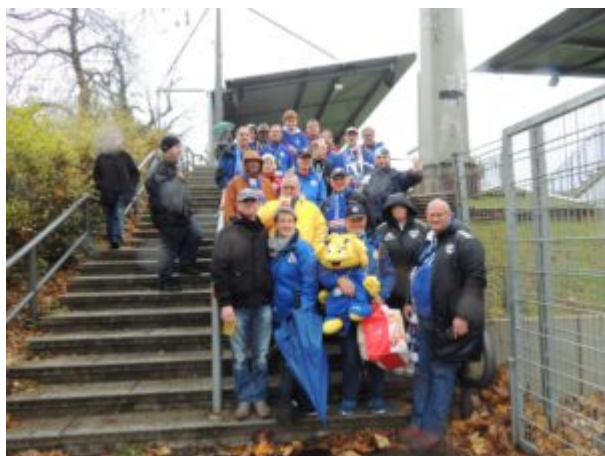
blaue Fanfreundschaft

Respekt gilt neben der Mannschaftsleistung auch den 57 Fans auf der Stehtribüne (ich habe in der Halbzeitpause mal nachgezählt), die bei diesem ekelhaften Dauerregenwetter zäh durchhielten.