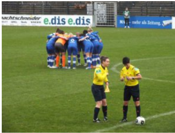
Kurz vor Anpfiff