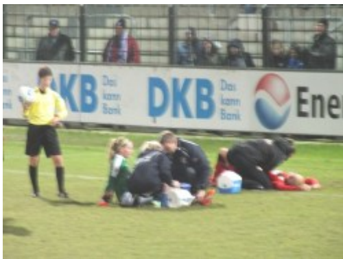
Verletzungspause kurz vor Spielende