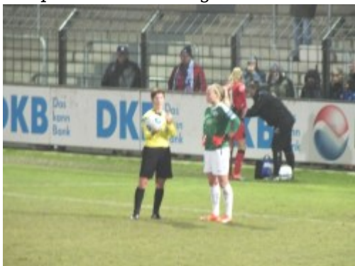
Mein Ball - nicht deiner