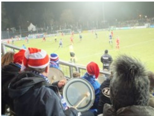
Trommeln zum Sieg