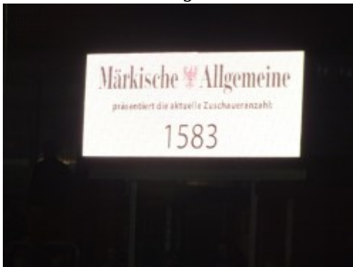
Gruß nach Bayern