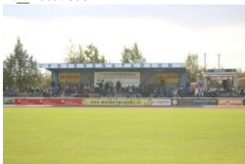
Tribüne des Friesenstadions Sangerhausen