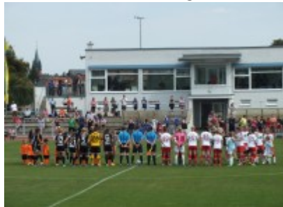
Vor dem Anpfiff