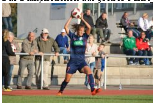
Einfwurf von Gasper_