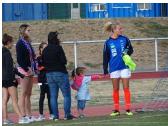
Was ist denn da?