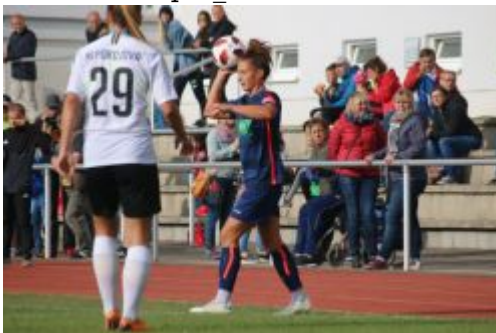
Einwurf Feli