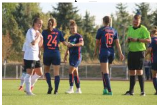
Feli ist happy