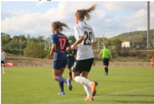
Wehende Zöpfe