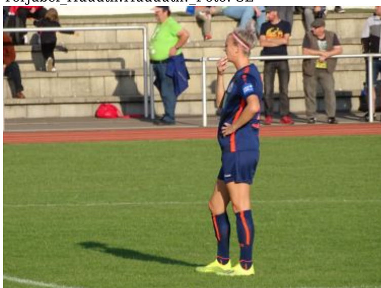
Jojo überlegt