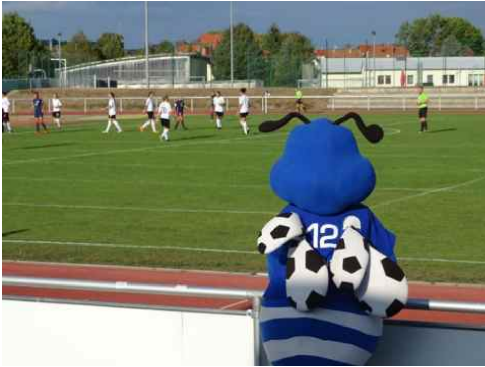
Neugieriger Zuschauer