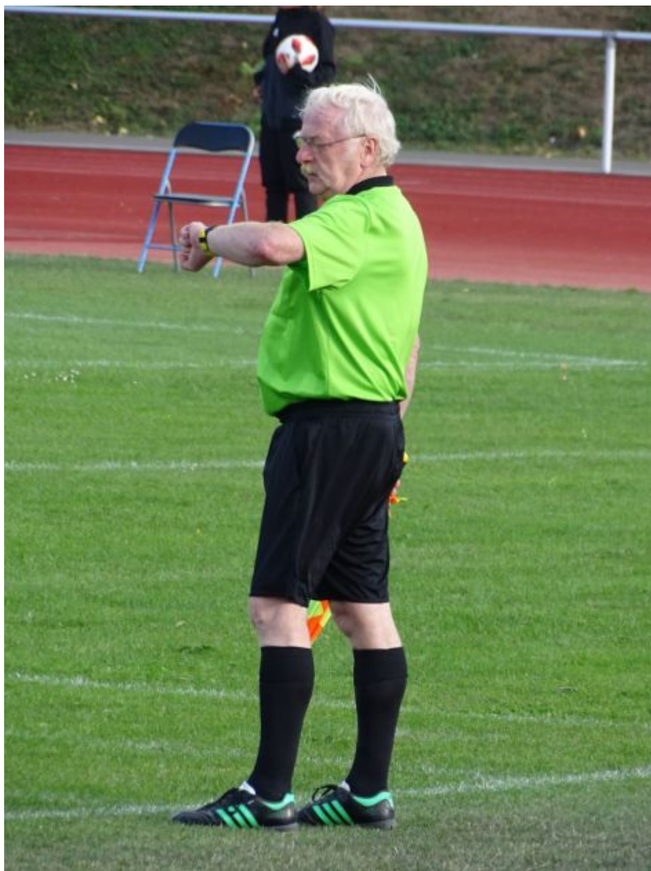
Zeit für den Anpfiff zur zweiten Halbzeit_ Foto: SL