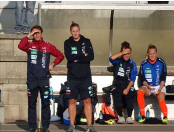
Nach Toren Ausschau haltend