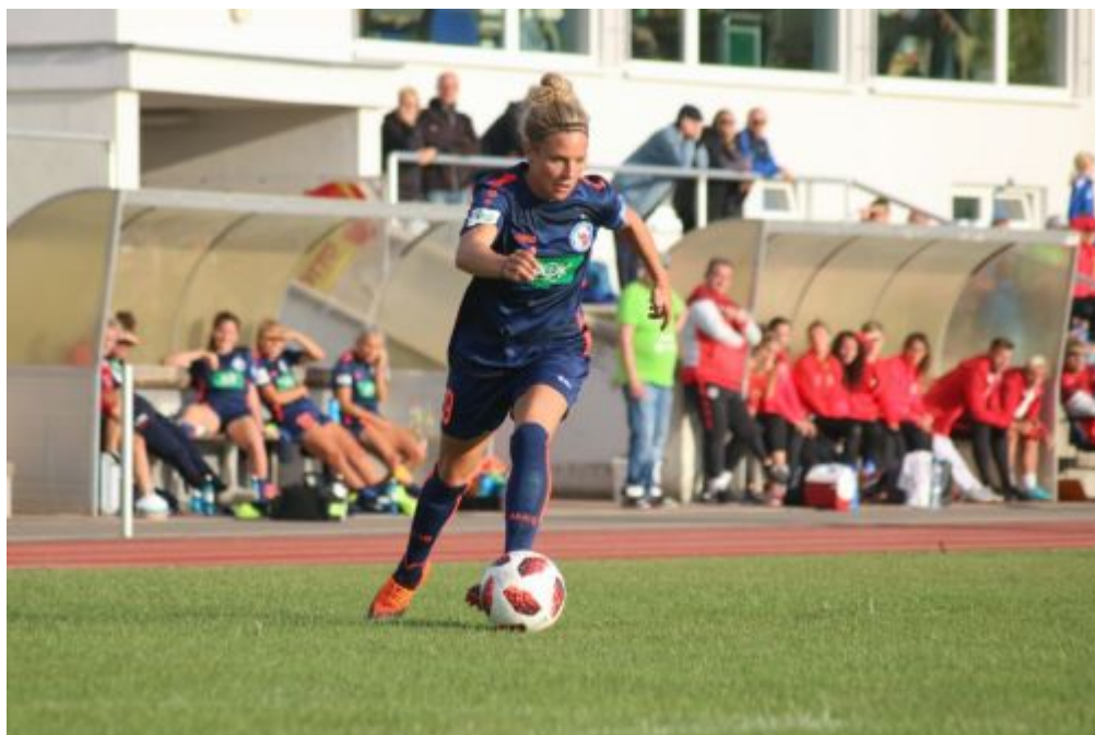
Das Dampflokchen auf großer Fahrt