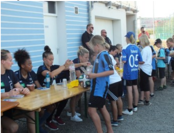
Regionaler Fußballnachwuchs auf Autogramm jagd