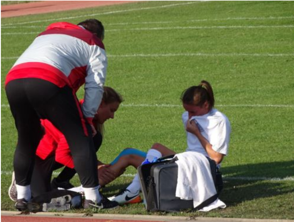
Sieht nicht gut aus