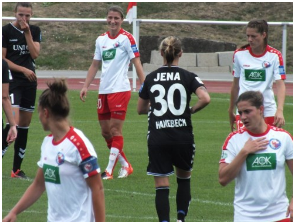
Die Es-10 von TP