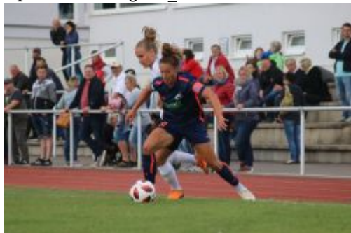
Nix da, meiner!