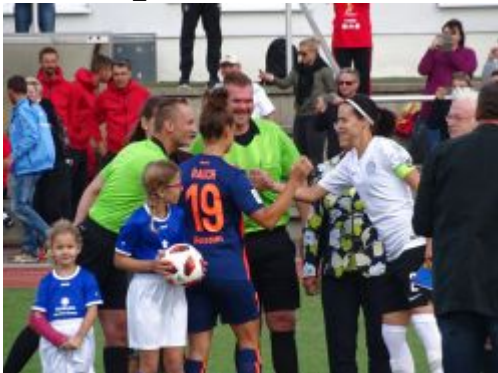
Die Kapitänninnen und Schiris