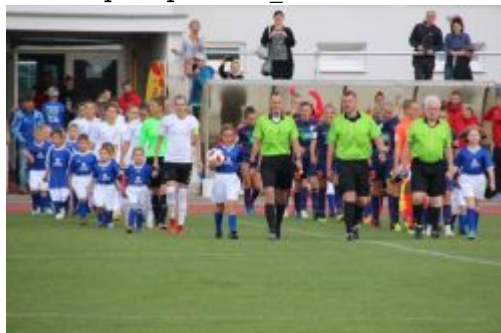
Einzug der Mannschaften