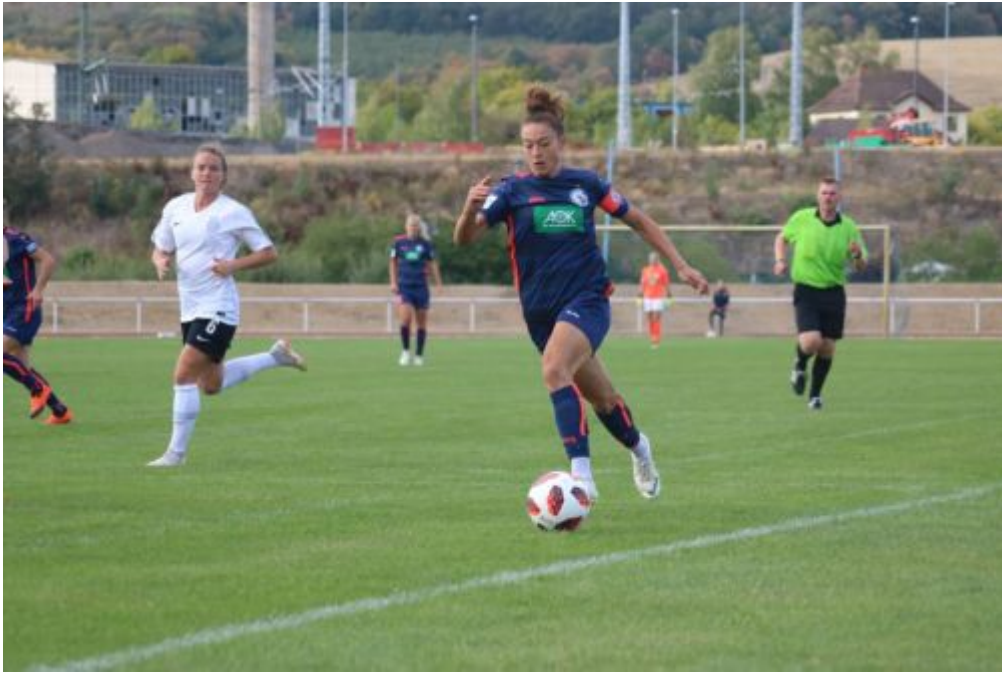
Feli im Anlauf