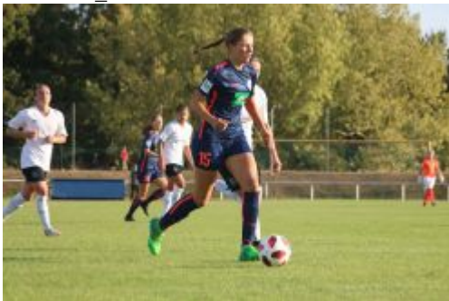
Eine der Torschützinnen