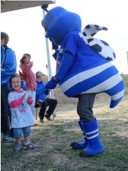
Shakern mit Torbienchen