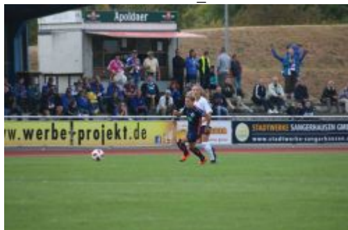
Huth setzt sich durch