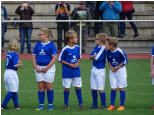
Und nun?