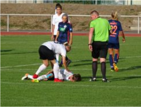
Verletzt am Boden liegend