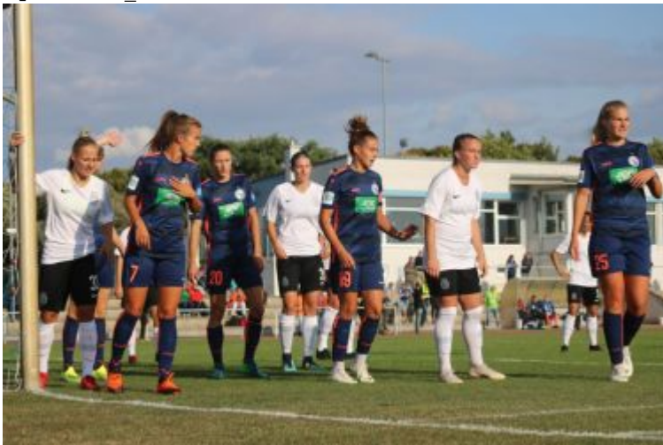
Zweite Halbzeit_Foto: sas