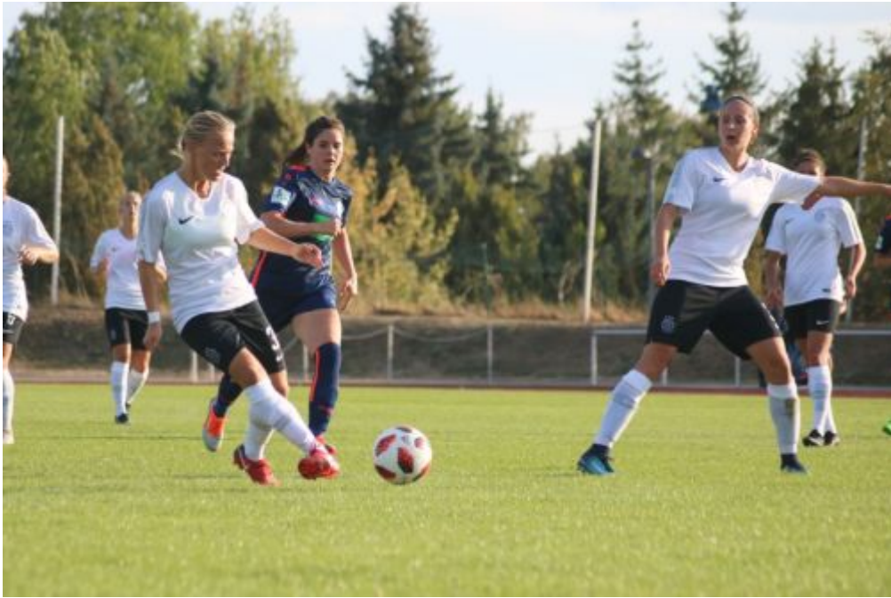
Spiel läuft