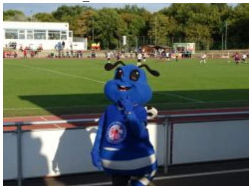
Gutlauntes Torbienchen