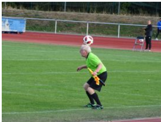
Jonglage-Einlage des Linienrichters