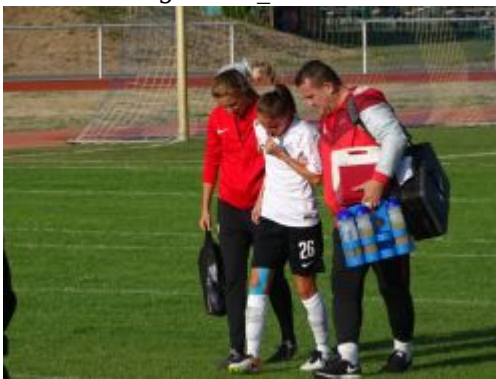
Auswechslung der verletzten Prager Spielerin