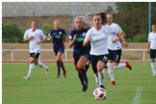
Sparta im Angriff