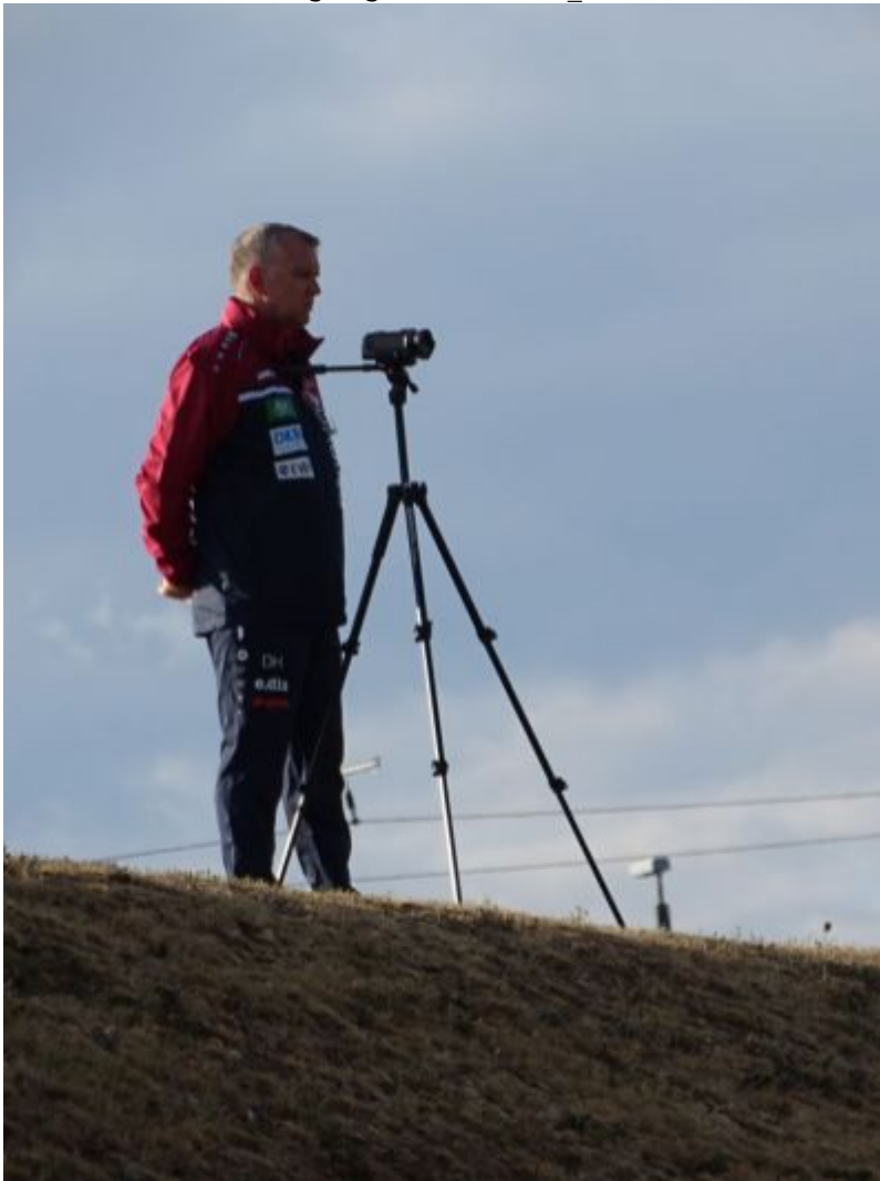
Kameramann auf Position