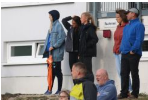
Einheimische schauen zu