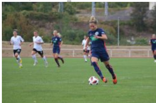
Huth in voller Größe