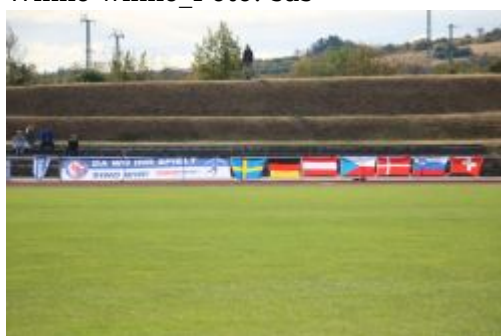
Die Beflaggung steht dank Frank E.