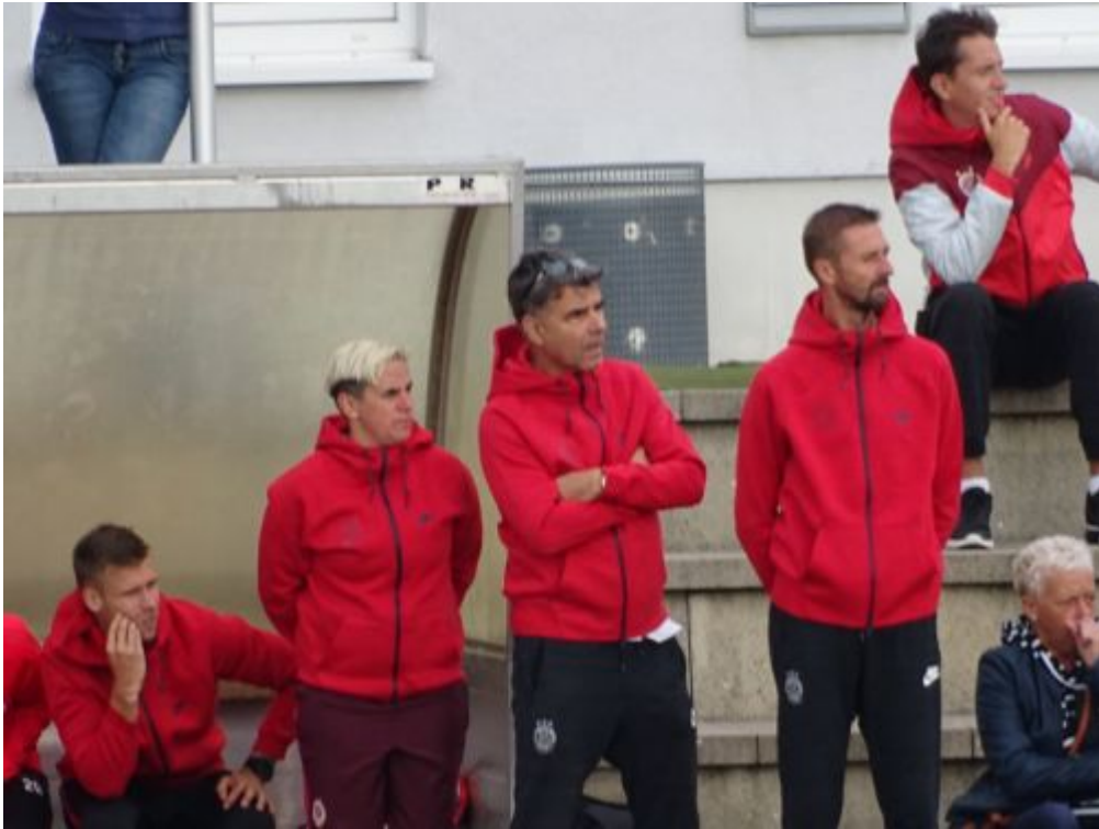
Das Prager Trio - nach Größe geordnet