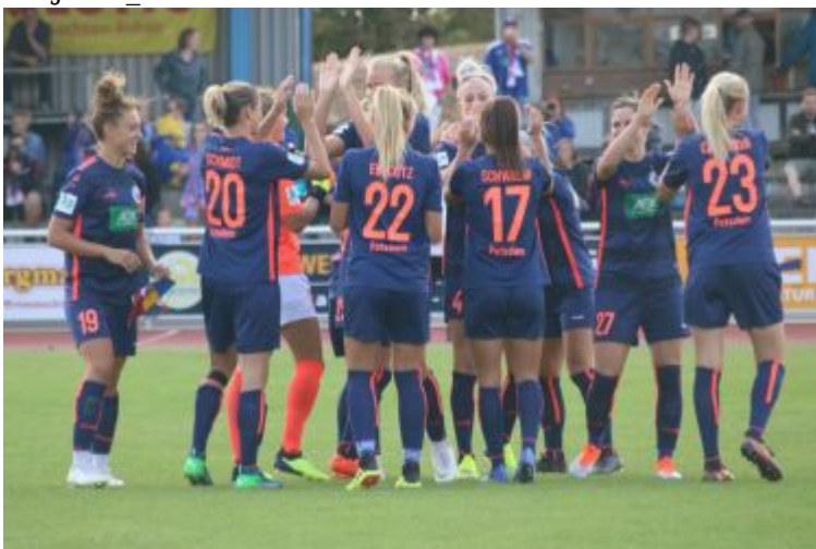
Auf geht's