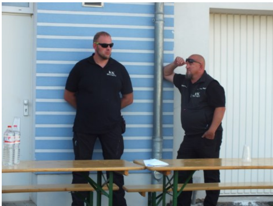
Total abgesicherte Veranstaltung