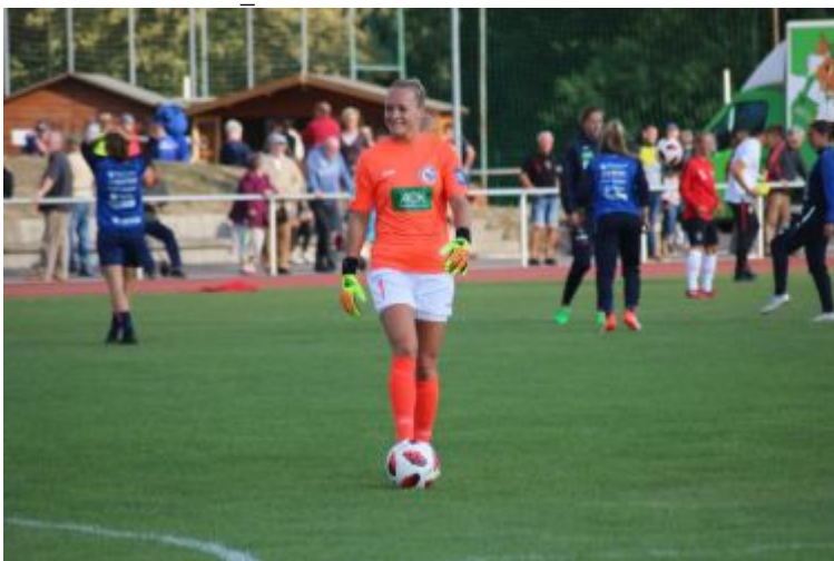
Auswechslung von Schmitz