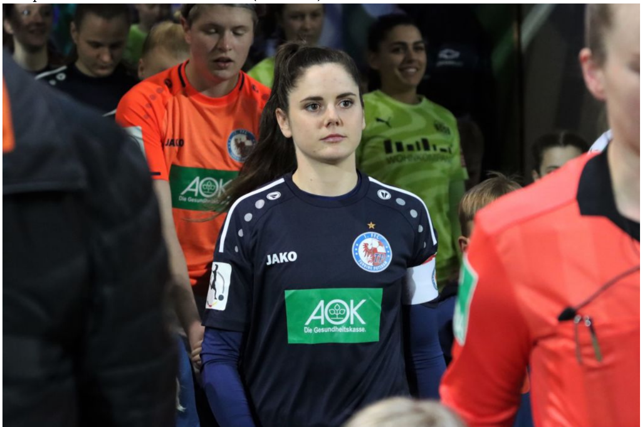
Dieser Blick!