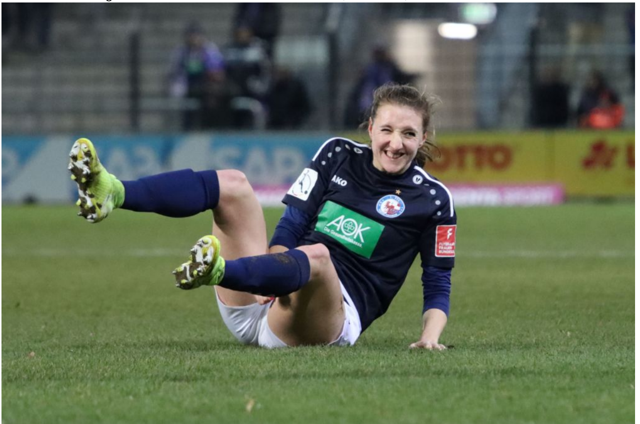
• ...zum Lachen

Nach der ersten halben Stunde voller Kurzatmigkeit und Gestöhne der Fans fingen sich die Potsdamerinnen und schalteten ihren Turbinenantrieb ein. Nun begann endlich das erwartete Spiel auf Augenhöhe. Es gab Torchancen