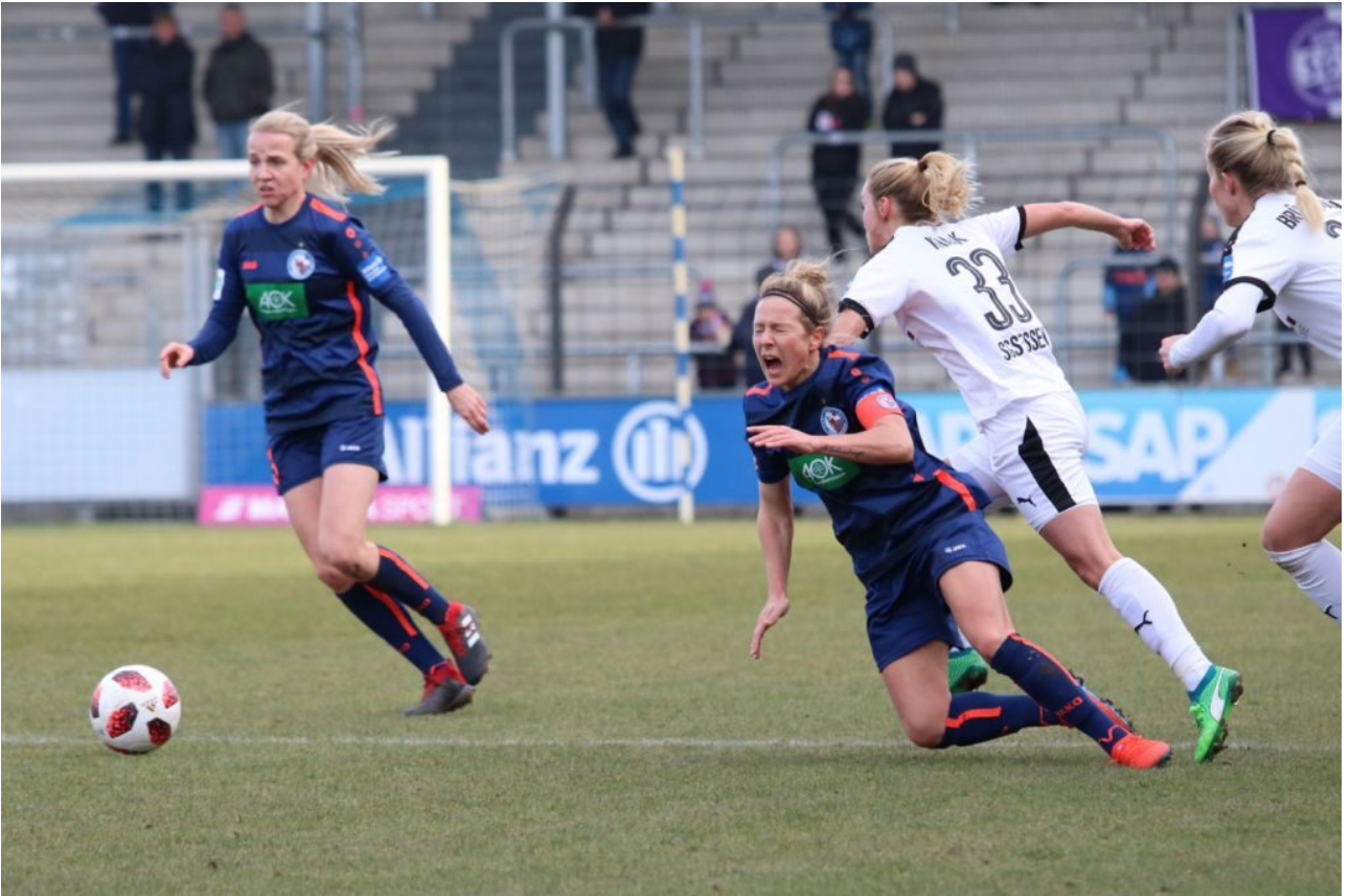
Foul an Huth