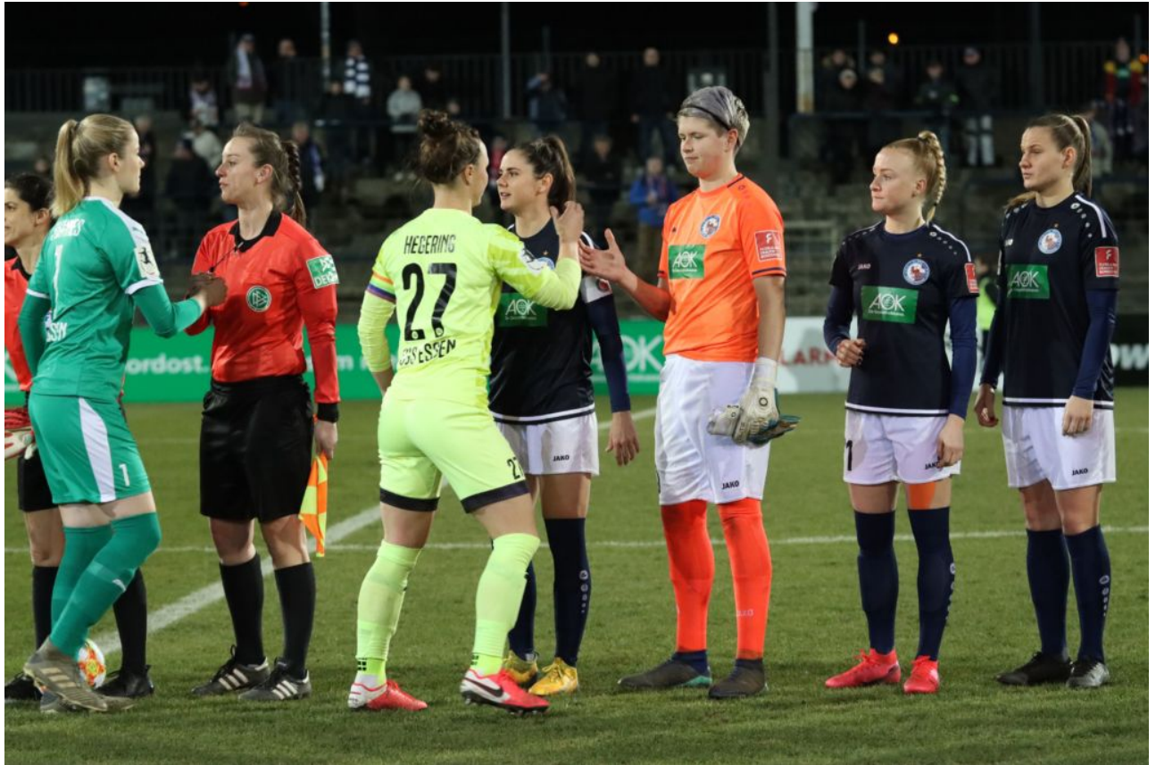
Abklatschen mit Hegering