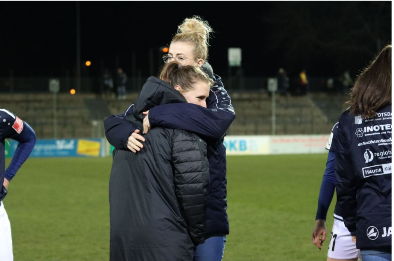
• Ich wärme dich