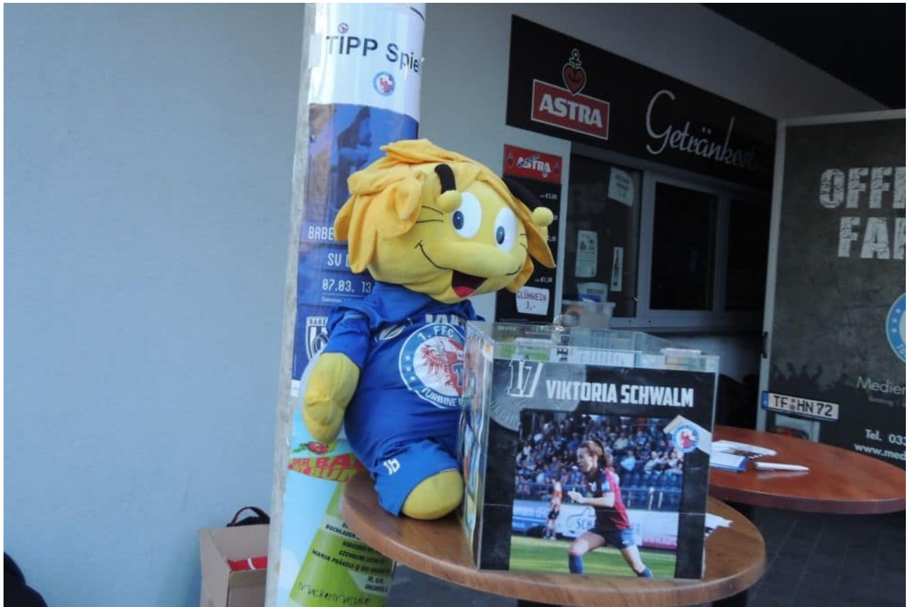
• Tippsspiel für die Fans