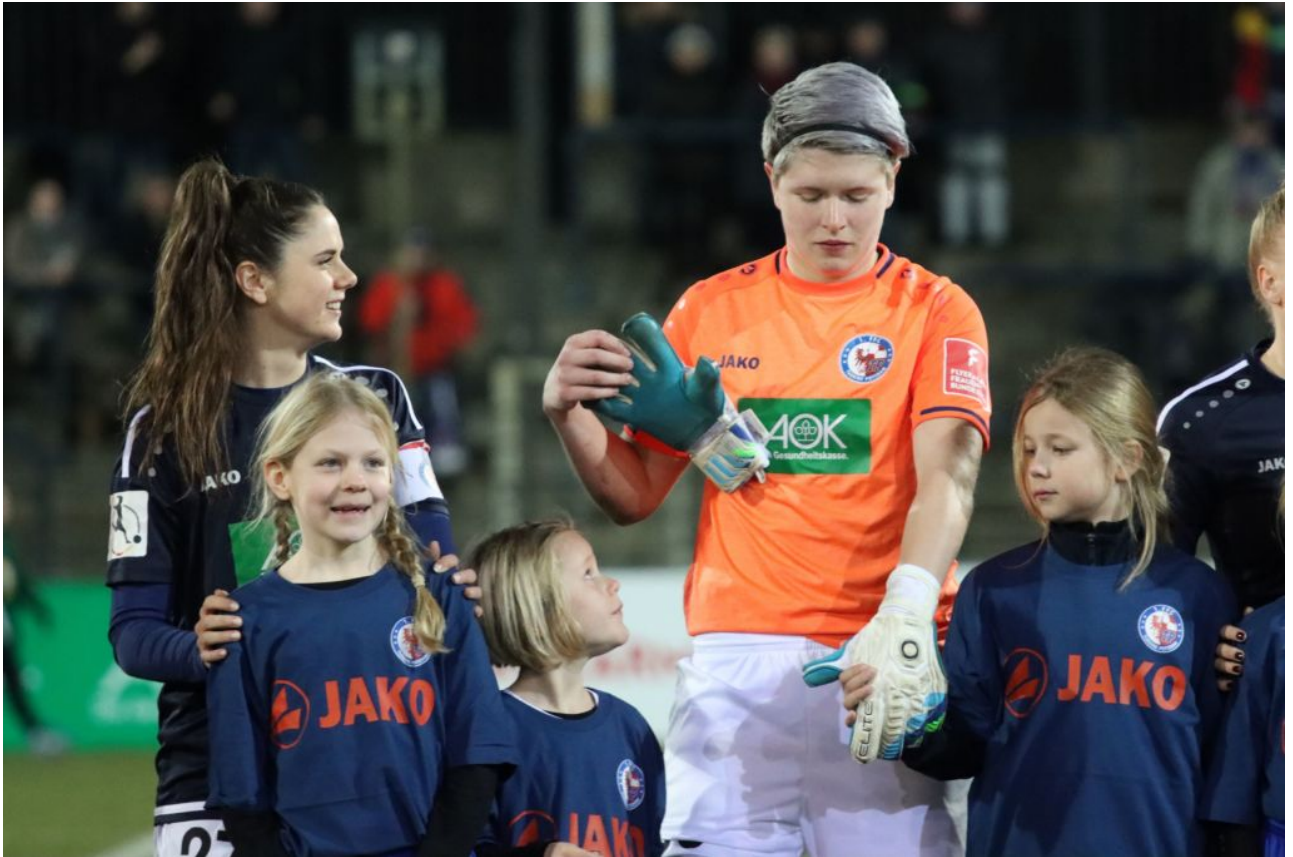
Die Ballade vom Handschuh