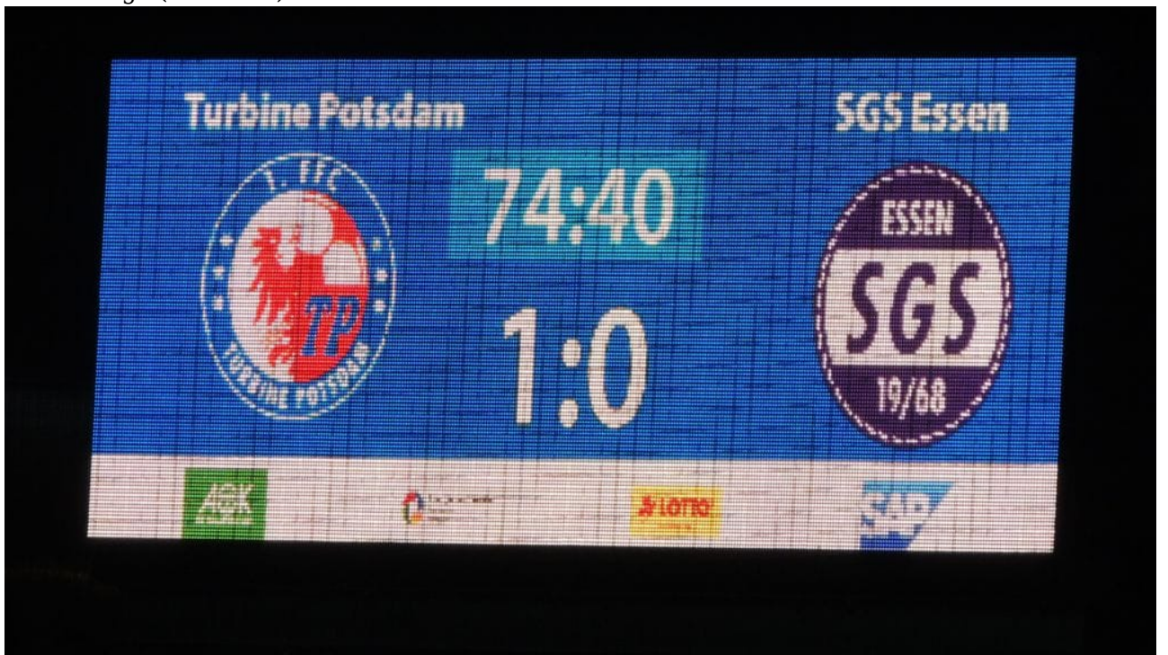
Nun die korrigiert Anzeige