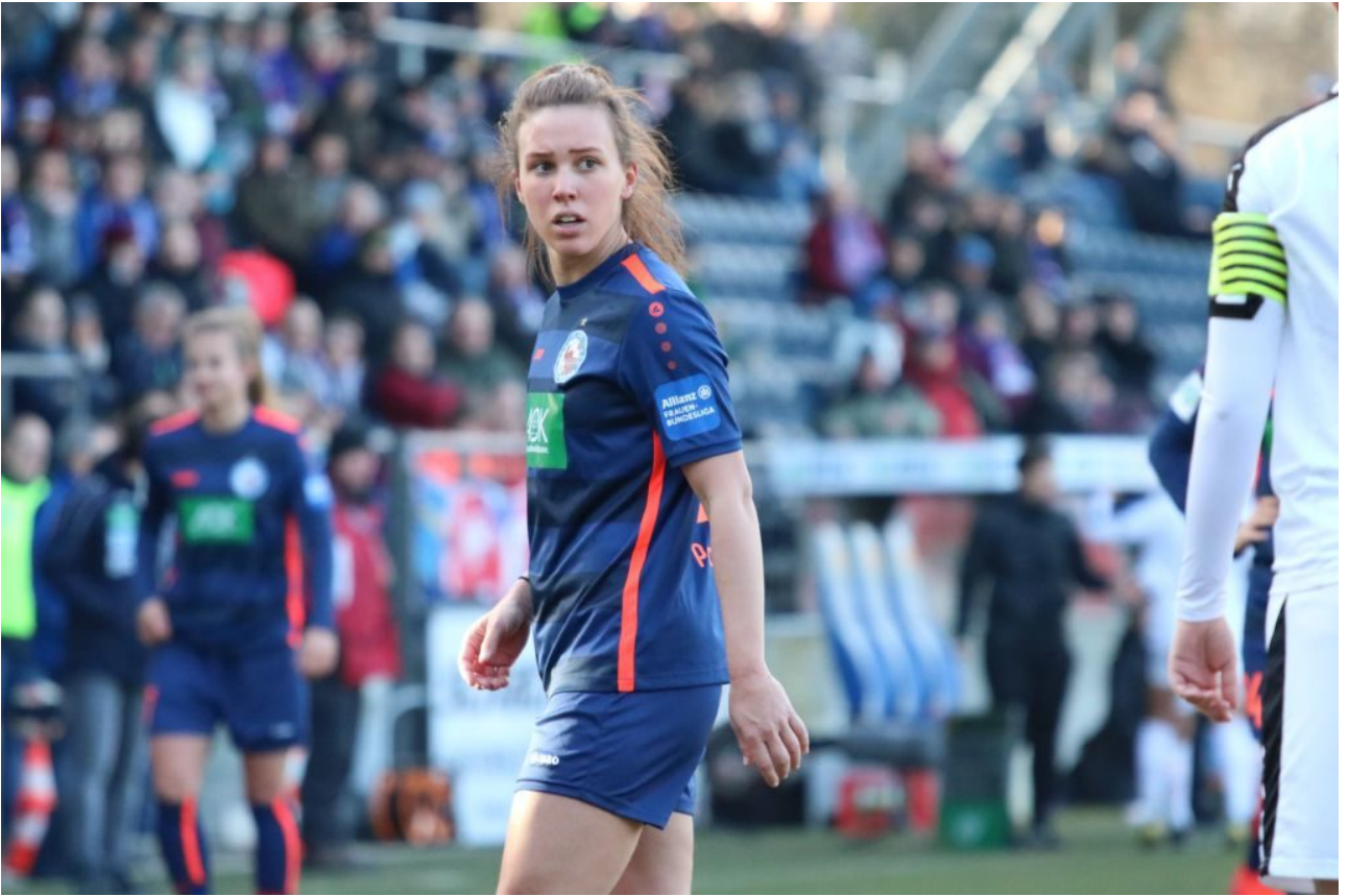
• Tory - stets engagiert