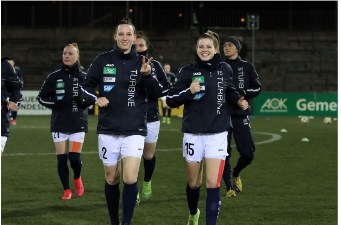
• Warum up