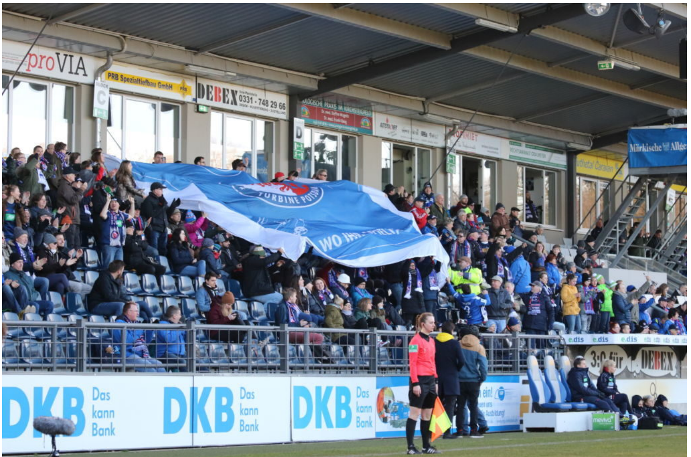
Bisschen was zu feiern

Den Rückstand von zwei Toren hatte die Lieblingsmannschaft