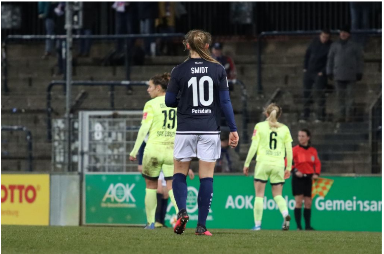
• Nach 17 langen Monaten der erste Auftritt