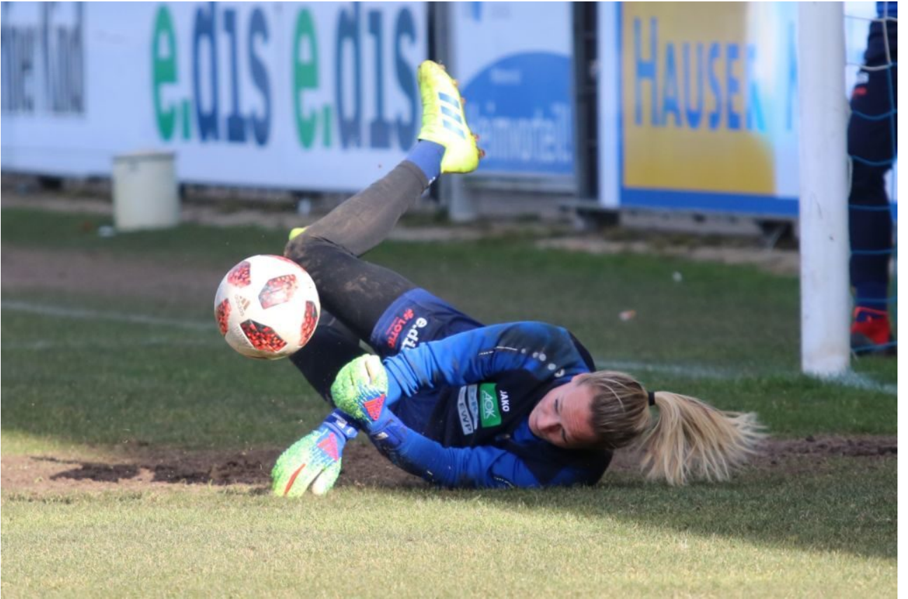
• Suhlen im Modder