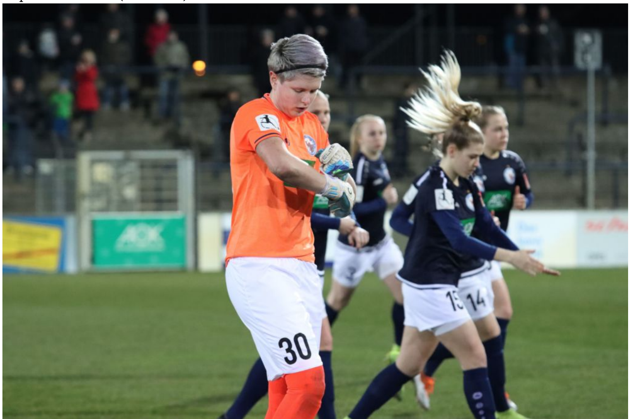
• Festgezurt ist halb gewonnen