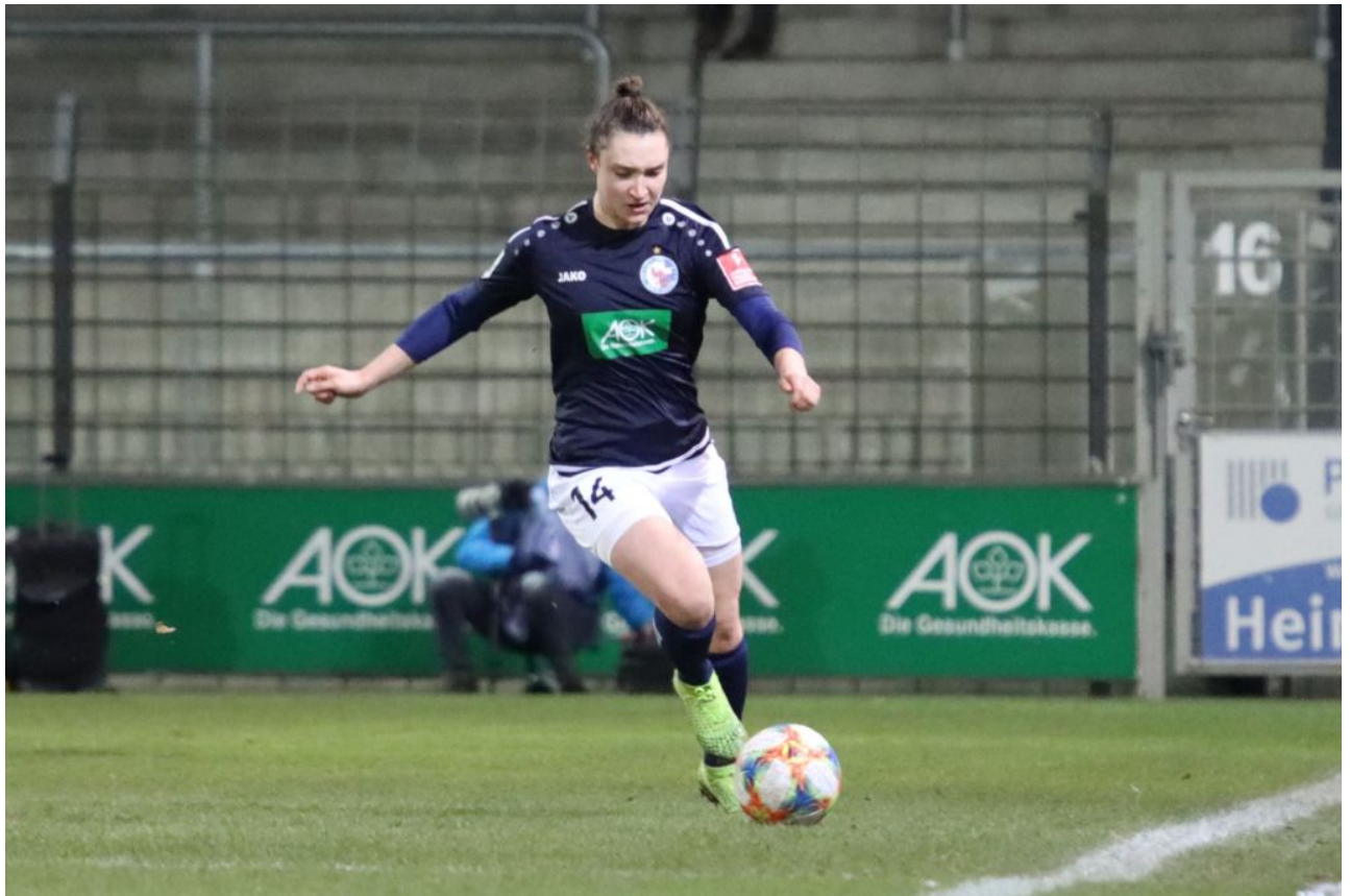
• Sophie Weidauer