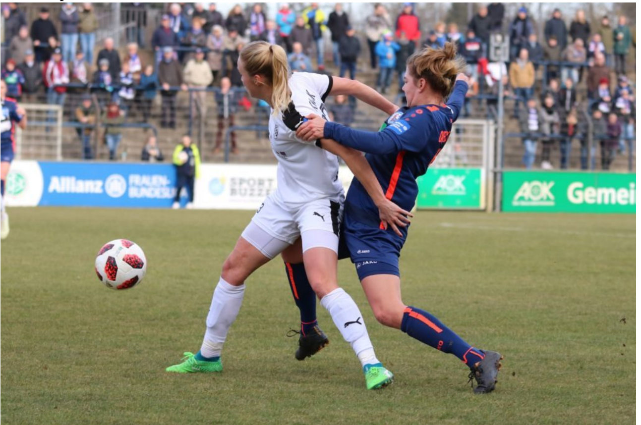
Gerangel um den Ball