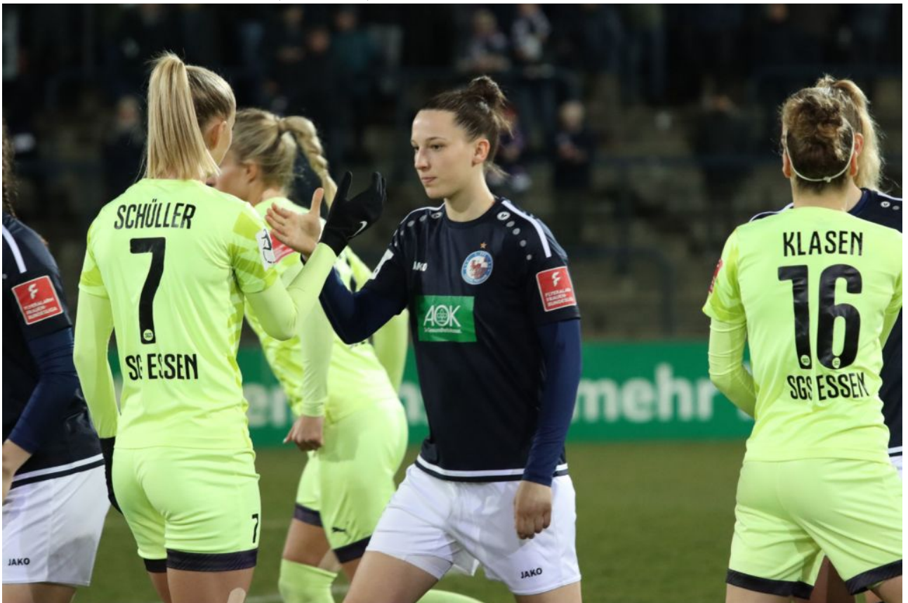
Erstes Kennlernen - wie sehen uns später