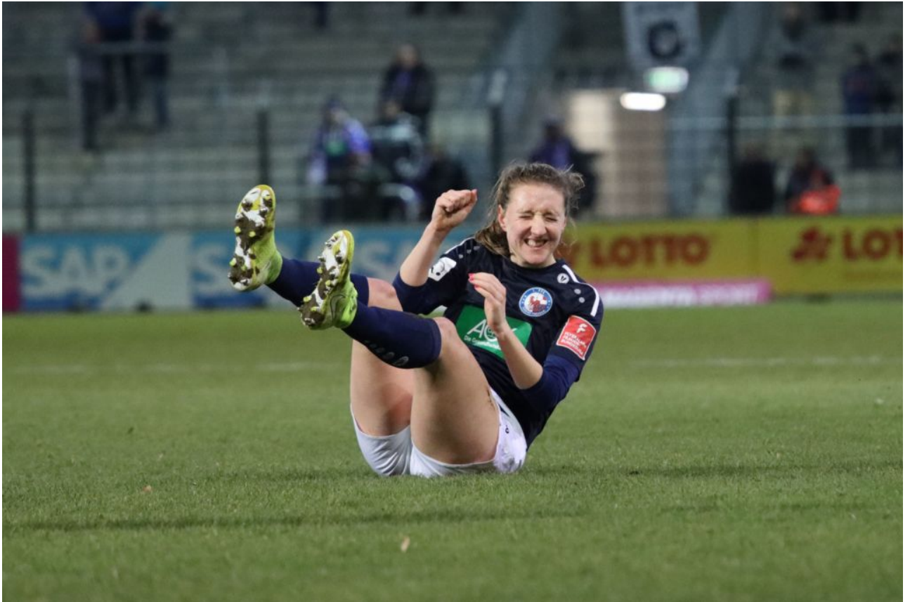
• Seichte Landung - zum Weinen oder zum Lachen?