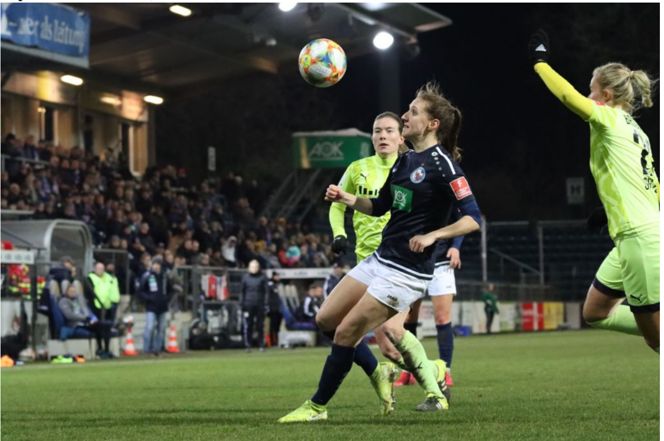
• Den Ball voll im Blick