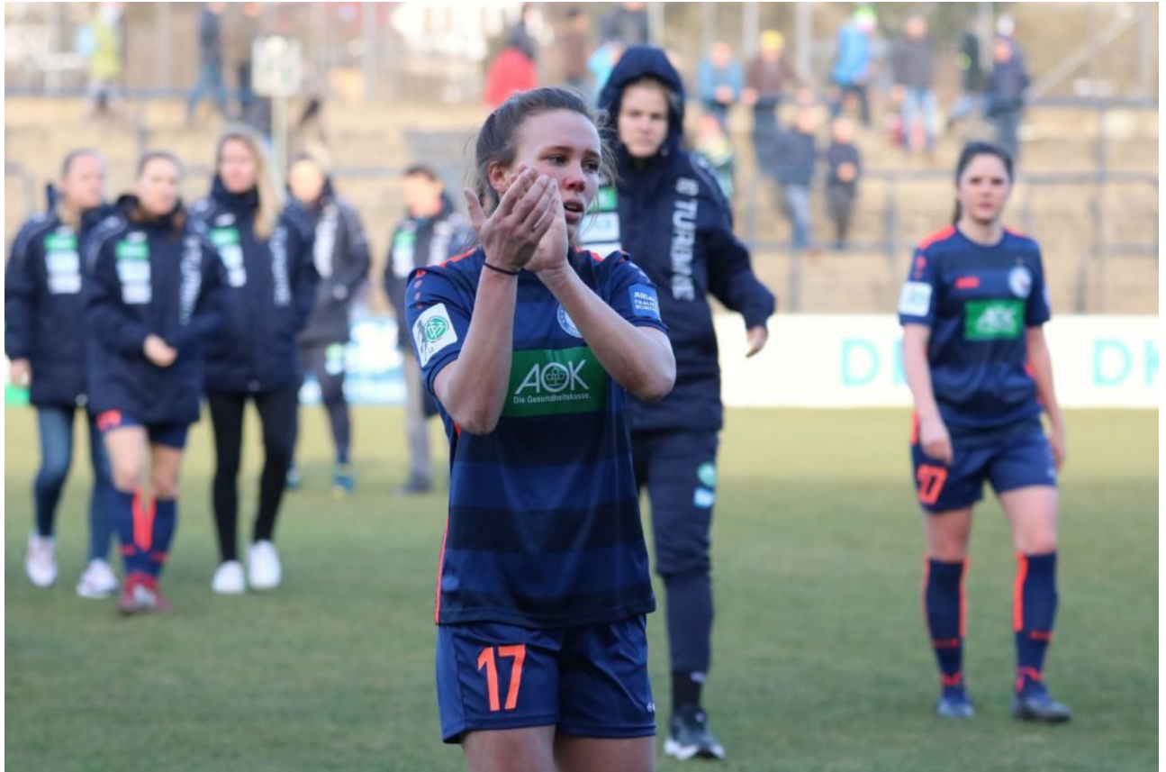
• Tory ebenso