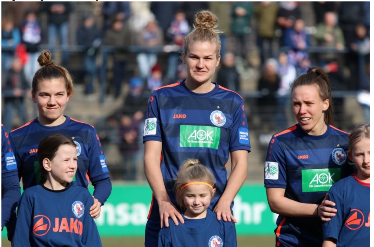
Groß und klein