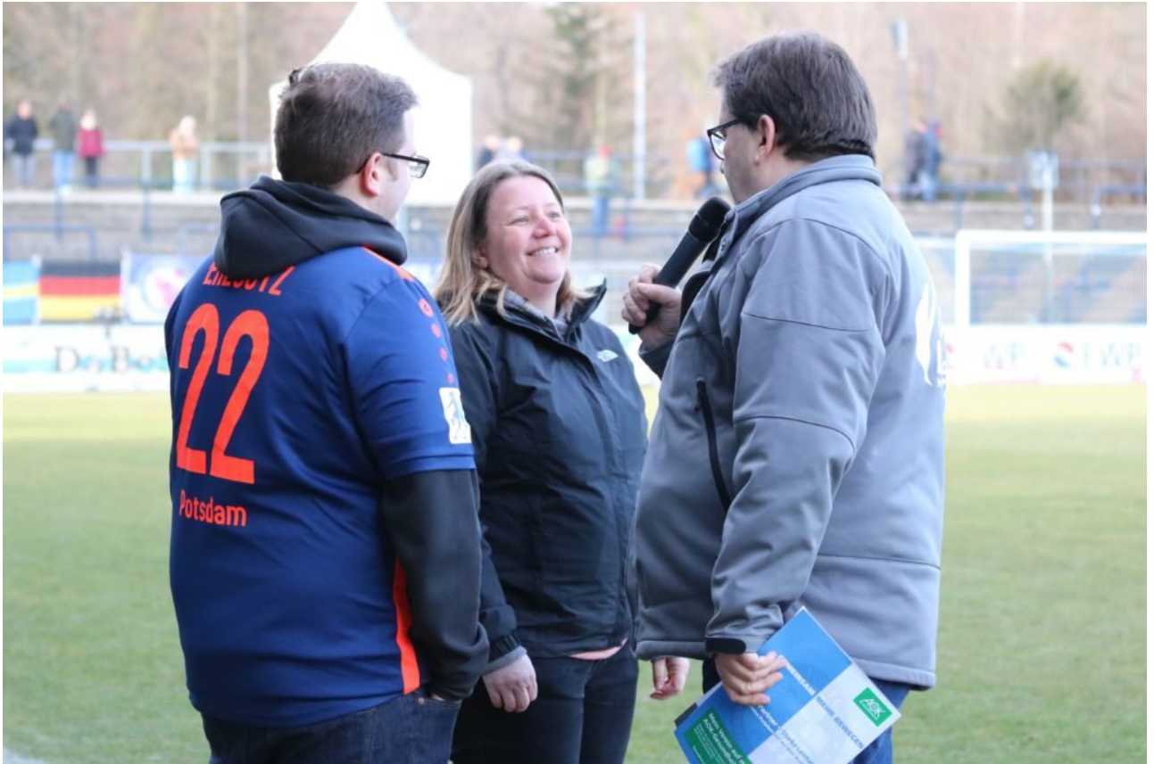
• Die Mittelfahren-Zielwilligen im Interview