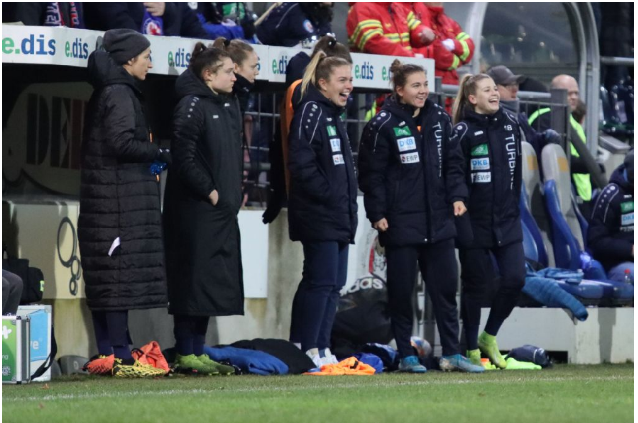
• Die Bank freut sich