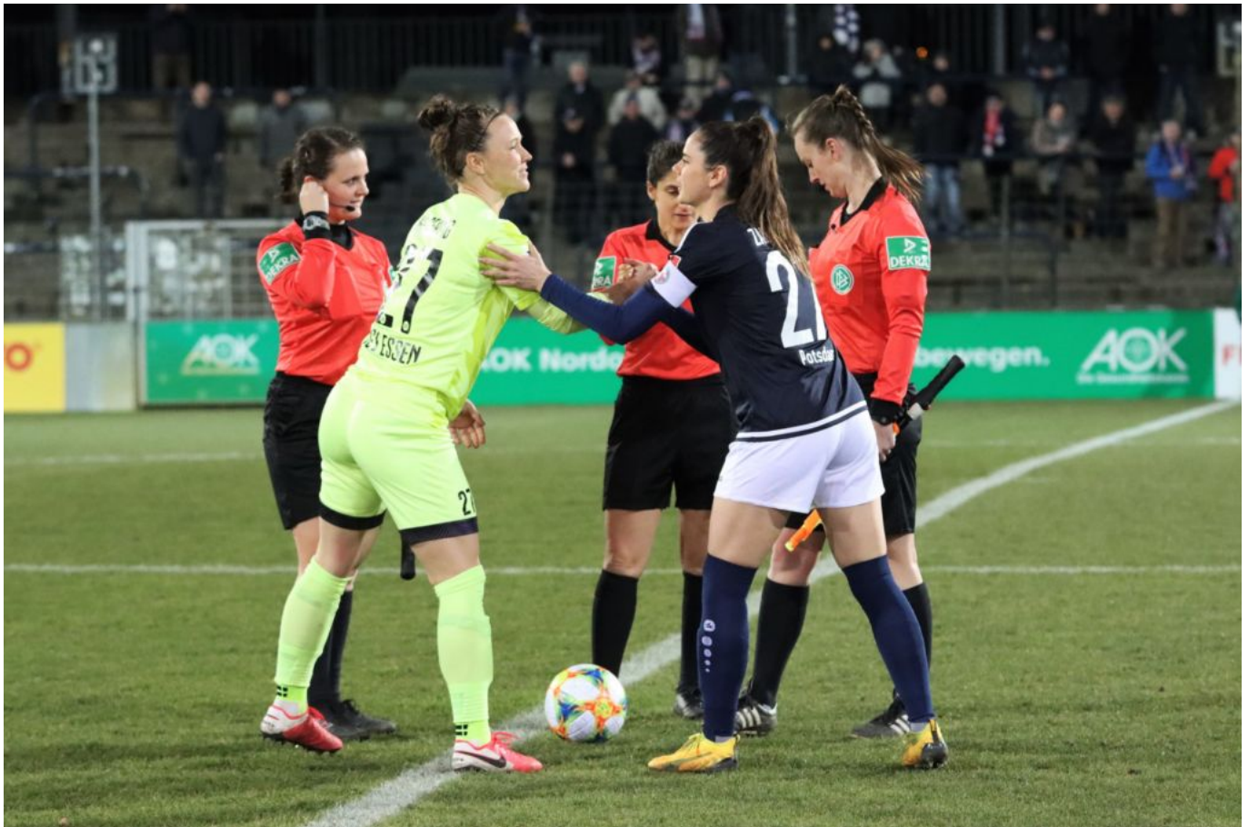
Starke Körpersprache - starkes Spiel