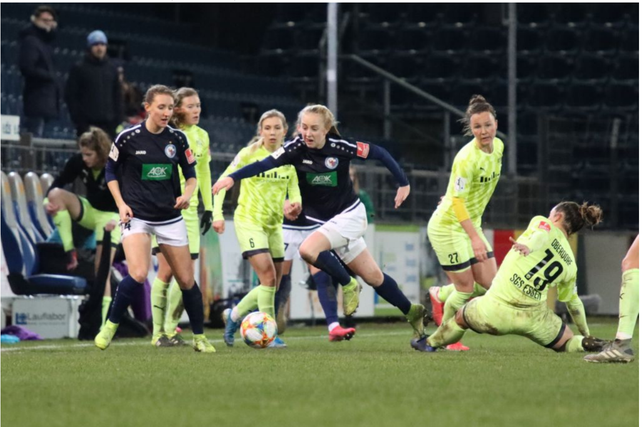
• Caro zieht an Oberdorf vorbei