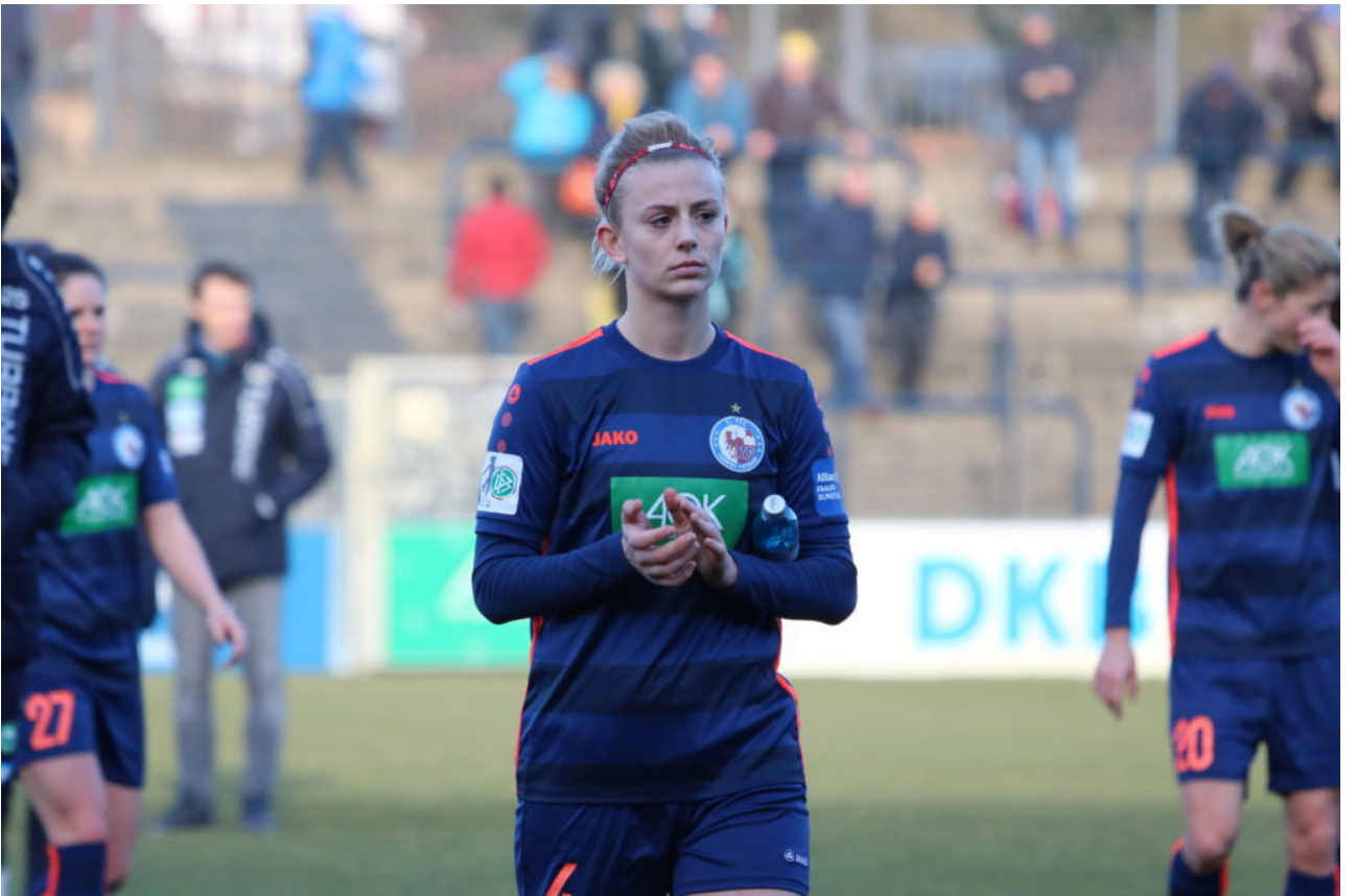
• Jojo trauert