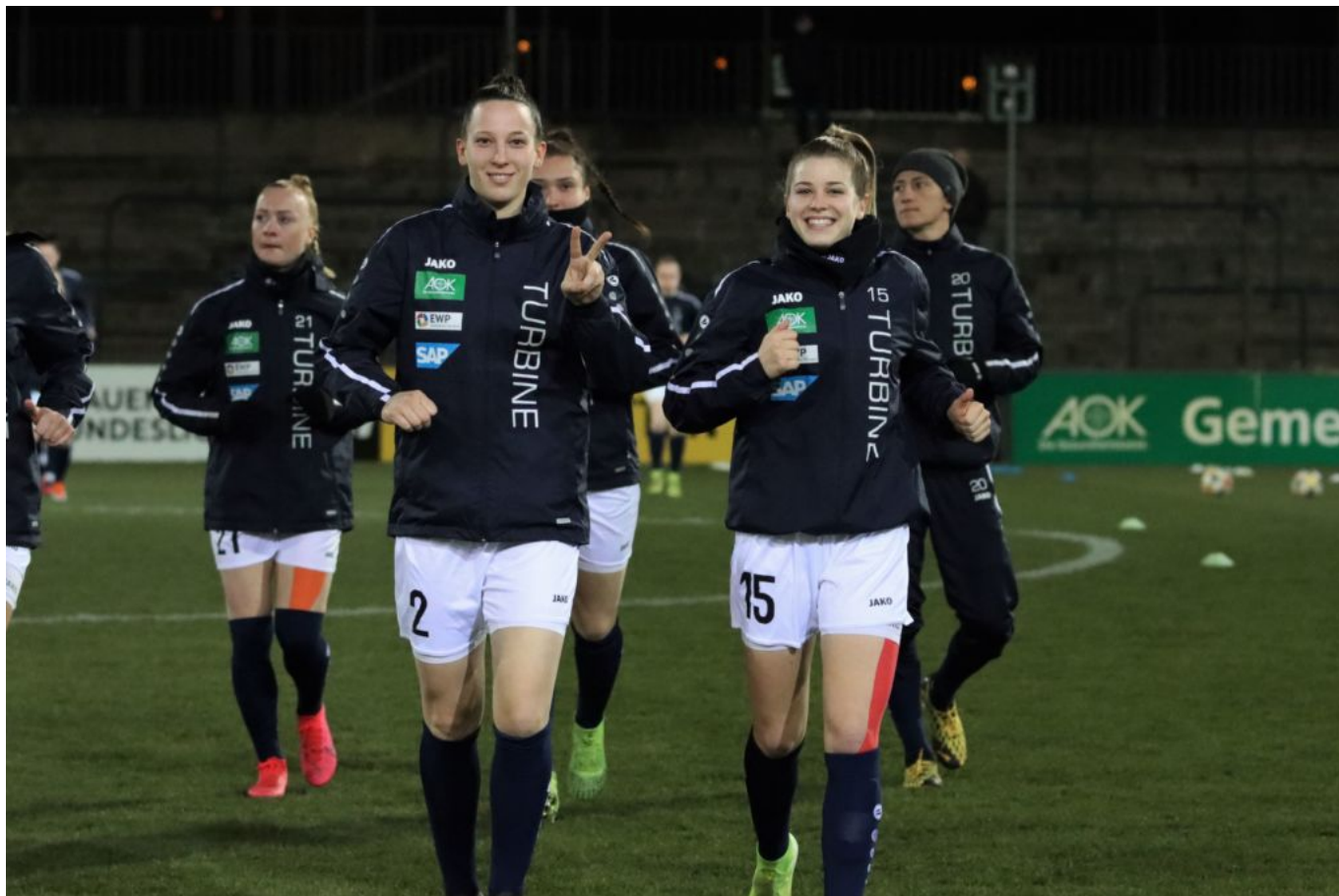
Warum up

Doch einer fehlte am Start: Eurosport. Die Flyeralarm Frauen-Bundesliga ließ am Freitagnachmittag im hervorragenden Amtsdeutsch folgenden Wortlaut verkünden: „Aufgrund einer kurzfristigen Programmänderung bedingt durch externe Faktoren war eine produktionstechnische Umsetzung des Top-Spiels für Eurosport heute nicht umsetzbar“ . Da fragt man sich, soweit dieser Wortgebrauch verständlich ist, was sich hinter diesen „externen Faktoren“ verbirgt. Auf jeden Fall war die wiederholte Ausstrahlung eines Wintersport-Events auf Eurosport mehr Priorität als die Live-Übertragung eines weiblichen Fußballspiels. Der Wunsch nach mehr Verlässlichkeit, gelingender Kommunikation und Professionalität schreit zum Karli-Himmel.