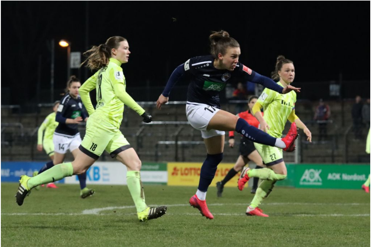
Tory zieht ab