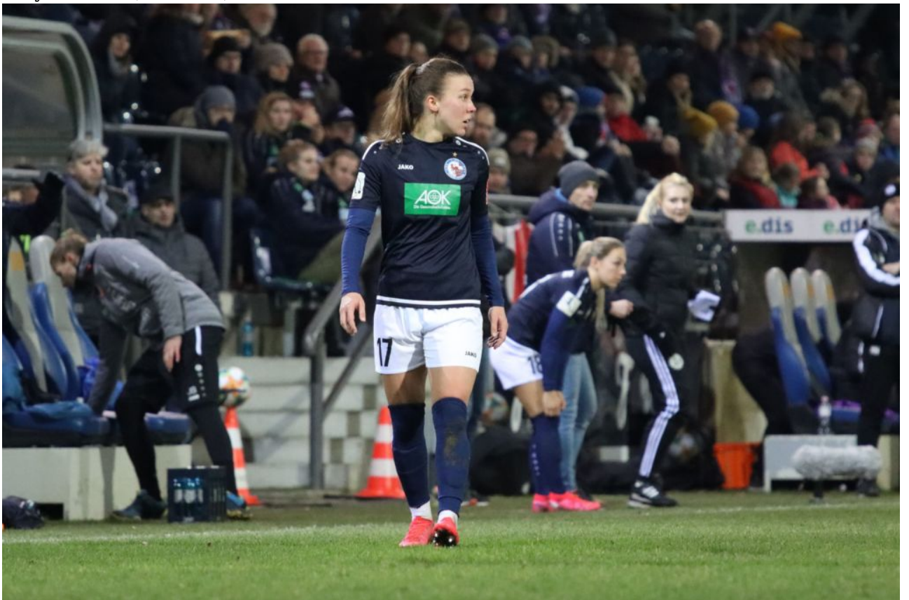
Die Fans im Rücken