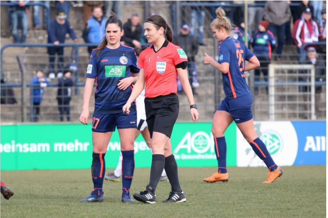
• Die Qualität lässt zu wünschen übrig