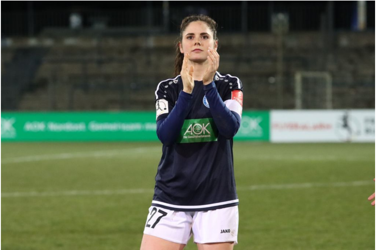
• Was denkt sie?