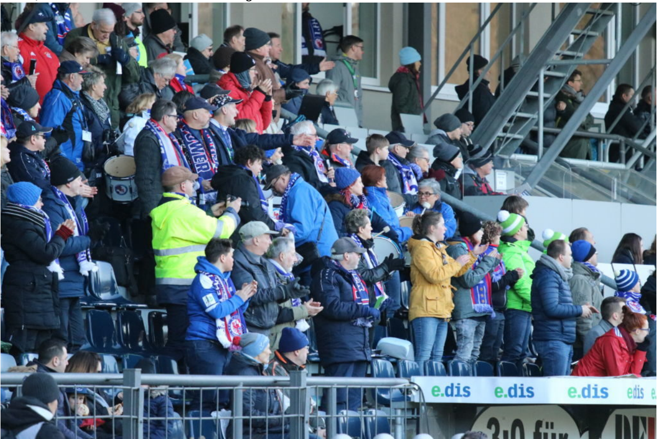
• Fanblock D