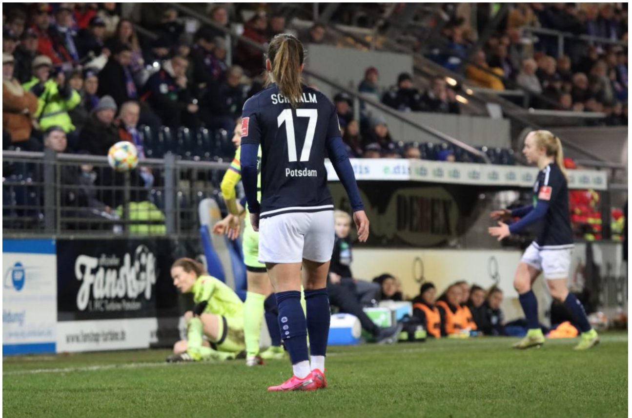
Spielerin im Aus