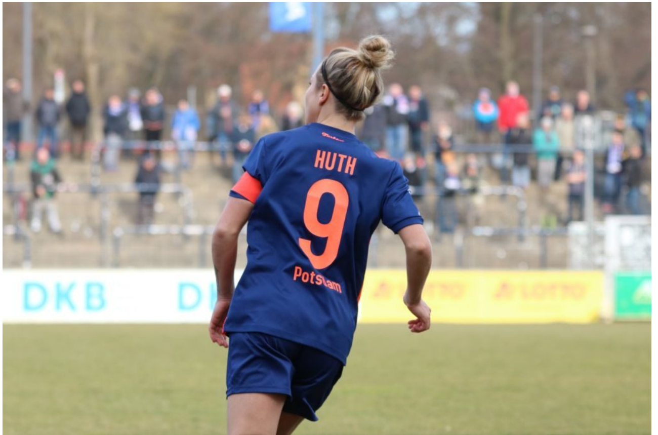
• Adieu I