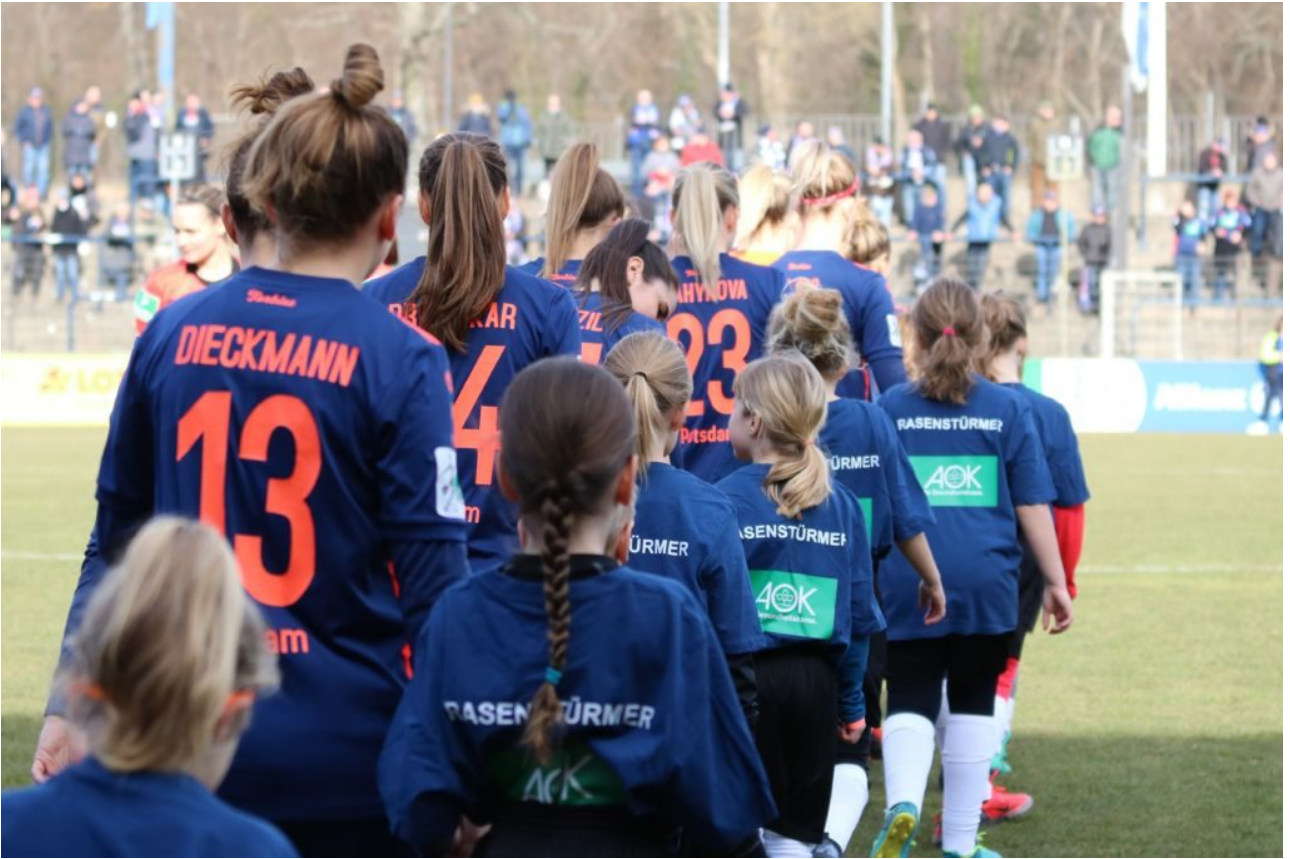
• Einlauf der Mannschaften