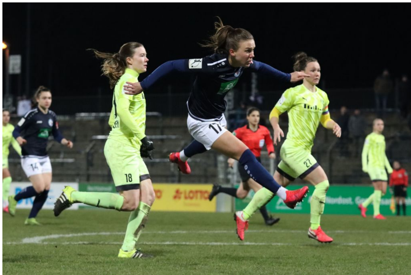
Überfliegerin