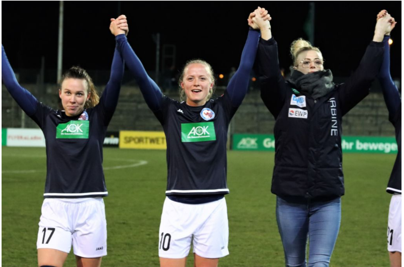
Da ist sie!