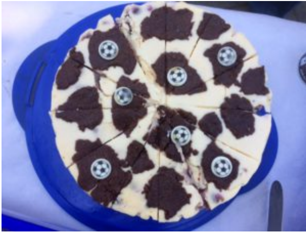
Fußballtorte - gebacken von Otto

Die vom Fanclub initiierte Spendenaktion „Kuchen essen gegen Essen - damit der Turbine-Nachwuchs nicht hungert“ entpuppte sich als voller Erfolg: 1003,50€ kamen dank der backenden Fans und spendablen Stadionbesucher/innen zusammen!