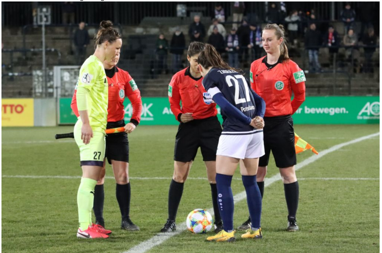
Ist das ne Westmark?