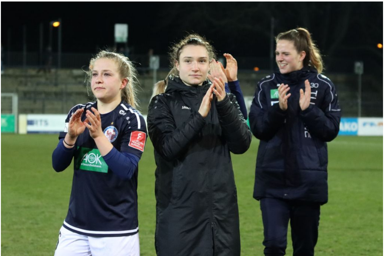
• Applaus für die Fans - mit und ohne Lächeln