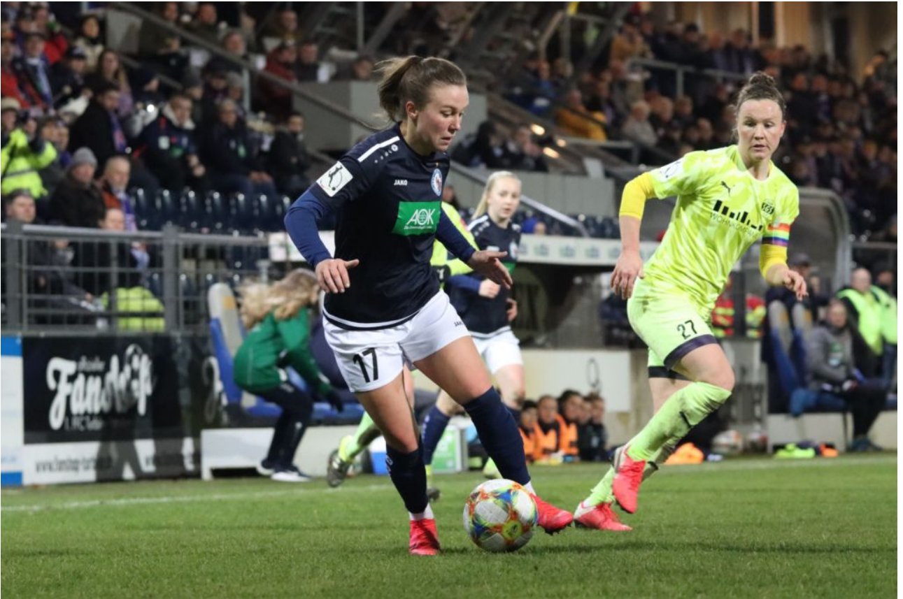
• Den Ball unter Kontrolle