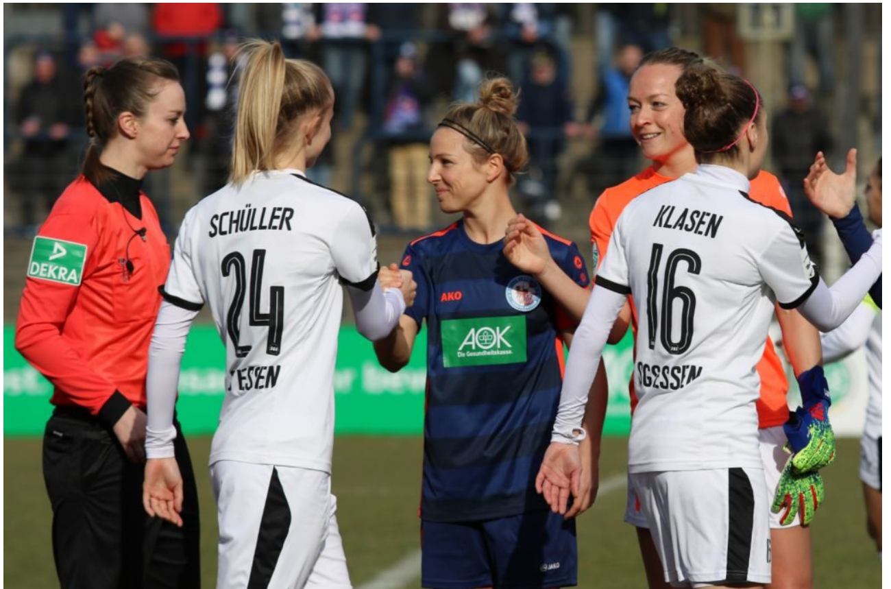
Begrüßung der besten Spielerin