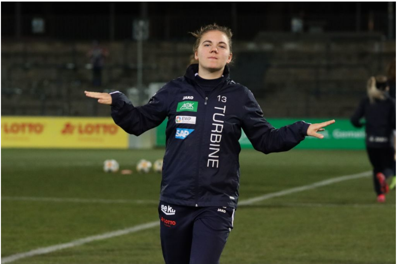
• Und ich flieg -flieg wie ein...