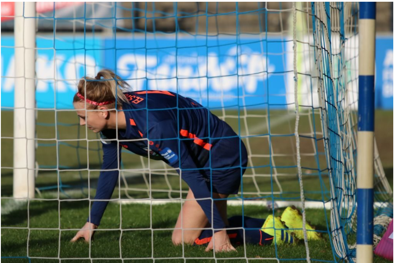
Auf allen Vieren krauchend

War das grässlich anzuschauen! Erst das sieg-vergeigte Spiel