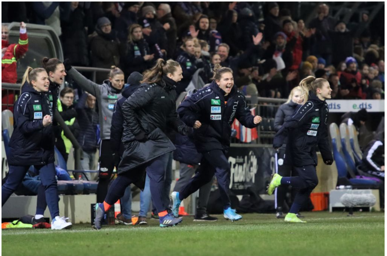
• Siegesjubiläum nach dem Abpfiff der Zitterpartie