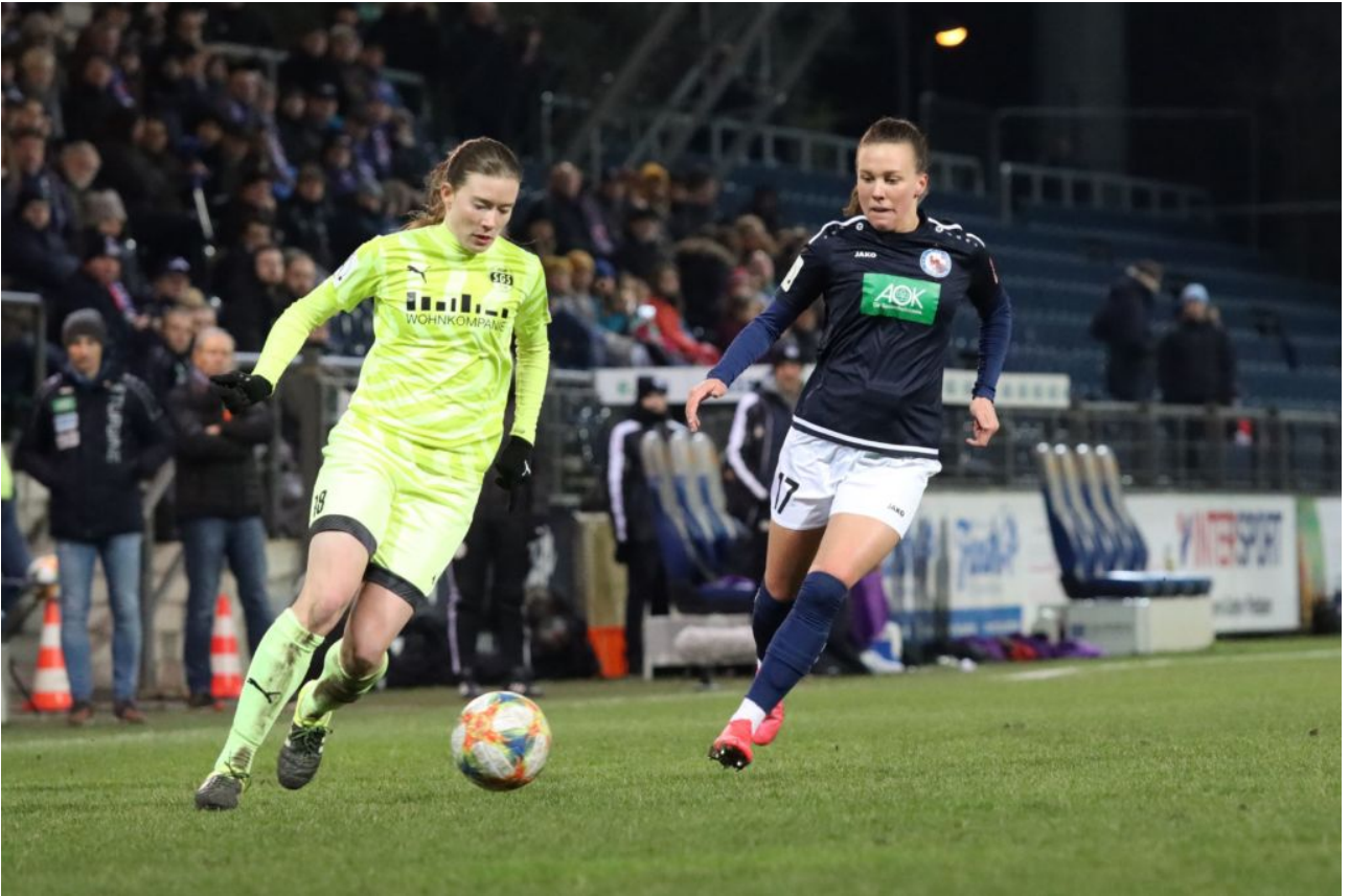
• Frischer Turbinewirbel