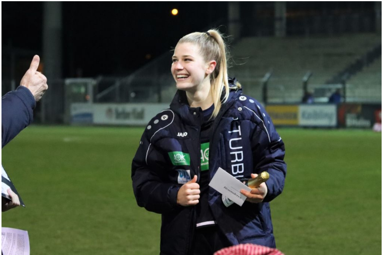
• Daumen hoch für the player of the match