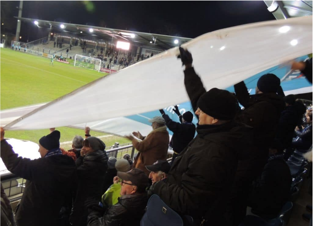
• Die Blockfahne ist diesmal dabei