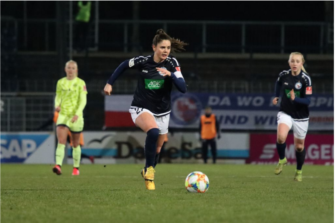
• Sarah rennt