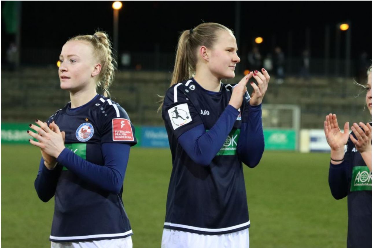
• Applaus in alle Richtungen