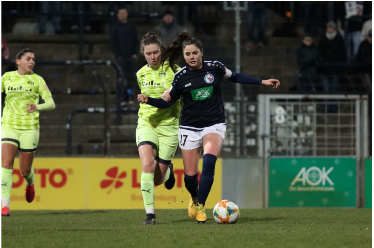
Festhalten – kein Pfiff