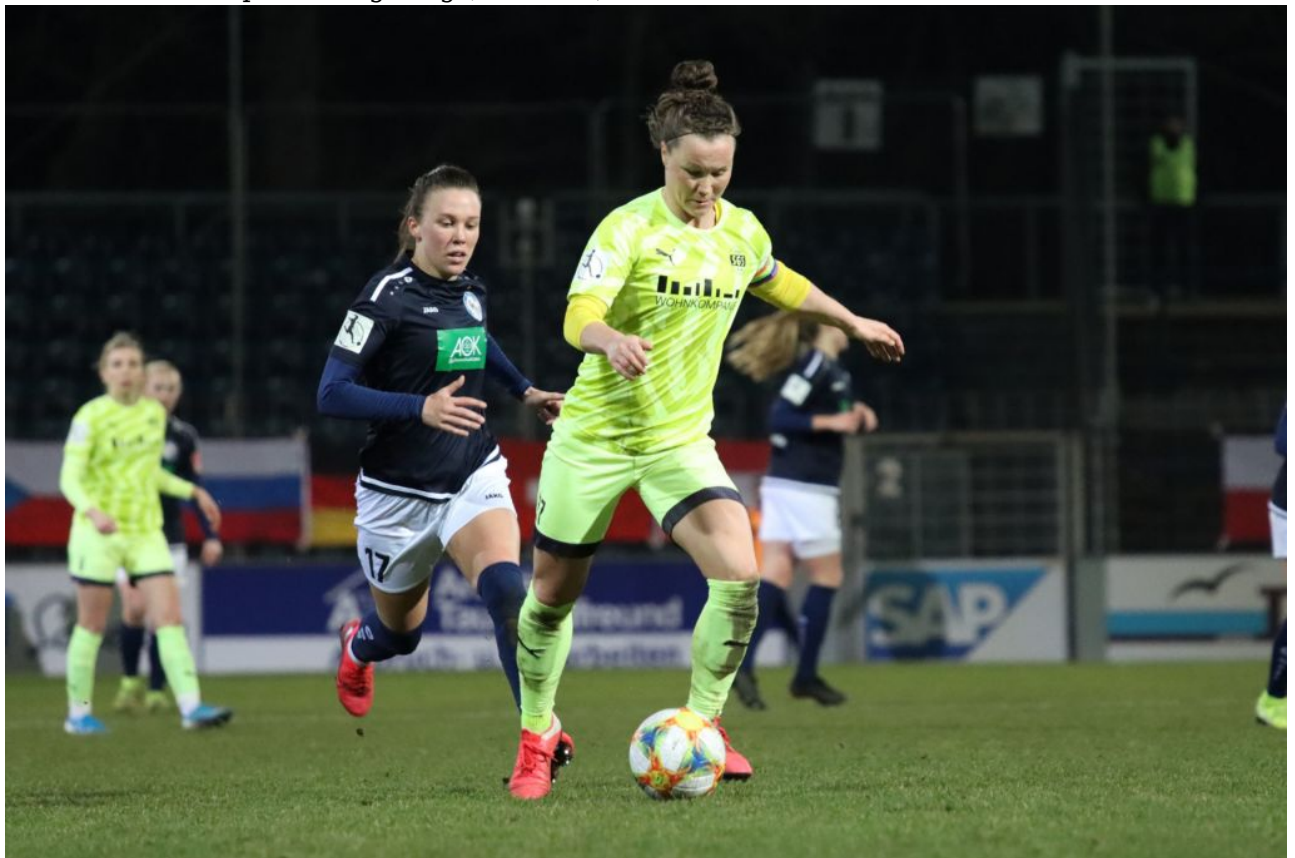
• Jetzt Hegering im Vorteil