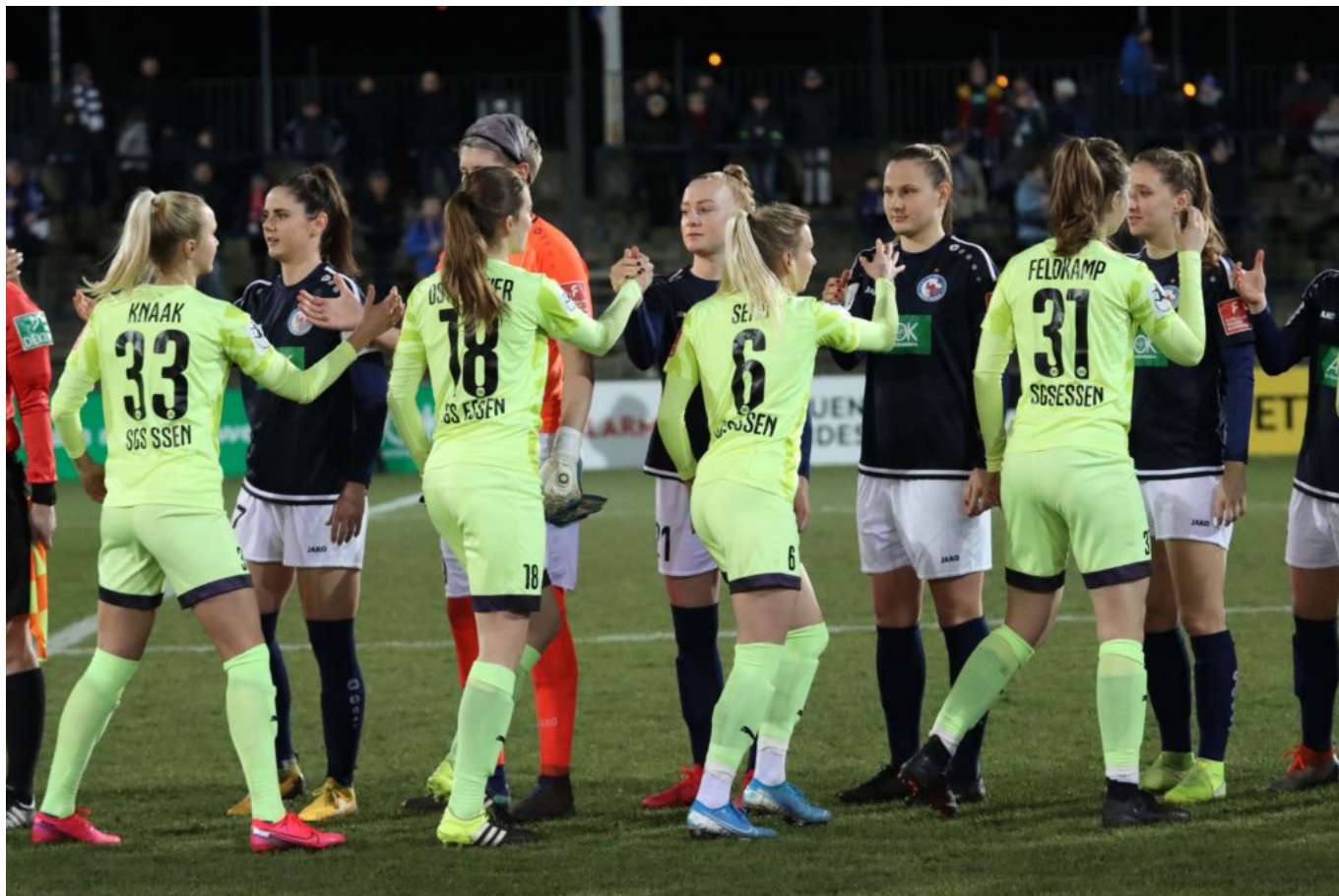
Abklatschen mit Essen