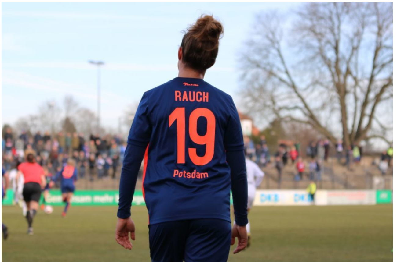
• Adieu II