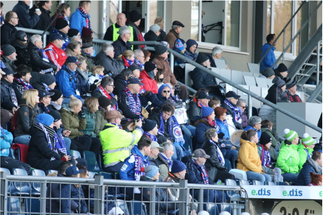
• Fanblock D