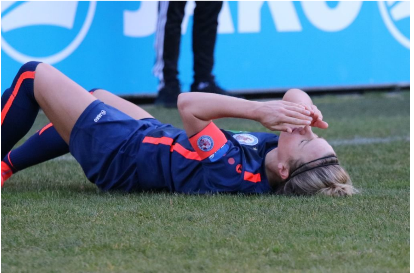
Turbinestar am Boden