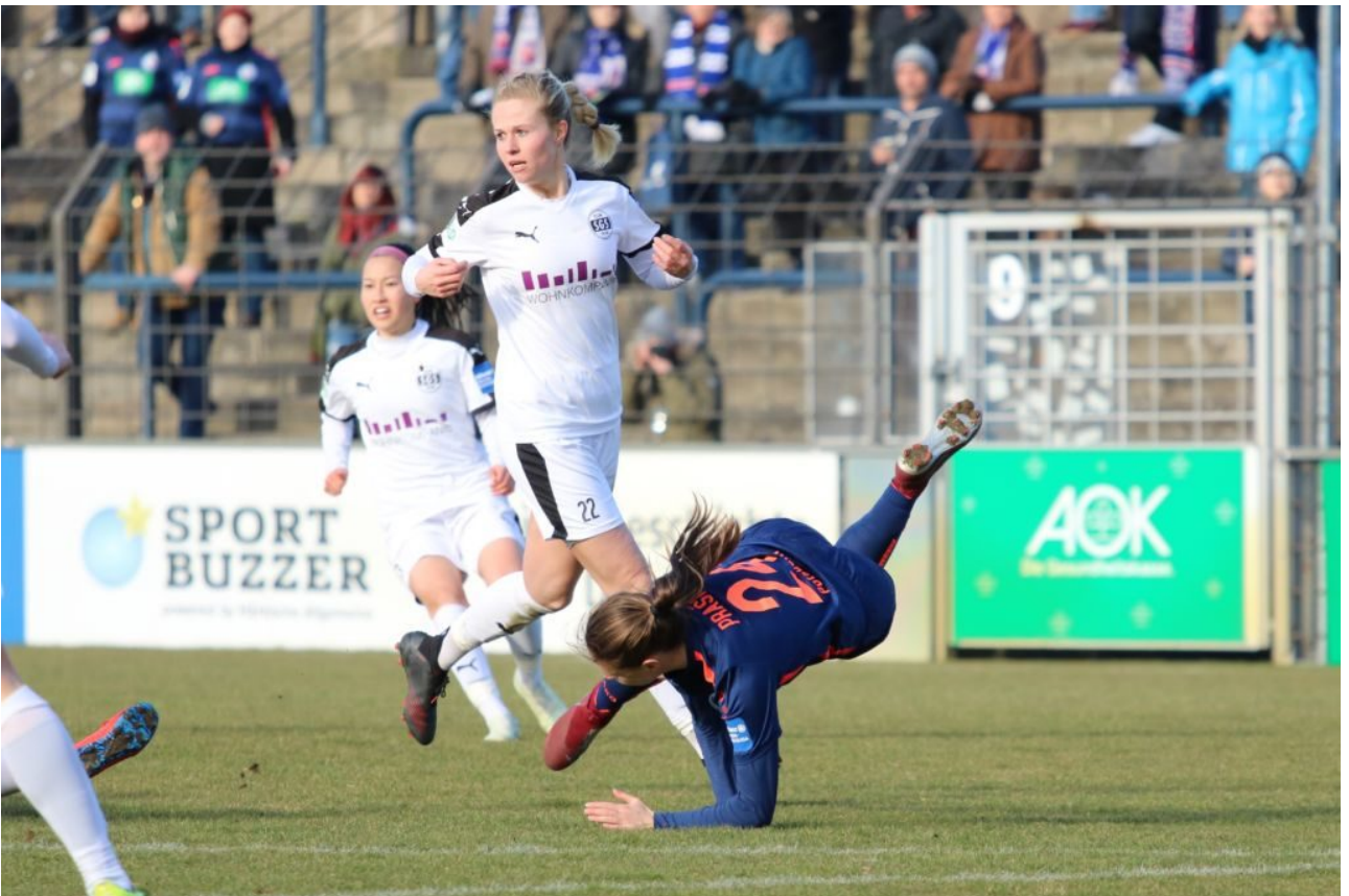
• Lara fliegt darnieder