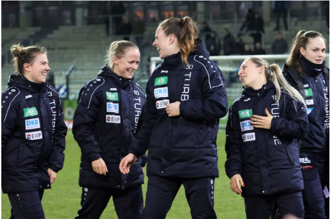
Voll lustig!