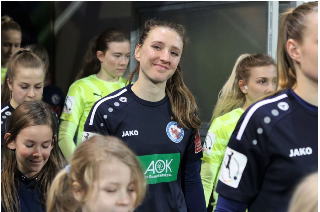
Entspanntes Lächeln beim Einlaufen