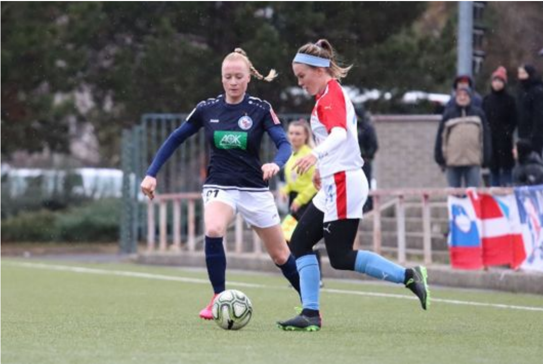
• Den wird sie sich holen