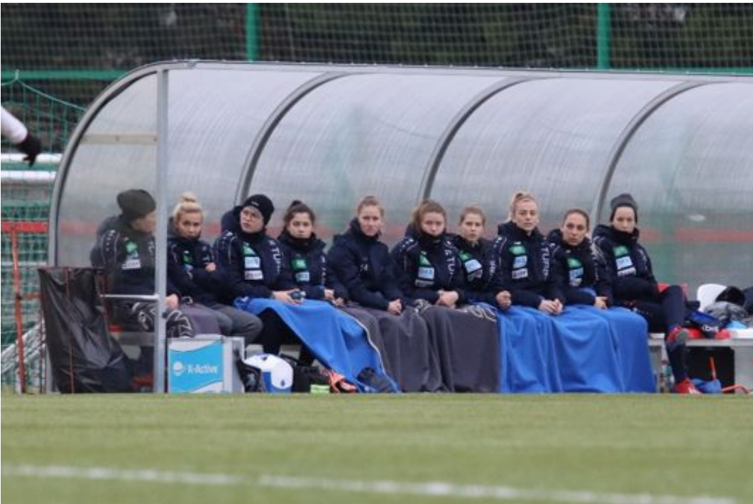
• Sch... Wetter!