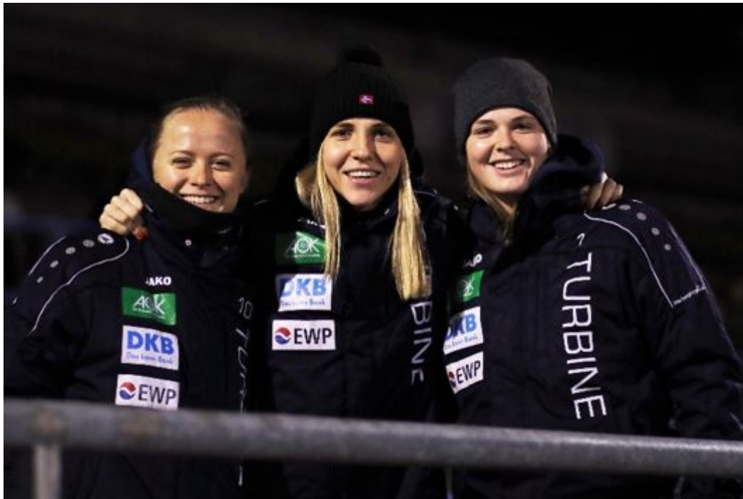
• Gute Stimmung neben der Bank