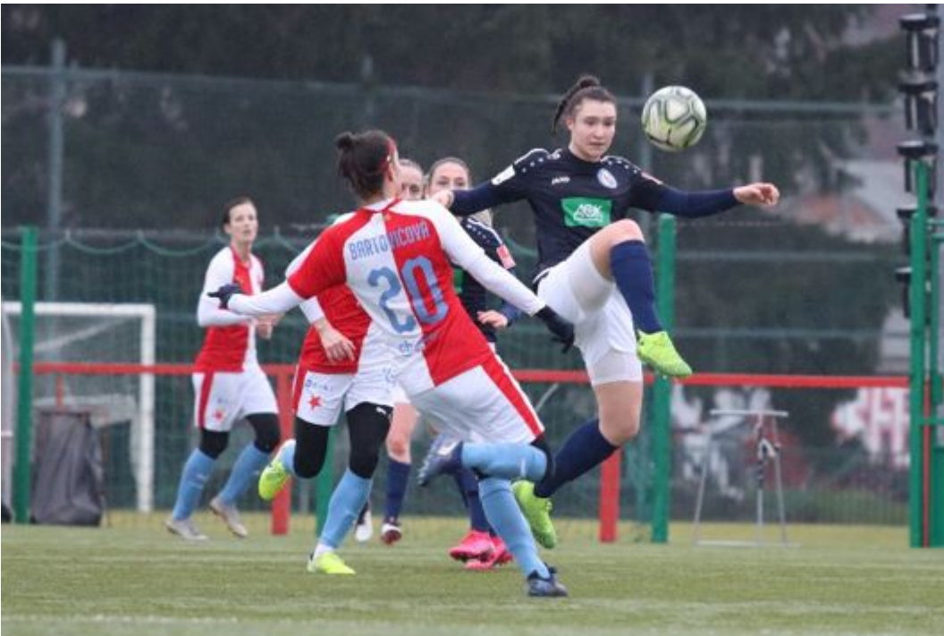
• Elegant bis in die Fußspitze