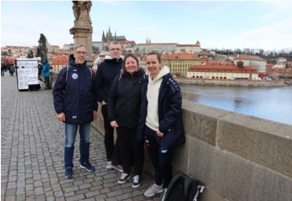
Turbinefans auf der Karlsbrücke

Am nächsten Morgen dann, gestärkt vom Frühstück, machte sich die Gruppe auf, Prag zu erkunden. Es wurde der Wenzelsplatz besucht (1912 nach dem Tschechischem Schutzpatron benannt und von wunderschönen Jugendstilbauten gesäumt), die Altstadt durchstreift und die Karlsbrücke (erbaut 1357 von Karl IV) bewundert.