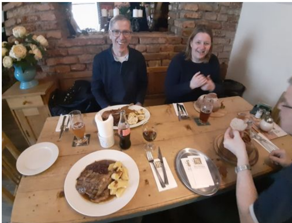
Eine erste Begegnung mit der Tschechischen Küche

Nach dem Check-In im Hotel machten sich die Turbinfans auf zum Mittagessen, einer ersten Erkundung der Goldenen Stadt und dann zum Strahov-Stadion von Sparta.