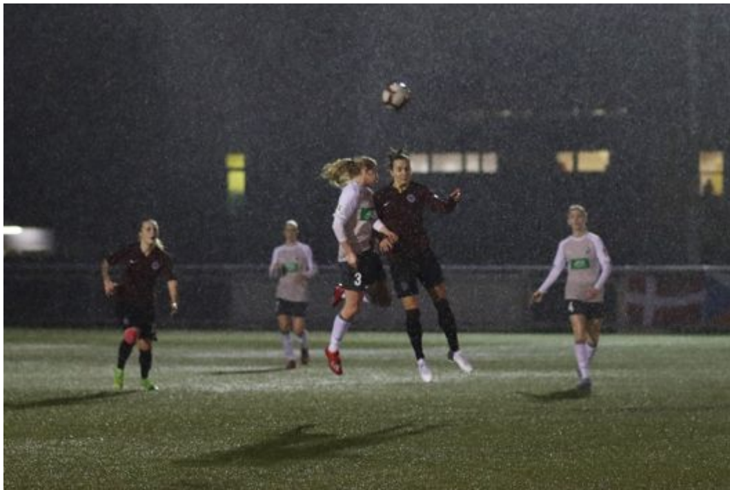
• Es war wirklich so dunkel und so nass

Text: Saskia Nafe und Frank Elvers