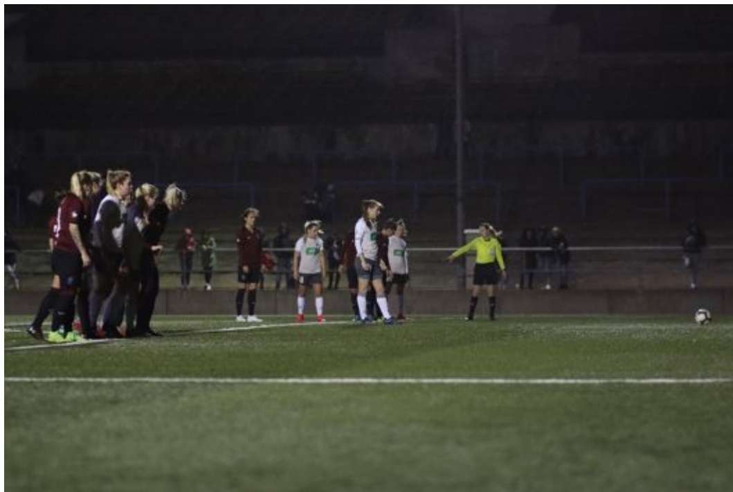
Elfmeter im Dämmerlicht

Dazu nutzten die Champions League-erfahrenen Spielerinnen aus Prag geschickt die großzügige Linie der Schiedsrichterinnen aus, um durch grenzwertig harte Spielweise die Turbinen zu provozieren. So manche Turbine beschäftigte sich mehr mit Reklamieren und Diskutieren als mit dem Spiel selbst. So ging der Spielfluss verloren und gleichzeitig begann Sparta zu spielen.