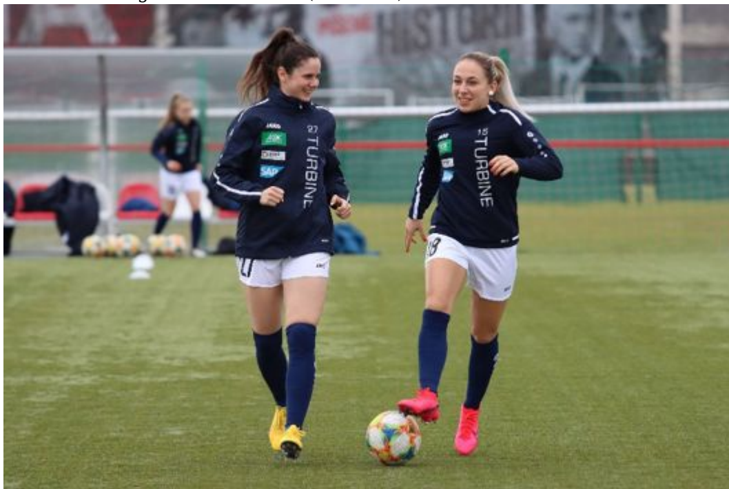
• Und - was hast du gestern noch so gemacht?