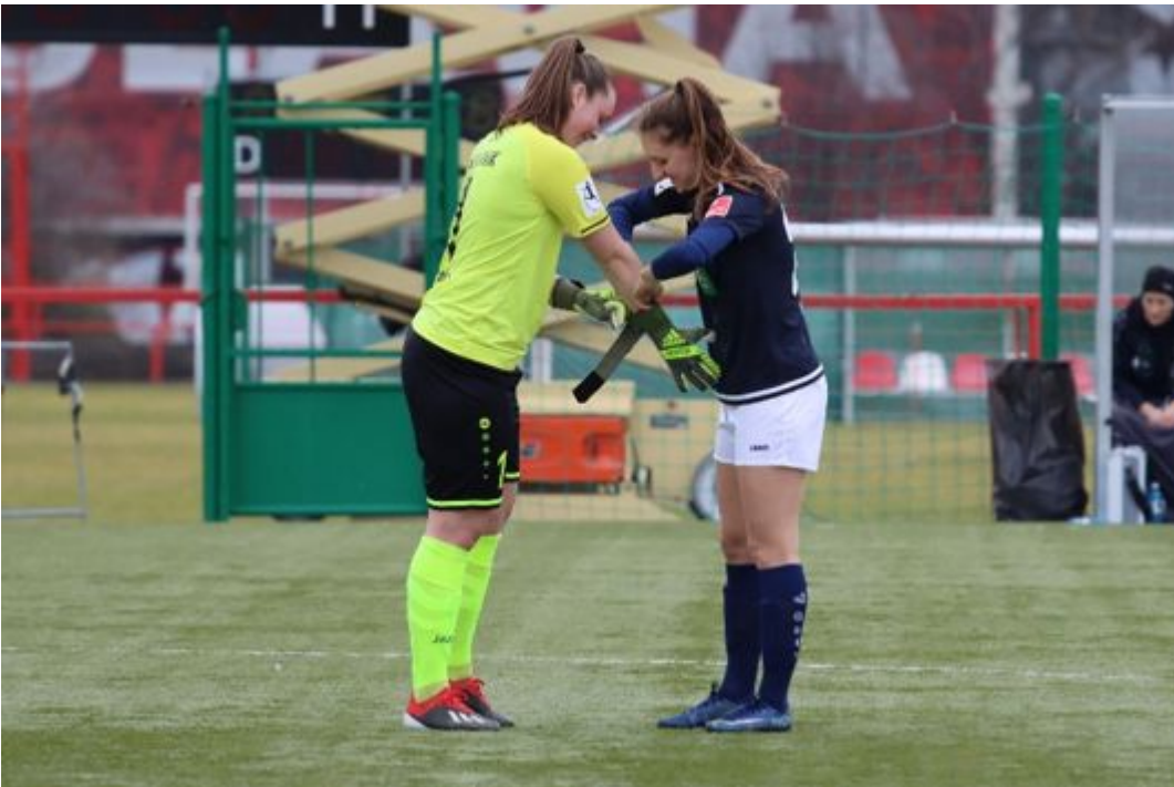
• Mama hilft beim Anziehen