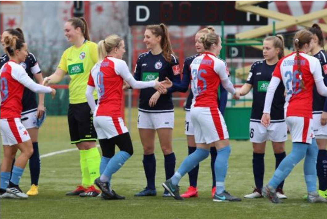
• Shake hands