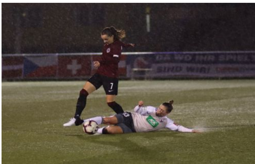
Nass war es!