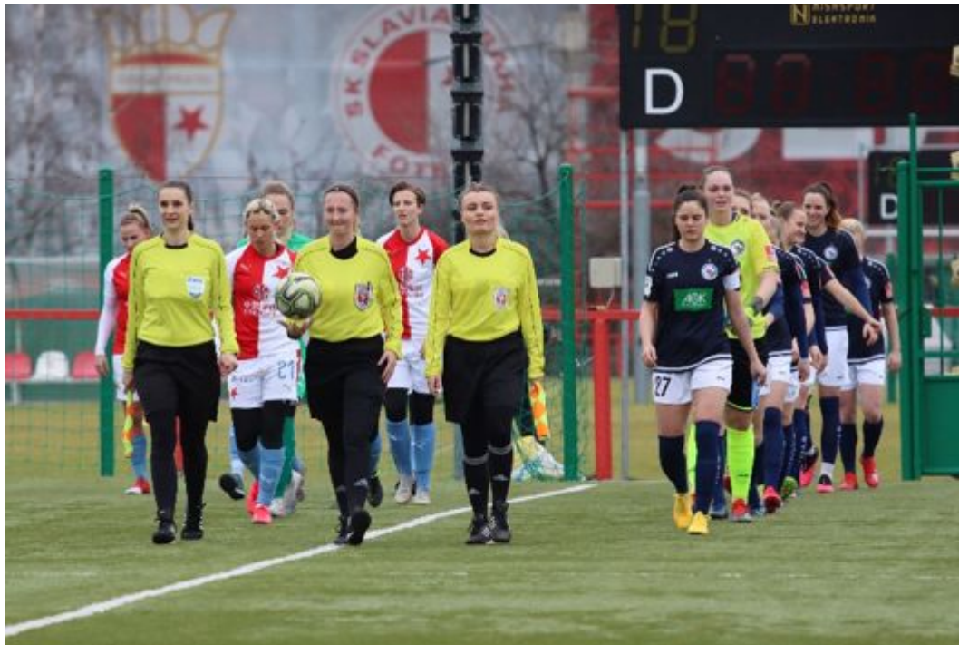
• Ordentliche Reihe