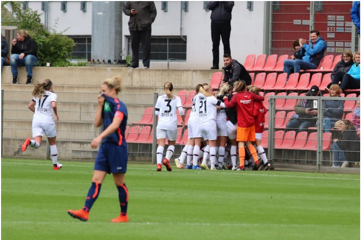
Rudelic inmitten des Rudeljubels