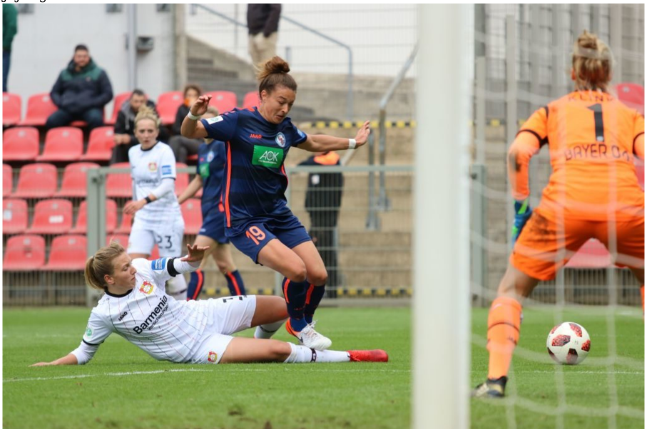
• Auch Feli versucht es vergeblich