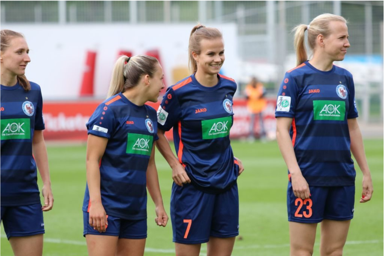
• Kleiner Gina-Scherz