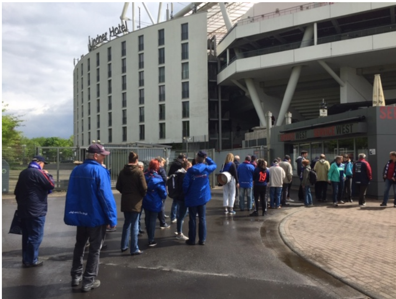
Schlangestehen am Kassenhäuschen

Ausnahme von Schalmeien, Edding-Stiften und Fotoapparaten ab einer bestimmten Objektivgröße.