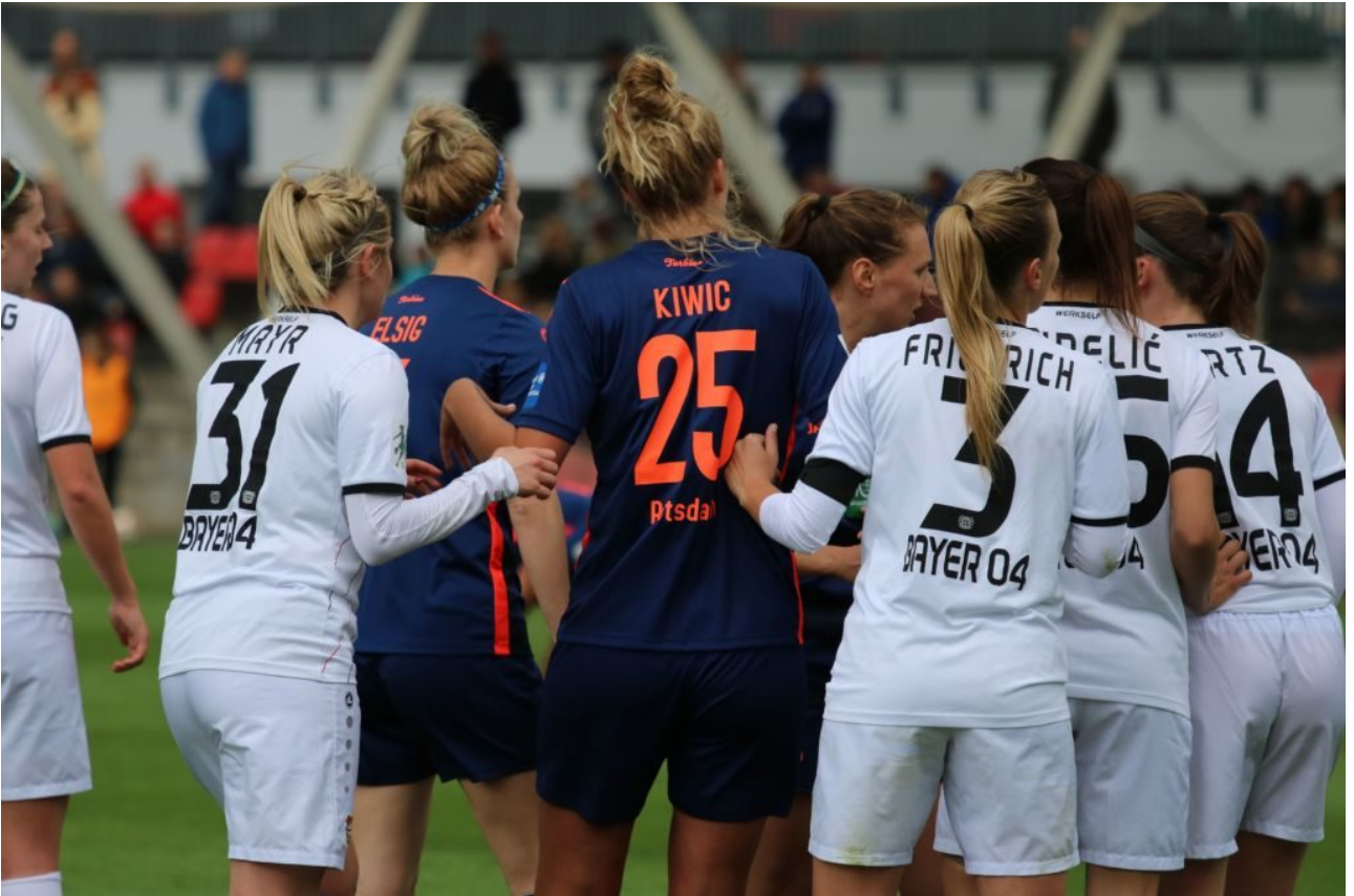
• Warten auf den Eckball