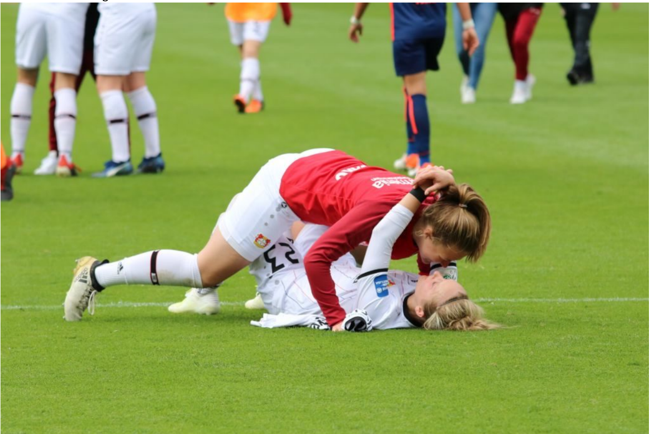
• Herzlicher Liegestütz