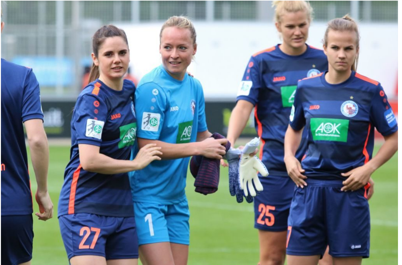
Lass uns ein Tänzchen wagen