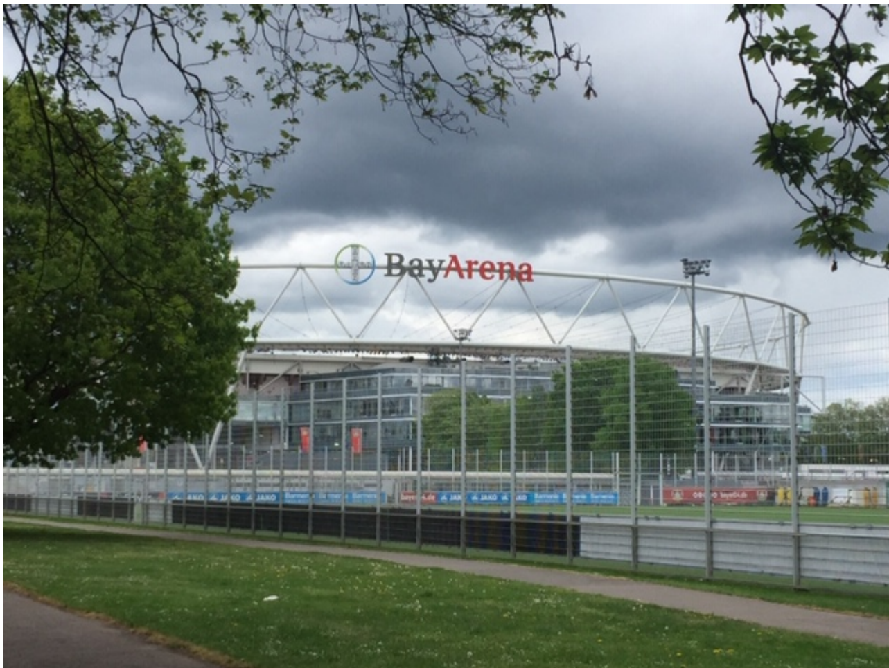
Bayarena Leverkusen

Nach einem geduldigen Schlangestehen vor dem Kassenhäuschen vor der Bayarena, das von einer Dame mit sehr ruhigen Bewegungsabläufen bewirtschaftet wurde, wurde den angereisten Turbinefans Einlass gewährt – mit