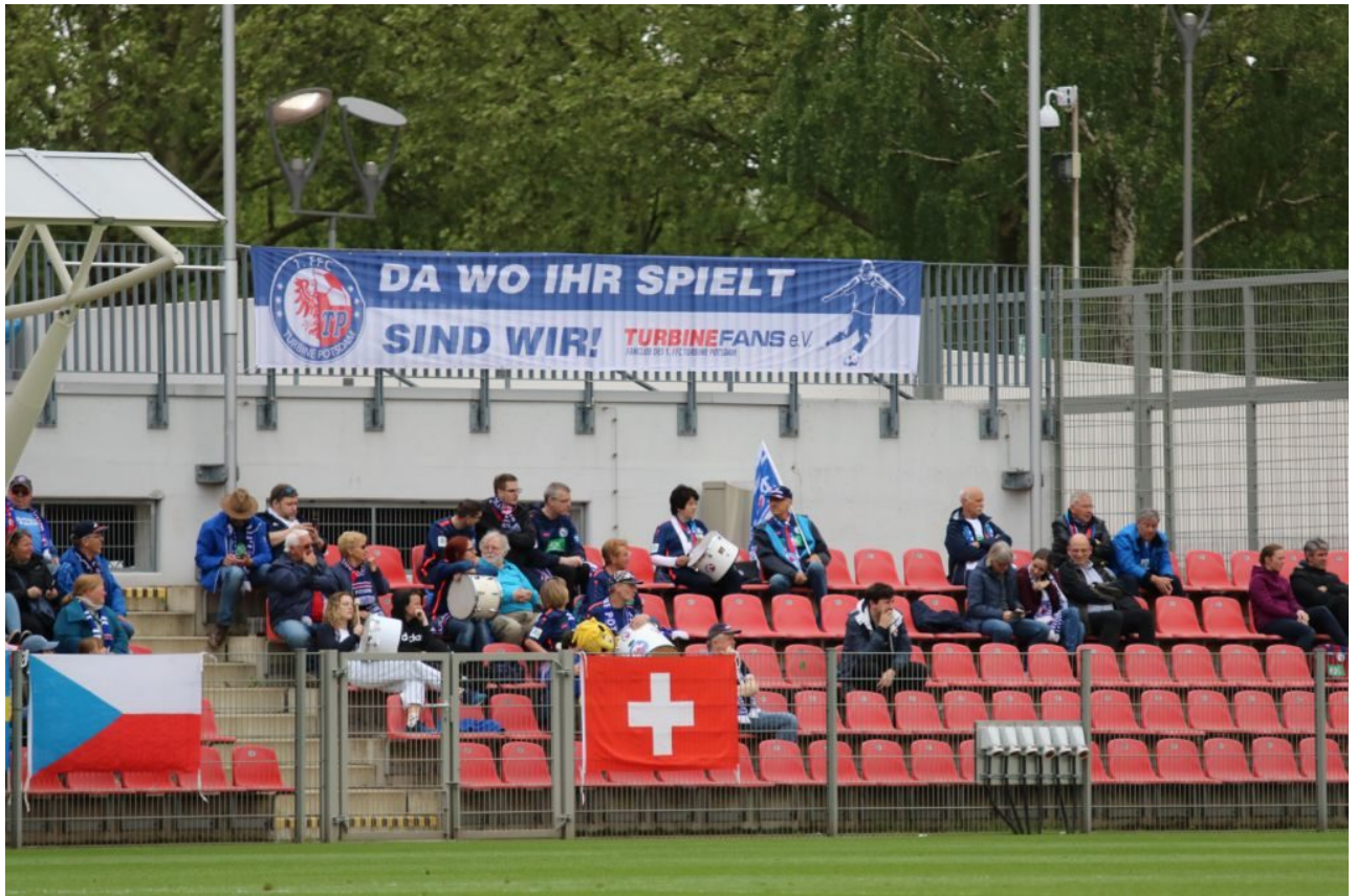
• Turbinefans am Start