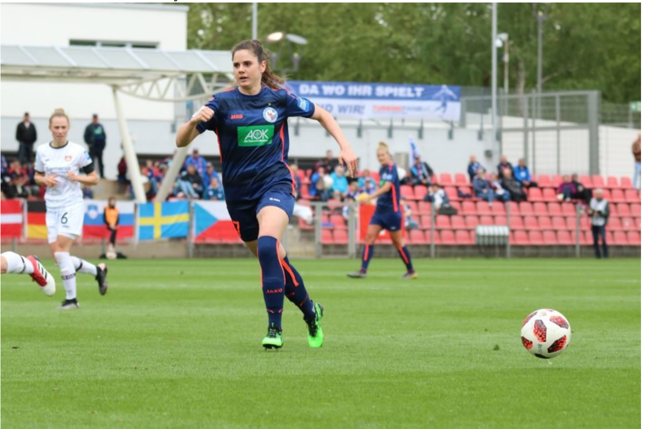
• Den Ball einfach mal links liegen lassen