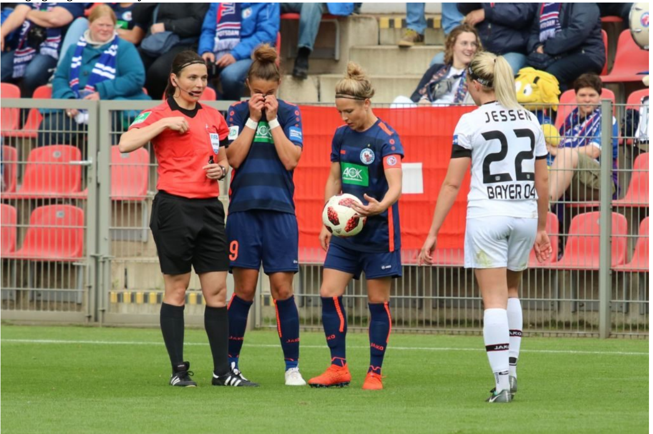
• Lasst mich doch erstmal machen, meinte die Schiri