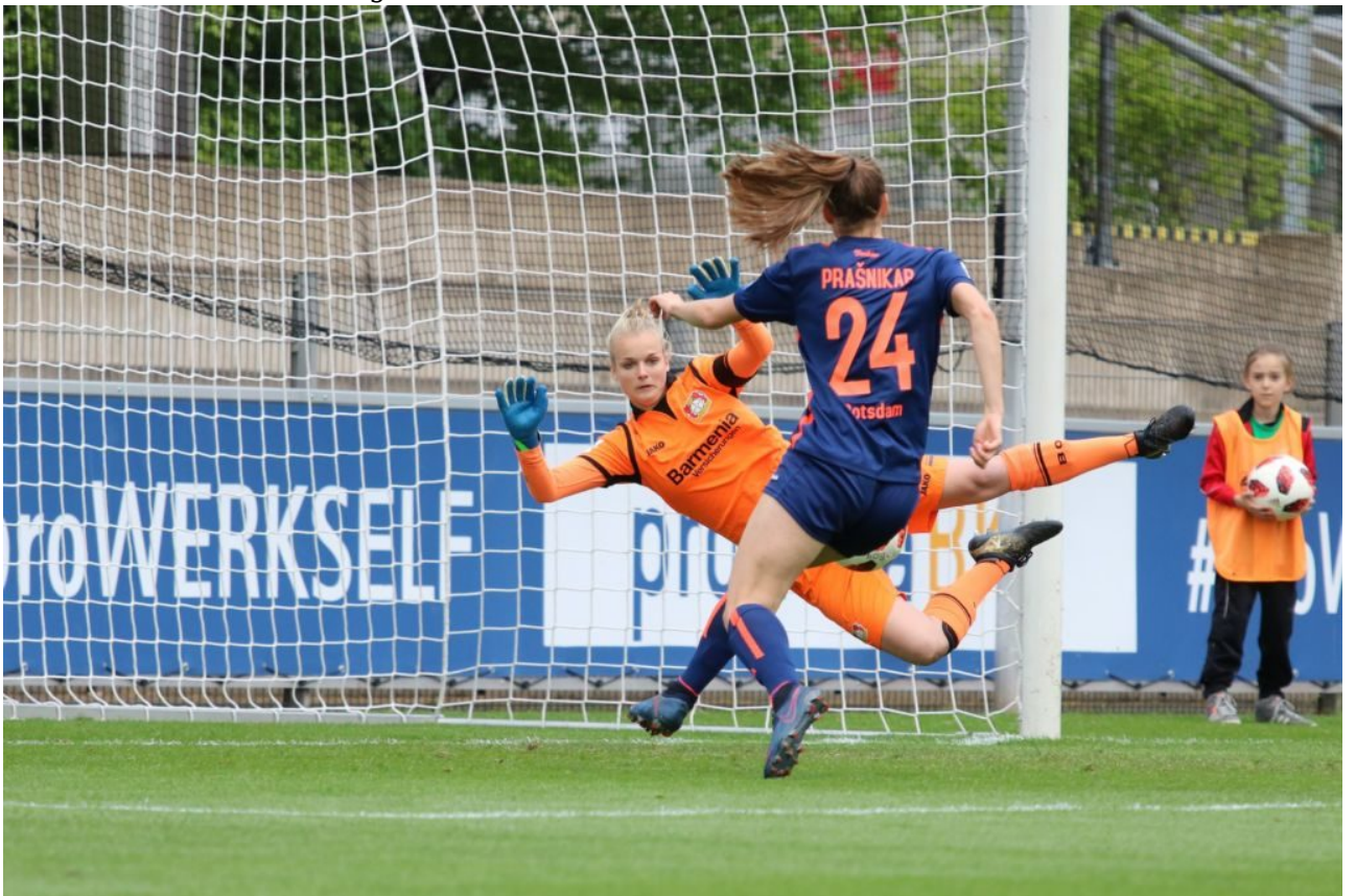
Suchbild: Wo ist der Ball?