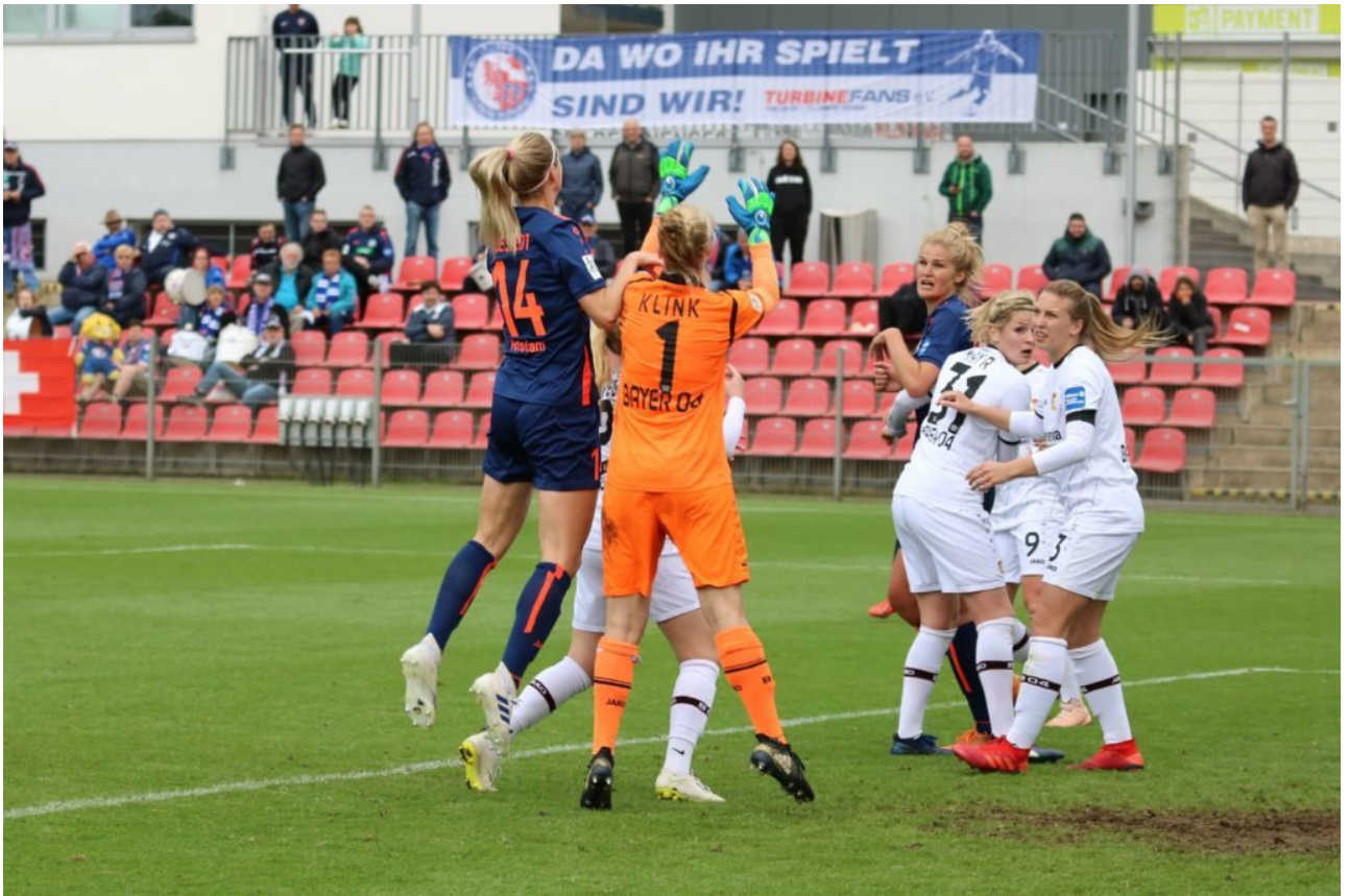
• Fröhliches Bannerpflücken - wer schafft es als erste?