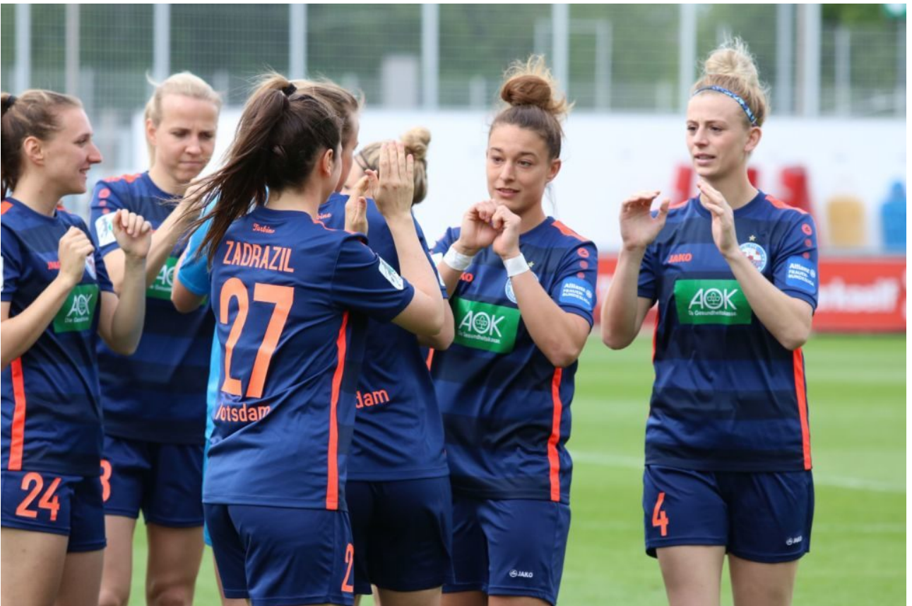
• Feli zeigt Herz