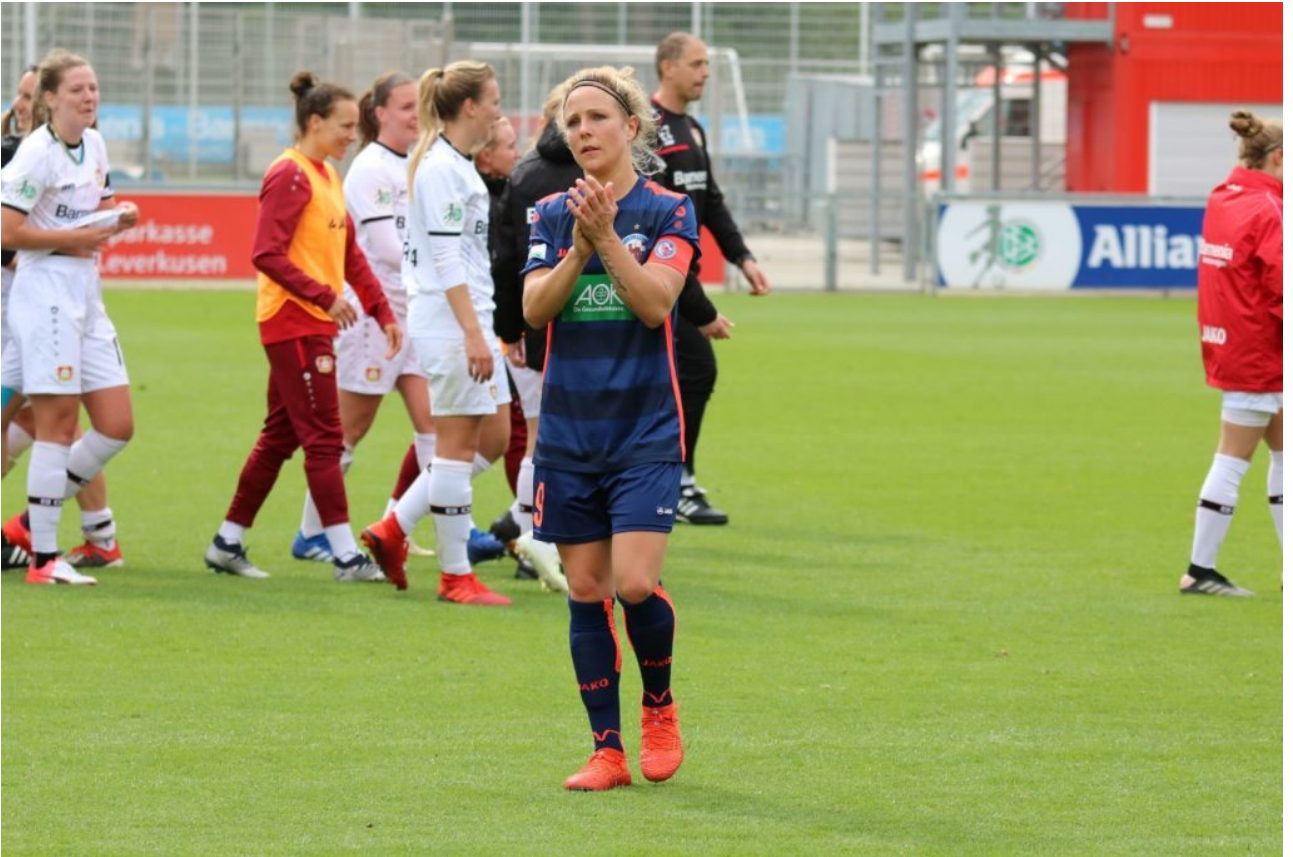
• Fankritik wahrgenommen