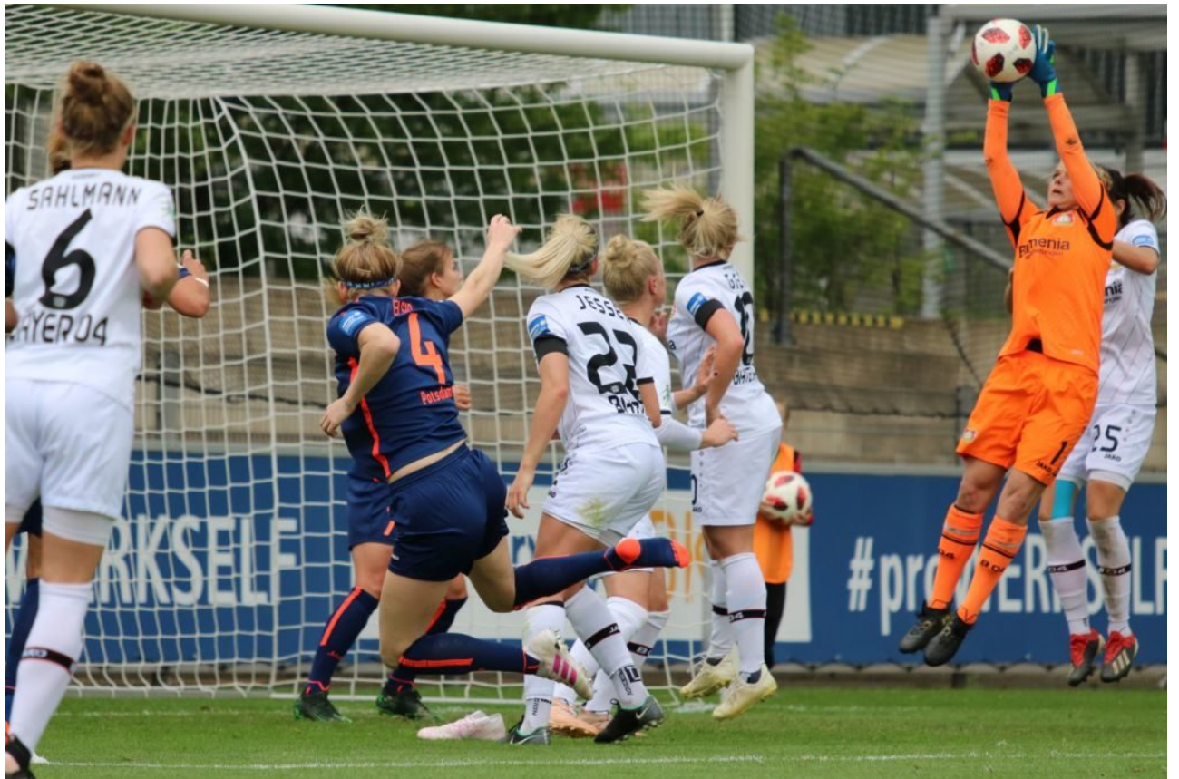
• Jojos gescheiterter 2:0-Versuch