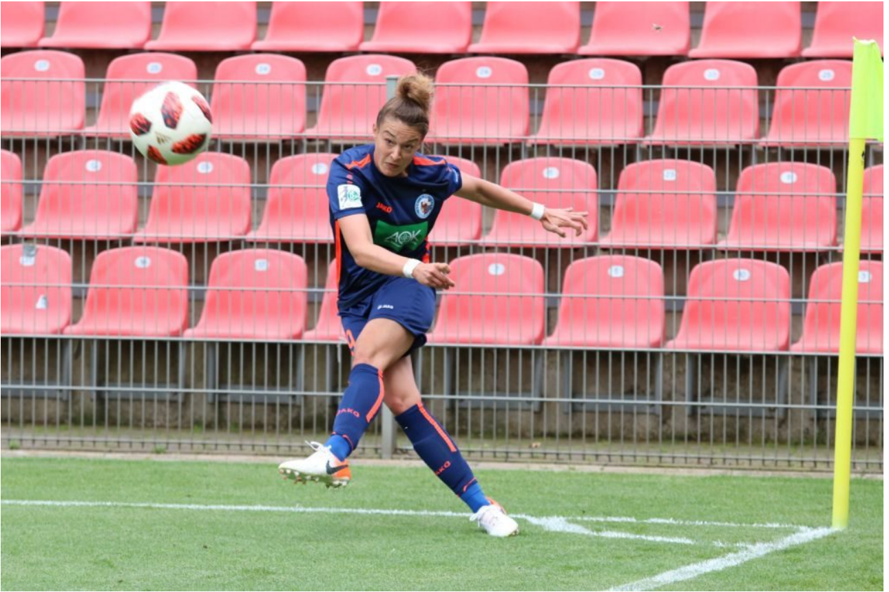
• Verkreuzt und zugenäht