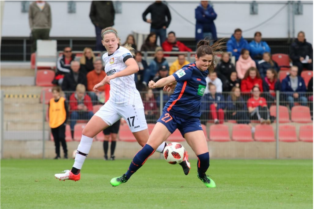
• Entgegengesetzte Dynamik