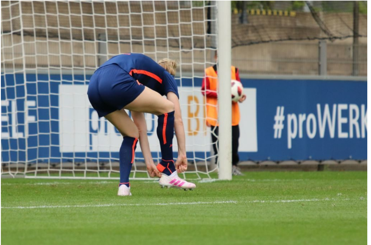
• Dieses Ding hat keine Doppelschleife