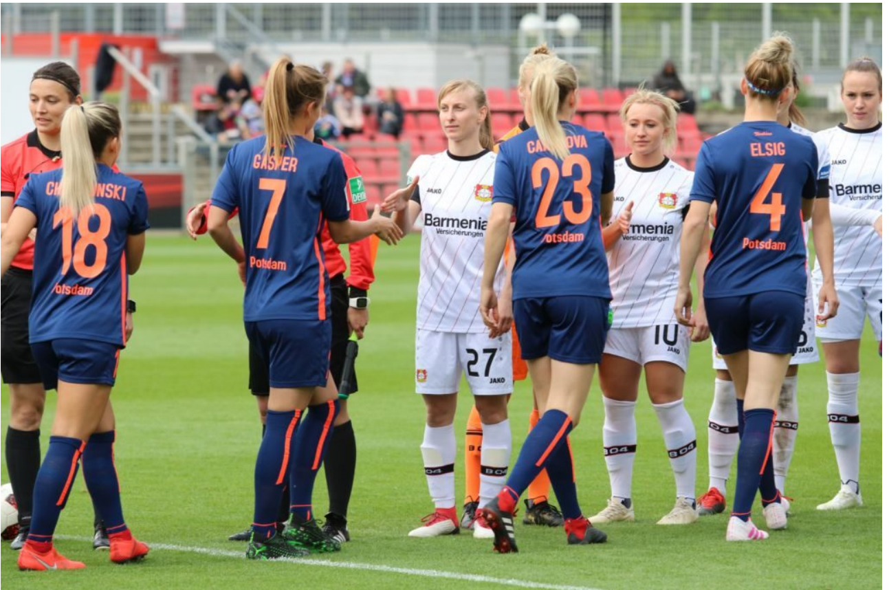
• Abklatschen vor dem Anstoß